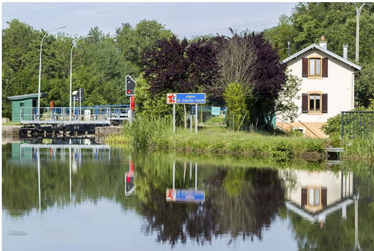
Vue d'ensemble depuis l'amont.