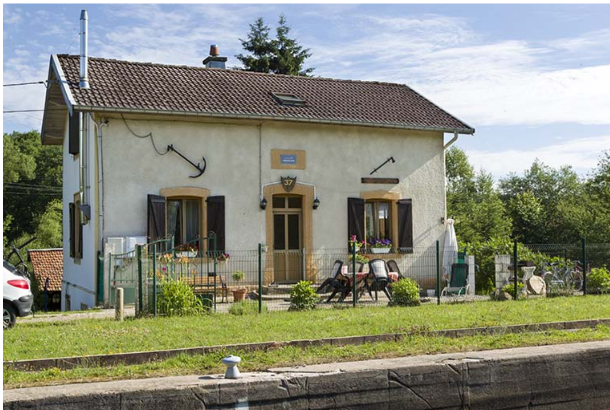
La maison d'éclusier, depuis l'écluse.