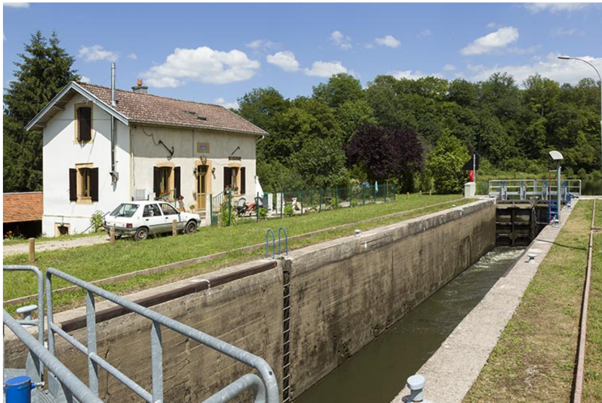
Le site d'écluse, depuis l'aval. 70, Ambiévillers