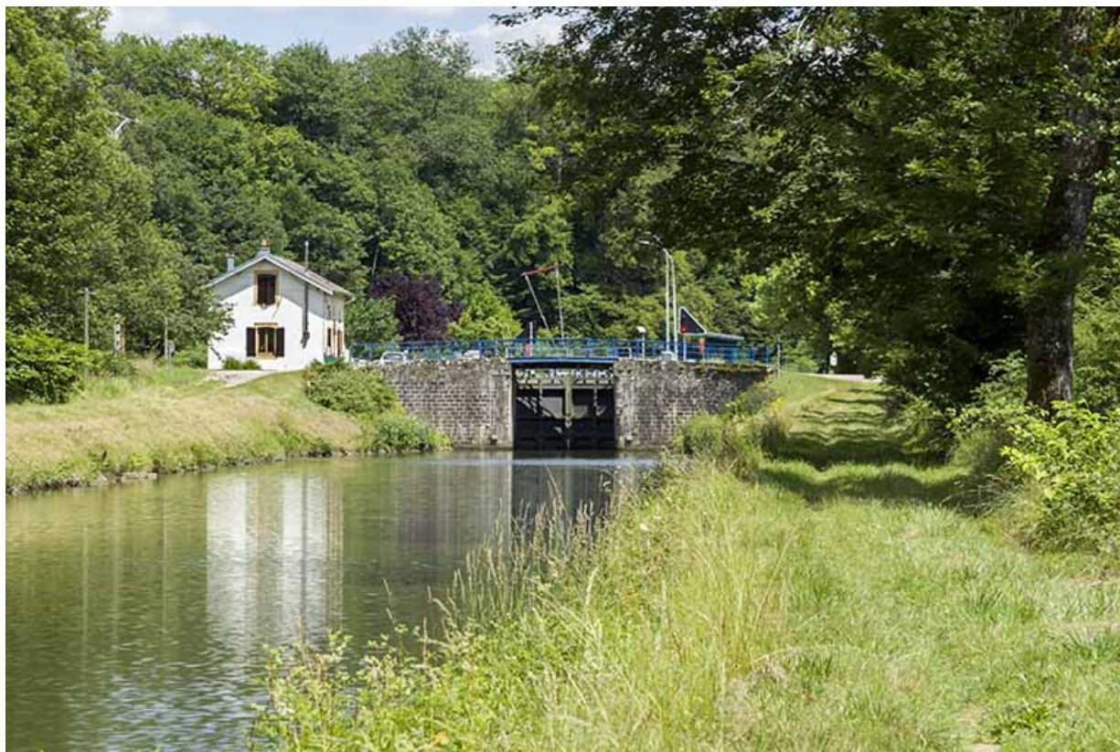
Vue d'ensemble depuis l'aval.