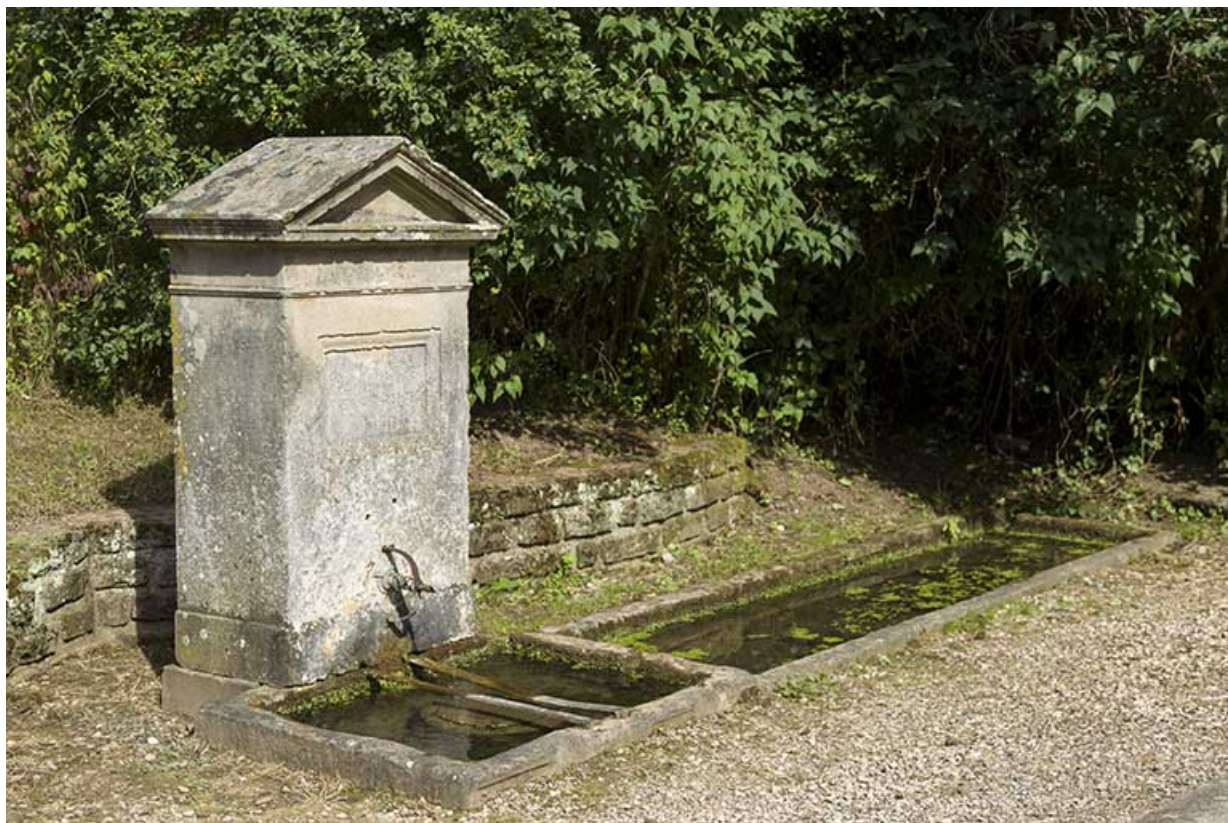
Fontaine située au début du chemin du Peu d'Acquet. 70, Pont-du-Bois