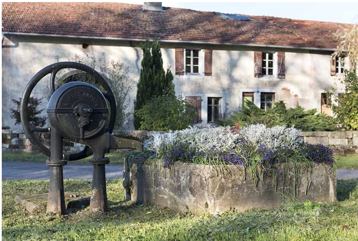
Roue à eau au quartier de la Forge