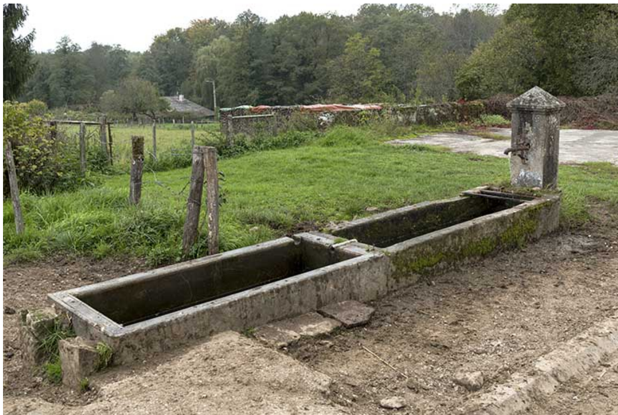
Fontaine-abreuvoir, rue Saint-Nicolas. 70, Pont-du-Bois