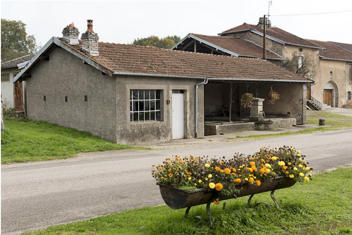
Fontaine-lavoir de la Grande rue.