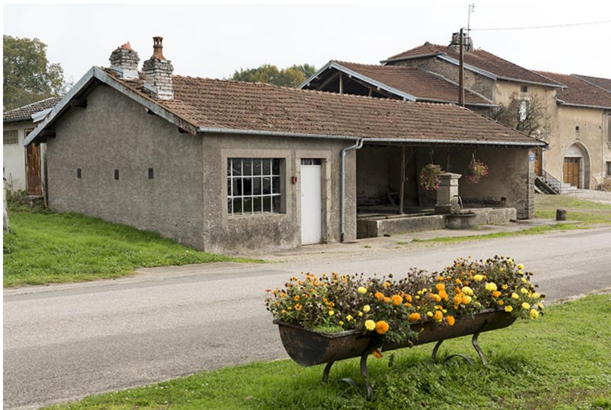
Fontaine-lavoir de la Grande rue. 70, Pont-du-Bois