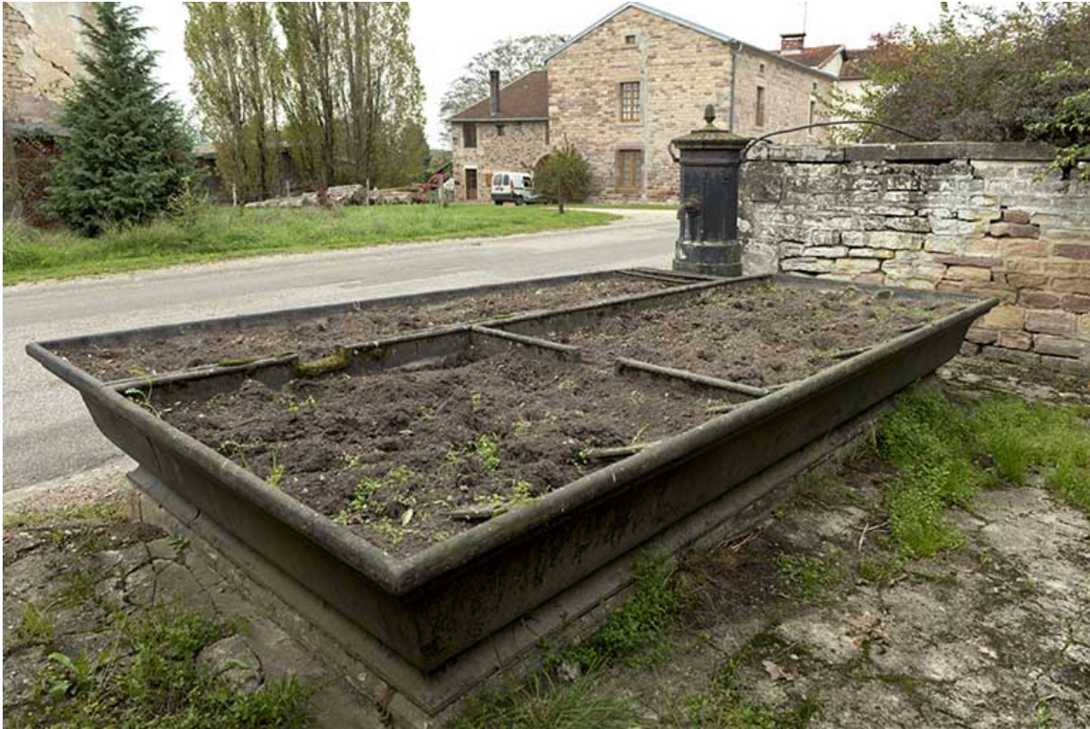
Fontaine-abreuvoir, Grande rue. 70, Pont-du-Bois