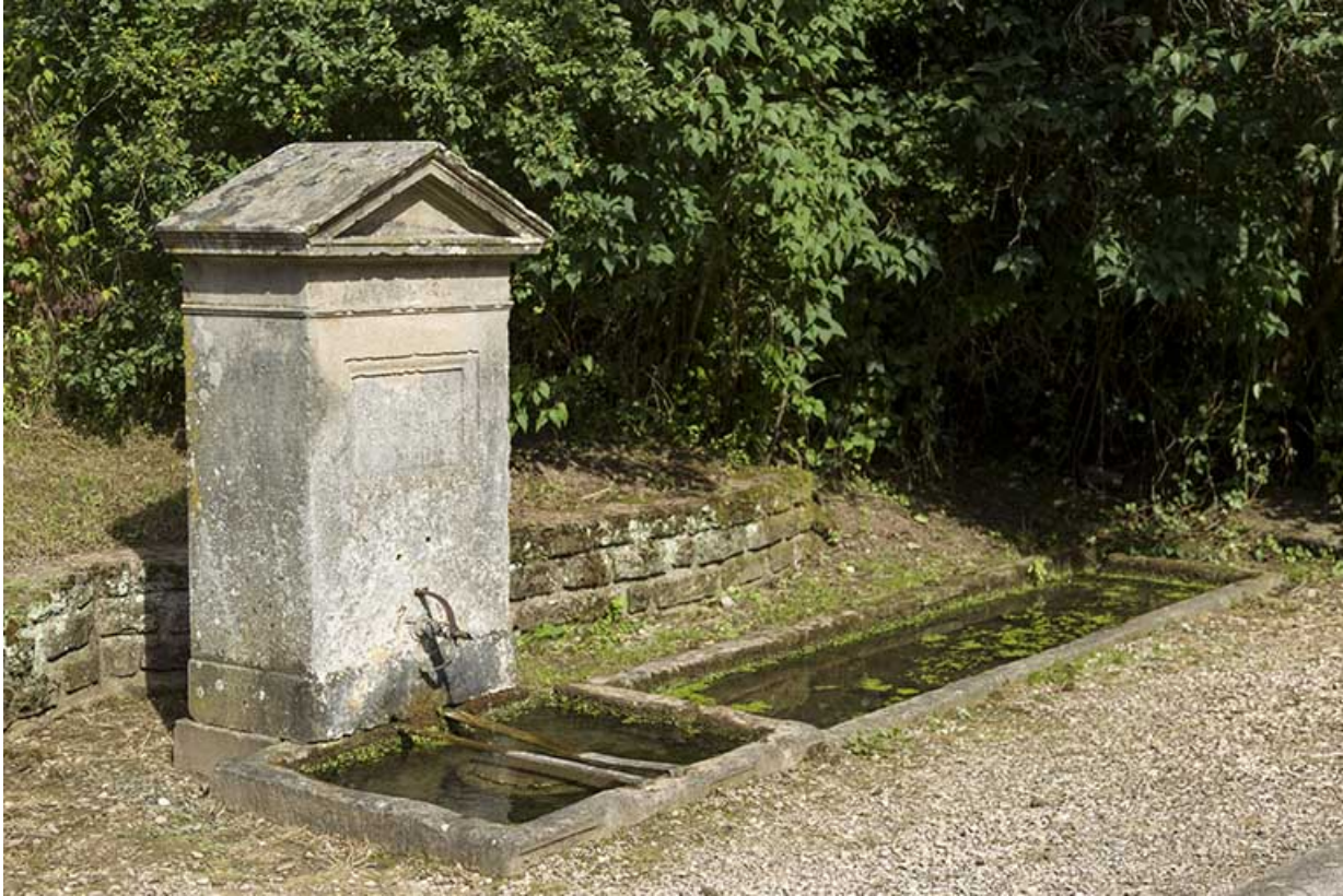
Fontaine située au début du chemin du Peu d'Acquet. 70, Pont-du-Bois