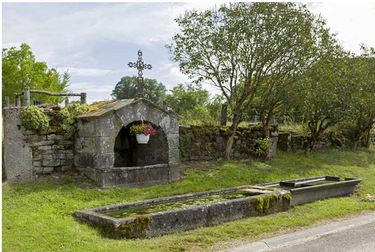
Fontaine rue Saint-Nicolas 70, Pont-du-Bois