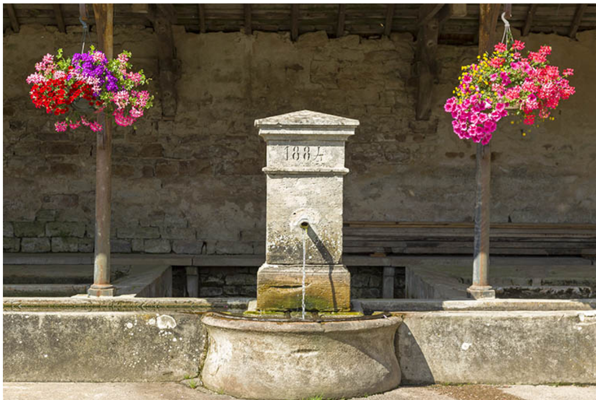
Détail sur la borne.