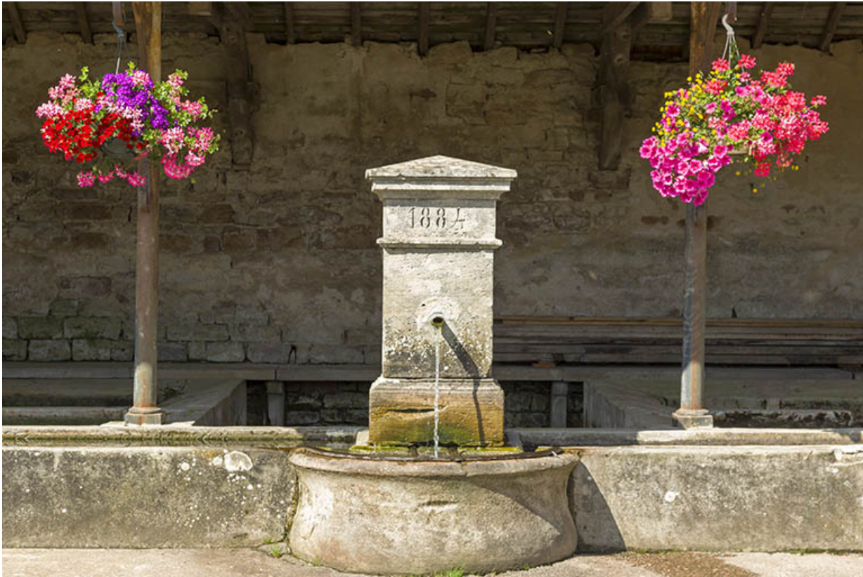
Détail sur la borne.