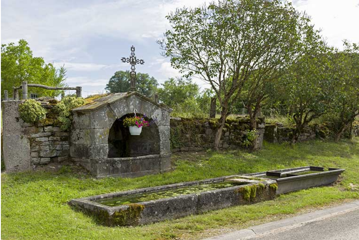
Fontaine rue Saint-Nicolas