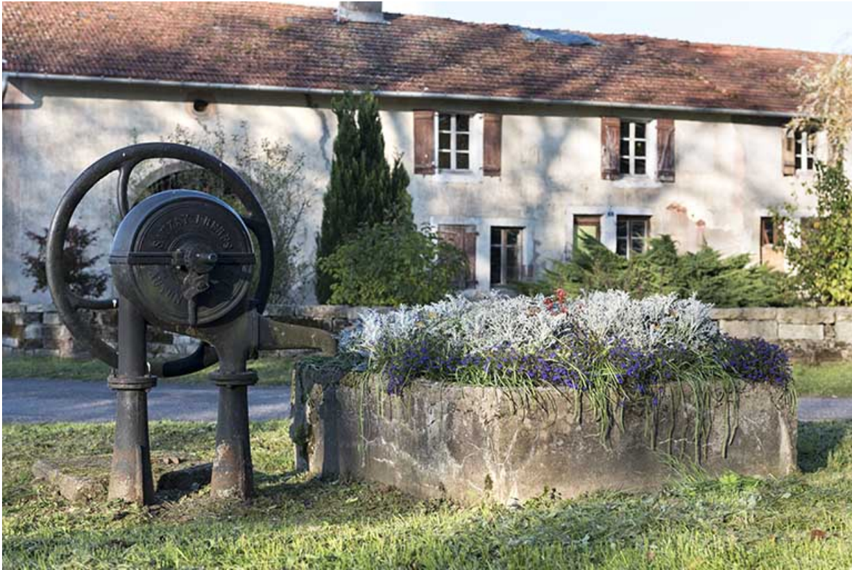
Roue à eau au quartier de la Forge