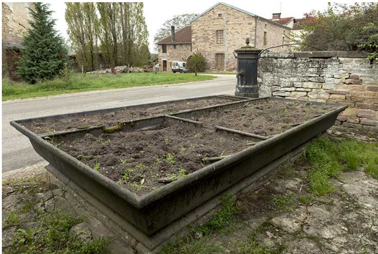
Fontaine-abreuvoir, Grande rue. 70, Pont-du-Bois