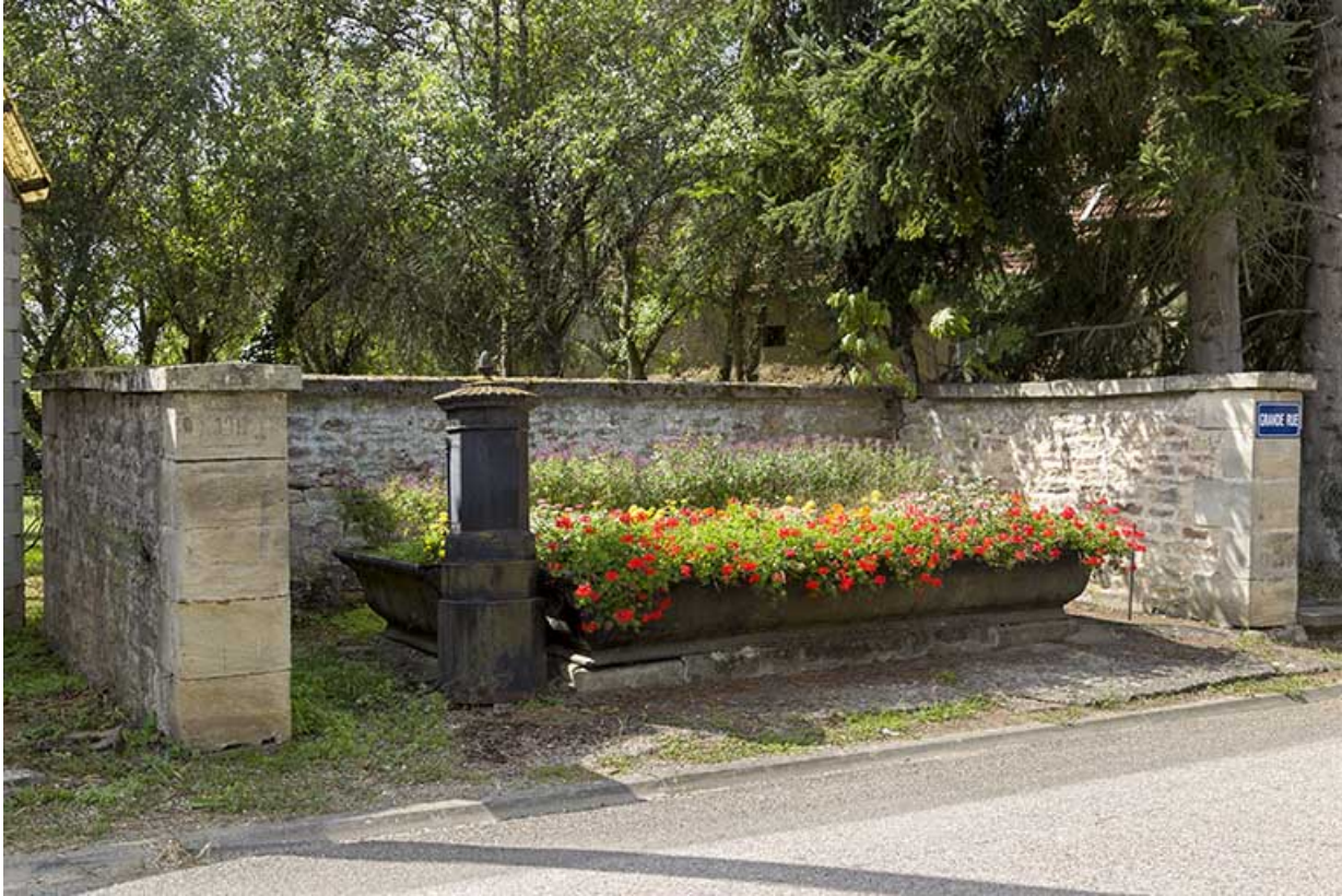
Fontaine-abreuvoir située à l'intersection de la Grande rue et rue du Chalet. 70, Pont-du-Bois