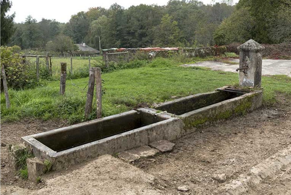
Fontaine-abreuvoir, rue Saint-Nicolas.