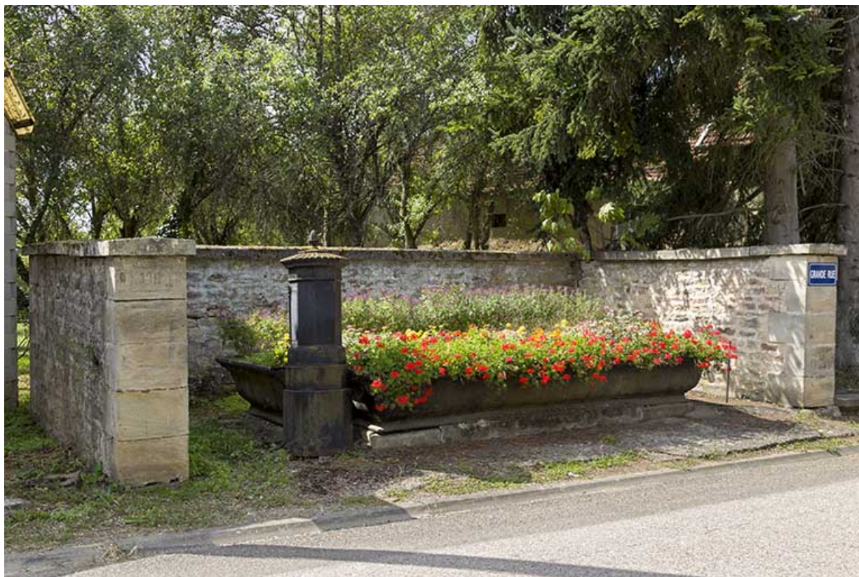
Fontaine-abreuvoir située à l'intersection de la Grande rue et rue du Chalet. 70, Pont-du-Bois