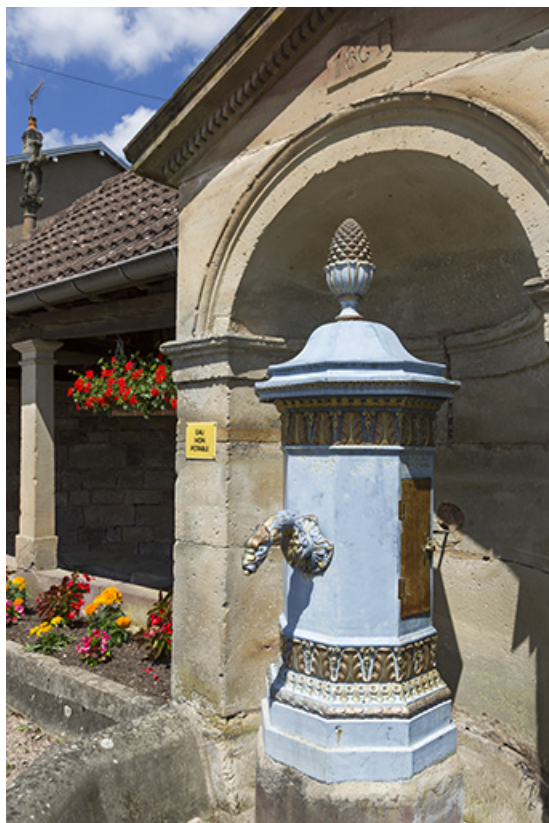
Vue de trois quart.