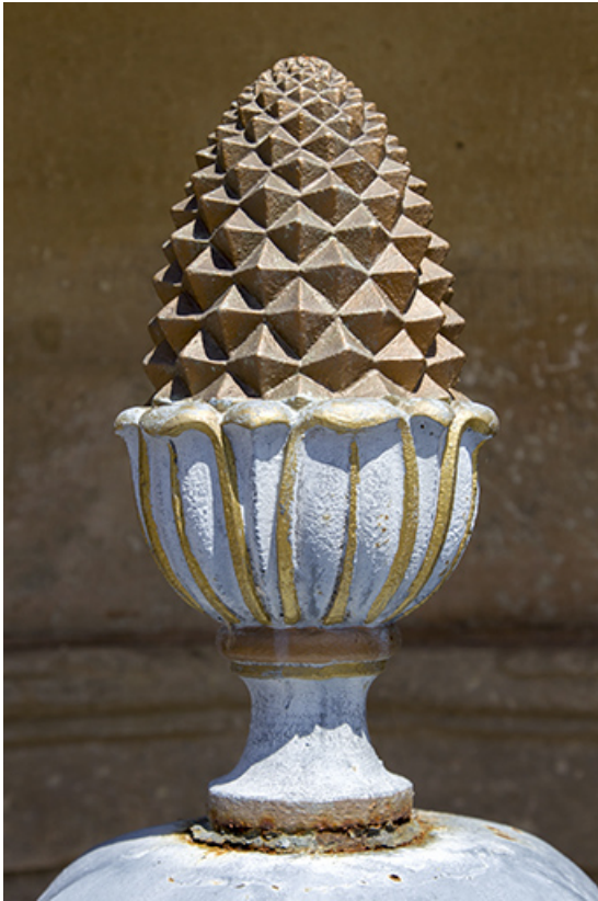
Détail de la pomme de pin sur la borne. 70, Ambiévillers rue Grande