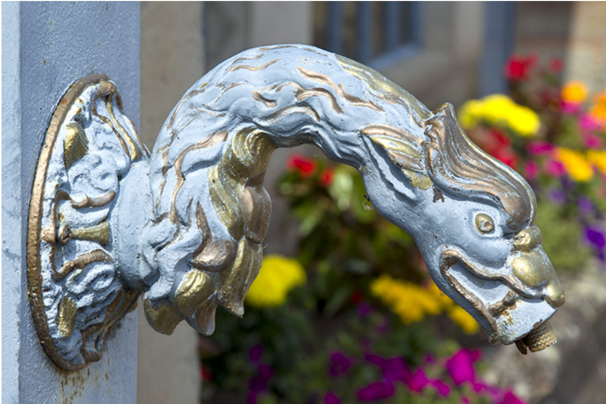
Détail du bec de la fontaine. 70, Ambiévillers rue Grande