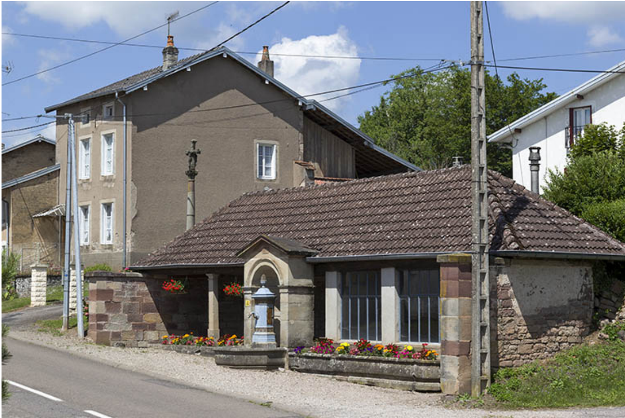
Vue d'ensemble depuis la Grande rue.