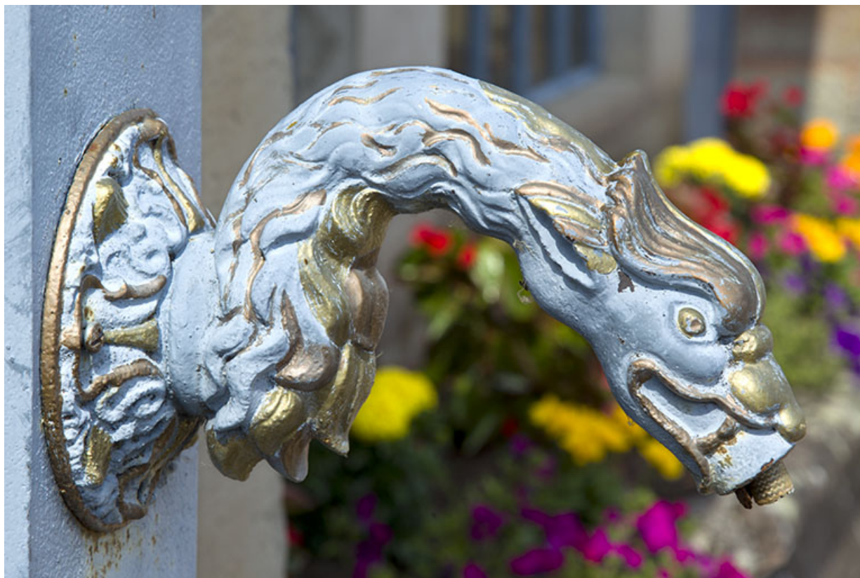
Détail du bec de la fontaine. 70, Ambiévillers rue Grande