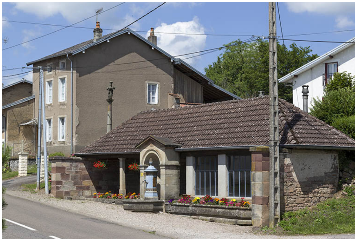
Vue d'ensemble depuis la Grande rue.