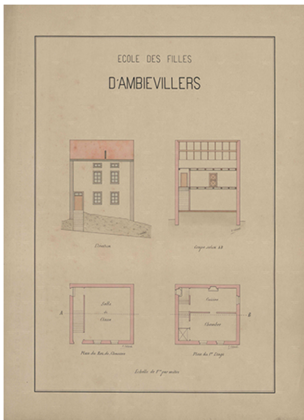
Plan de l'école des filles : élévation, coupe, rez-de-chaussée et 1er étage. 70, Ambiévillers, 26 rue Grande