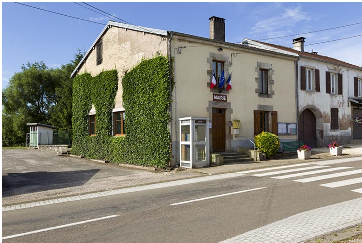
Façades antérieur et latérale gauche.