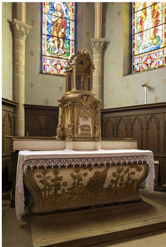
Le maître-autel : représentation du Sacrifice d'Abraham sur la face antérieure de l'autel. 70, Pont-du-Bois rue Saint-Nicolas