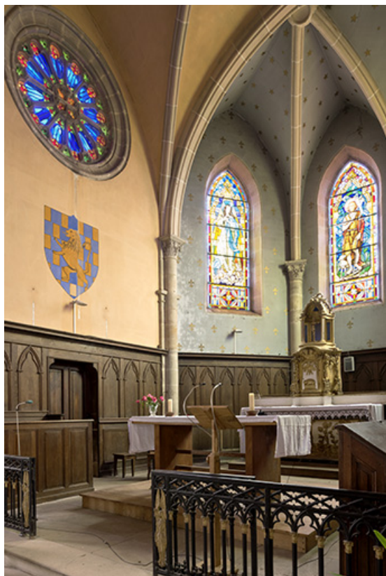
Vue intérieure du chœur.