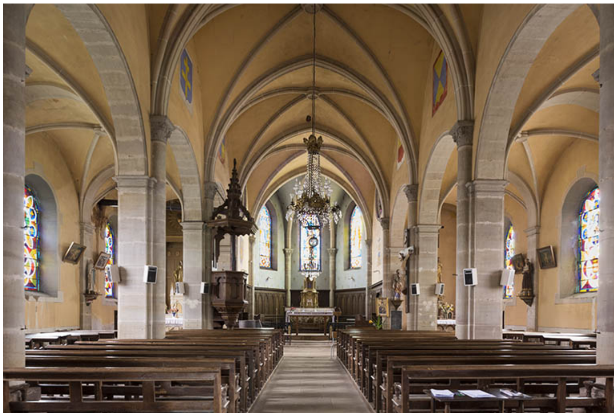
Vue intérieure de l'église.