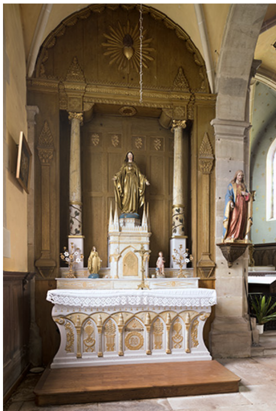
Statue représentant une Vierge de l'Assomption.