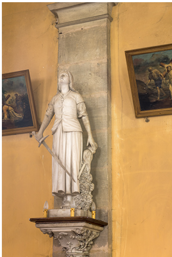
Statue représentant Jeanne d'Arc.