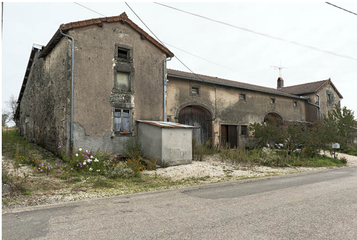
Ferme dans le village (2).