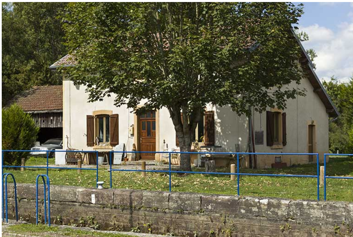
La maison d'éclusier, écluse n°39.