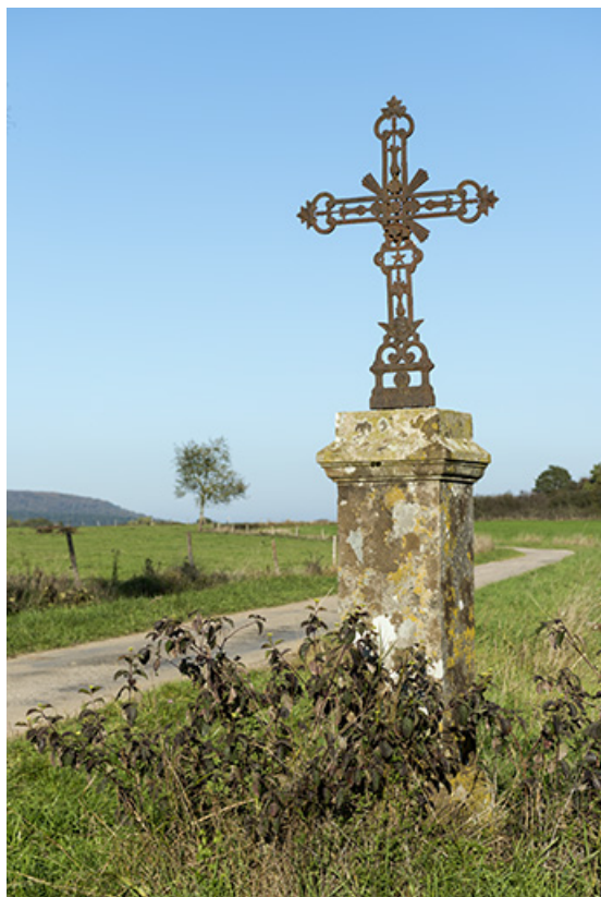
Croix de chemin.