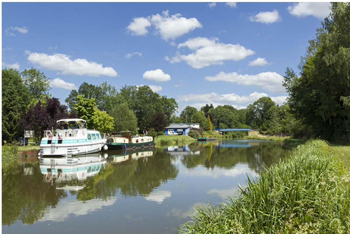
Bâteau de plaisance naviguant sur le canal, Pont-du-Bois.