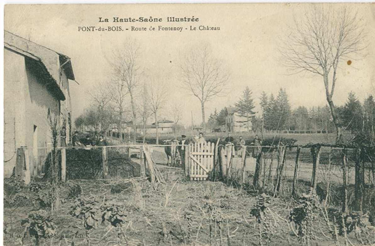
Route de Fontenoy (actuelle route départementale), carte postale. 70, Pont-du-Bois