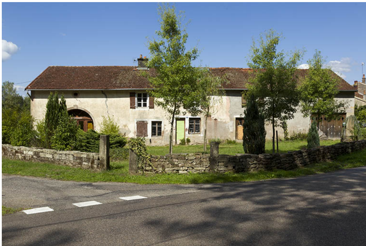
Ancienne épicerie le long de la route départementale. 70, Pont-du-Bois