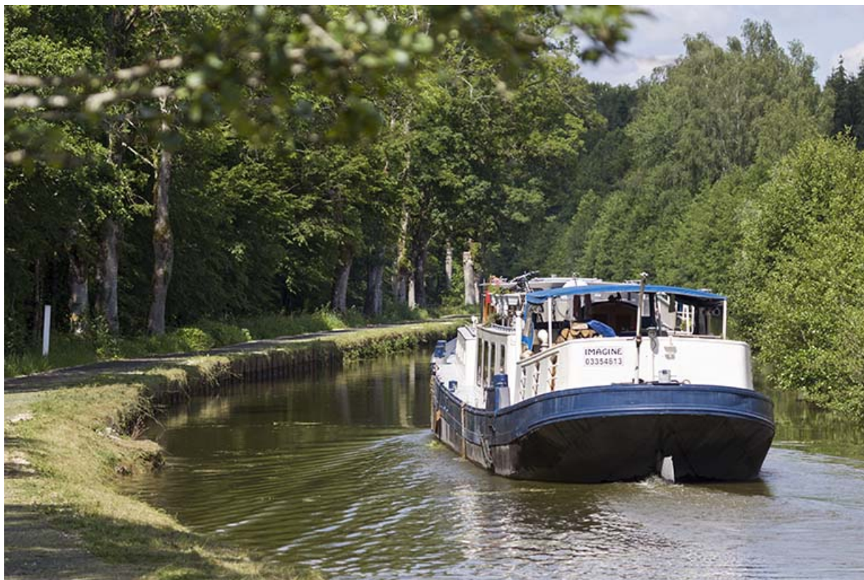
Bâteau naviguant sur le canal de l'Est.