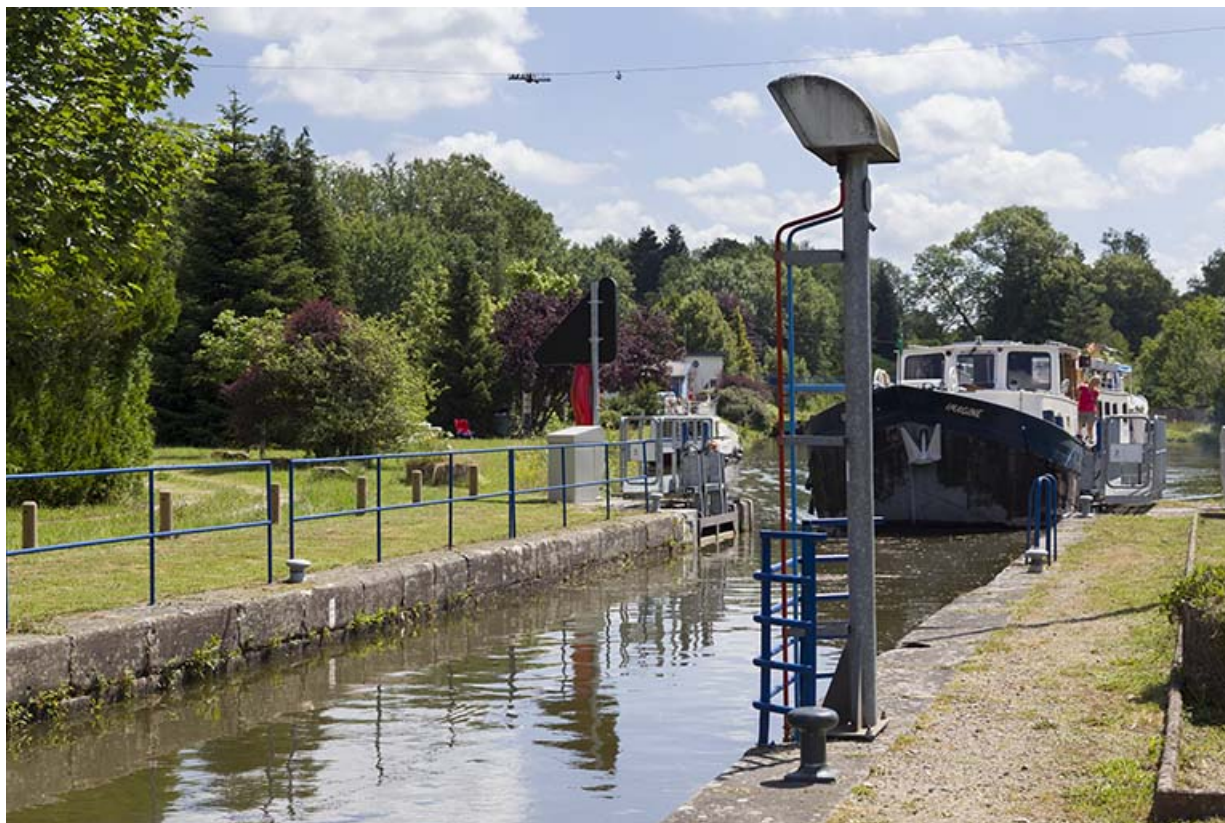
L'écluse de Pont-du-Bois.