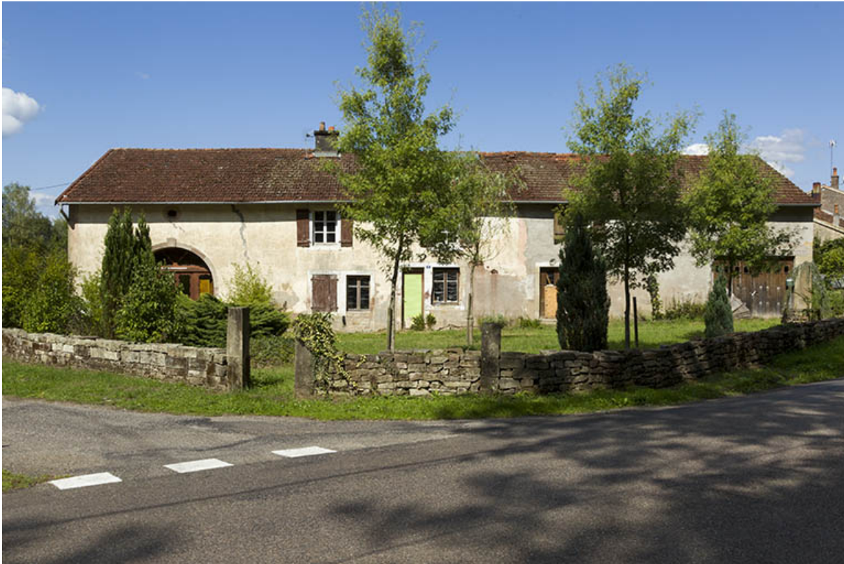
Ancienne épicerie le long de la route départementale. 70, Pont-du-Bois