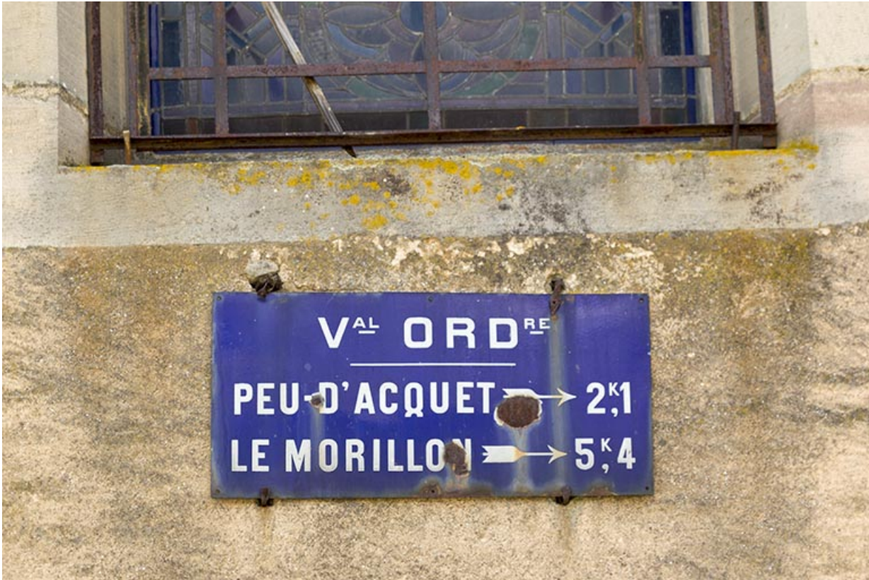
Plaque de rue indiquant les deux hameaux de la commune.