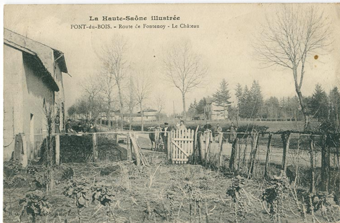
Route de Fontenoy (actuelle route départementale), carte postale. 70, Pont-du-Bois