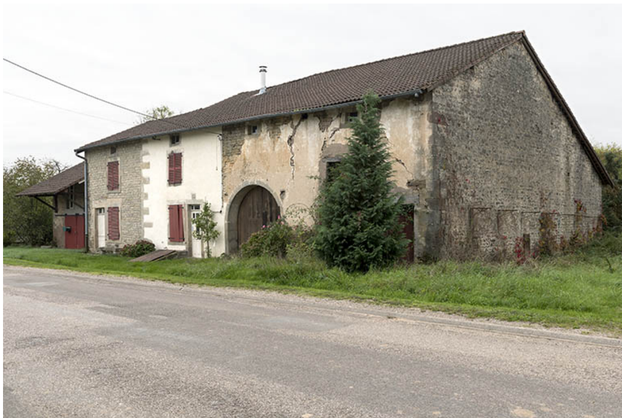
Ferme dans le village (1).