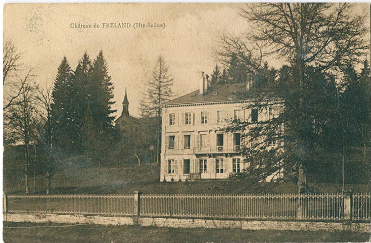
Le château de Freland depuis le canal de l'Est.