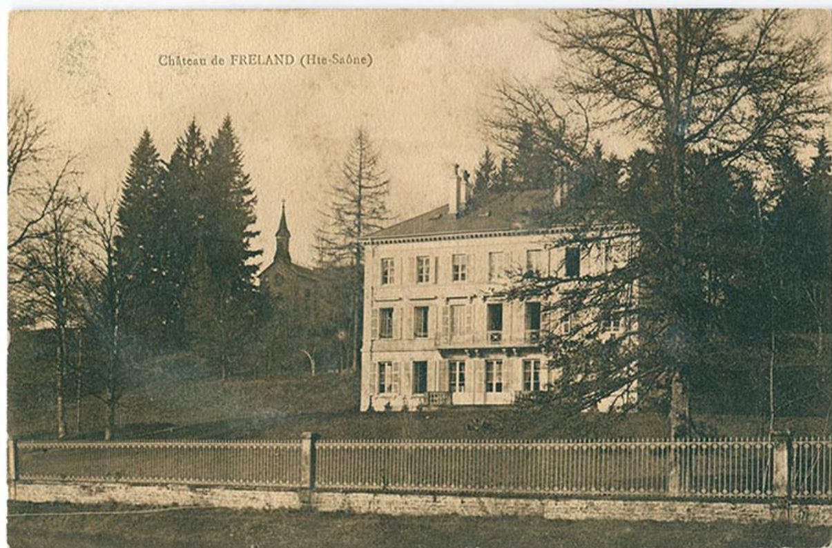
Le château de Freland depuis le canal de l'Est.