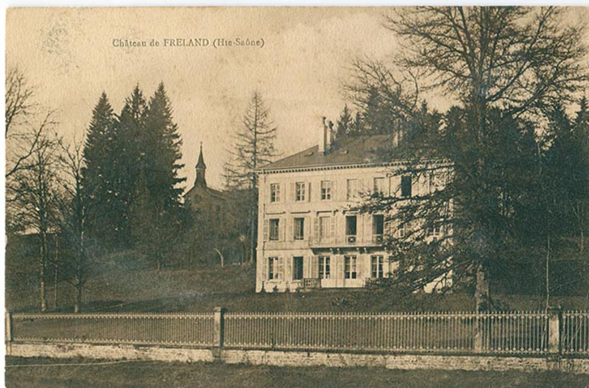
Le château de Freland depuis le canal de l'Est.