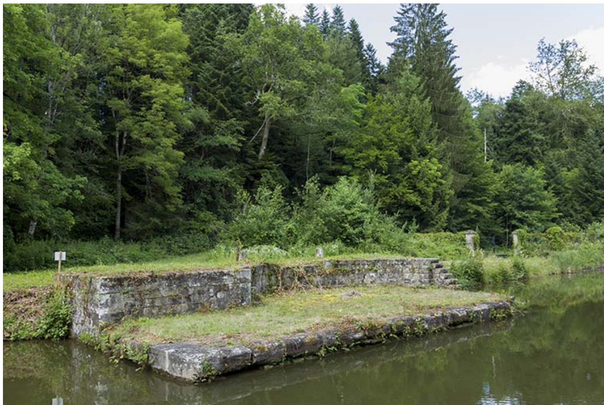
Emplacement du pont tournant au Fréland sur le canal de l'Est.