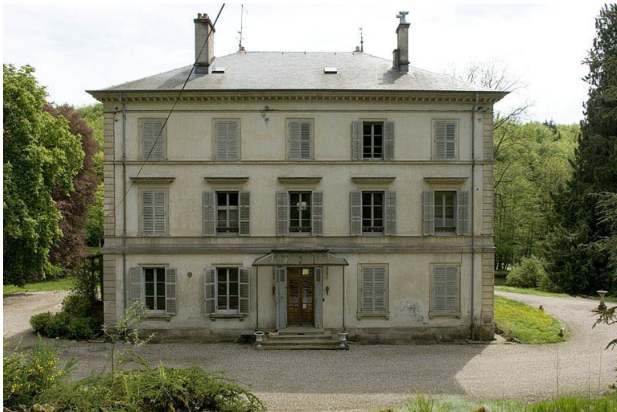
Façade sud de la demeure patronale.