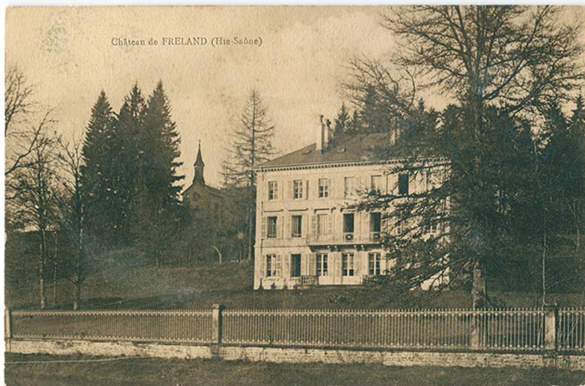
Le château de Freland depuis le canal de l'Est.