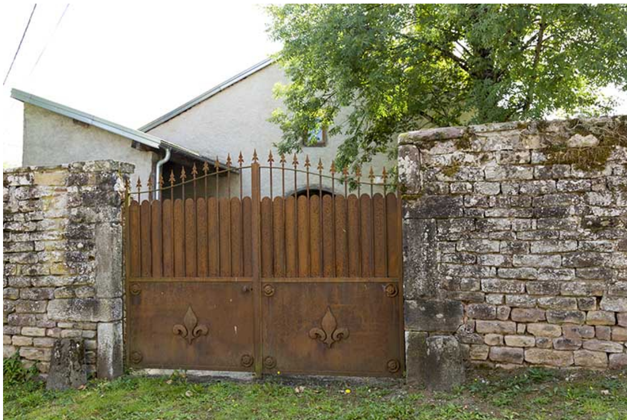
Mur d'enclos sud avec des fleurs de lys sur la grille.