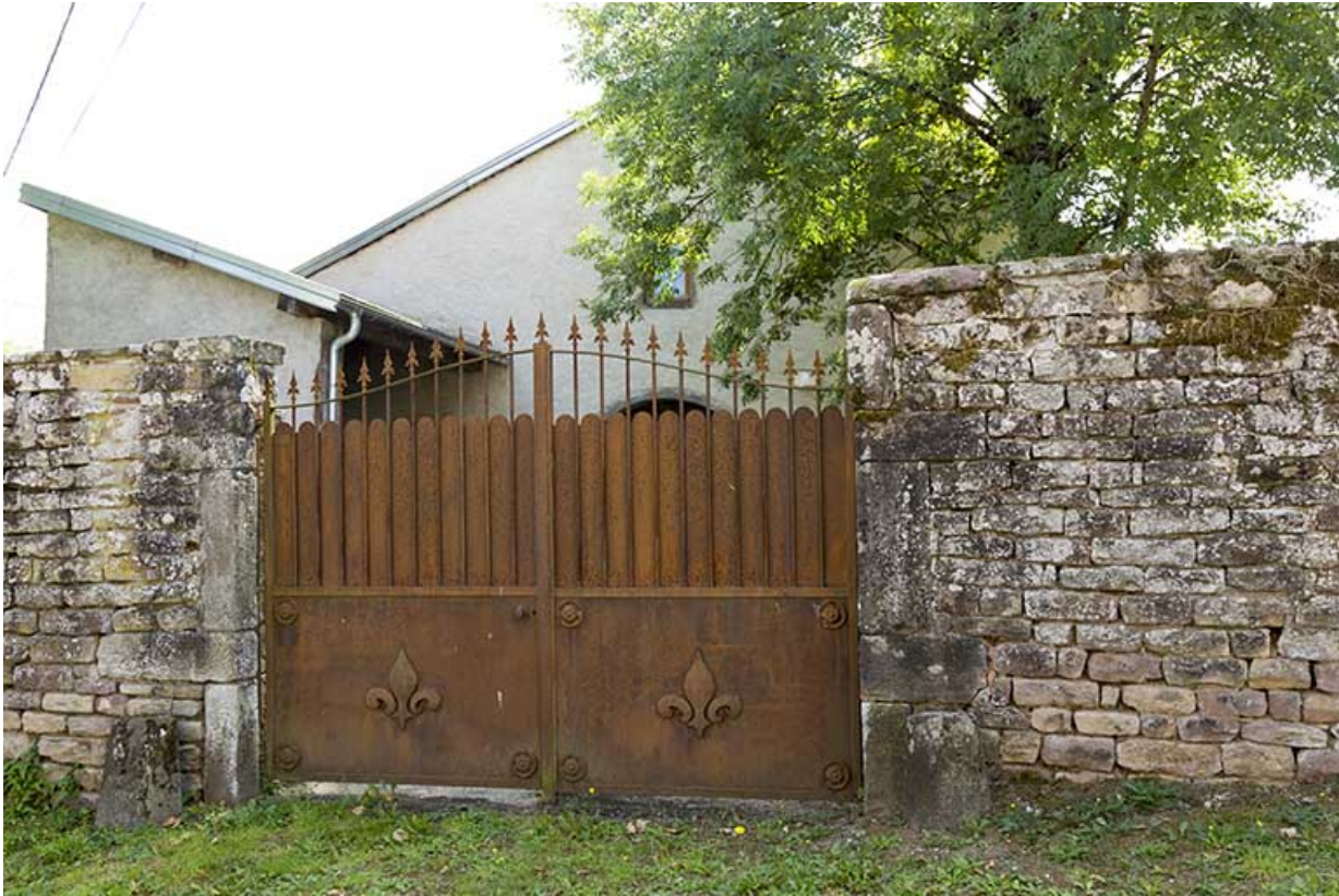
Mur d'enclos sud avec des fleurs de lys sur la grille.