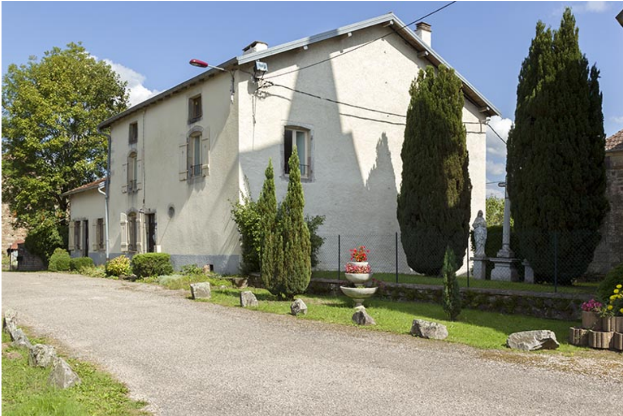
Façades postérieures et latérale sud.