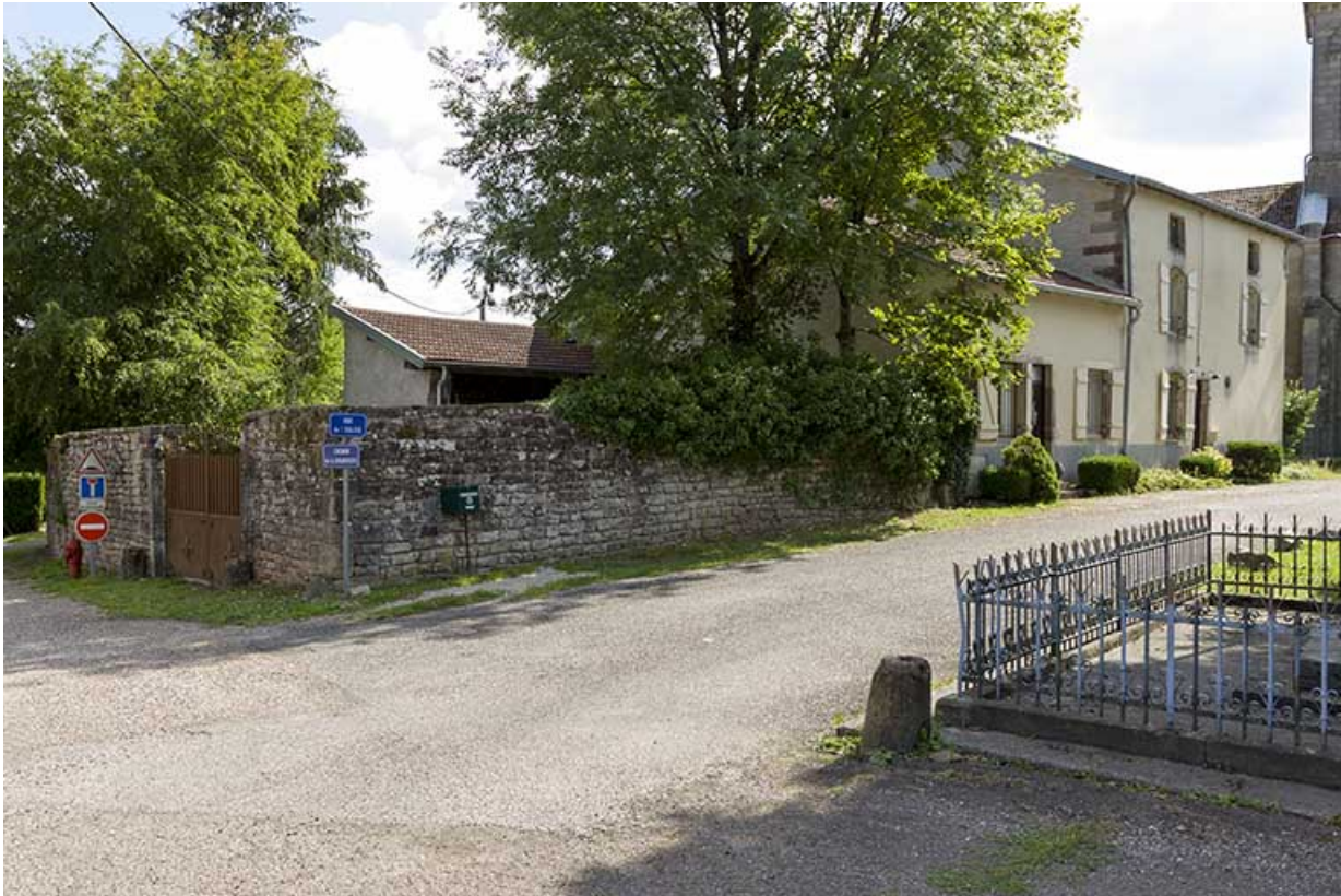
Vue d'ensemble depuis la Grande rue.