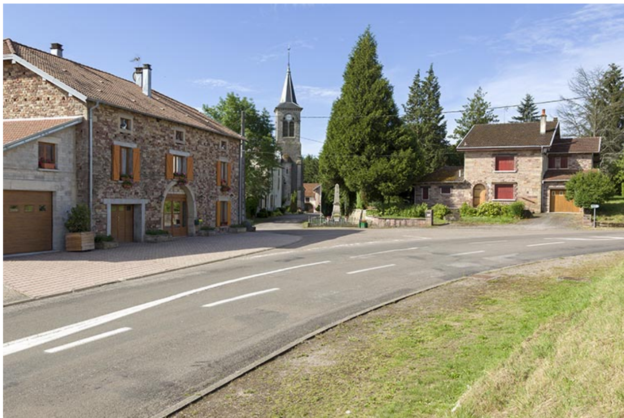
Vue depuis la Grande Rue. 70, Ambiévillers rue de l' Église