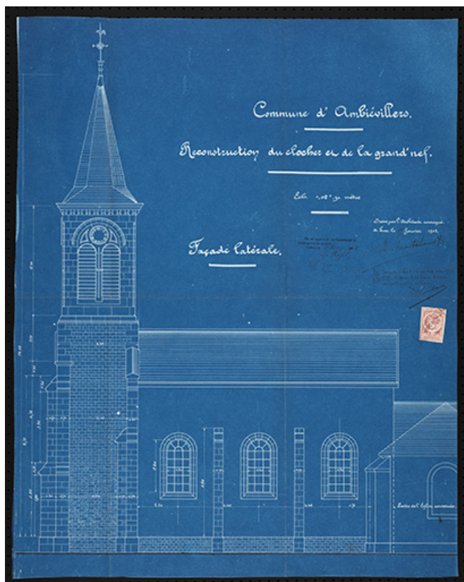
Plan présentant le projet de reconstruction du clocher et de la nef, façade latérale. 70, Ambiévillers rue de l' Église