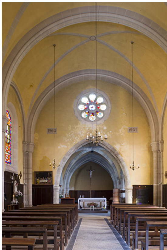
Le chœur et la nef depuis l'entrée.