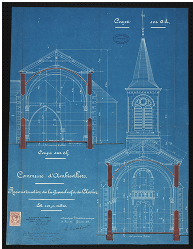
Plan présentant le projet de reconstruction du clocher et de la nef. 70, Ambiévillers rue de l'Église