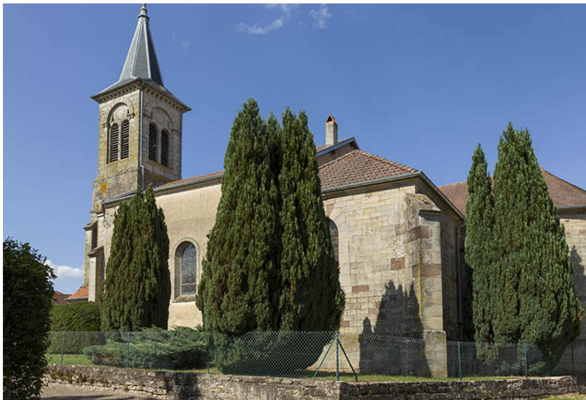
Façade latérale sud de la nef.