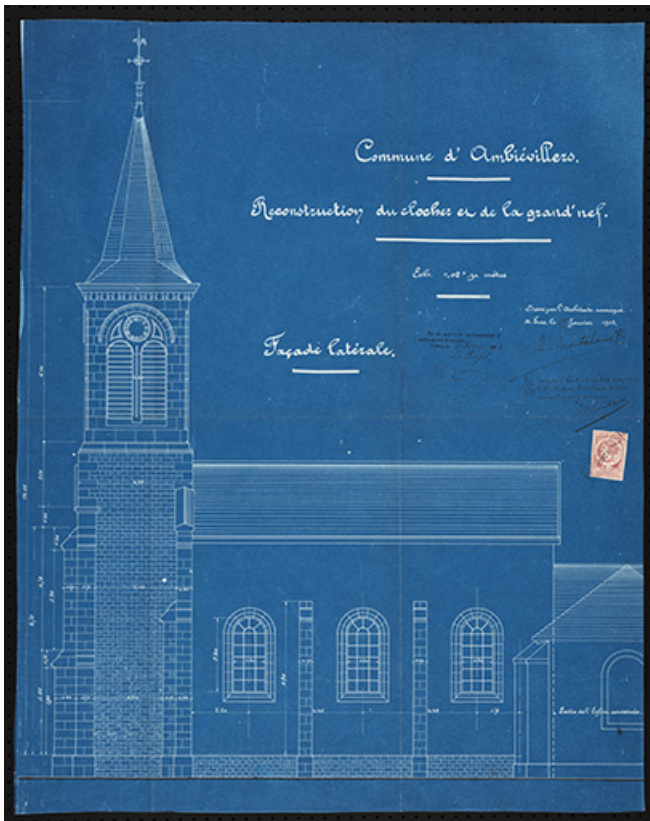
Plan présentant le projet de reconstruction du clocher et de la nef, façade latérale. 70, Ambiévillers rue de l' Église