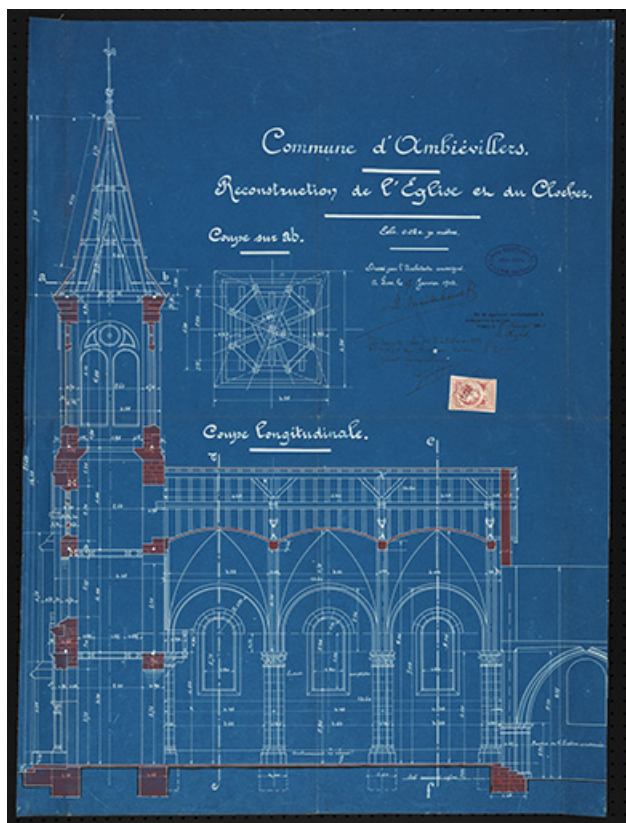
Plan présentant le projet de reconstruction du clocher et de la nef, coupe longitudinale. 70, Ambiévillers rue de l'Église