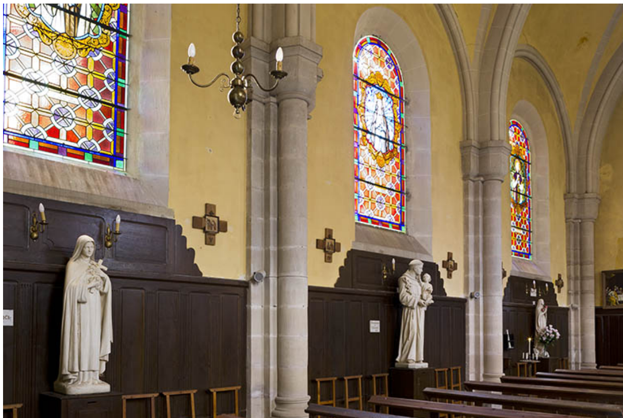
Statues et boiseries du mur latéral nord.