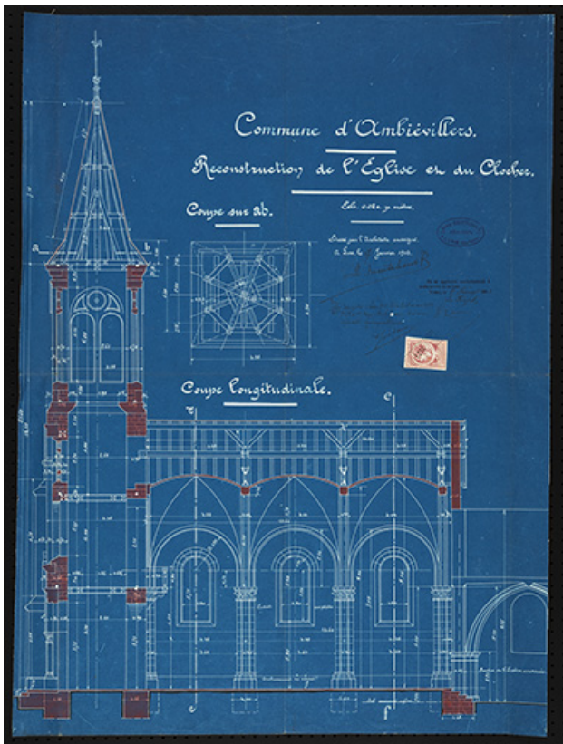
Plan présentant le projet de reconstruction du clocher et de la nef, coupe longitudinale. 70, Ambiévillers rue de l'Église