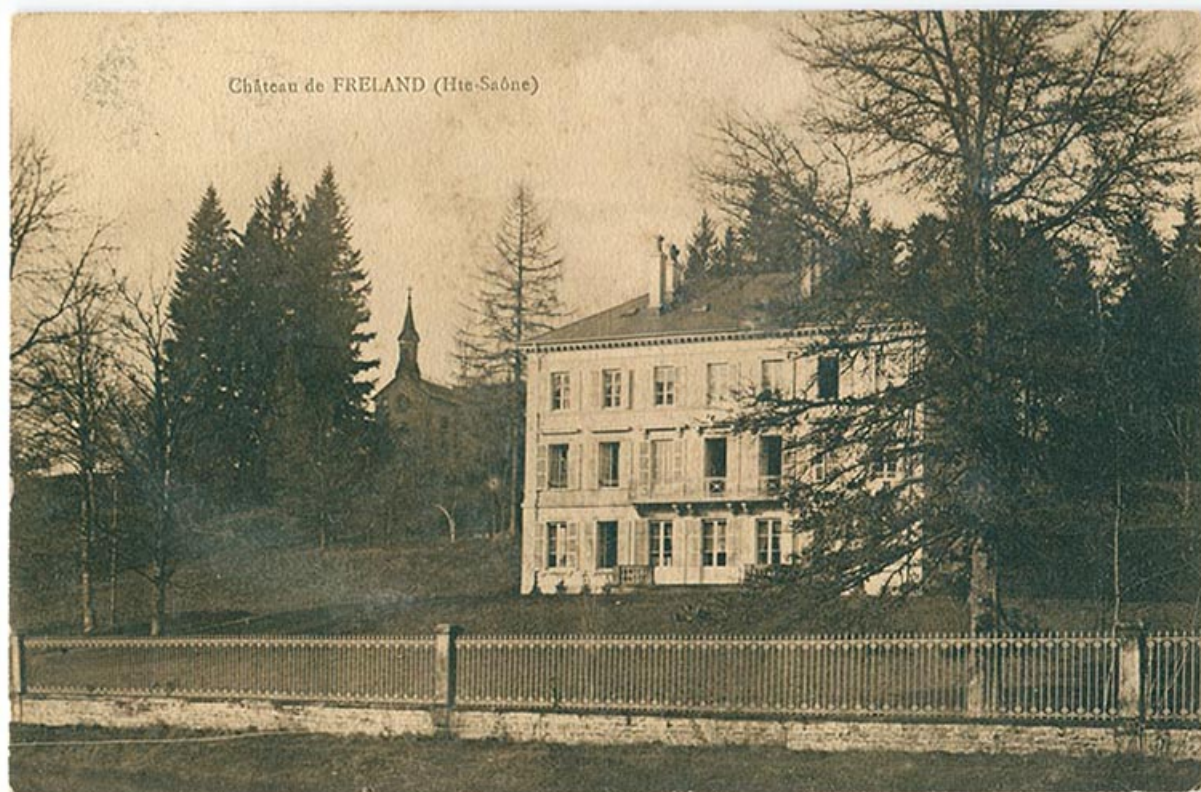
Le château de Freland depuis le canal de l'Est.