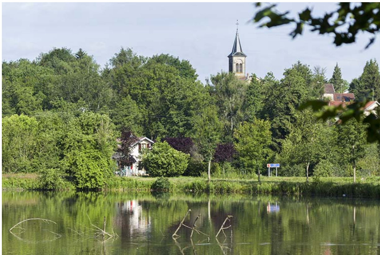
Vue sur le bourg depuis le Coney 70, Ambiévillers