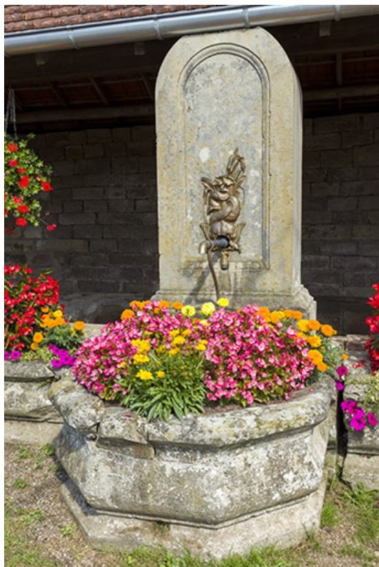
Détail de la borne.