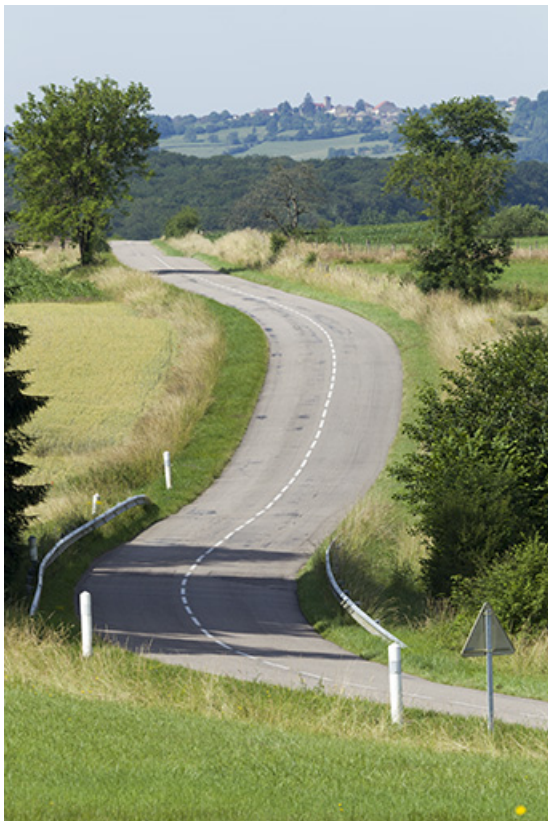
La route départementale 434.