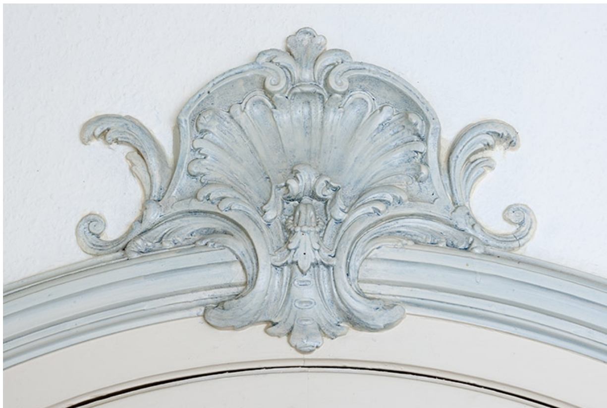
Décor du salon au-dessus de la porte conduisant à la cuisine.