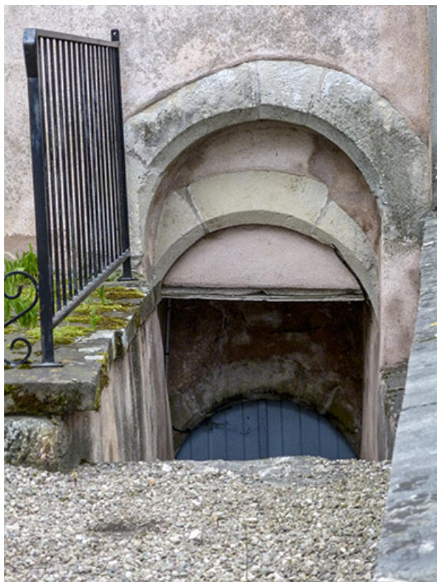
Maison cadastrée 1996 AB 557 : entrée du sous-sol côté cour. 70, Faverney, 9, 11 place de la Mairie