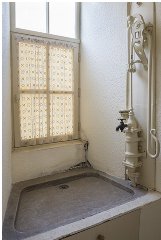
L'ancienne pompe à bras munie d'un robinet au-dessus de l'évier en pierre de la cuisine. 70, Faverney, 9, 11 place de la Mairie