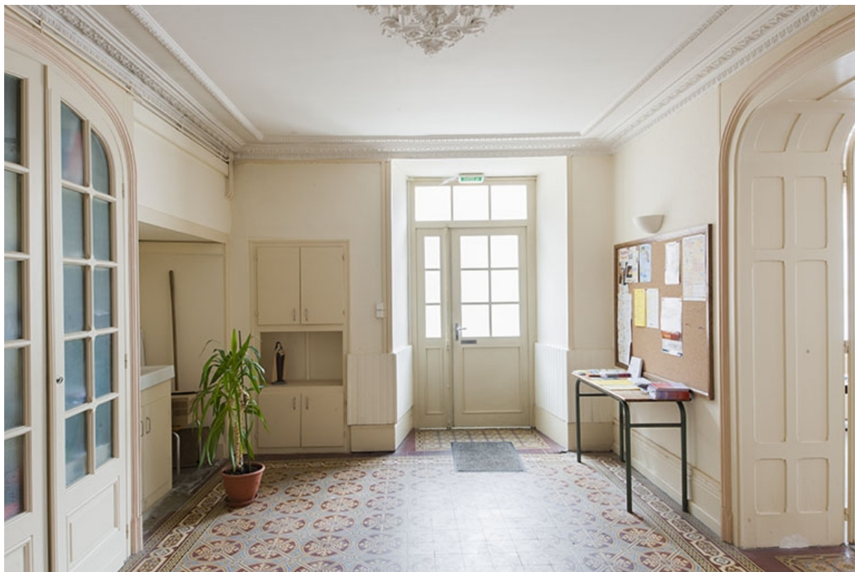
Le vestibule en direction de l'entrée.