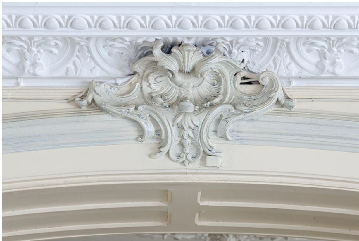
Décor du salon au-dessus de la porte ouvrant sur le vestibule.