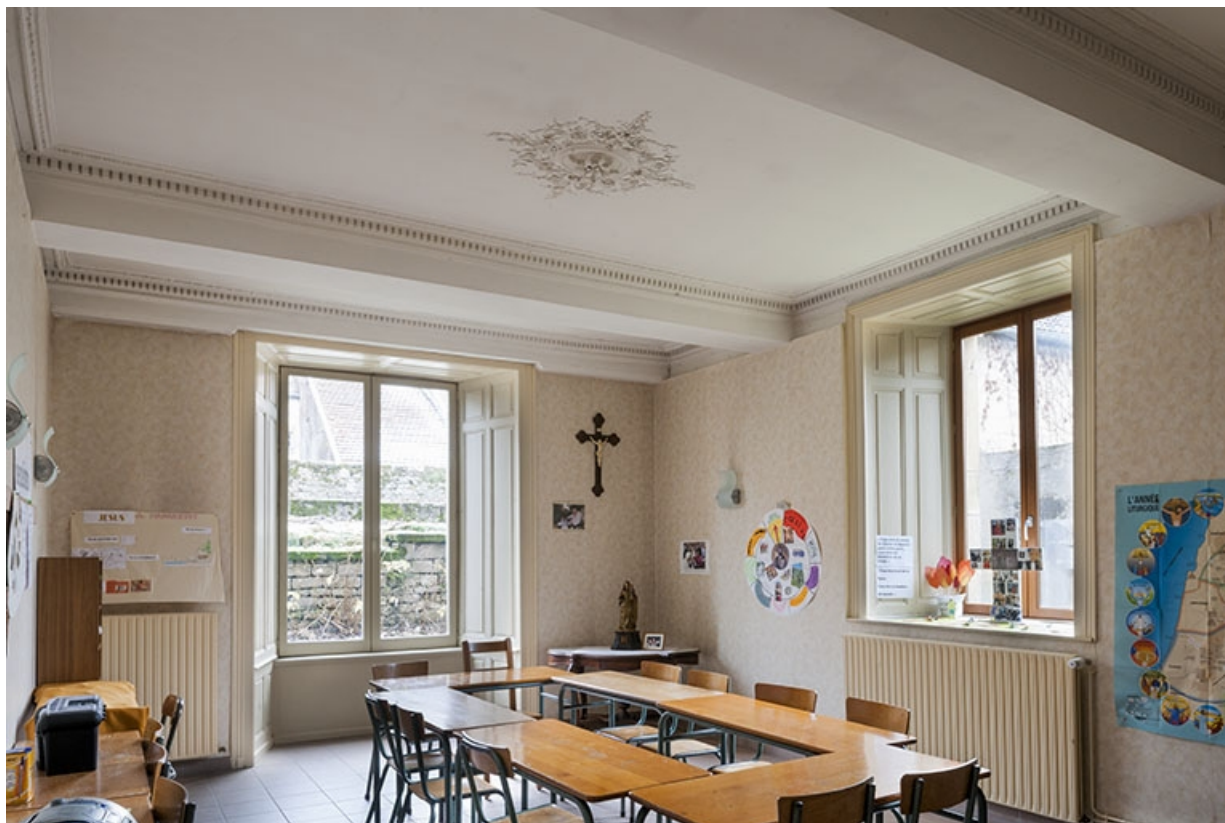
Vue générale de la salle à manger.