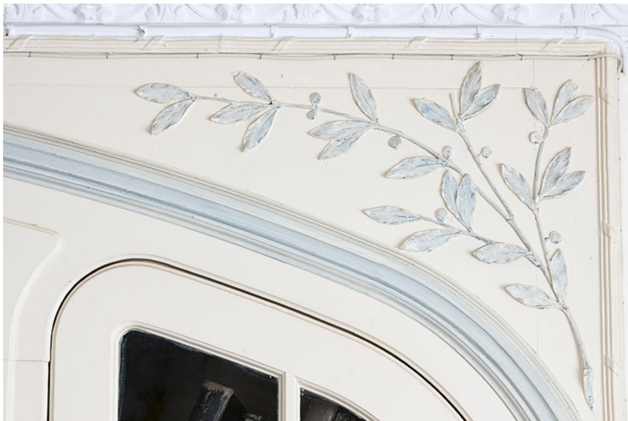
Décor du salon : branche de laurier au-dessus de la porte ouvrant sur le vestibule.