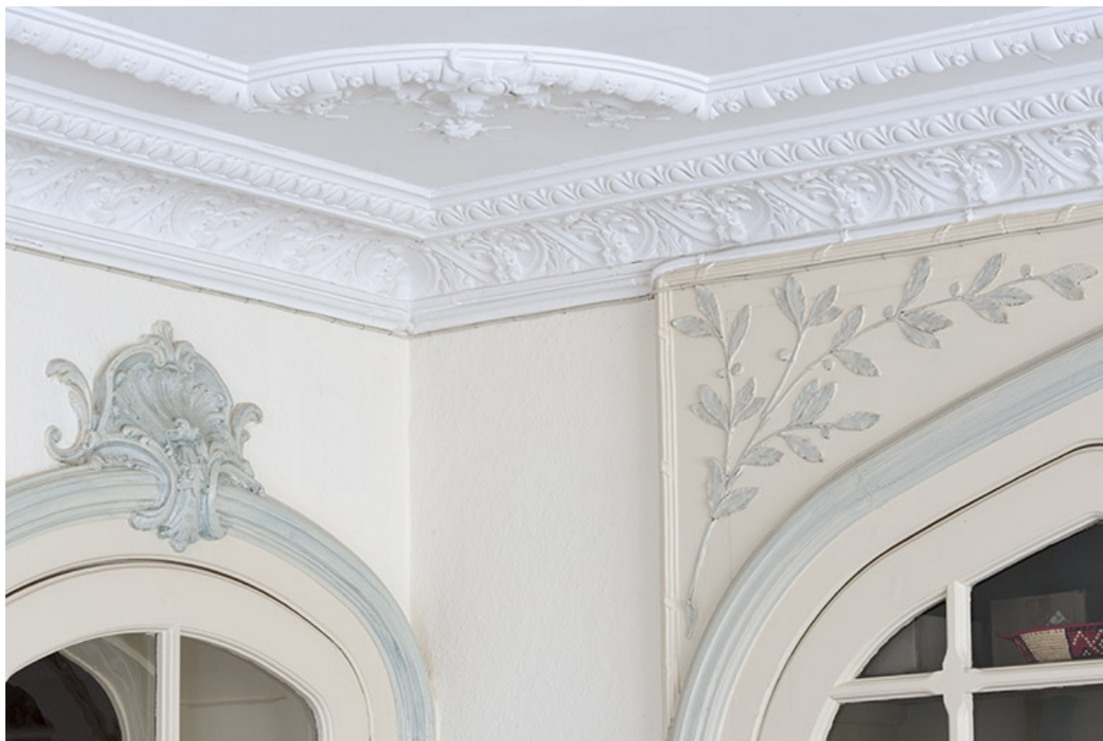
Décor du salon : détail à l'angle de l'entrée.