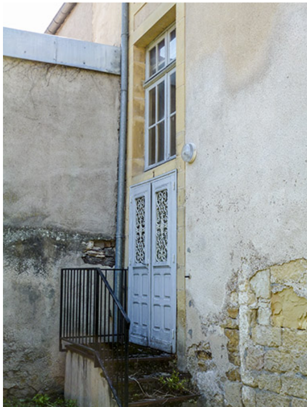
Façade latérale droite : porte de service.