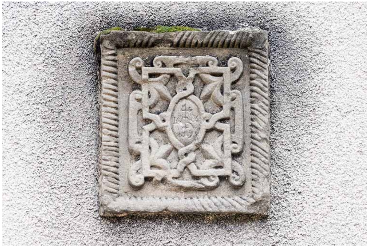
Détail de la façade antérieure : marque de marchand (4 de chiffre) portant la date 1606. 70, Faverney, 9, 11 place de la Mairie