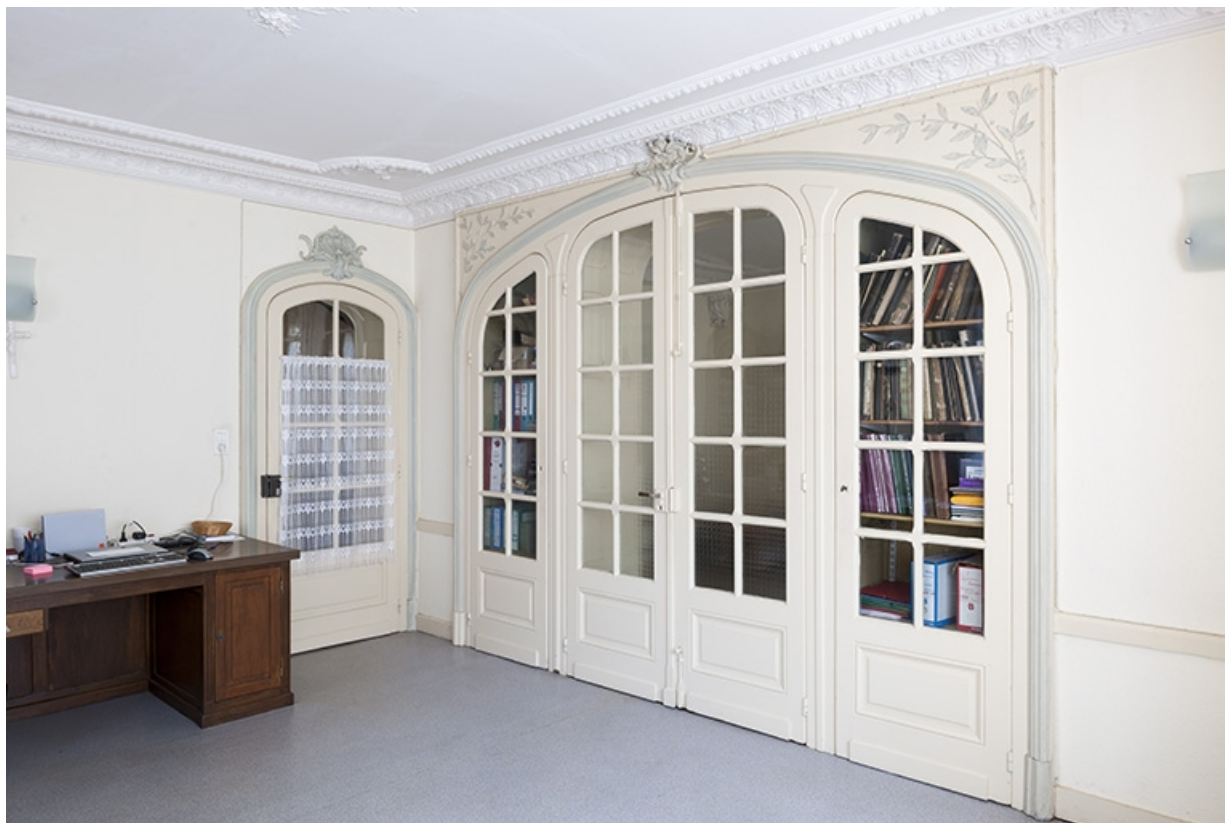
Le salon vu de trois quart : porte ouvrant sur le vestibule et porte conduisant à la cuisine. 70, Faverney, 9, 11 place de la Mairie