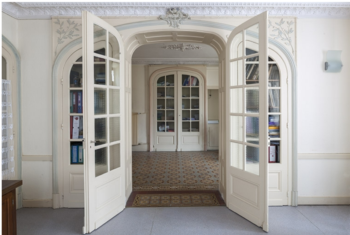
Le vestibule depuis le salon.