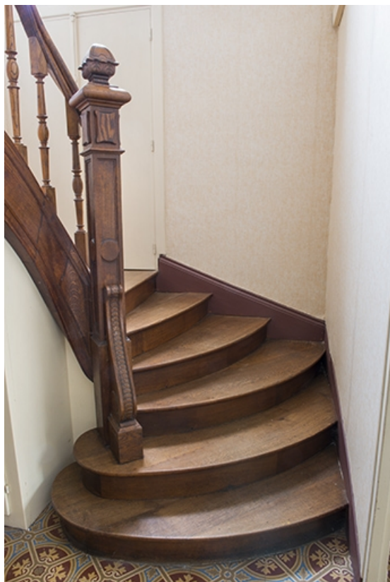
L'escalier conduisant aux chambres situées à l'étage.