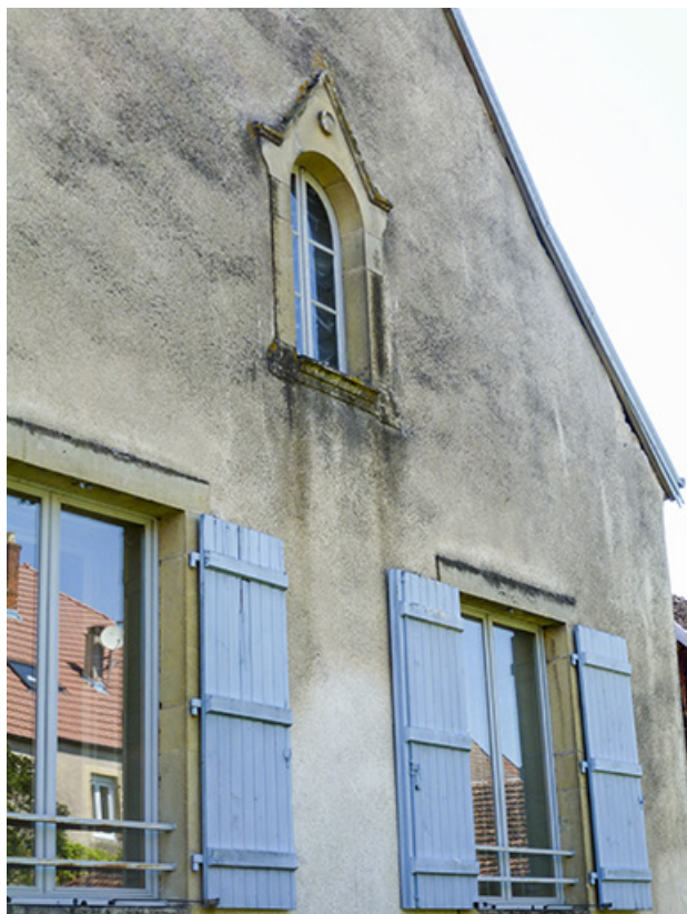
Façade postérieure : vue rapprochée.