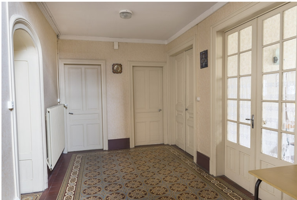
Le vestibule desservant la salle à manger (porte vitrée) attenant à la cuisine. 70, Faverney, 9, 11 place de la Mairie