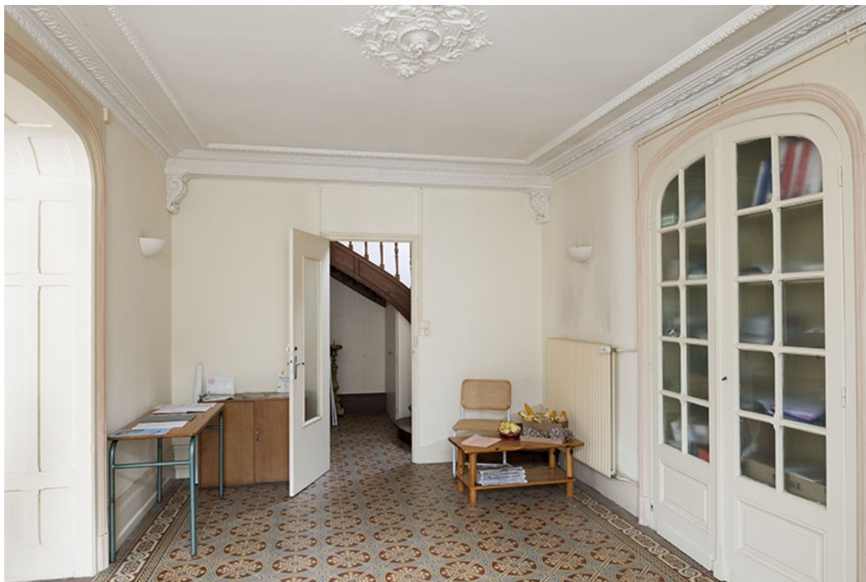
Le vestibule depuis l'entrée conduisant à la cuisine, à la salle à manger et à l'escalier. 70, Faverney, 9, 11 place de la Mairie