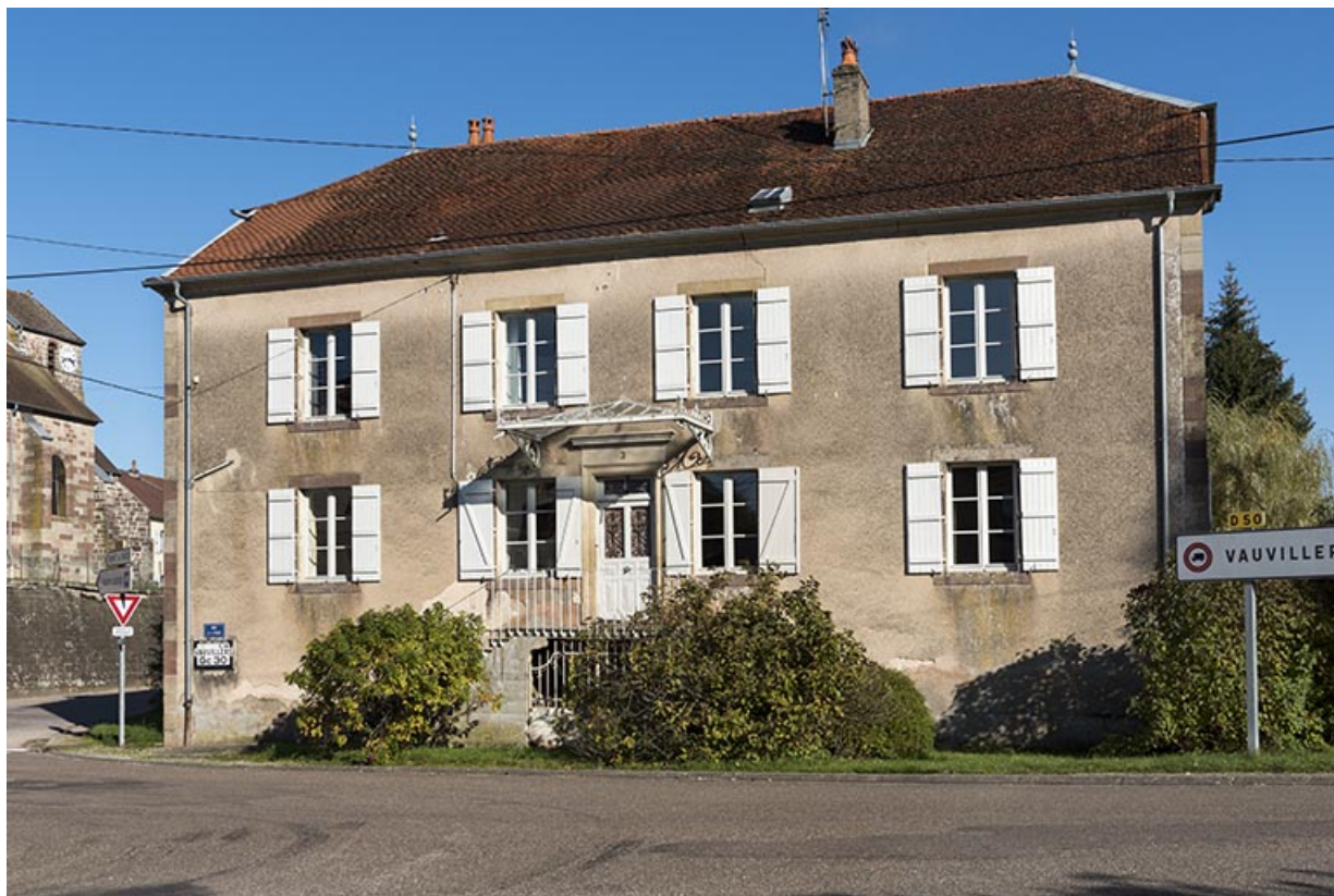
Demeure en bordure du canal.