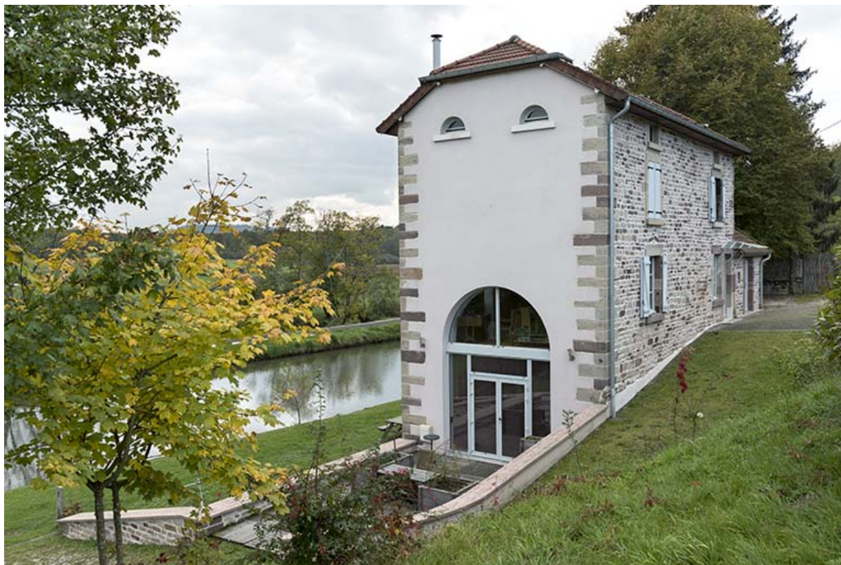
Maison située face au canal, vue latérale (3). 70, Selles