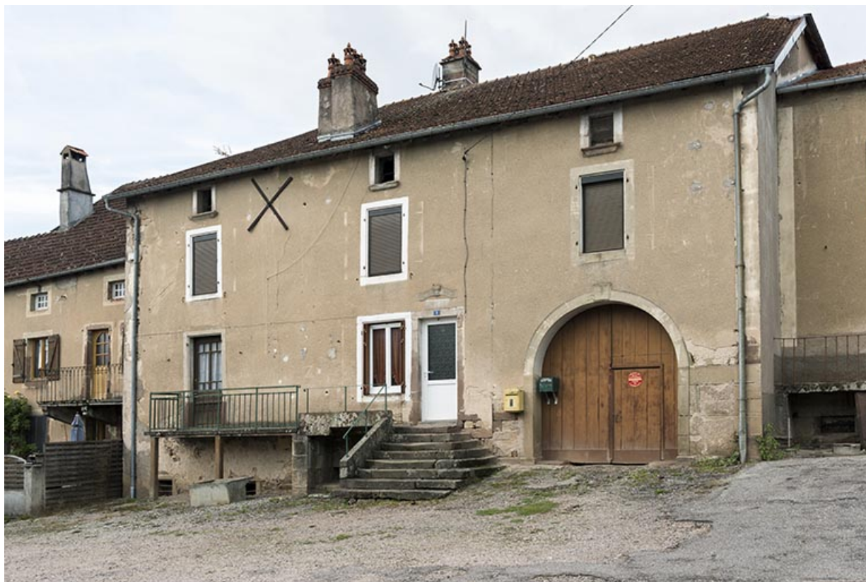
Ancien presbytère de la commune.