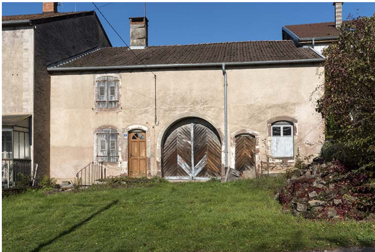
Ferme, rue de la Forge. 70, Selles