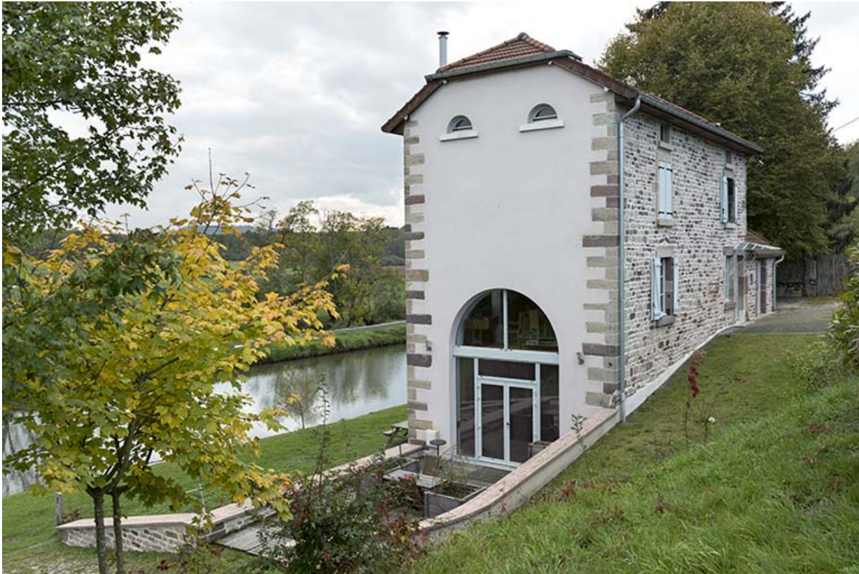
Maison située face au canal, vue latérale (3). 70, Selles