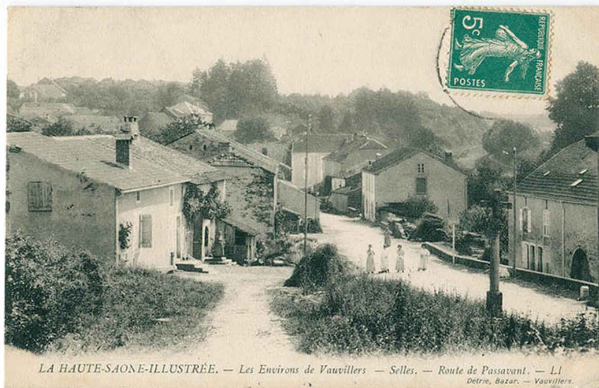
Route de Passavant, carte postale.