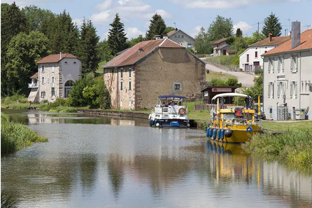
Maisons le long du canal.