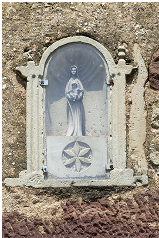
Statue représentant une vierge dans une niche au dessus d'un porte d'entrée. 70, Selles