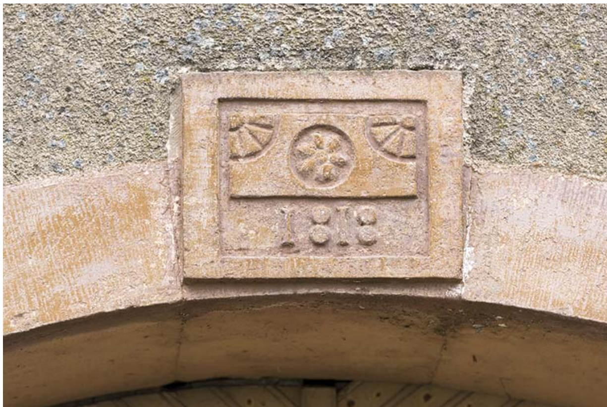
Détail d'une date portée.