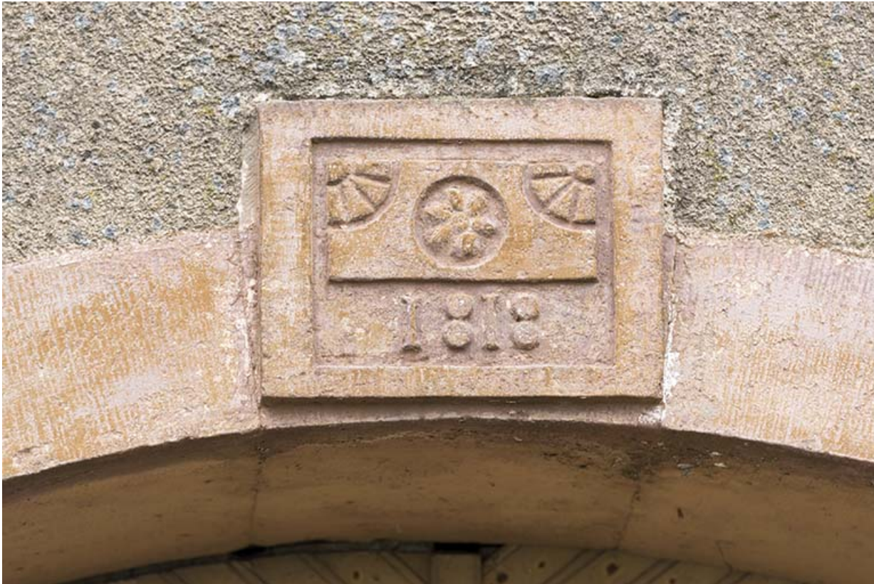
Détail d'une date portée.