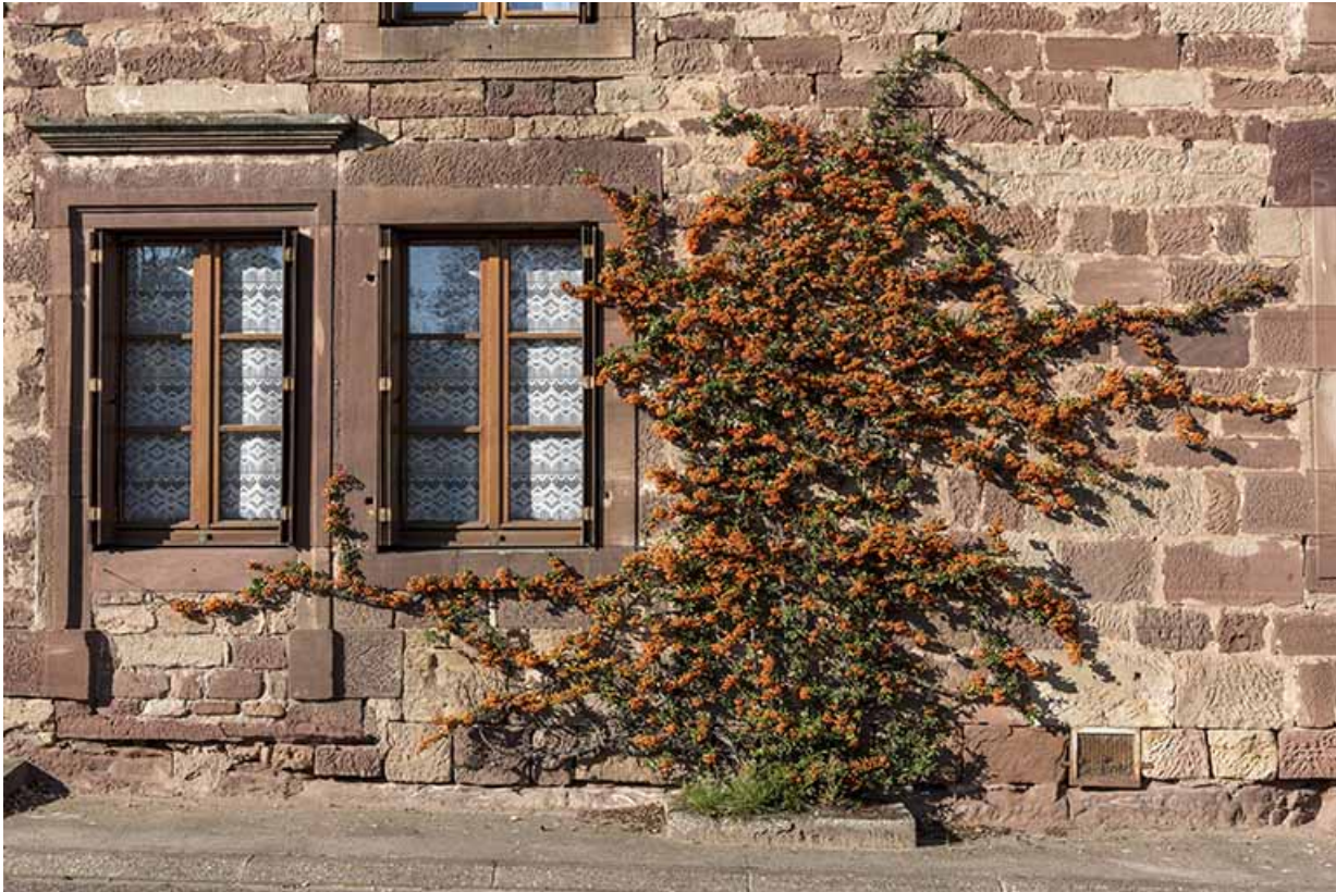
Ferme construite en grès des Vosges.