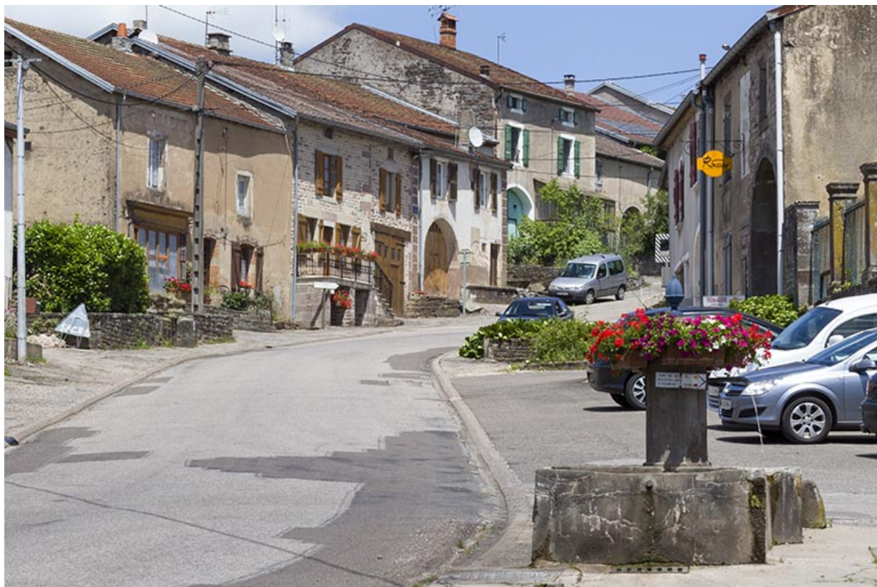
Vue générale de la rue de la Forge.