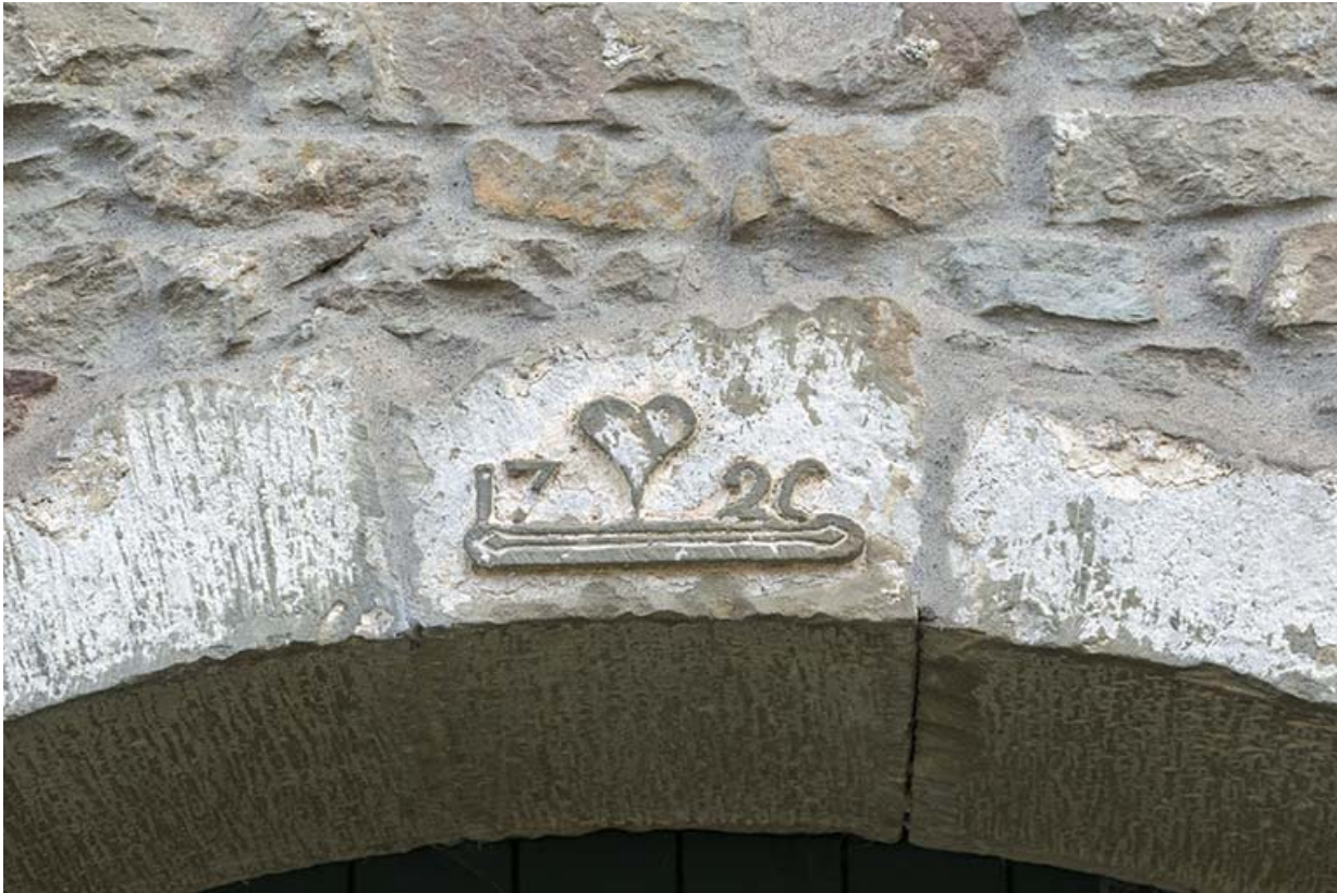
Détail d'une date portée.