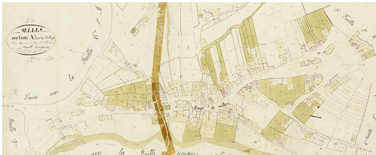
Plan du village extrait du plan cadastral, 1830.