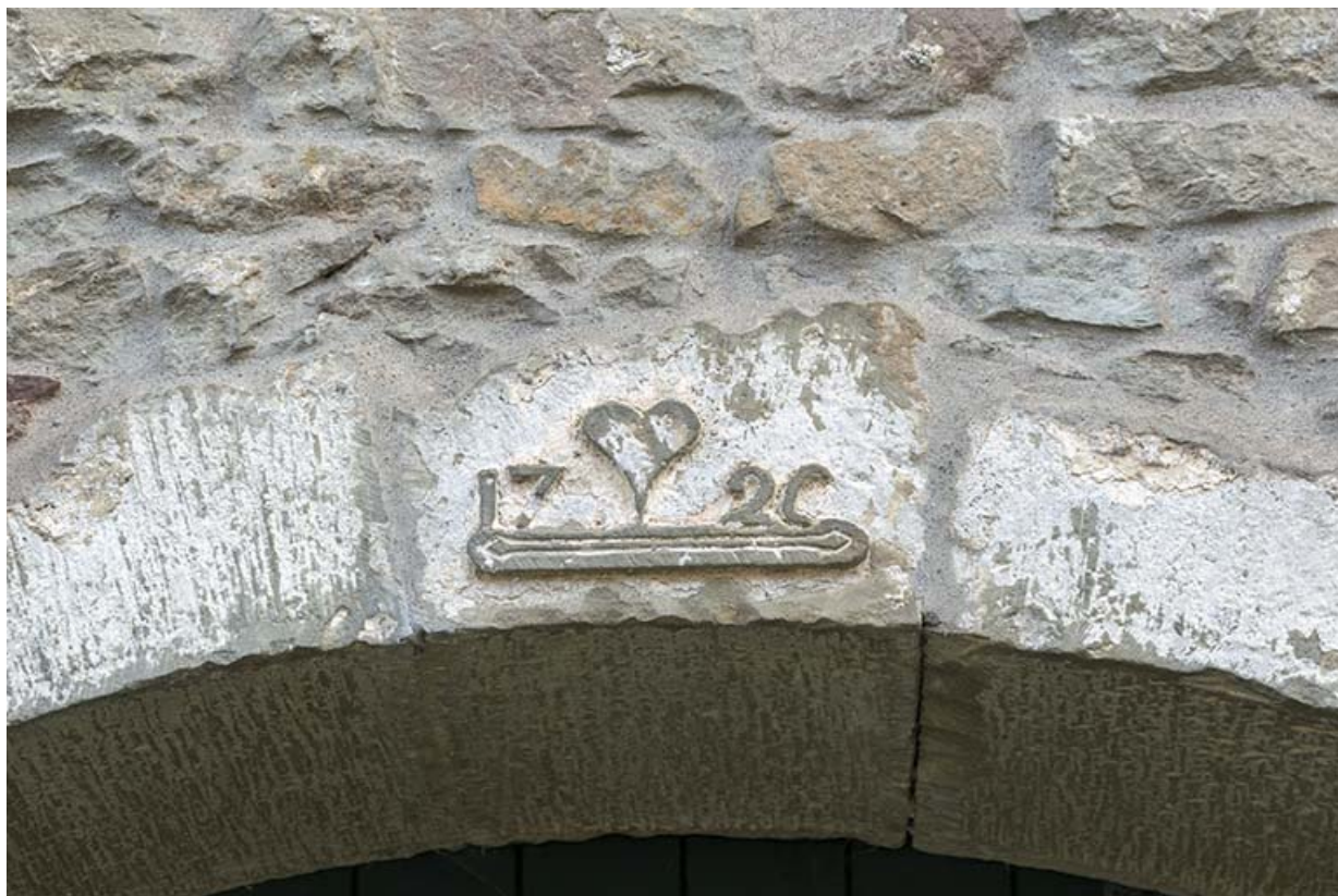
Détail d'une date portée.