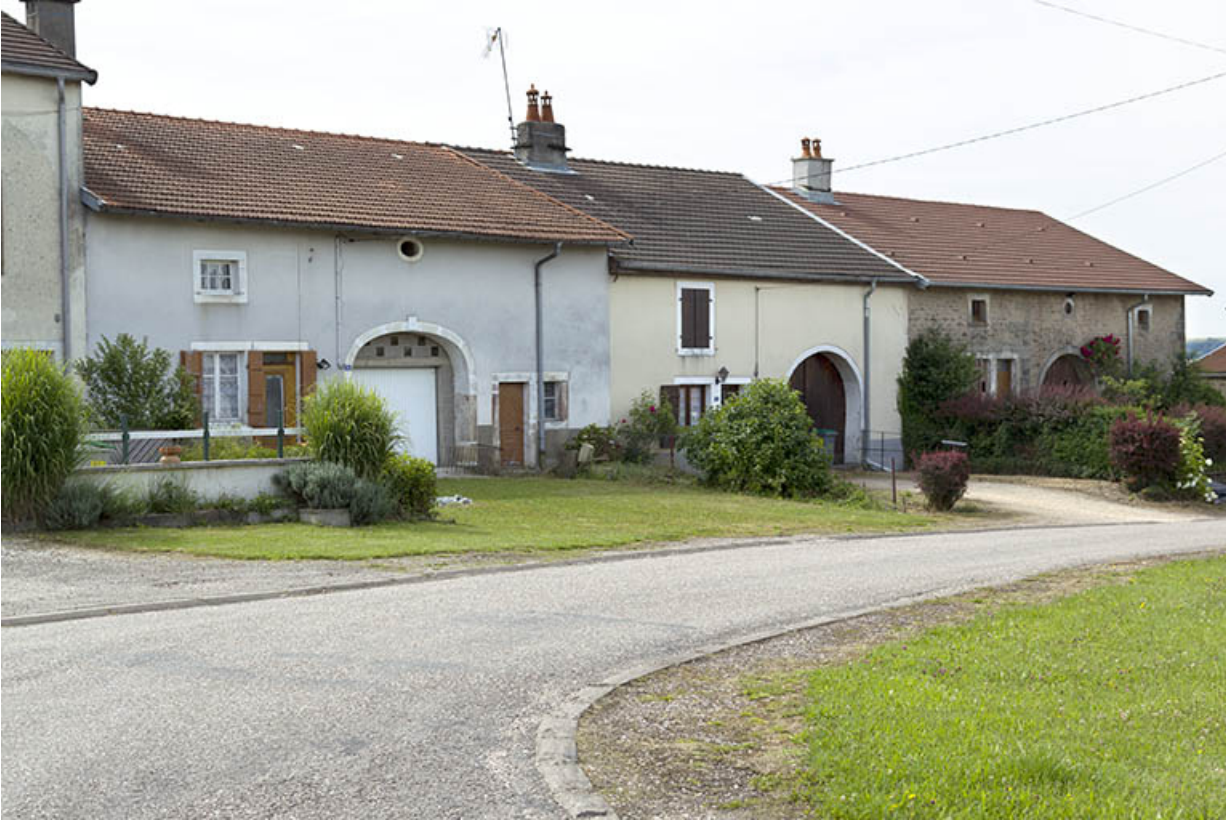
Alignement de fermes, rue de Pont-du-Bois. 70, Selles