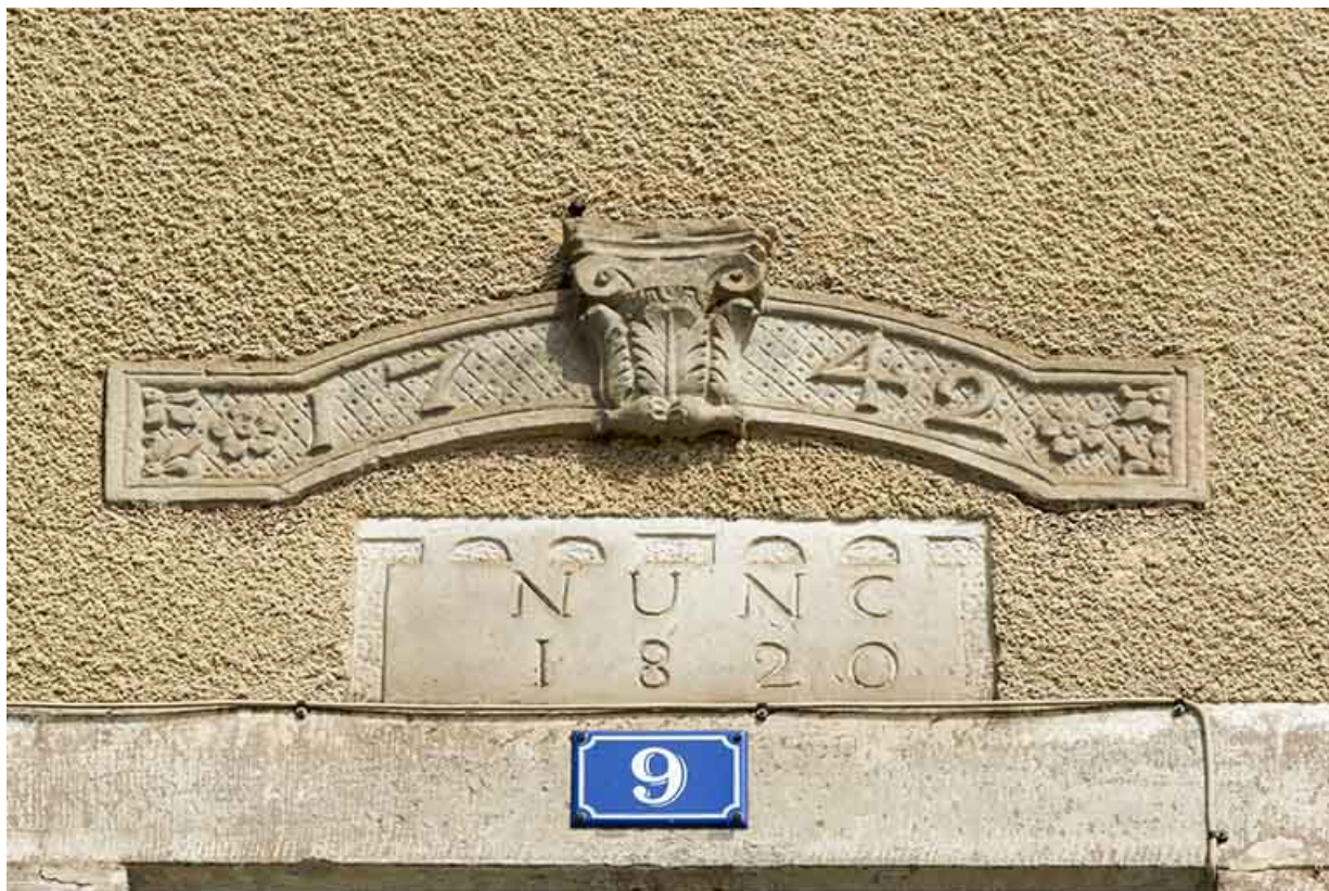
Détail d'une date portée, ancien presbytère. 70, Selles