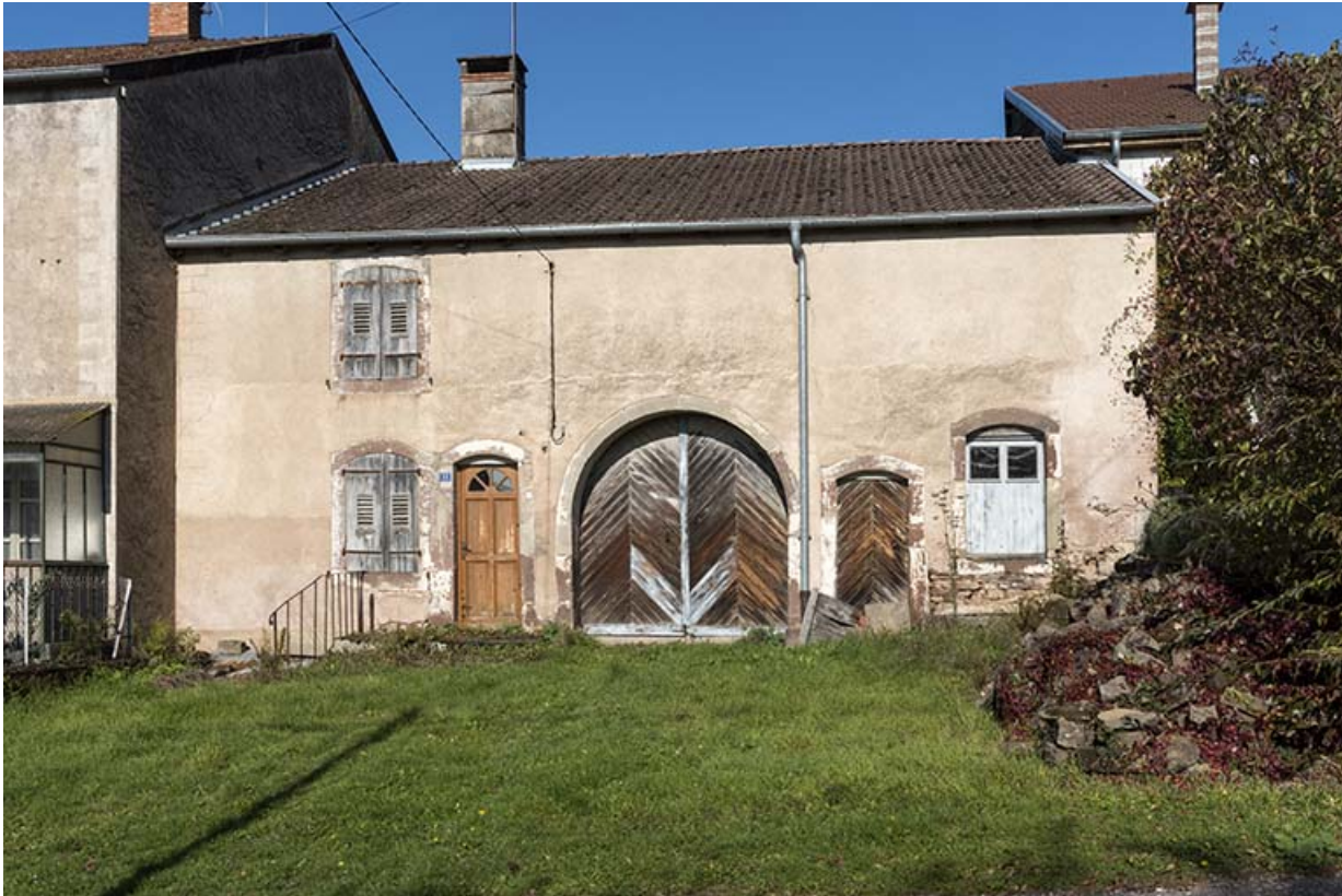
Ferme, rue de la Forge.