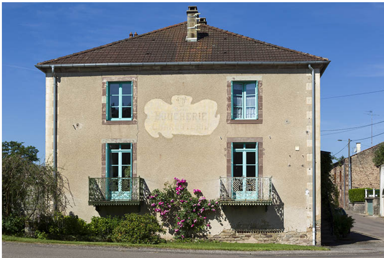
Ancienne boucherie, centre du village.