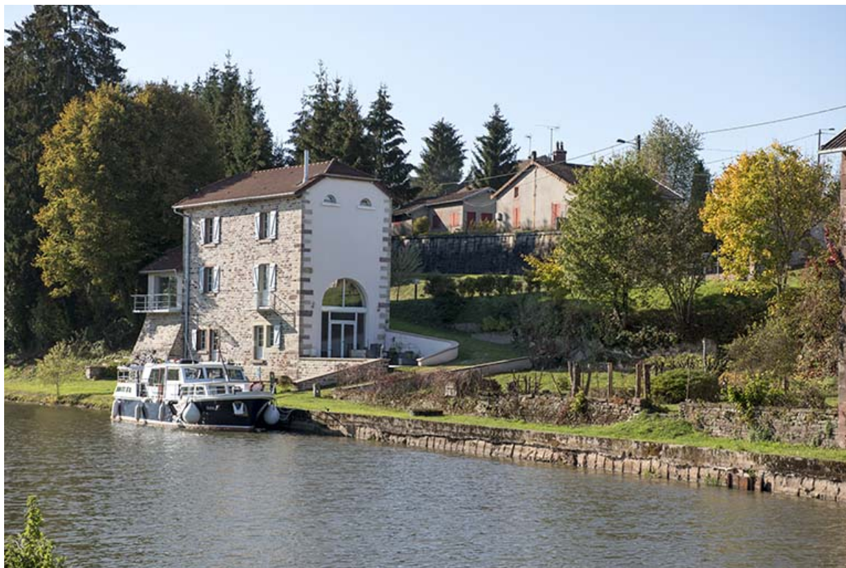
Maison située face au canal (1).