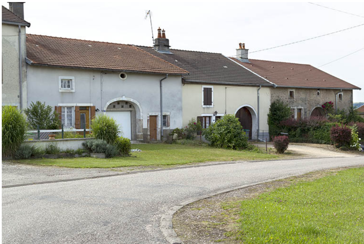
Alignement de fermes, rue de Pont-du-Bois. 70, Selles