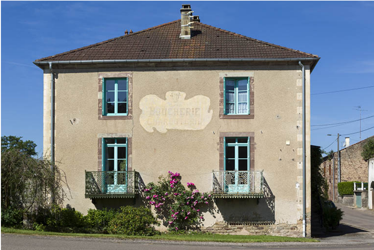
Ancienne boucherie, centre du village.