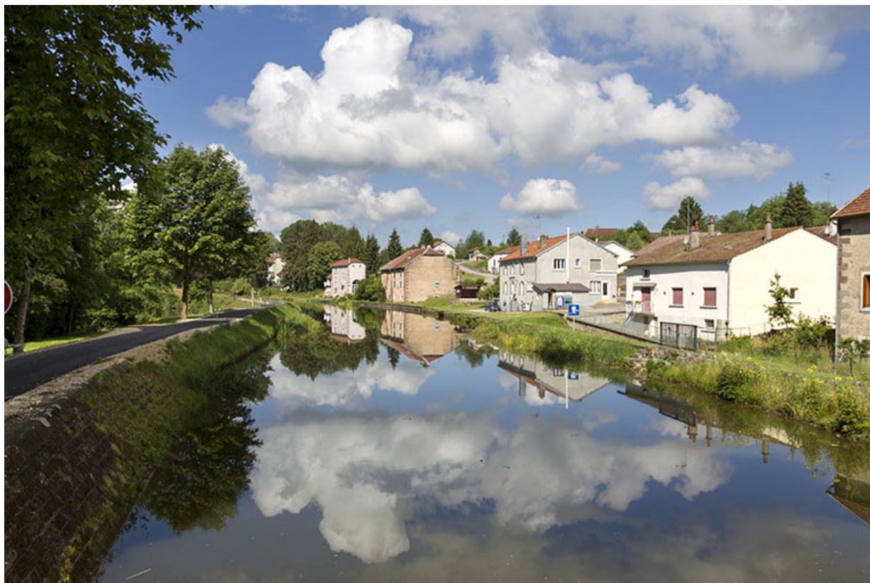
Vue depuis le pont tournant sur les habitations situées rue de la Tuilerie. 70, Selles