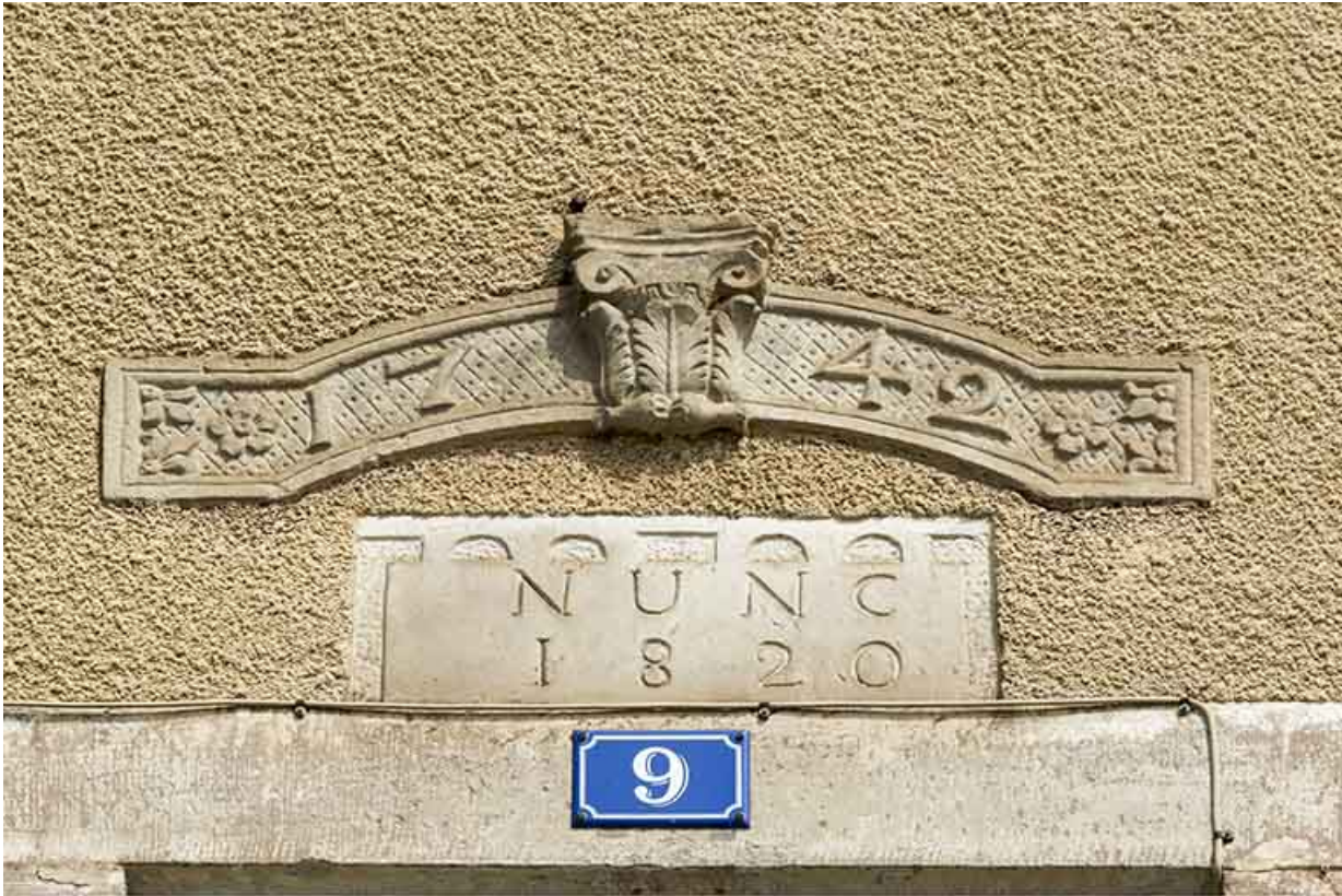
Détail d'une date portée, ancien presbytère.