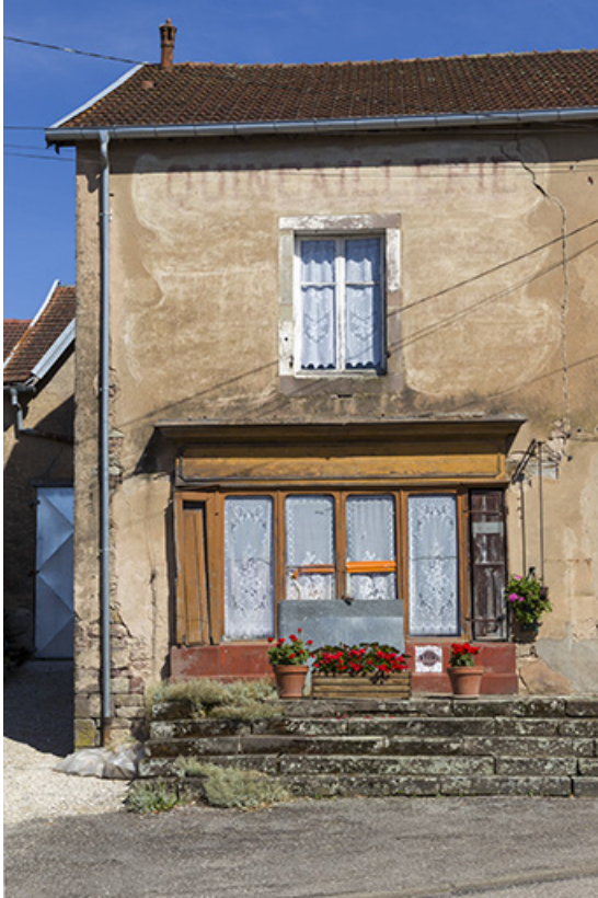
Ancienne boutique, rue de la Forge.