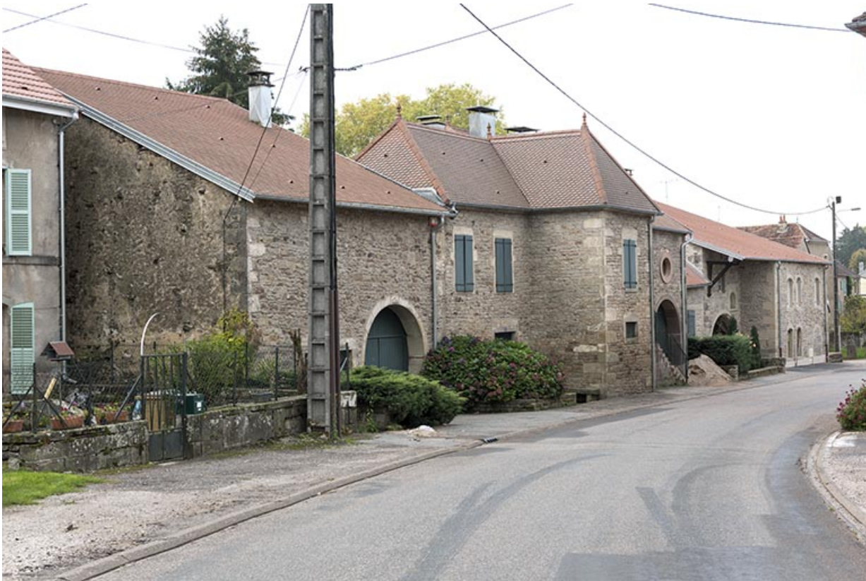
Maisons dans le bas de la rue de la Forge.