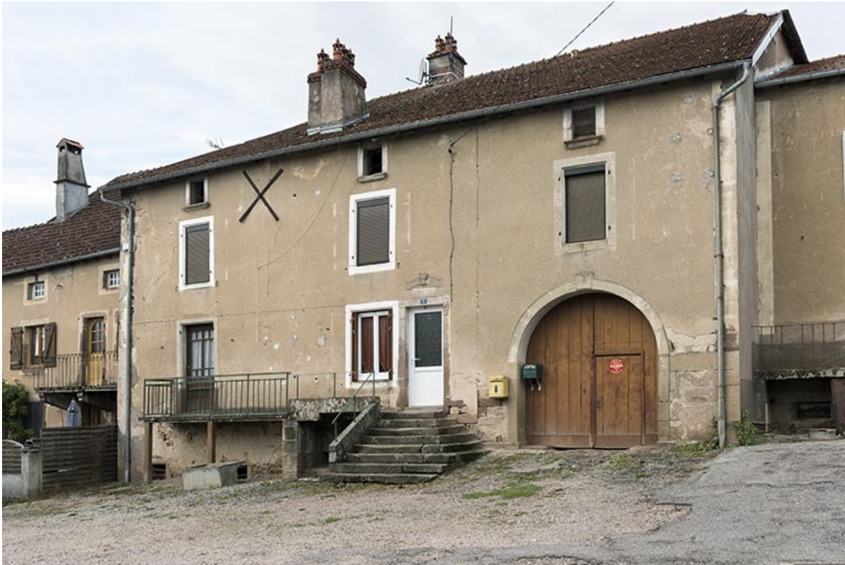
Ancien presbytère de la commune.