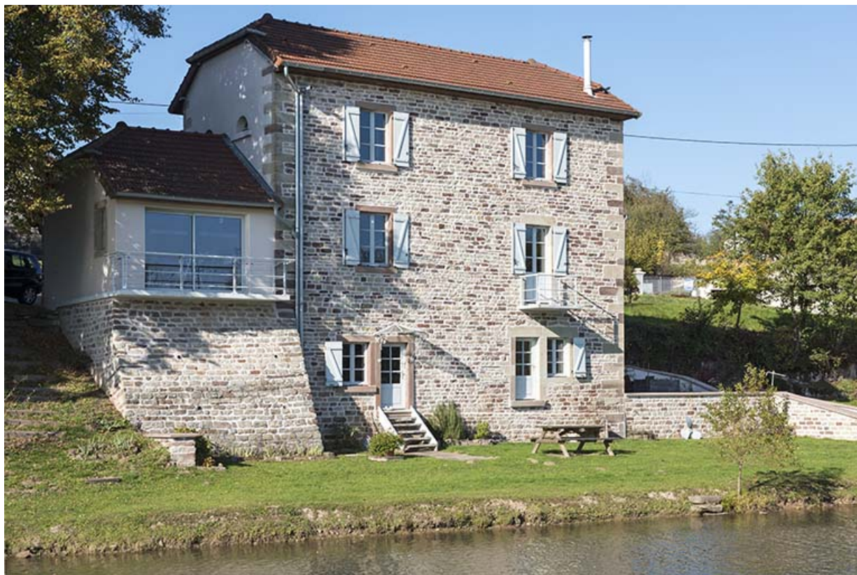
Maison située face au canal (2).