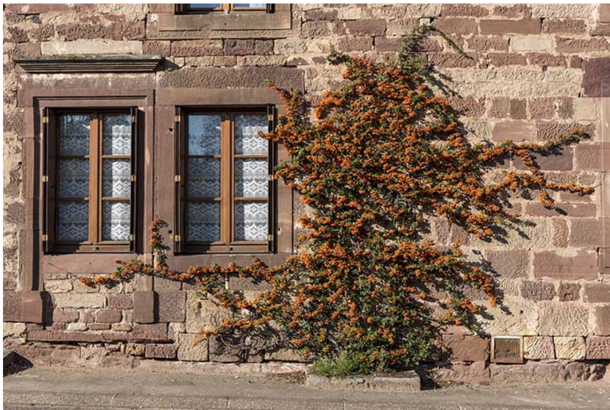
Ferme construite en grès des Vosges.