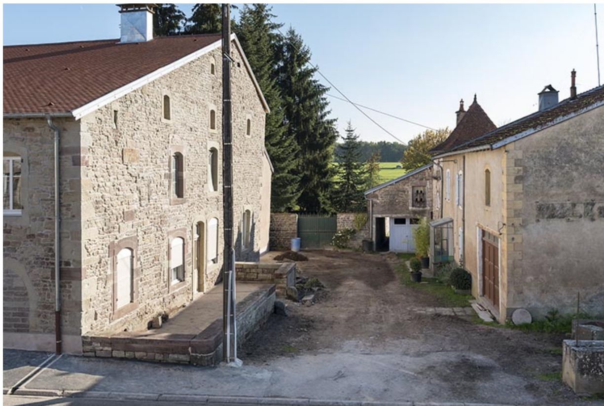
Vue du mur pignon ouest.