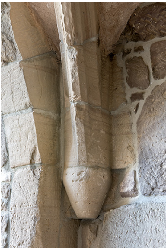
Détail d'un culot.