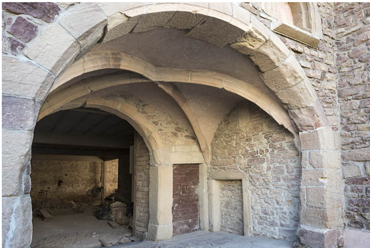
Les voûtes d'ogives du porche.