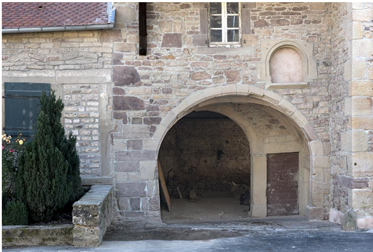
Le porche et l'accès à la grange.