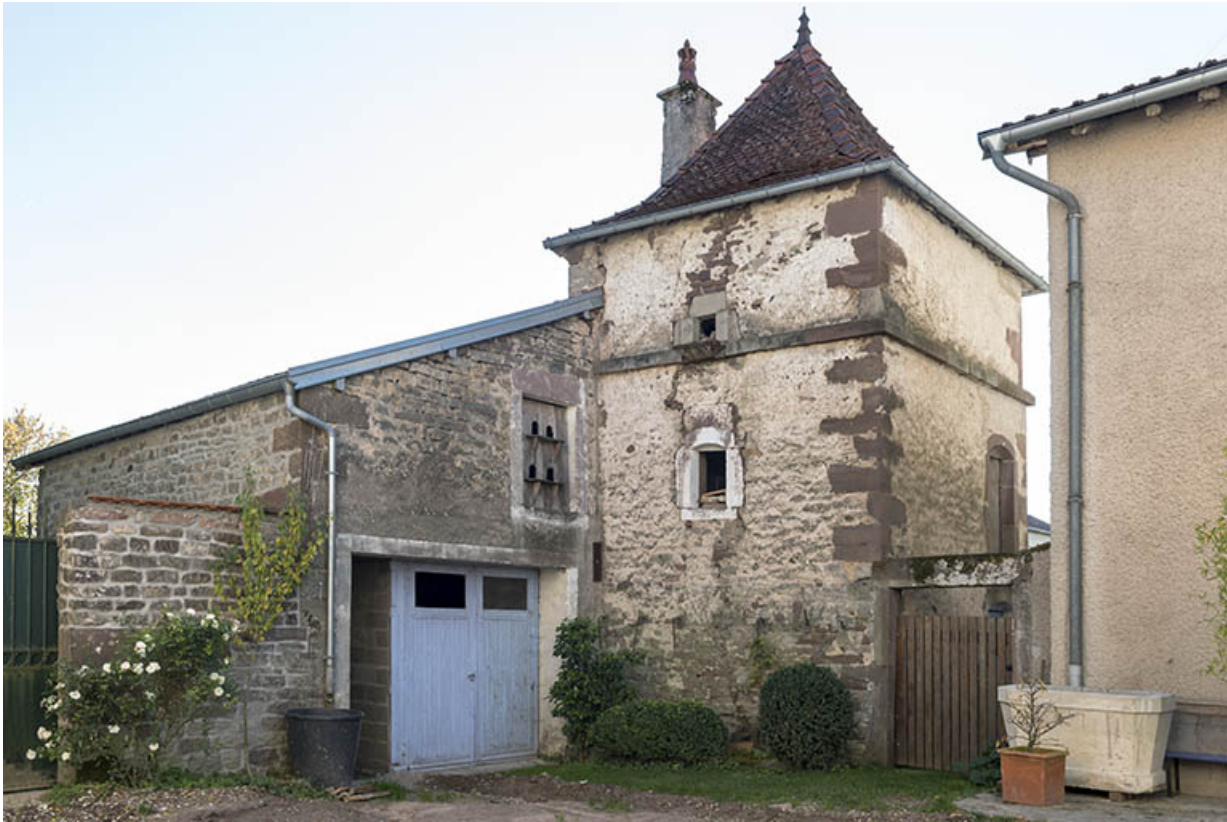
Pigeonnier proche de la ferme.