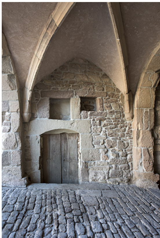
Détail des voûtes.