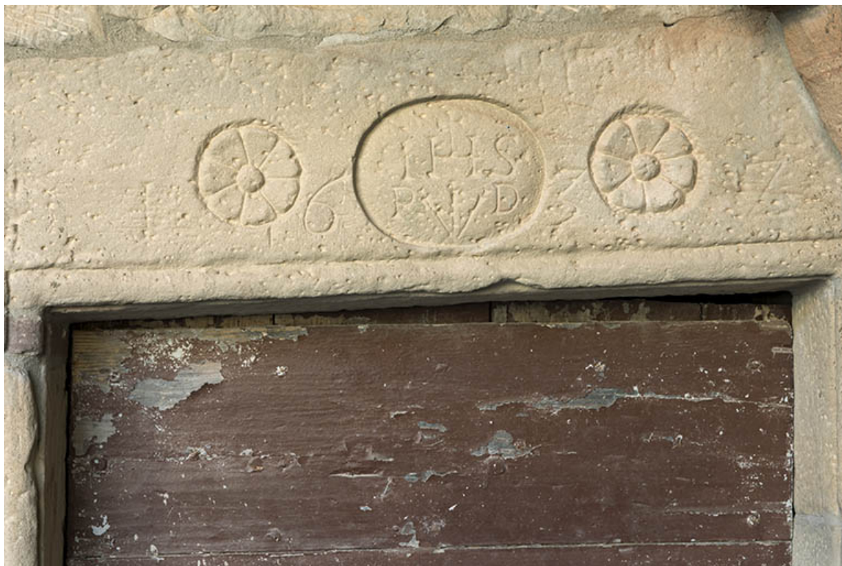
La date portée sur le linteau.