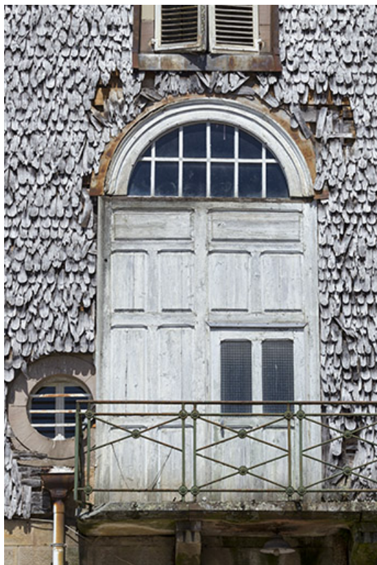
Détail de la porte sur la façade sud.