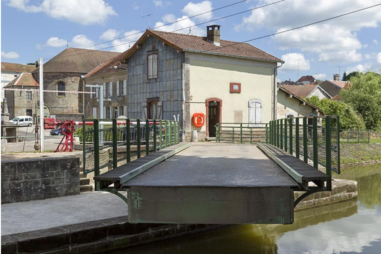
Pont en rotation.