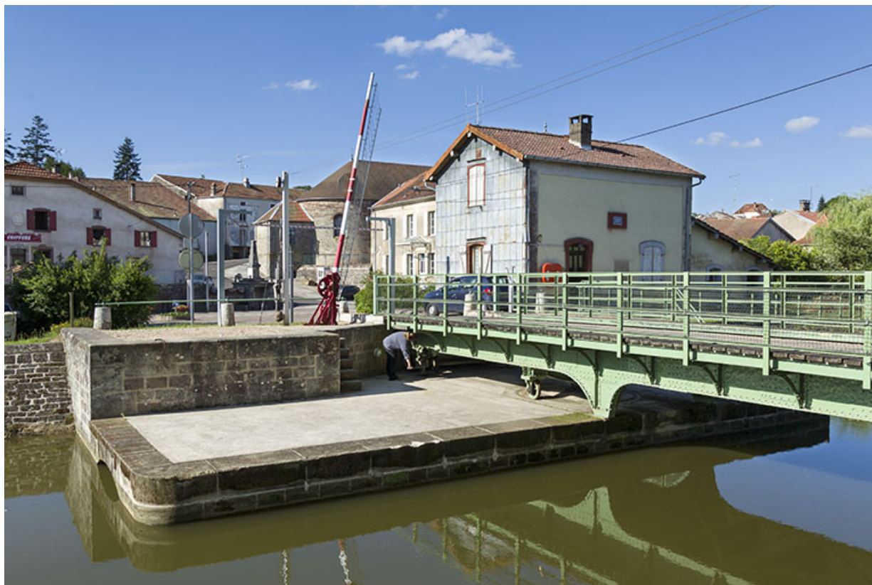
Le tablier métallique et sa plateforme depuis l'aval.