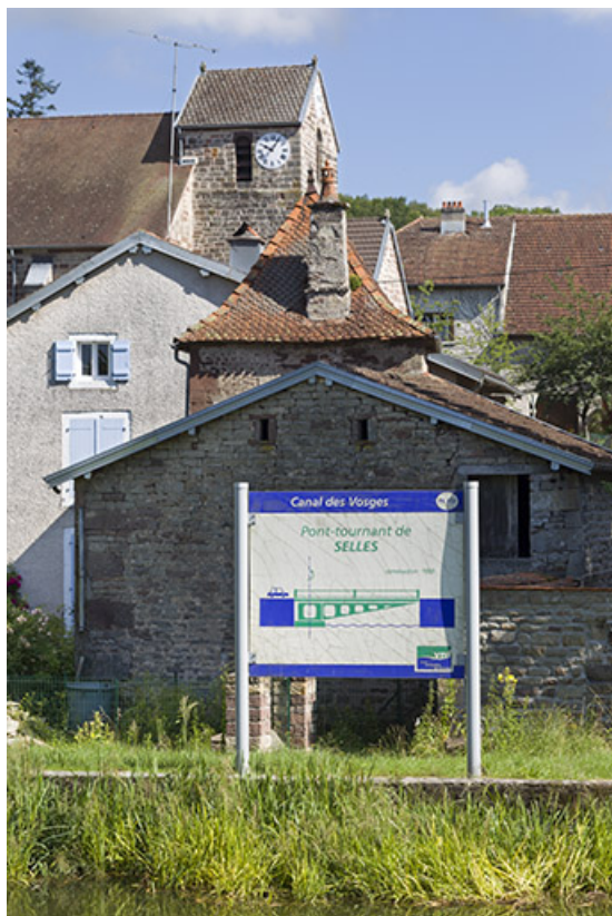
Plaque d'information indiquant la présence du pont tournant et l'église en arrière plan. 70, Selles rue de la Forge