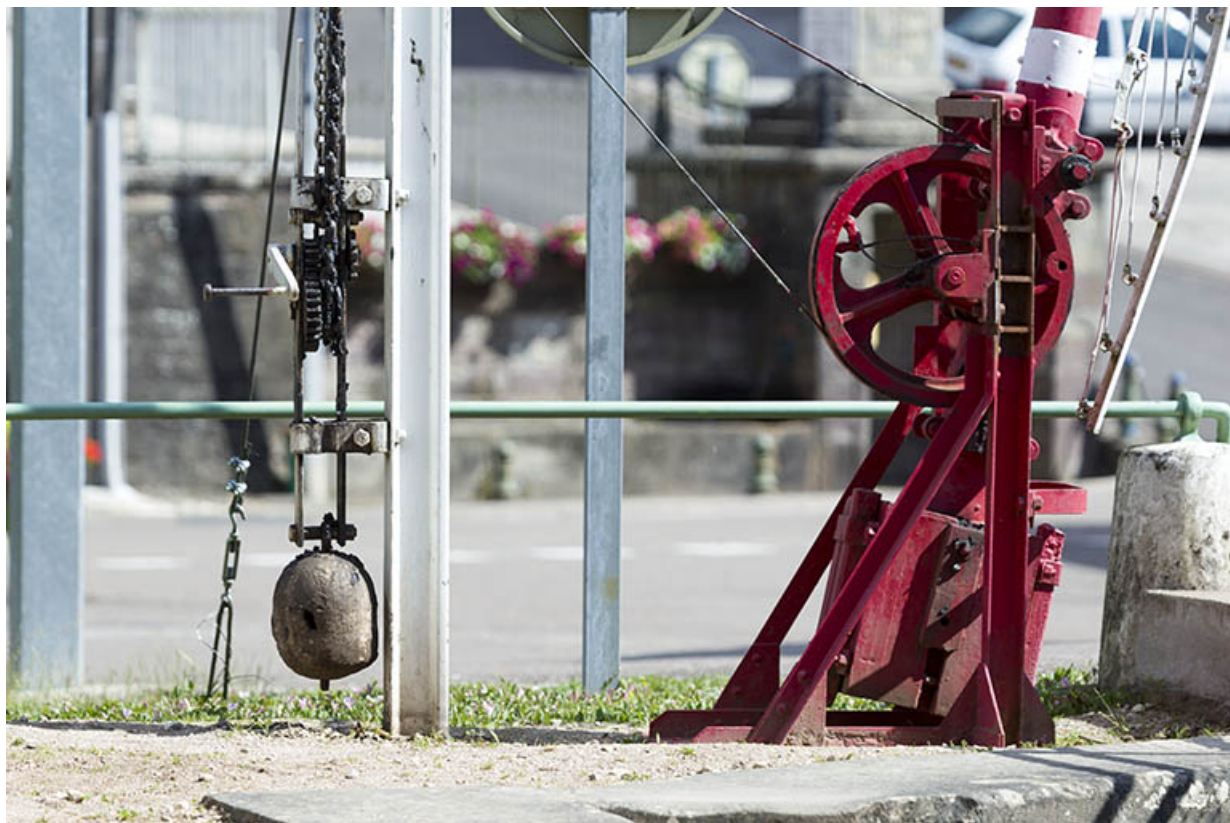
Détail du mécanisme de la barrière.