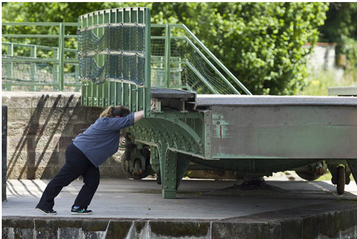
Rotation du pont par poussée manuelle.