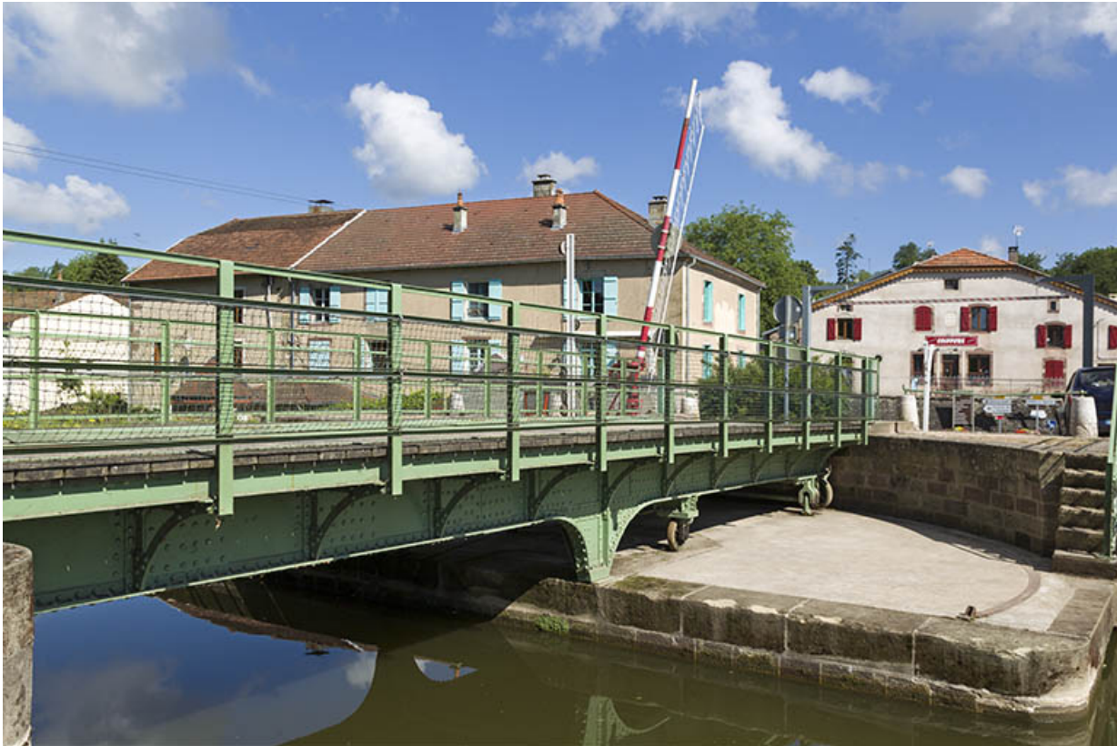
Le tablier métallique et sa plateforme.