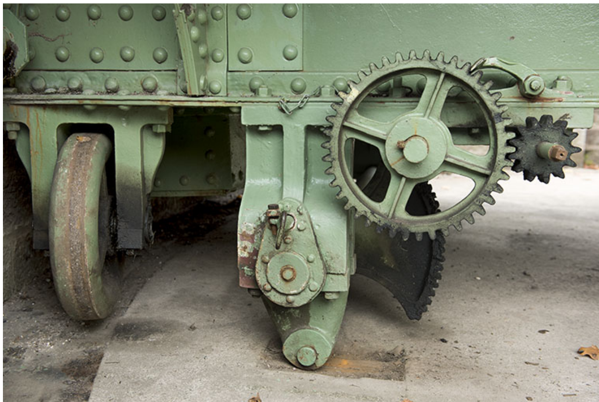
Détail du système de calage du pont.