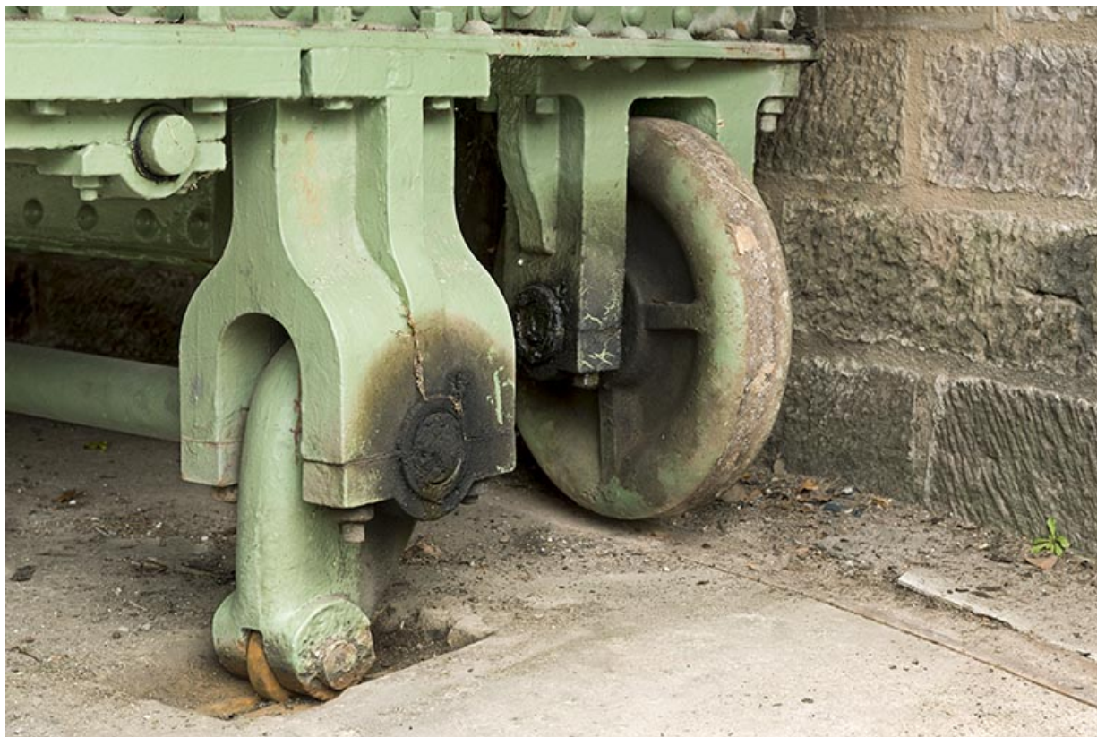
Système de calage baissé (côté amont).