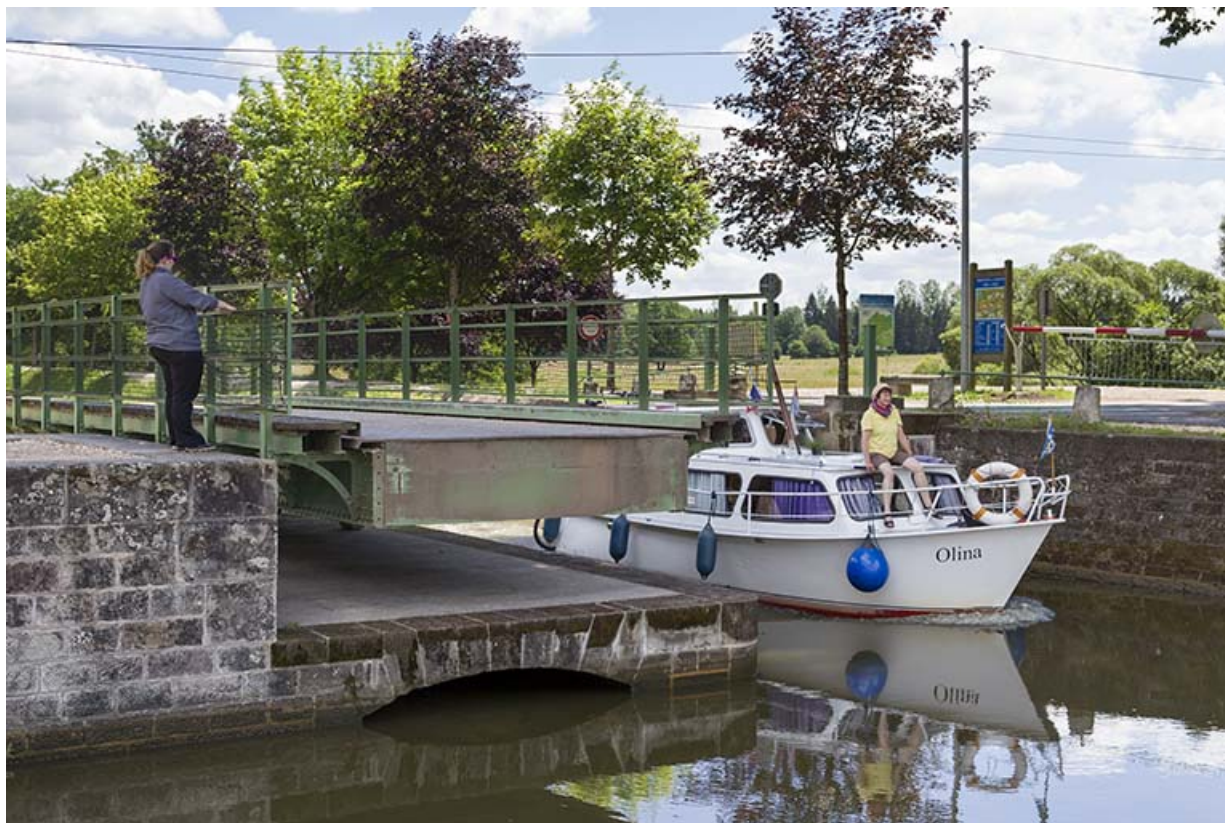
Passage d'un bateau de plaisance et maintien du tablier ouvert.