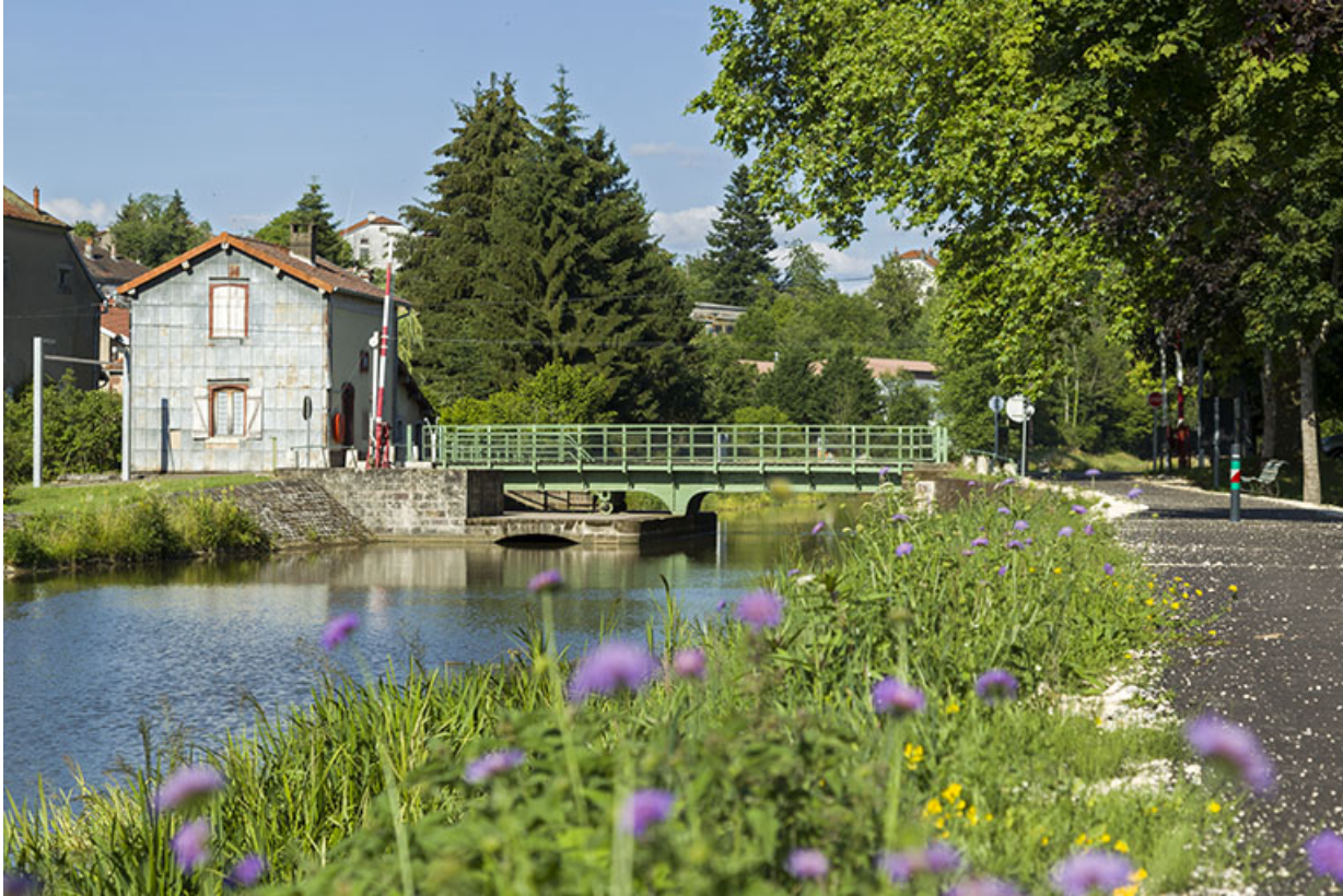
Le pont tournant depuis l'aval.