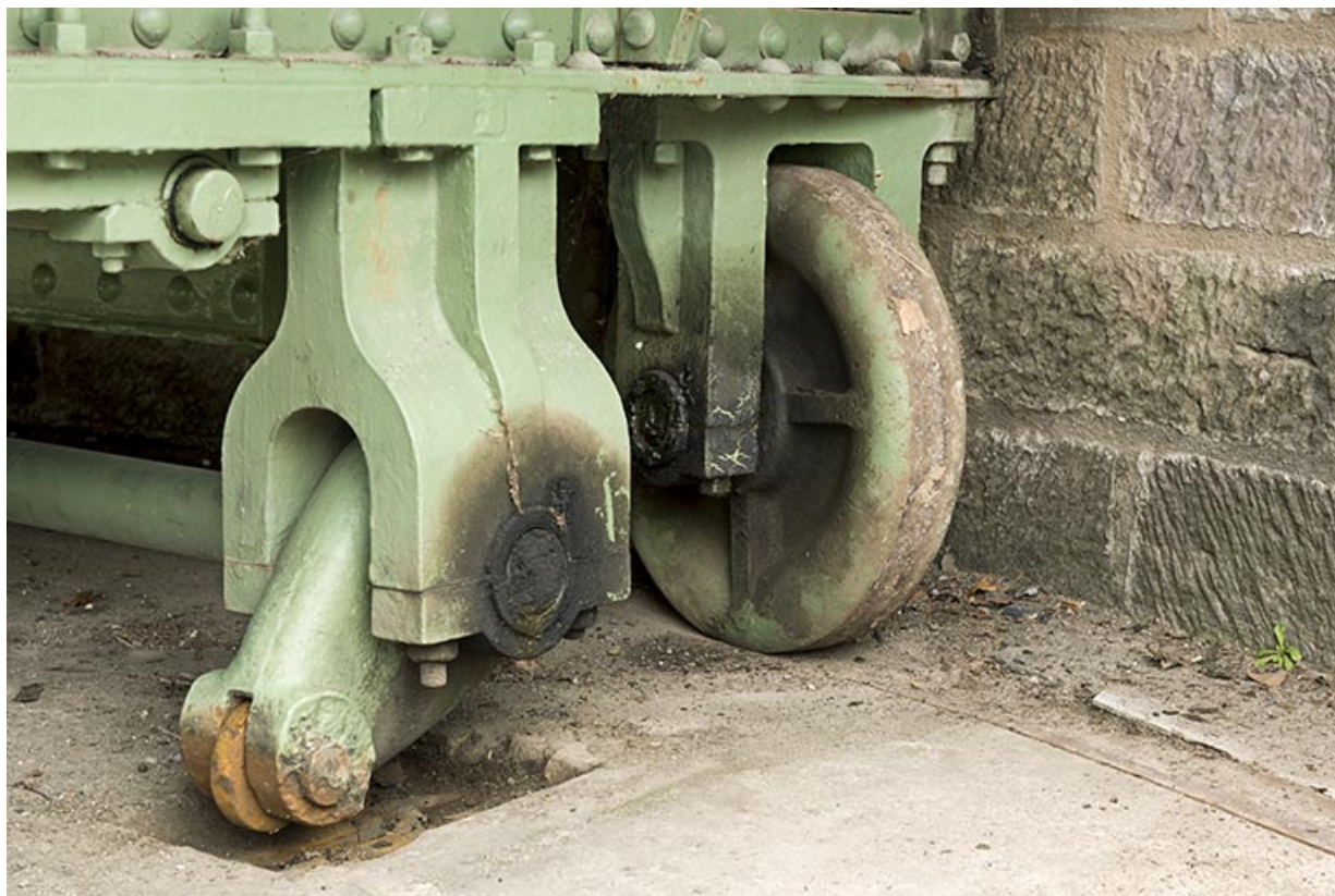
Système de calage levé (côté amont).