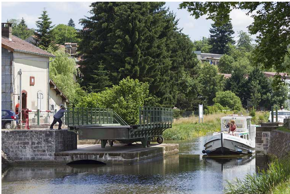
Passage d'un bateau de plaisance.