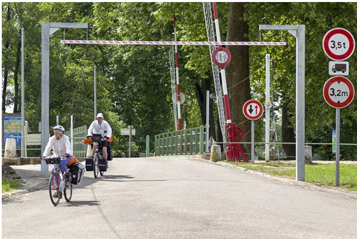
Cyclistes franchissant le pont.