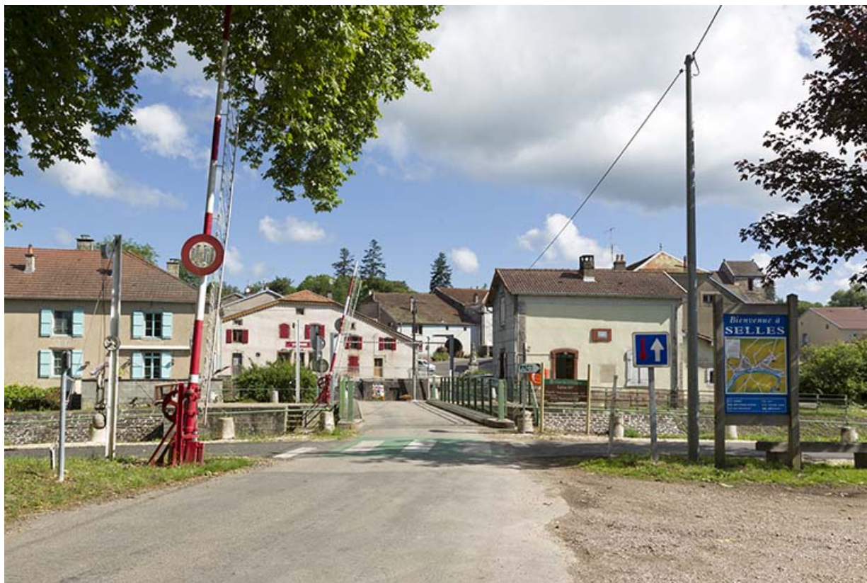
Entrée du village après le pont.