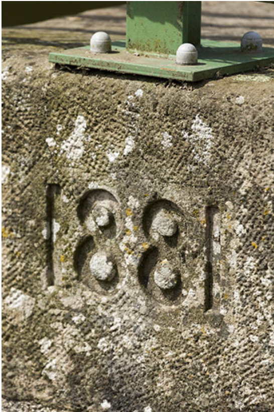
Date portée sur la construction du pont.