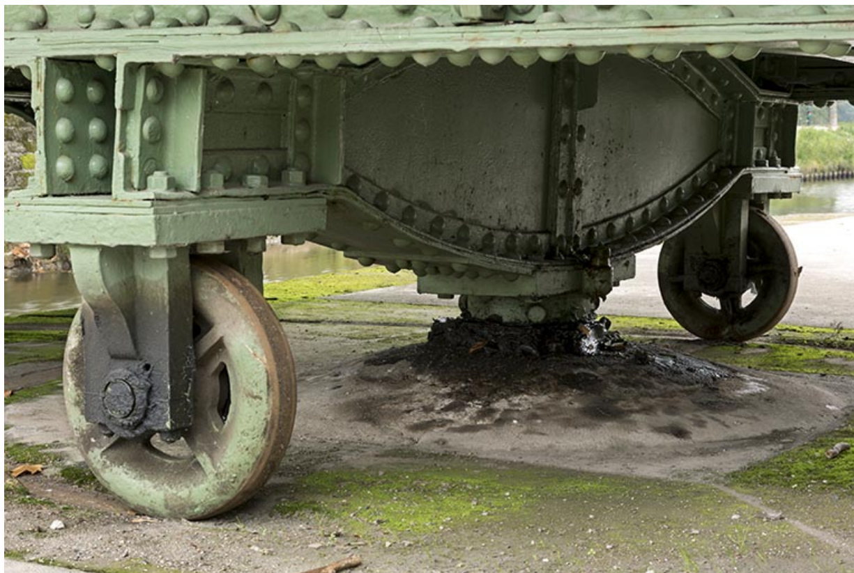
Détail du pivot sous le chevêtre.