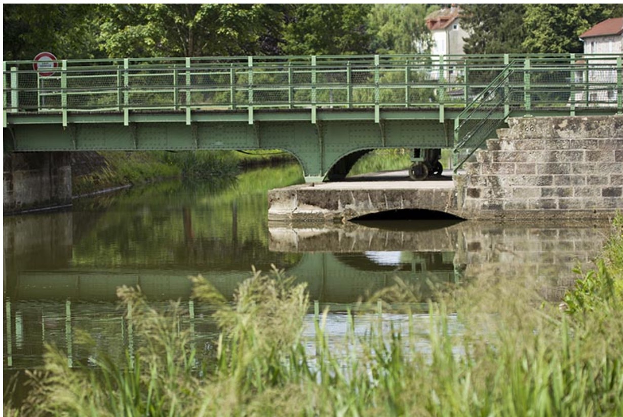
Vue sur la plateforme maçonnée (côté date portée). 70, Selles rue de la Forge