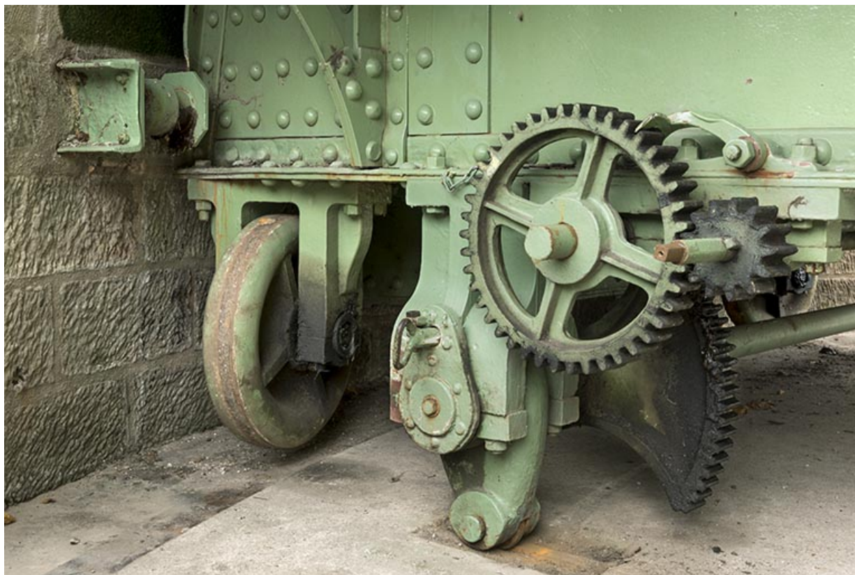
Détail du système de levage.