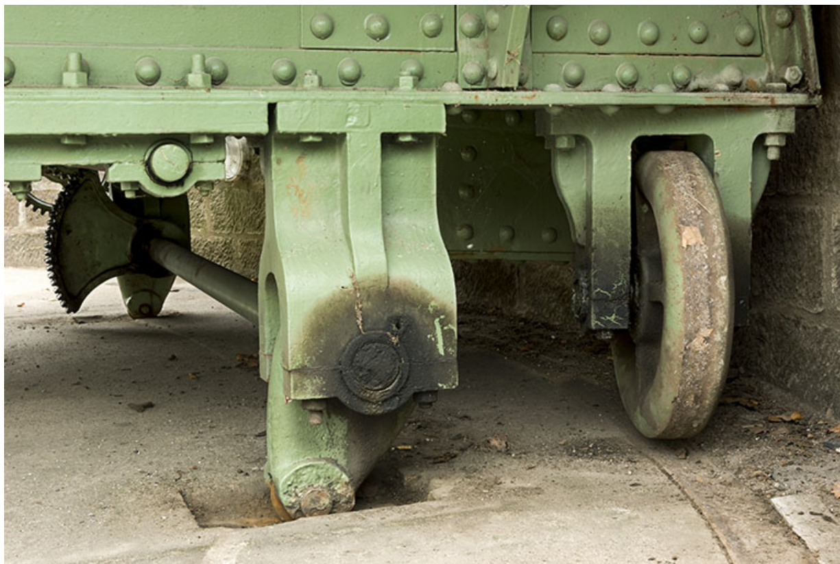
Système de calage, axe et engrenages.