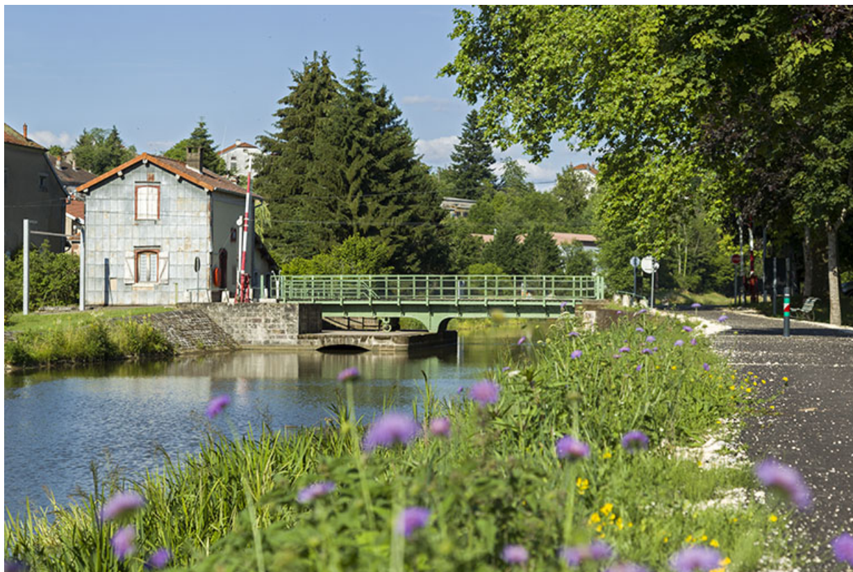
Le pont tournant depuis l'aval.