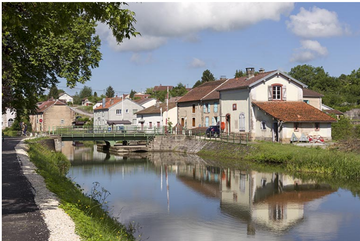
Vue d'ensemble depuis l'amont.