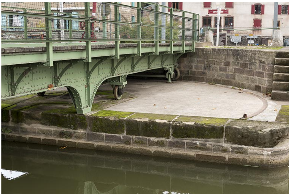
Détail de la plateforme maçonnée.