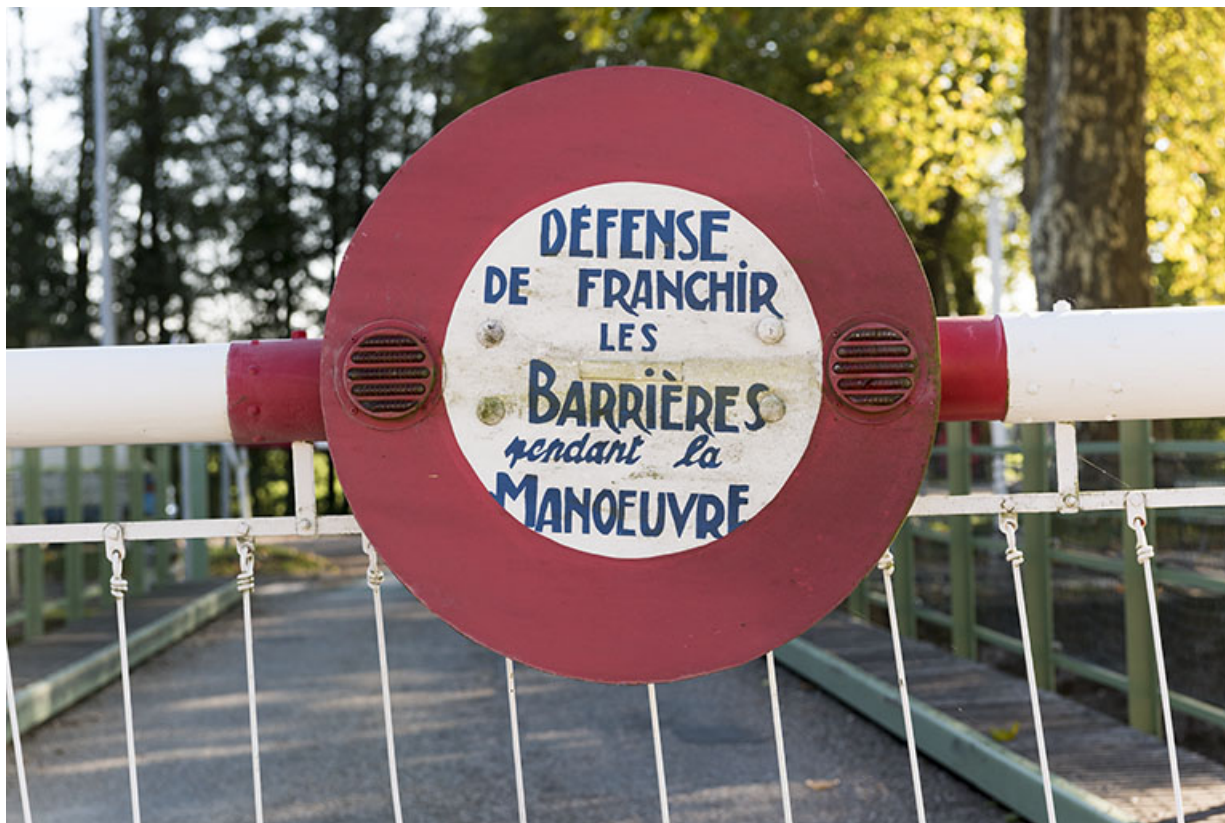
Panneau de signalisation de la barrière.