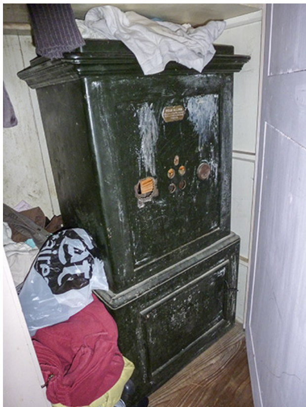
Vue générale du coffre-fort.