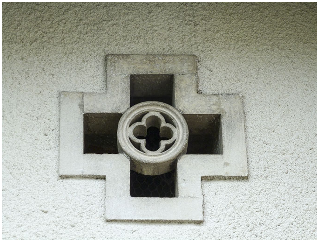
Remise : baie cruciforme de l'étage de comble.