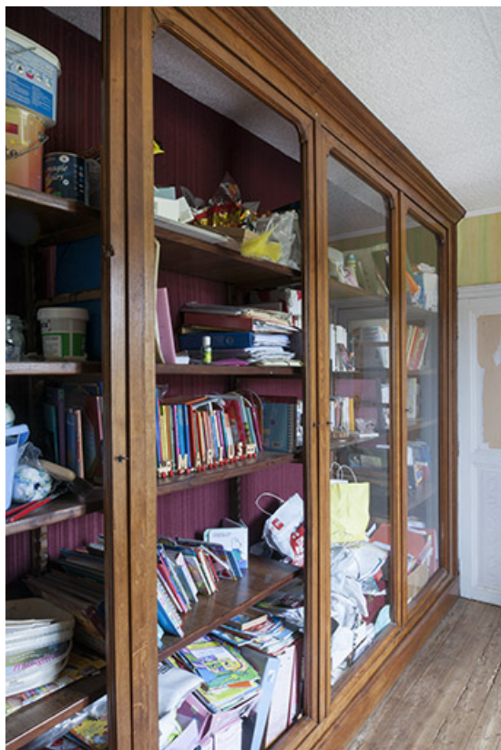
Meuble d'exposition situé à l'étage et servant à présenter des oiseaux empaillés. 70, Faverney, 1 rue Molière