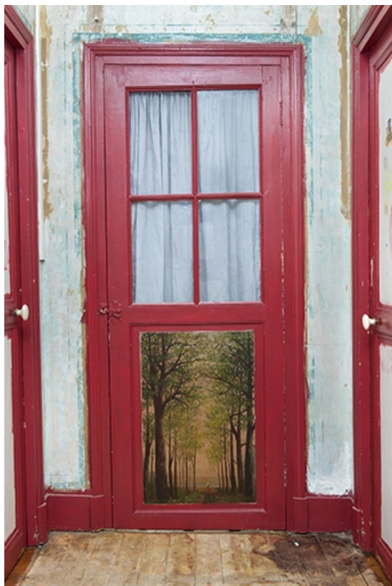
Porte conduisant à une des chambres de l'étage.