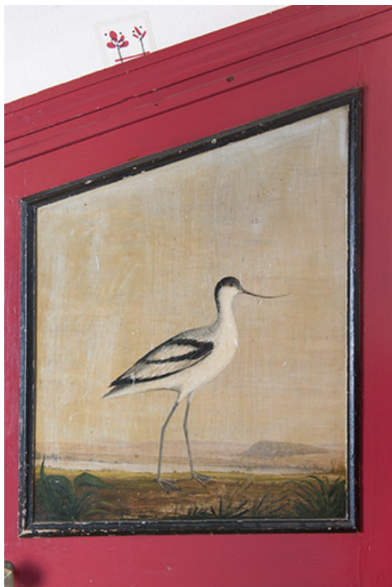
Panneau supérieur du placard situé près de l'escalier menant à l'étage, représentation de courlis. 70, Faverney, 1 rue Molière