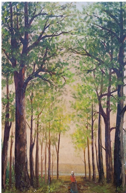
Détail : le panneau inférieur de la porte conduisant à une des chambres de l'étage. 70, Faverney, 1 rue Molière