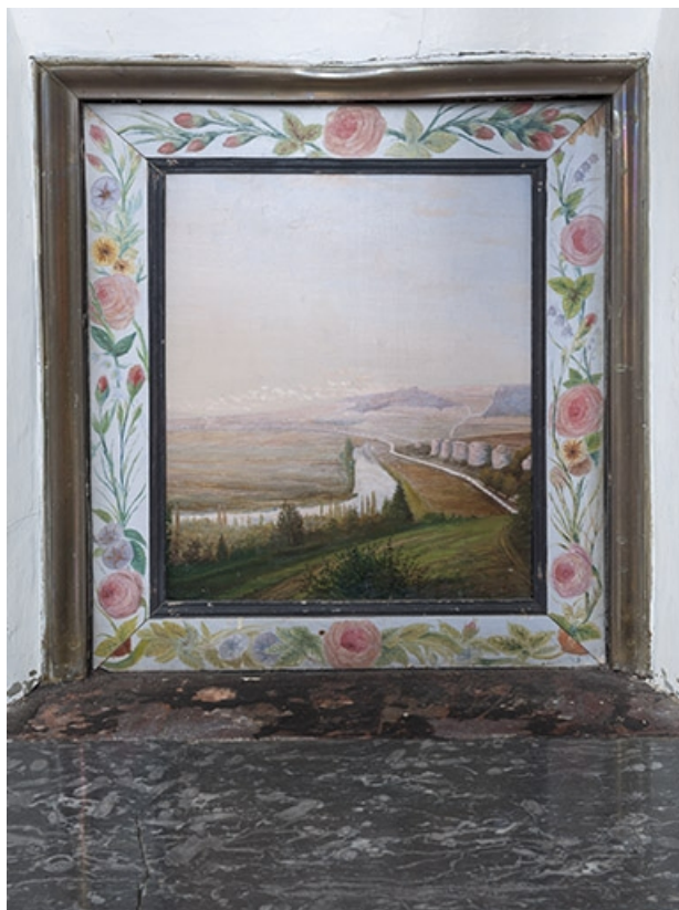
Détail de la cheminée : panneau peint.