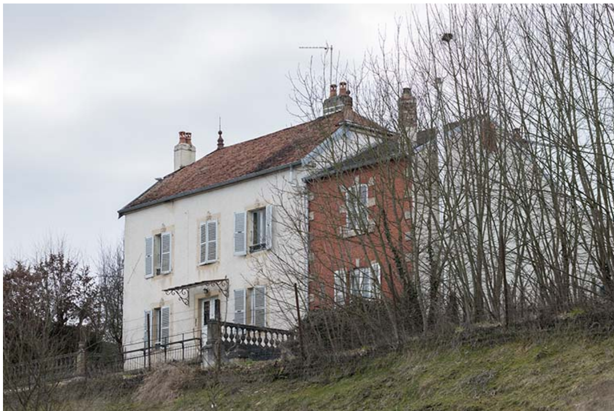
Vue générale de trois quart droite depuis la rue Molière.