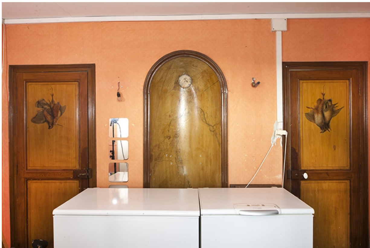
Salle à manger : mur séparant la salle à manger de la cuisine.