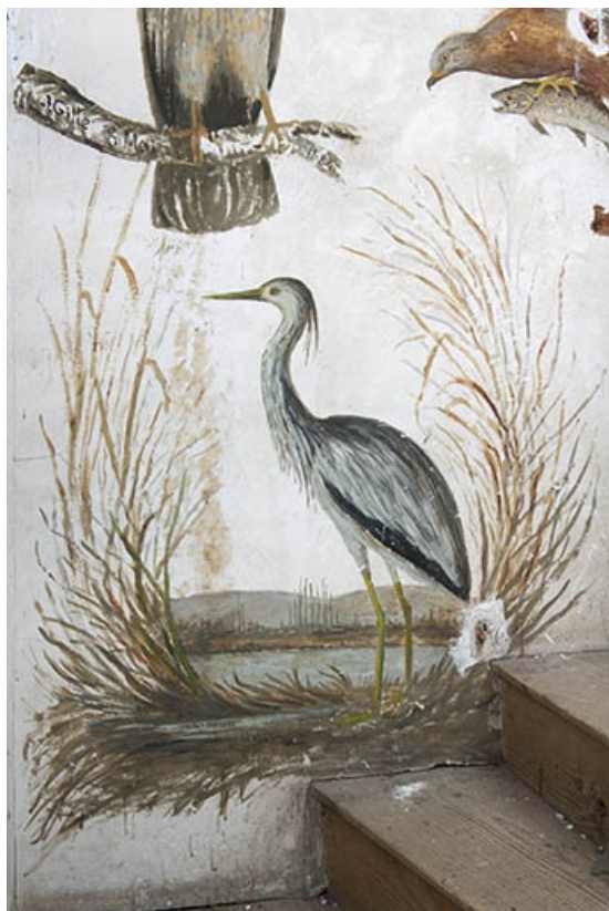
Détail des représentations d'oiseaux exécutées dans la cage de l'escalier menant au grenier : héron. 70, Faverney, 1 rue Molière