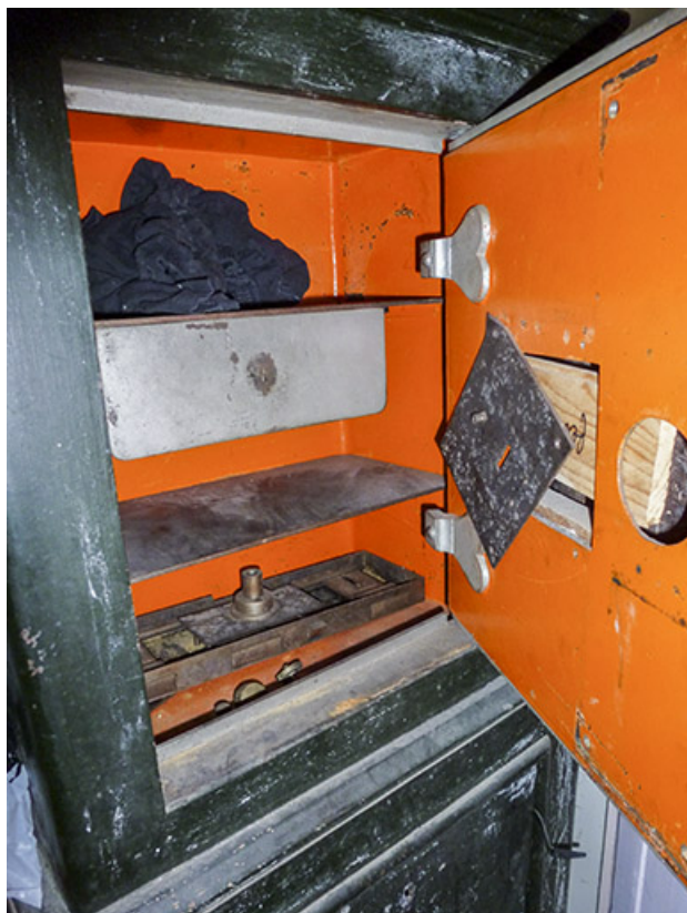
Vue générale du coffre-fort, porte ouverte.