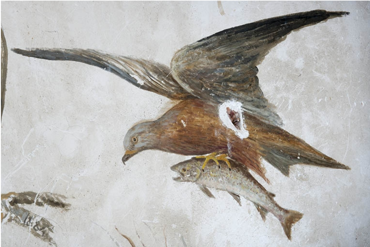
Détail des représentations d'oiseaux exécutées dans la cage de l'escalier menant au grenier : milan noir apportant un poisson. 70, Faverney, 1 rue Molière