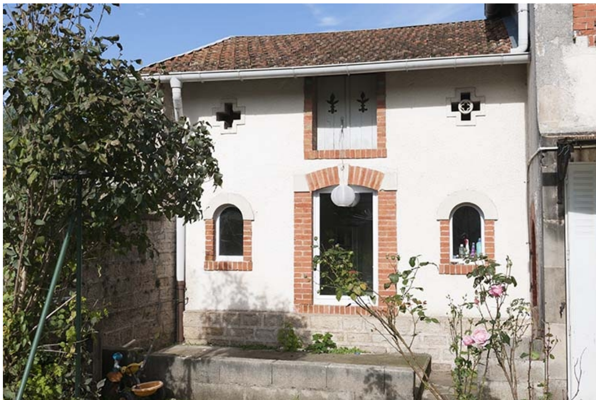
Façade antérieure de la remise.