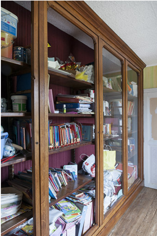
Meuble d'exposition situé à l'étage et servant à présenter des oiseaux empaillés. 70, Faverney, 1 rue Molière