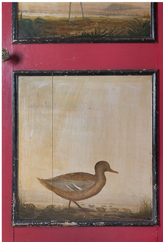
Panneau inférieur du placard situé près de l'escalier menant à l'étage, représentation d'oiseau. 70, Faverney, 1 rue Molière