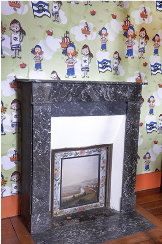
Vue générale de la cheminée d'une des chambres situées à l'étage. 70, Faverney, 1 rue Molière