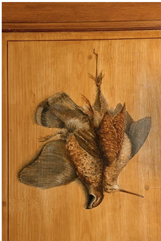
Détail de la nature morte ornant une des portes de la salle à manger 70, Faverney, 1 rue Molière