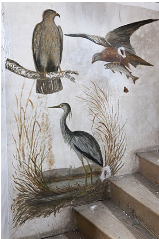
Vue générale des peintures exécutées dans la cage de l'escalier menant au grenier. 70, Faverney, 1 rue Molière