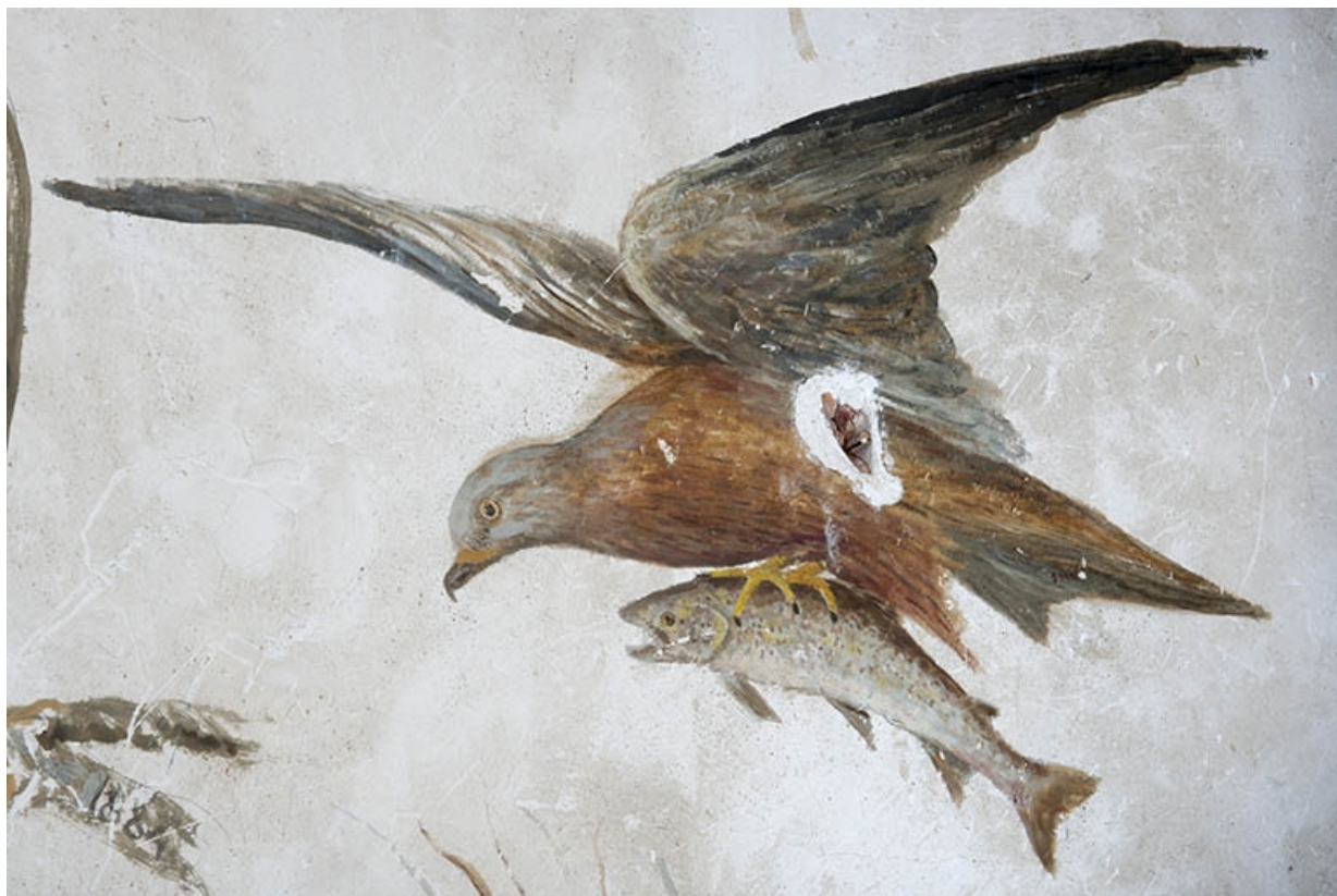
Détail des représentations d'oiseaux exécutées dans la cage de l'escalier menant au grenier : milan noir apportant un poisson. 70, Faverney, 1 rue Molière