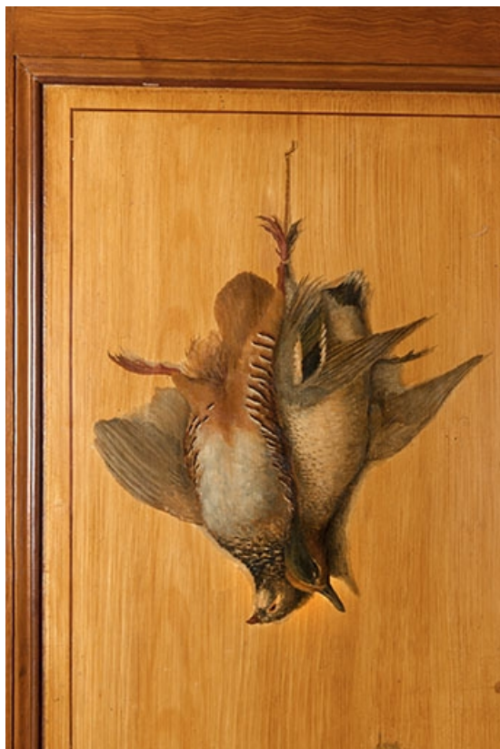
Salle à manger : nature morte ornant la porte conduisant à la cuisine. 70, Faverney, 1 rue Molière