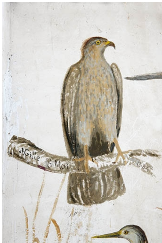
Détail des représentations d'oiseaux exécutées dans la cage de l'escalier menant au grenier : buse variable. 70, Faverney, 1 rue Molière