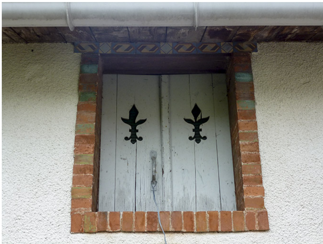
Remise : baie de l'étage de comble.