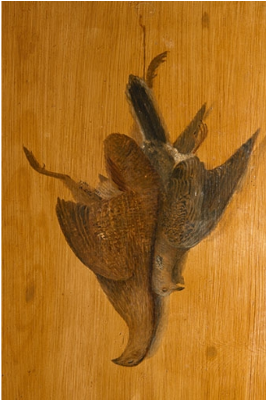
Salle à manger : nature morte ornant la 3e porte.