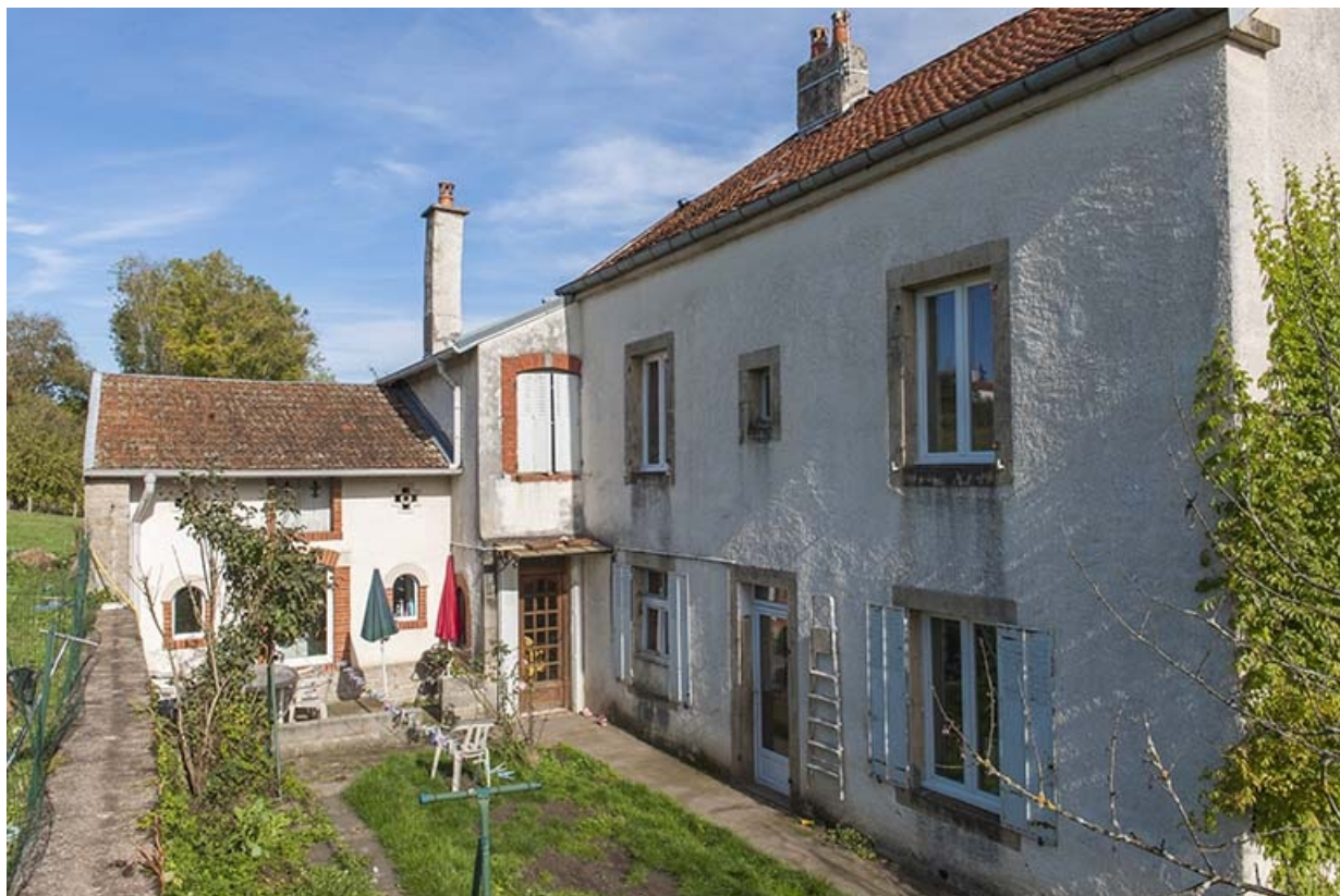
Façade postérieure et remise.