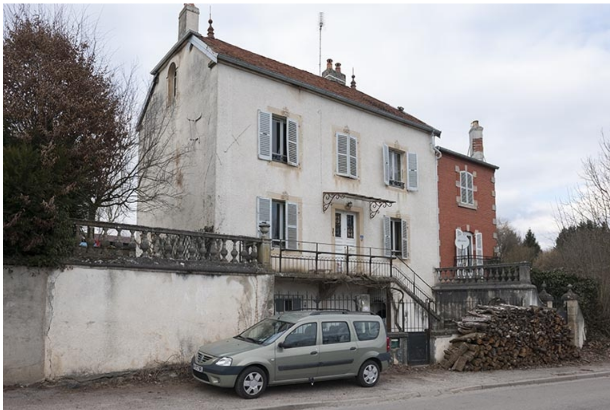
Vue de trois quart gauche depuis la rue Molière.