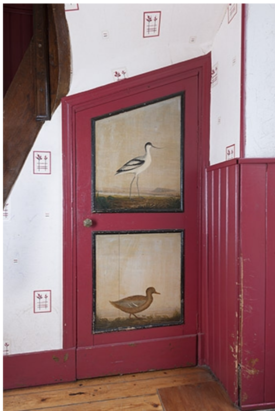
Porte ornée de peintures du placard situé près de l'escalier menant à l'étage. 70, Faverney, 1 rue Molière