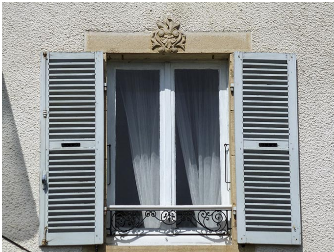
Détail d'une fenêtre du premier étage, au linteau décoré.