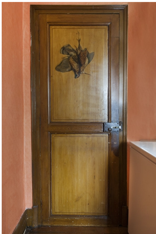
Salle à manger : porte de placard ornée d'une nature morte. 70, Faverney, 1 rue Molière