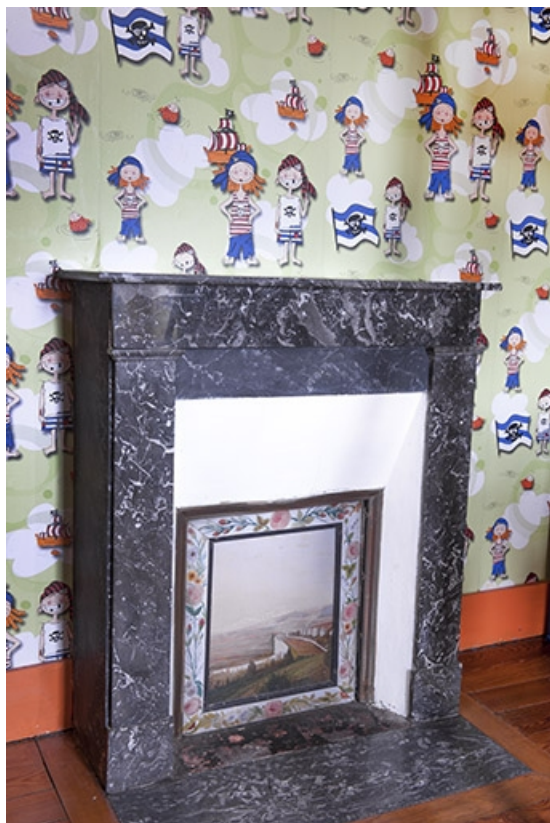
Vue générale de la cheminée d'une des chambres situées à l'étage. 70, Faverney, 1 rue Molière