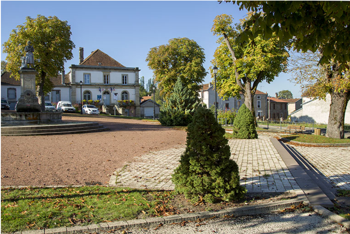
La place publique.