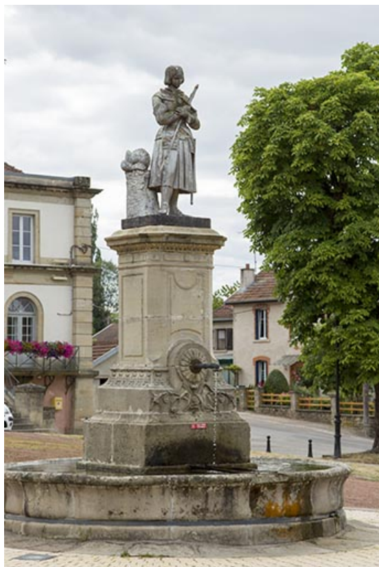
La fontaine Jeanne d'Arc.