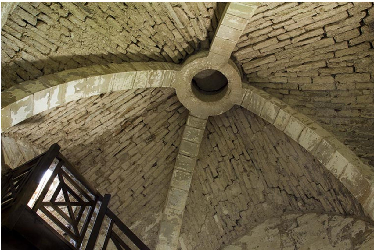
Le plafond voûté du rez-de-chaussée du donjon.

70, Passavant-la-Rochère, 1 rue du Château