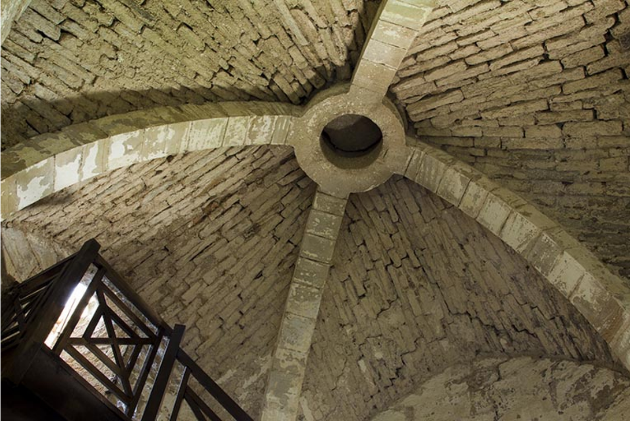
Le plafond voûté du rez-de-chaussée du donjon.

70, Passavant-la-Rochère, 1 rue du Château