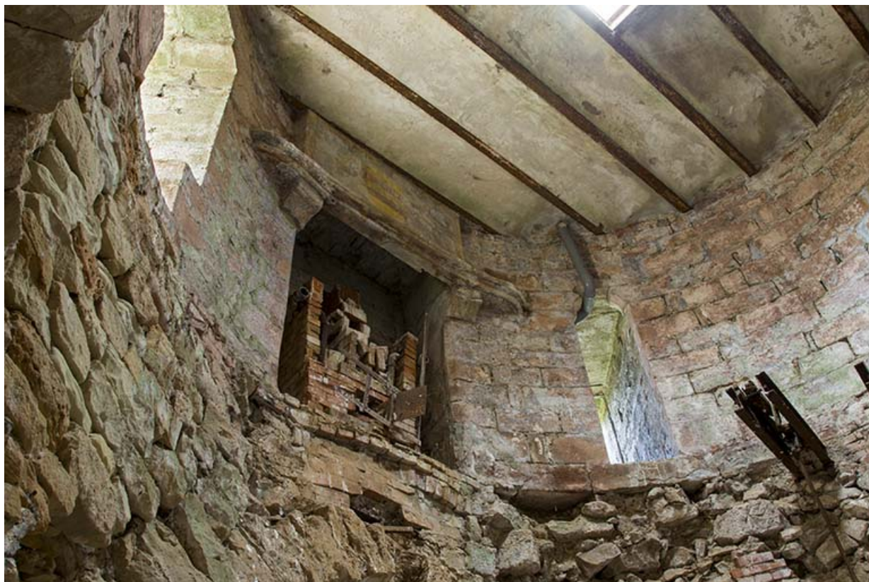
Vue sur la cheminée encore en place au second étage.

70, Passavant-la-Rochère, 1 rue du Château