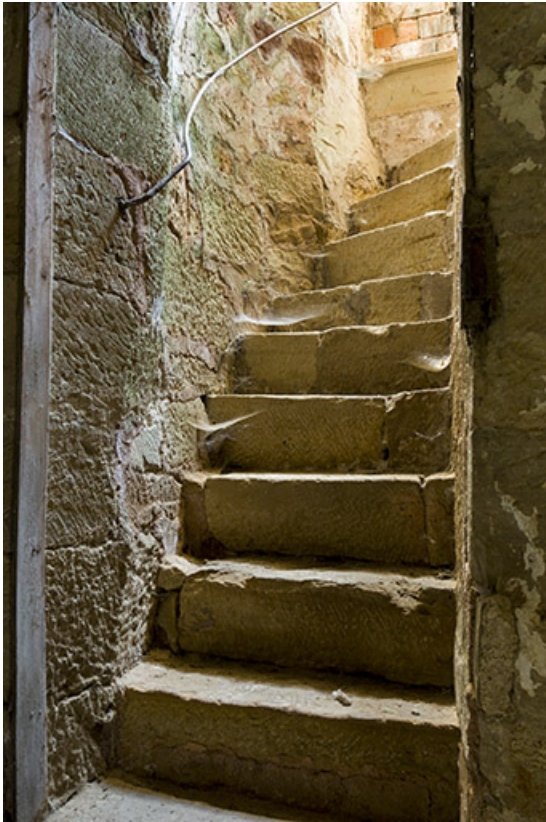
Escalier du donjon.

70, Passavant-la-Rochère, 1 rue du Château