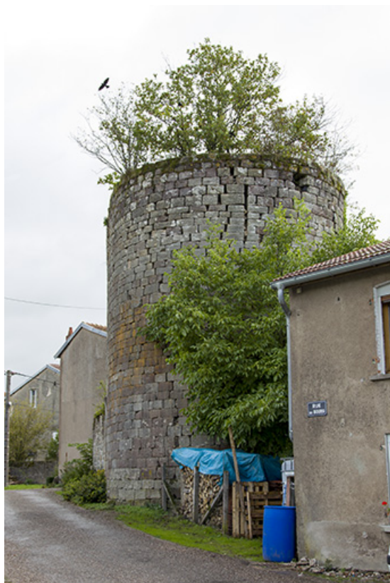
L'ancienne tour d'entrée de ville.