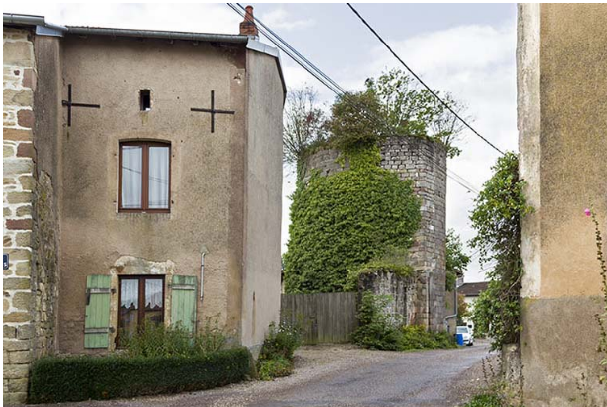
La tour dite Mathey, rue du Bourg. 70, Passavant-la-Rochère