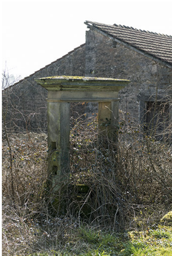
Ancien puits du bourg fortifié.