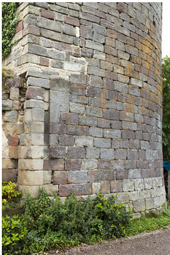
Détail d'une rainure verticale qui accueillait la herse permettant de fermer la porte. 70, Passavant-la-Rochère