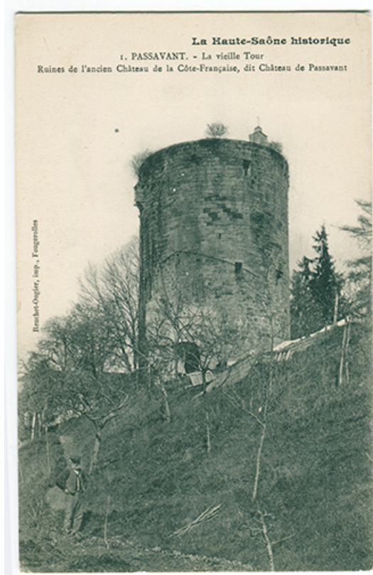
le donjon, carte postale. 70, Passavant-la-Rochère