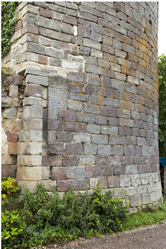
Détail d'une rainure verticale qui accueillait la herse permettant de fermer la porte. 70, Passavant-la-Rochère