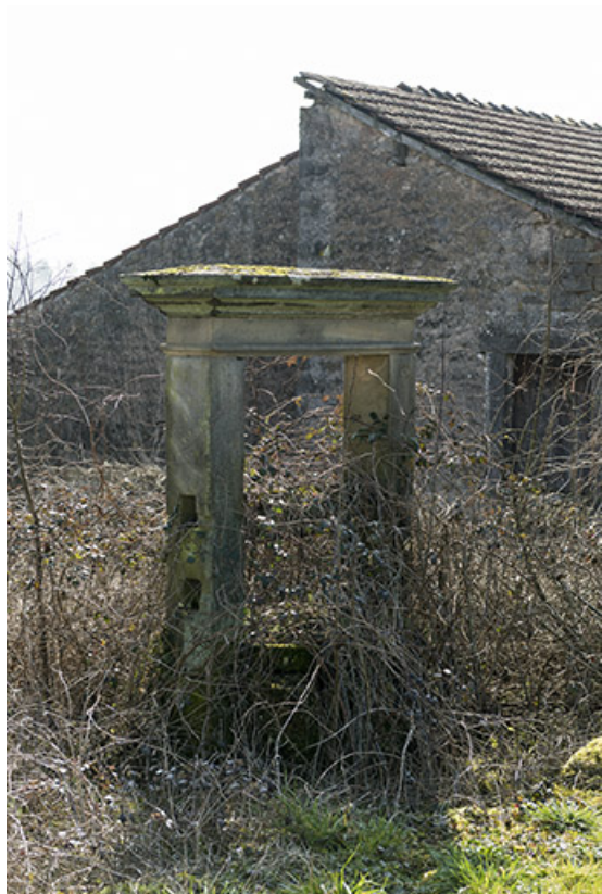
Ancien puits du bourg fortifié.