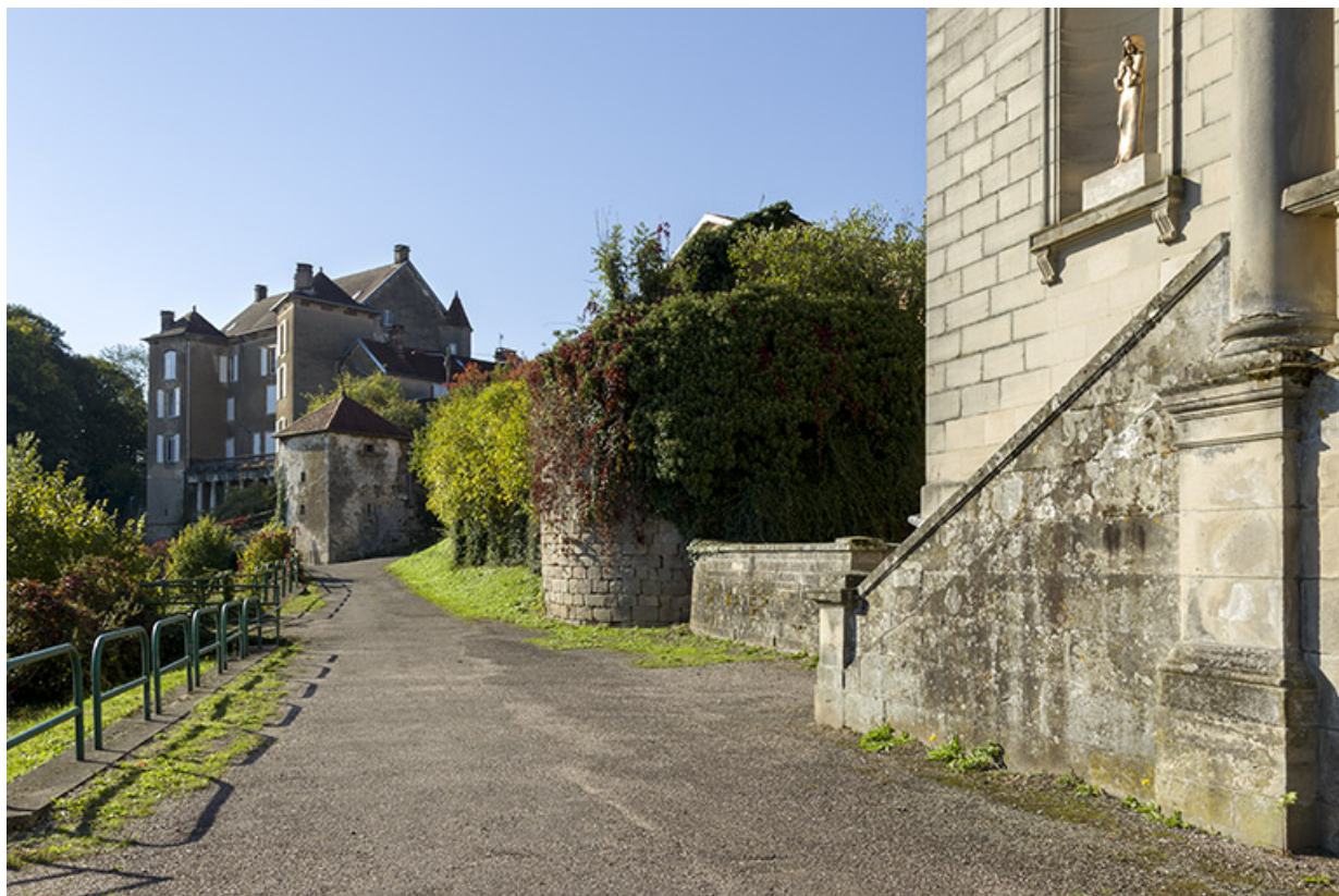
Ruines d'une tour près de l'église.