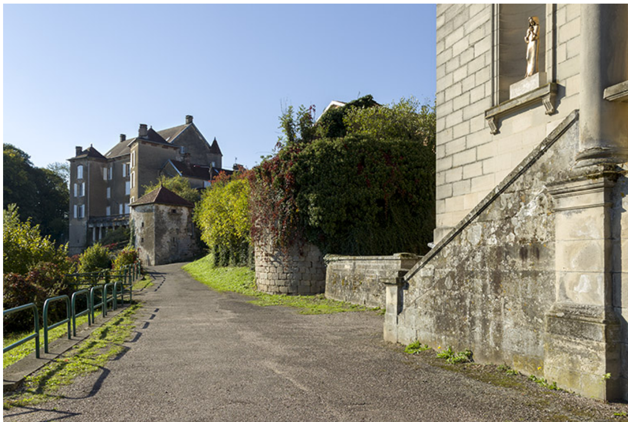
Ruines d'une tour près de l'église.