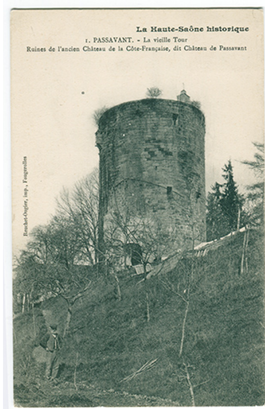
le donjon, carte postale. 70, Passavant-la-Rochère