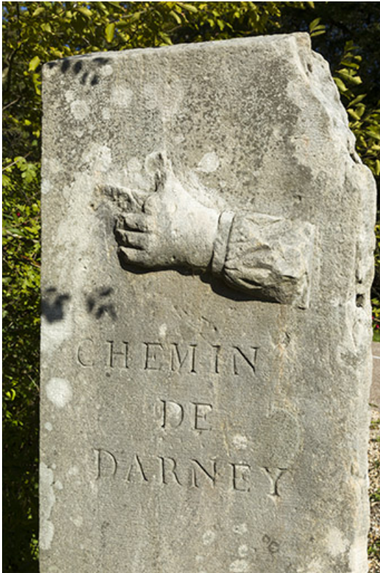
Ancienne borne directionnelle.

70, Passavant-la-Rochère, lieudit : la Rochère