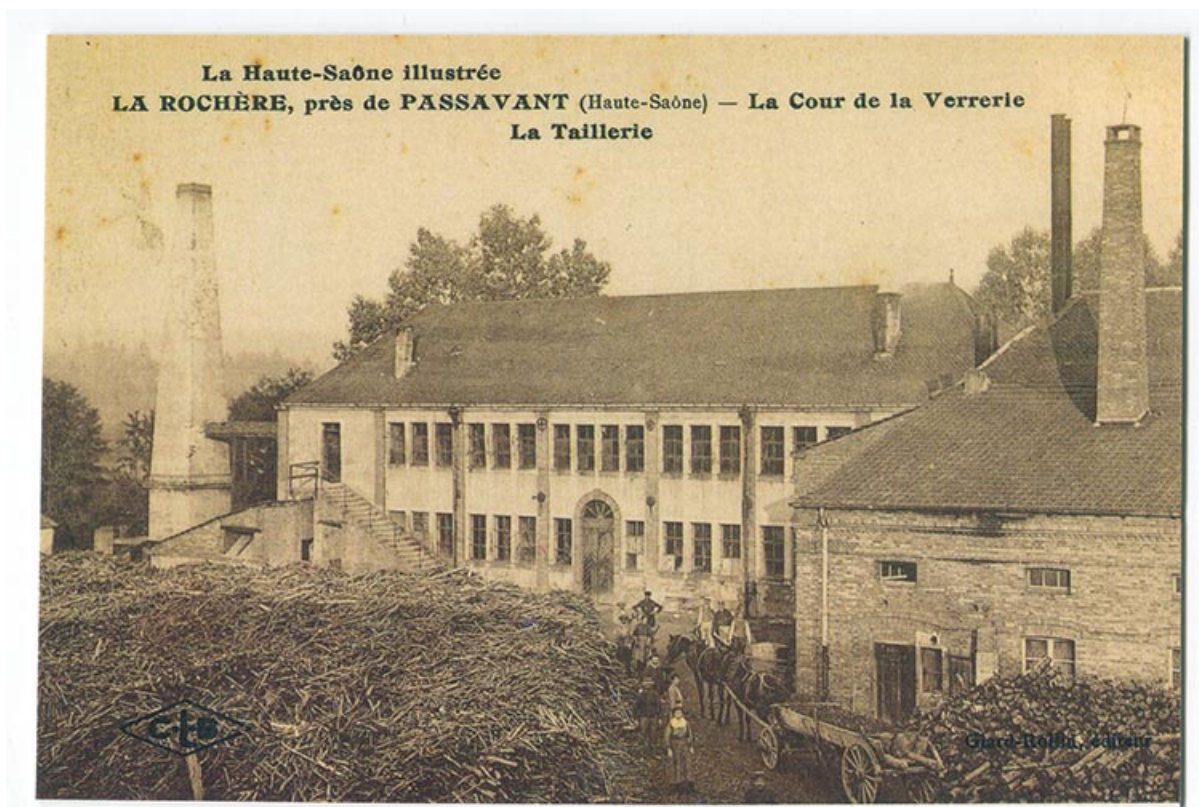
La verrerie de la Rochère, carte postale. 70, Passavant-la-Rochère