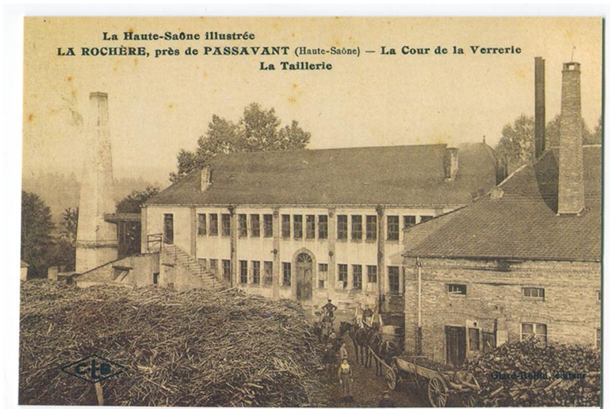
La verrerie de la Rochère, carte postale. 70, Passavant-la-Rochère