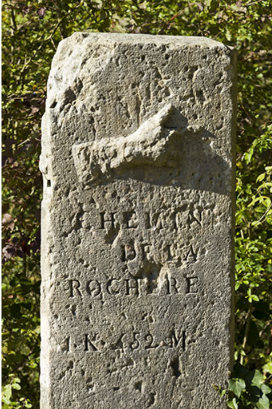
Ancienne borne indiquant la localité de la Rochère.

70, Passavant-la-Rochère, lieudit : la Rochère