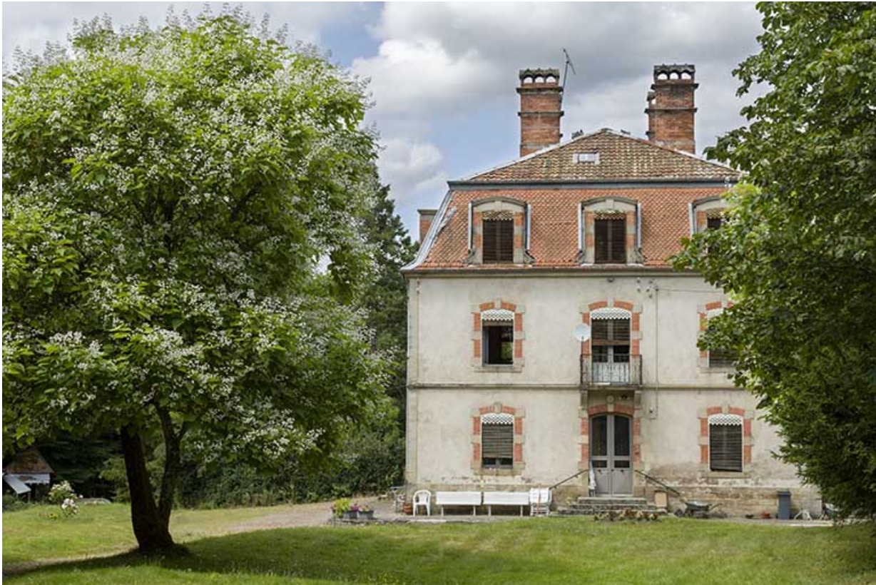
Le château Mercier, actuellement propriété Dumoulin.

70, Passavant-la-Rochère, lieudit : la Rochère