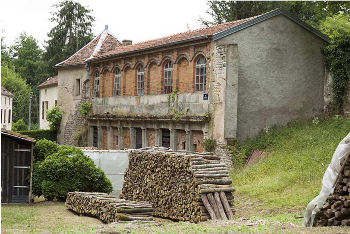
Bâtiment dépendant du moulin détruit au cours du 19e siècle.

70, Passavant-la-Rochère, lieudit : la Rochère