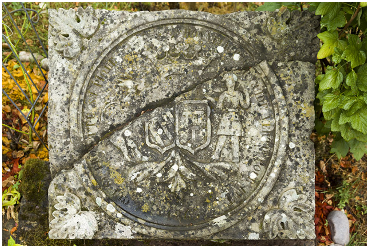
Clé de voûte de l'entrée de l'ancienne verrerie située au quartier des Ronds Champs.

70, Passavant-la-Rochère, lieudit : la Rochère