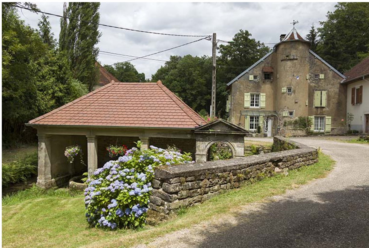
Fontaine-lavoir et la maison des Hennezel. 70, Passavant-la-Rochère, lieudit : la Rochère