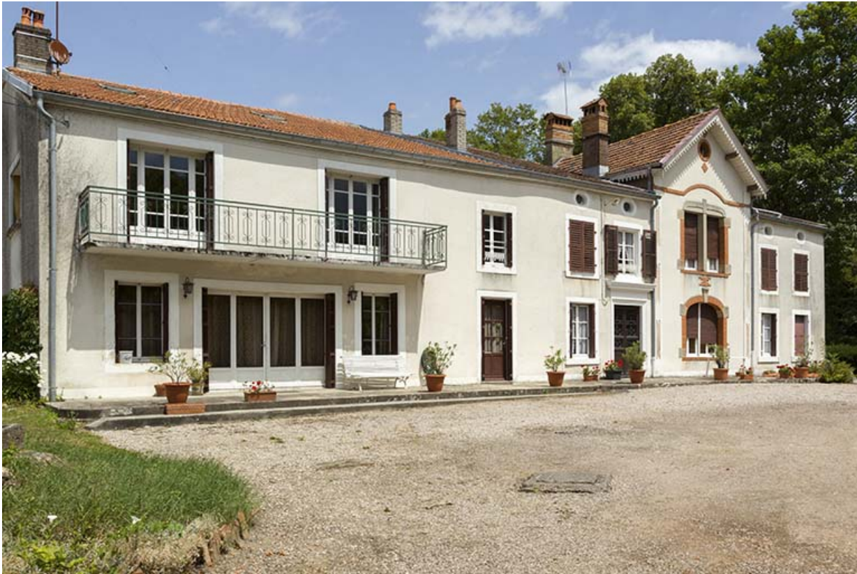
Maison "Boileau", ancien directeur de la verrerie.

70, Passavant-la-Rochère, lieudit : la Rochère