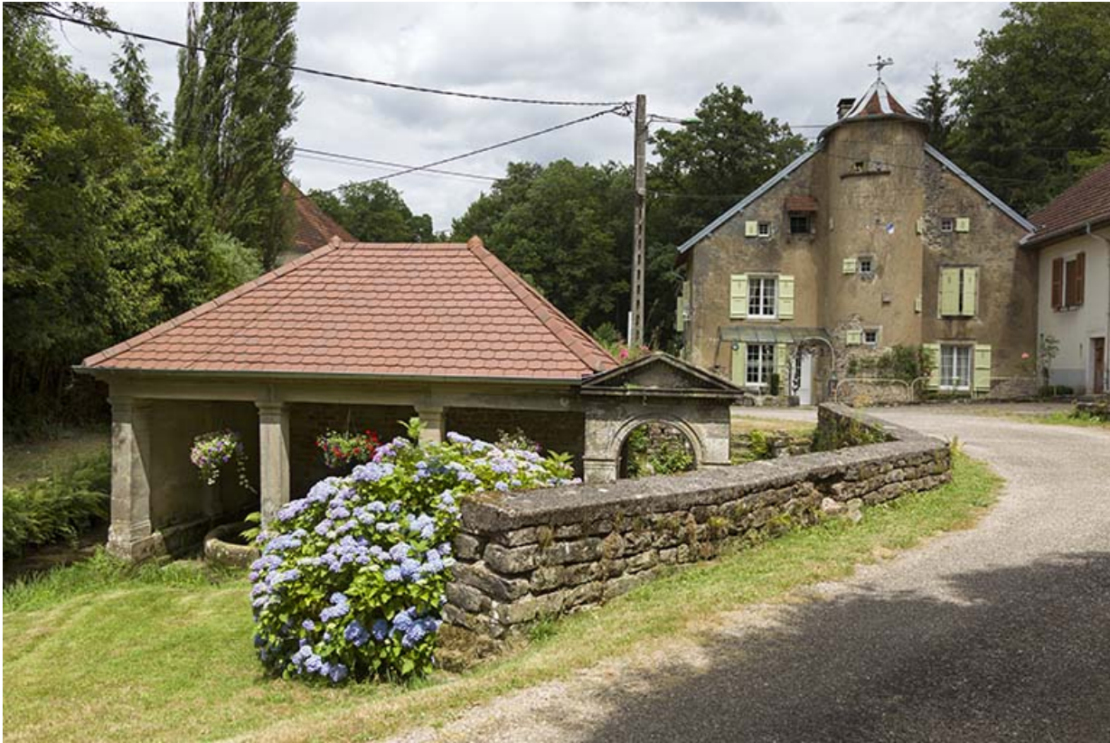
Fontaine-lavoir et la maison des Hennezel.

70, Passavant-la-Rochère, lieudit : la Rochère