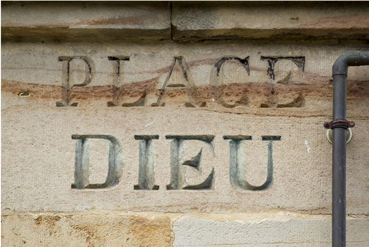
Inscription sur la façade antérieure de l'école.

70, Passavant-la-Rochère, lieudit : la Rochère