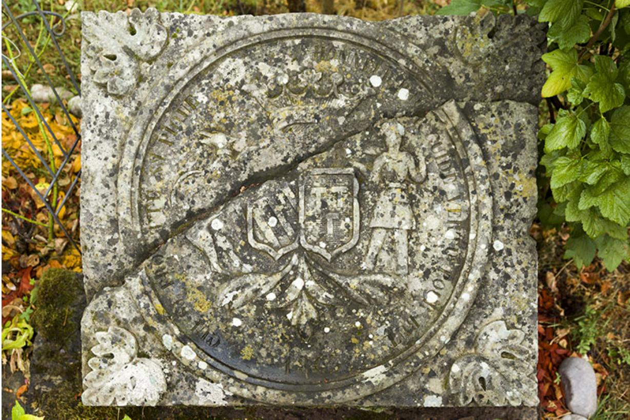
Clé de voûte de l'entrée de l'ancienne verrerie située au quartier des Ronds Champs.

70, Passavant-la-Rochère, lieudit : la Rochère