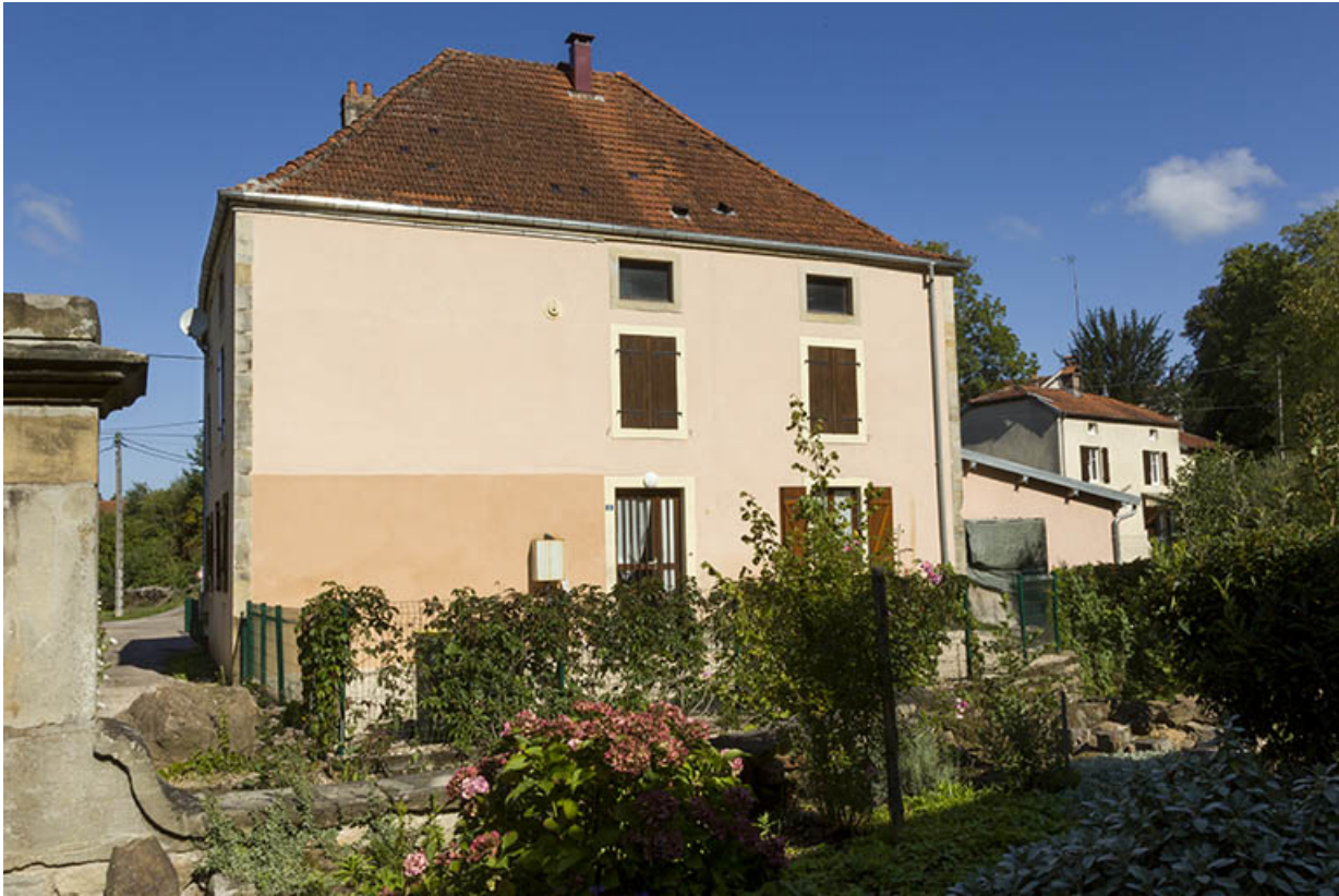
Maison, façade postérieure, rue du Moulin. 70, Passavant-la-Rochère, lieudit : la Rochère