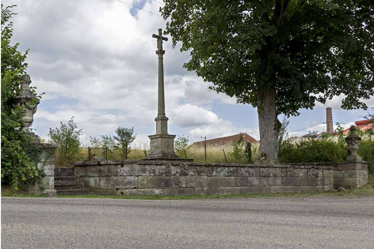
Calvaire situé au nord de la place Dieu.

70, Passavant-la-Rochère place Dieu, lieudit : la Rochère