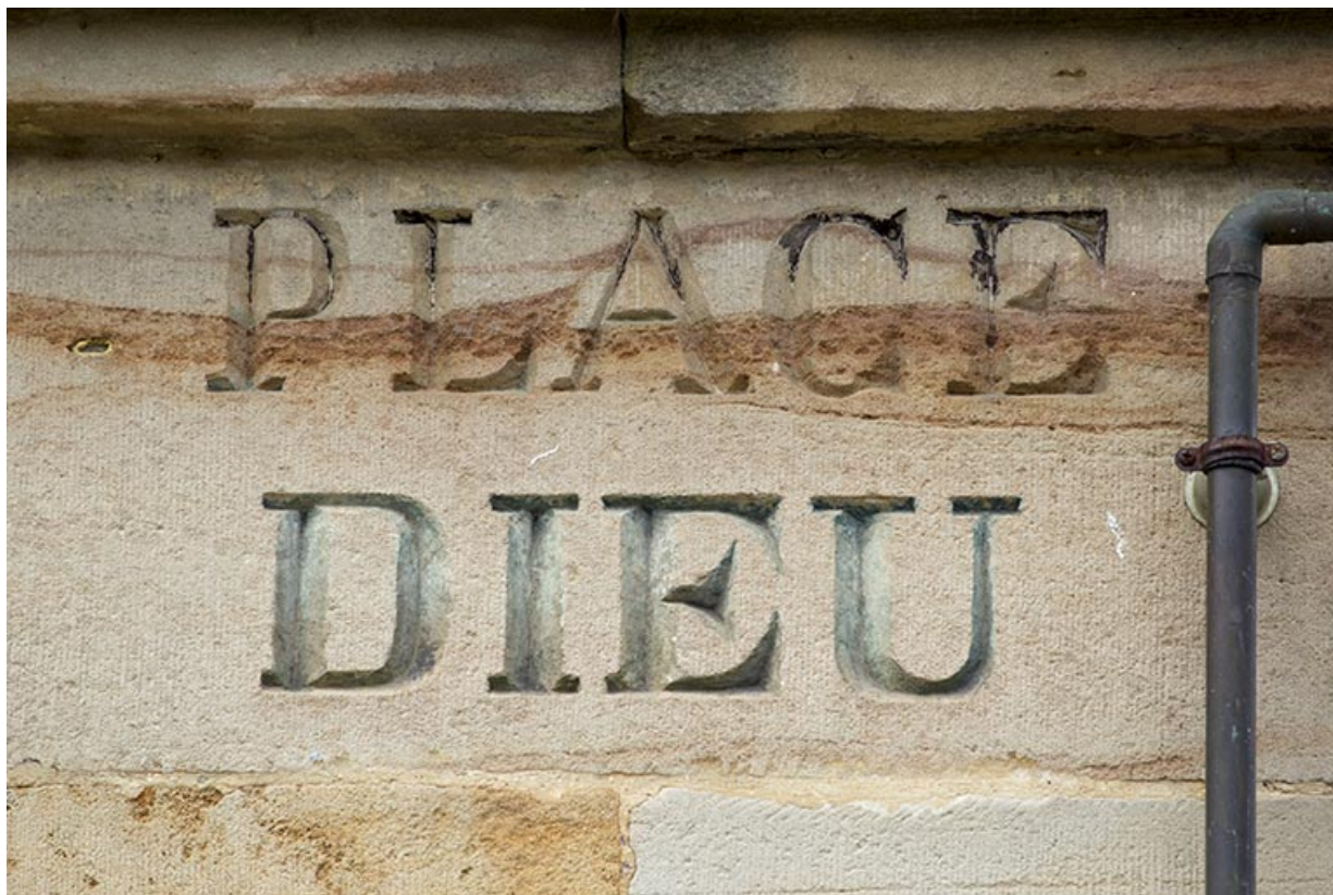
Inscription sur la façade antérieure de l'école.

70, Passavant-la-Rochère, lieudit : la Rochère