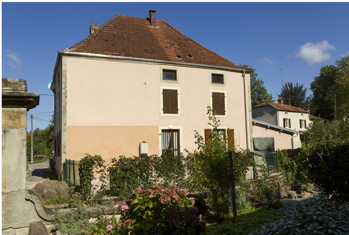
Maison, façade postérieure, rue du Moulin. 70, Passavant-la-Rochère, lieudit : la Rochère