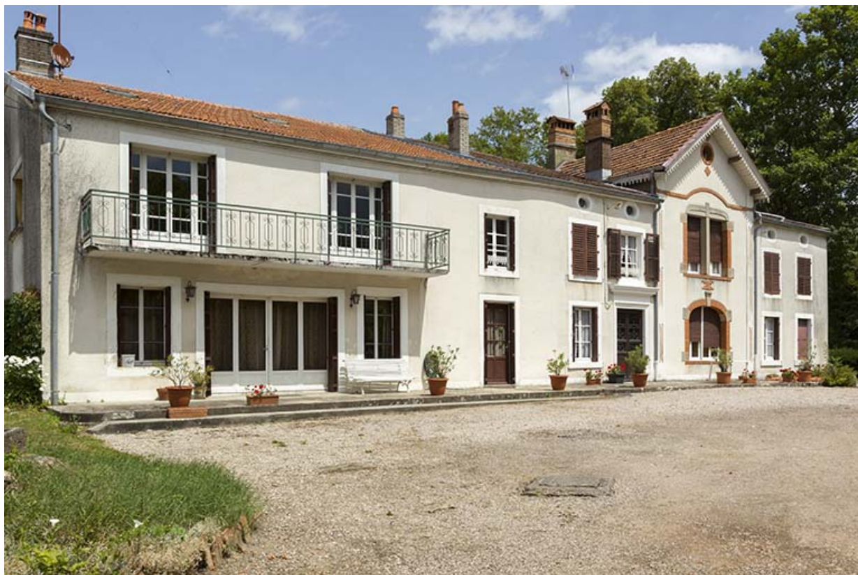
Maison "Boileau", ancien directeur de la verrerie.

70, Passavant-la-Rochère, lieudit : la Rochère