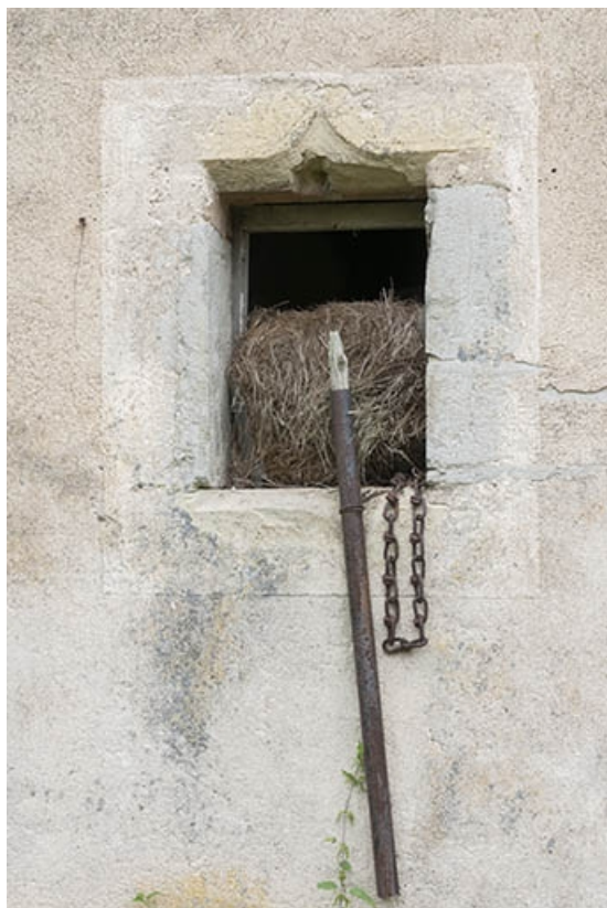
Façade postérieure des parties agricoles, détail d'une baie en accolade. 70, Faverney, 2 rue Sadi Carnot