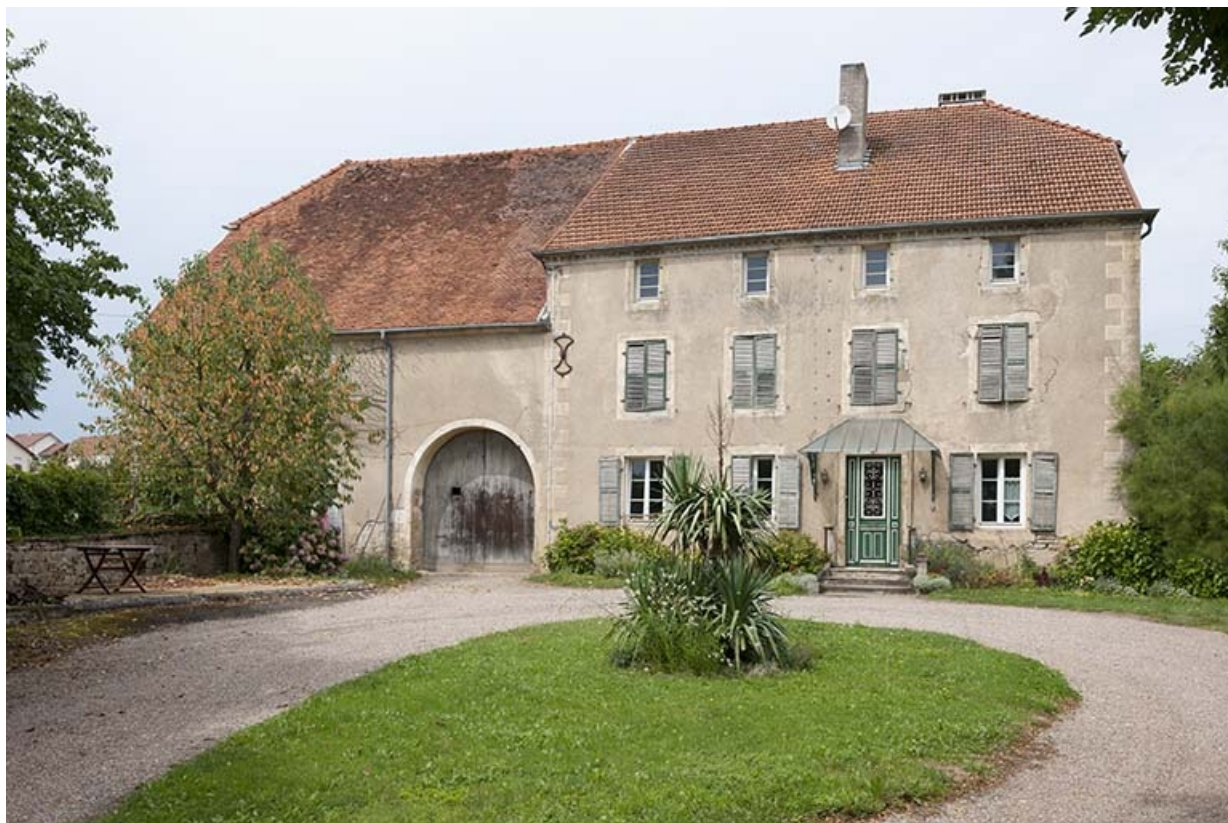
Vue d'ensemble de la maison et des parties agricoles.