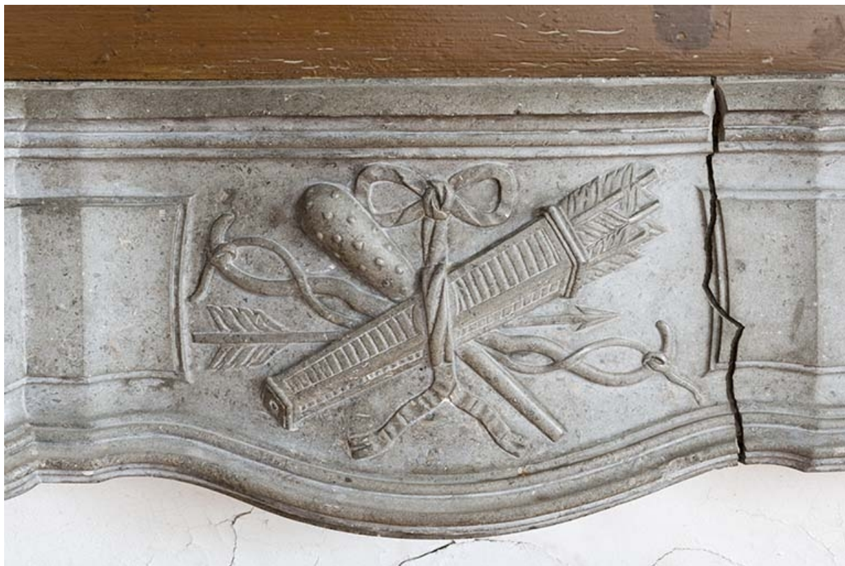
La salle à manger, détail du décor de la cheminée.