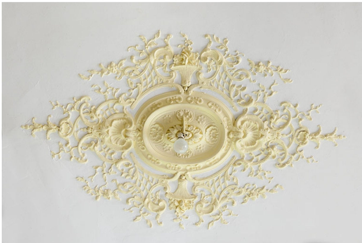
La salle à manger, détail du décor du plafond.