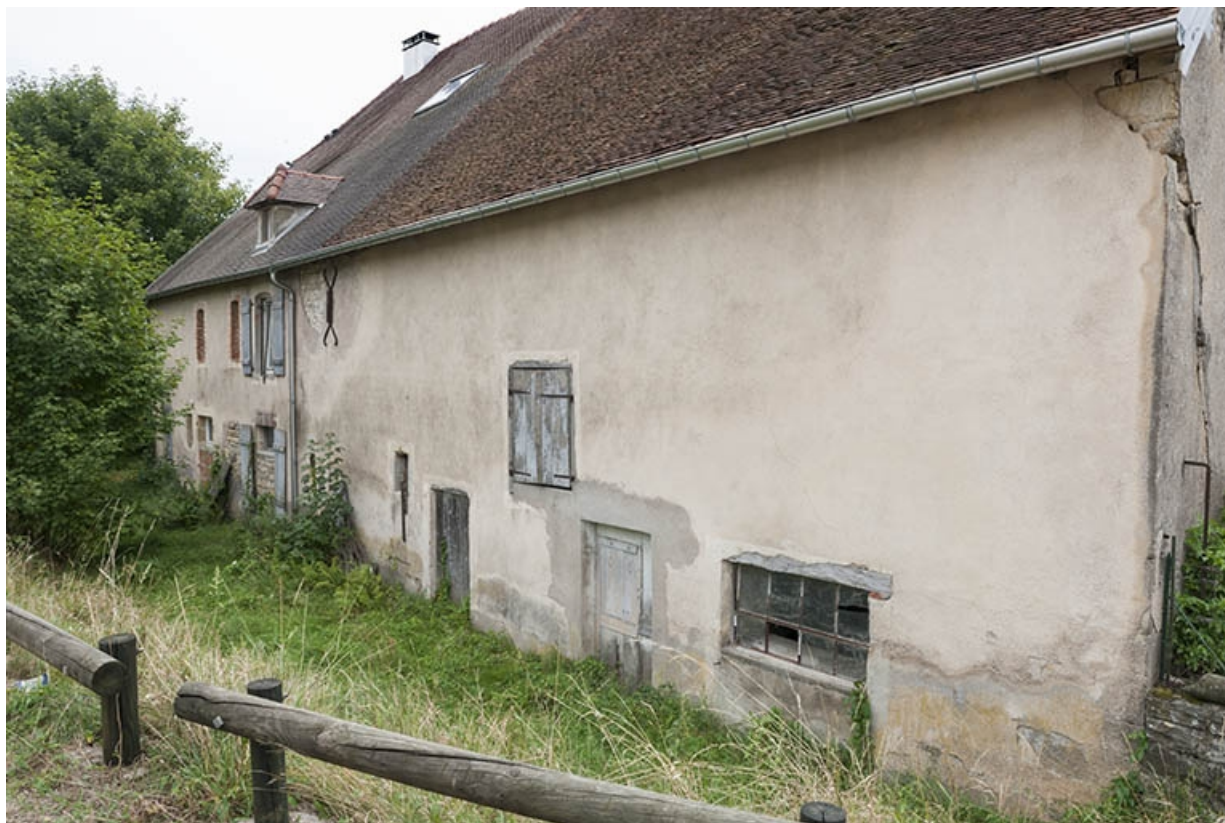
Façade postérieure des parties agricoles et de la maison.