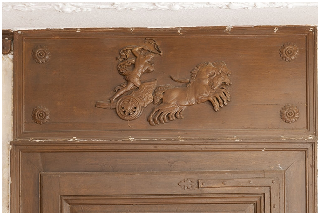
La salle à manger, détail du dessus-de-porte.