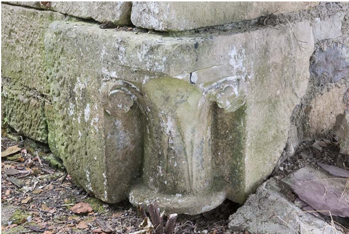
Chapiteau inséré à l'angle du mur de la remise, de face.