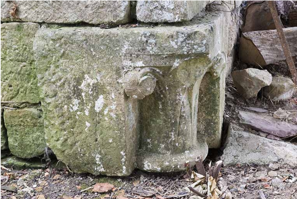
Chapiteau inséré à l'angle du mur de la remise, de trois quarts.