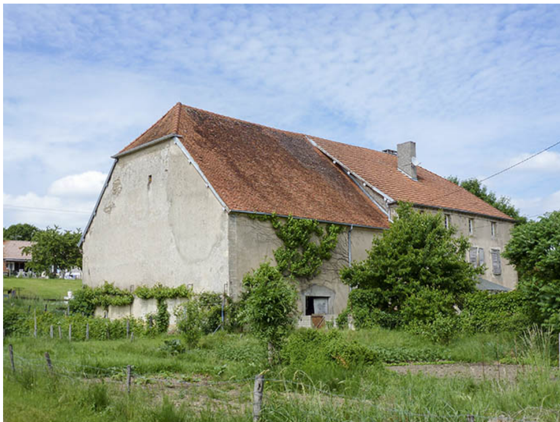
Vue d'ensemble de la maison et des parties agricoles, de trois quarts gauche. 70, Faverney, 2 rue Sadi Carnot