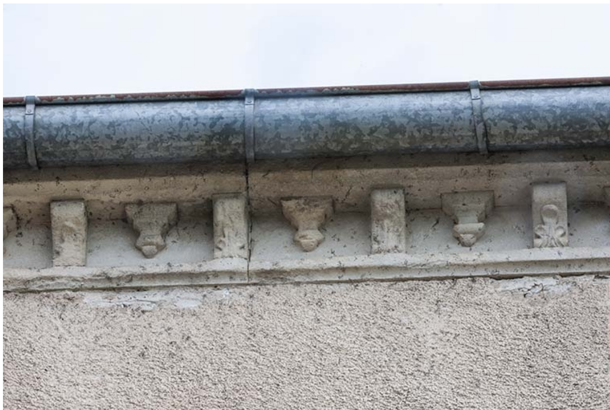
Détail de la corniche de la maison.