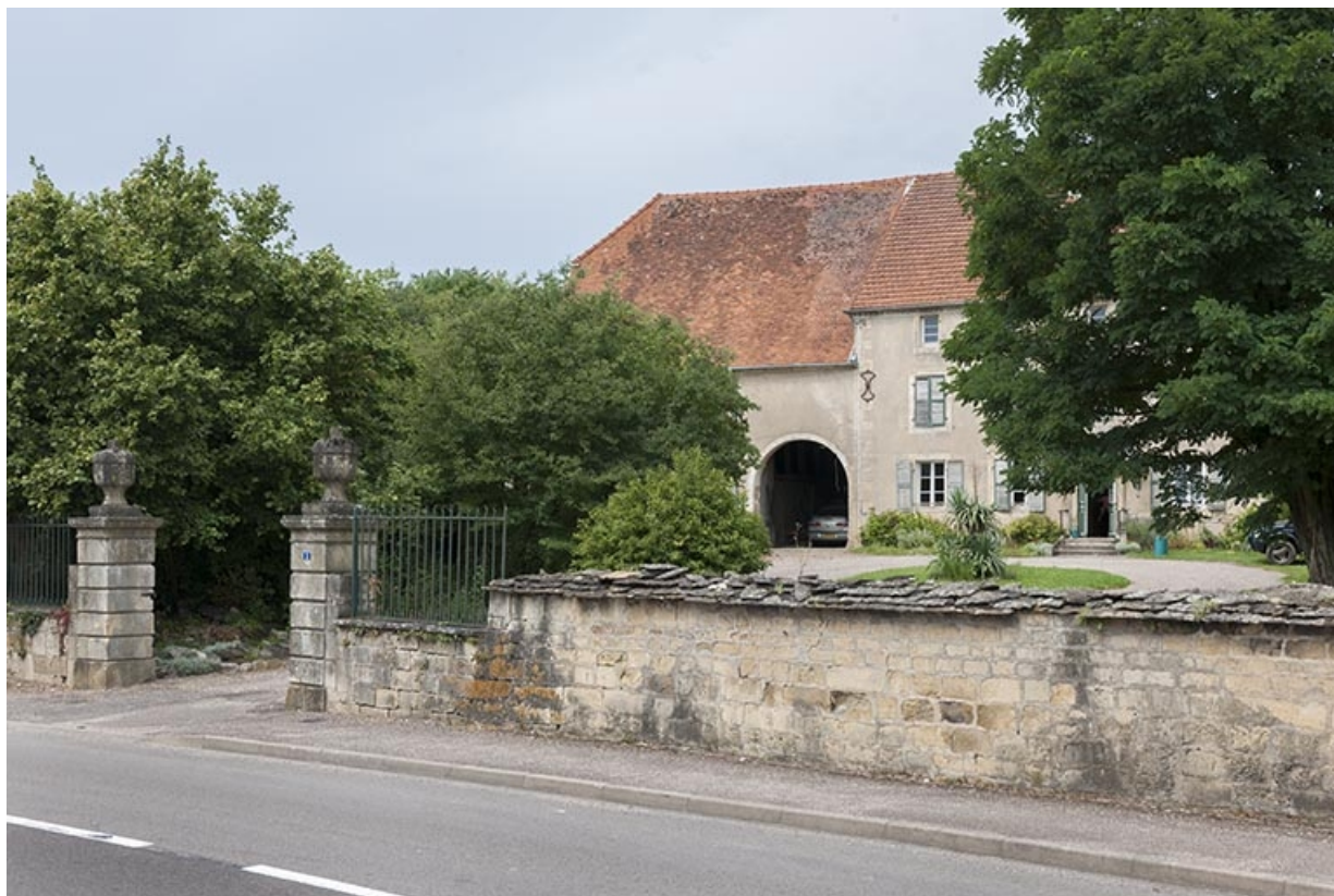
Vue générale depuis la rue Sadi Carnot.