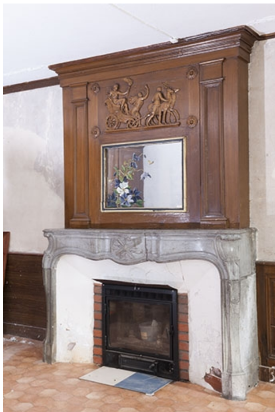
La salle à manger, vue générale de la cheminée. 70, Faverney, 2 rue Sadi Carnot