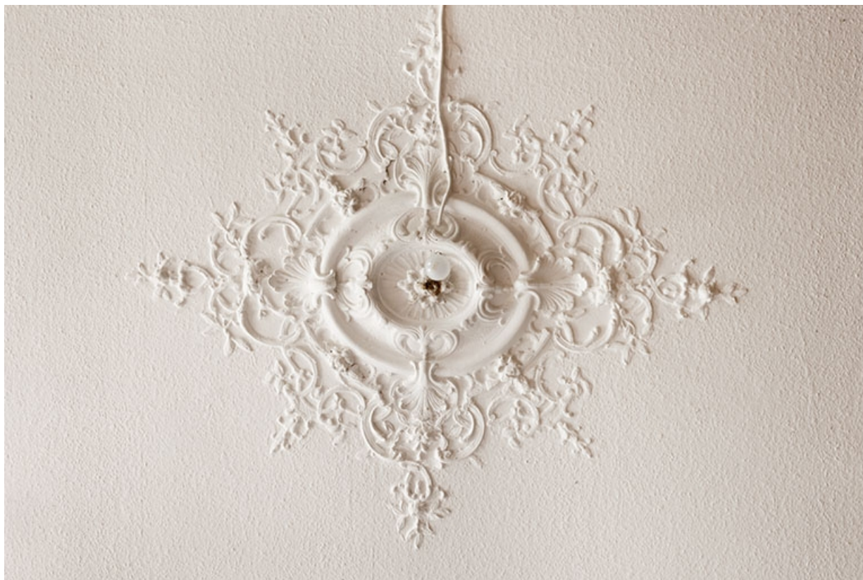
Le salon, détail du décor du plafond.