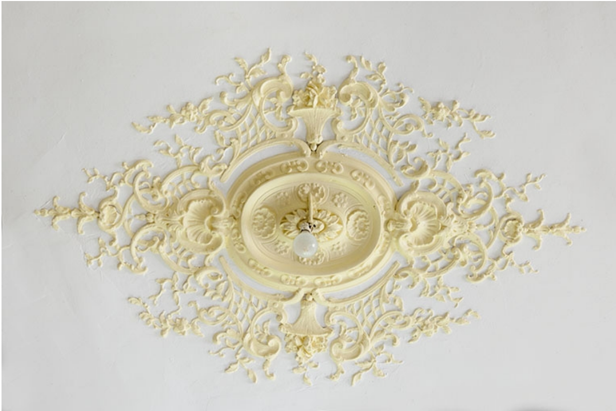
La salle à manger, détail du décor du plafond.