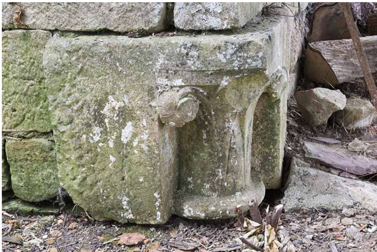
Chapiteau inséré à l'angle du mur de la remise, de trois quarts.