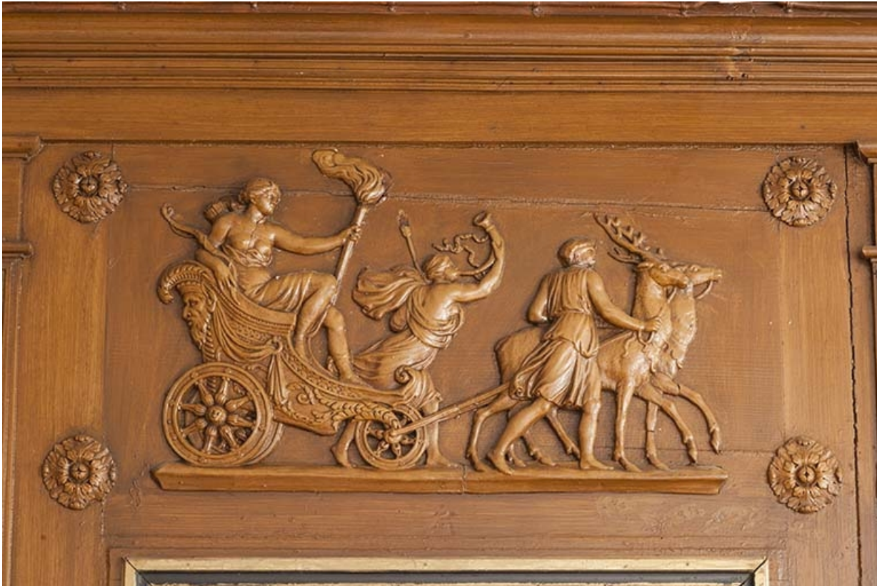
La salle à manger, détail du panneau sculpté au-dessus de la cheminée.