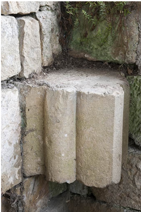
Élément architectural inséré dans le mur d'enclos.