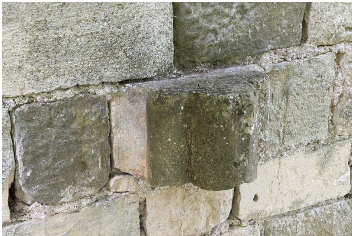
Autre exemple d'élément architectural inséré dans le mur d'enclos.