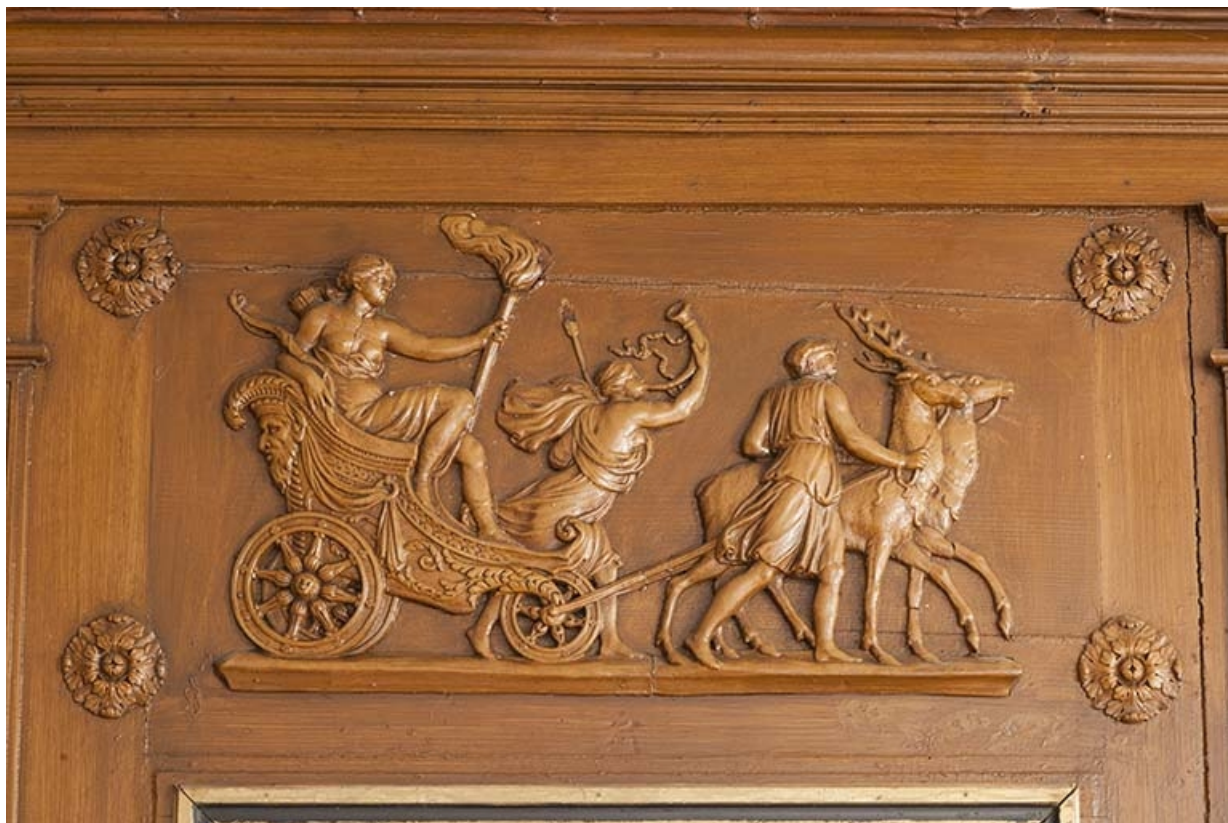
La salle à manger, détail du panneau sculpté au-dessus de la cheminée. 70, Faverney, 2 rue Sadi Carnot