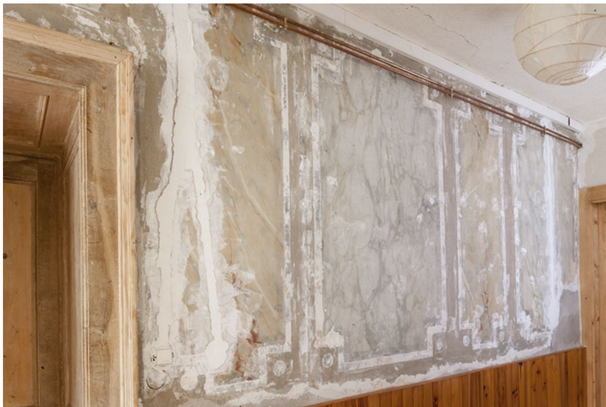
Le vestibule vu depuis l'entrée.