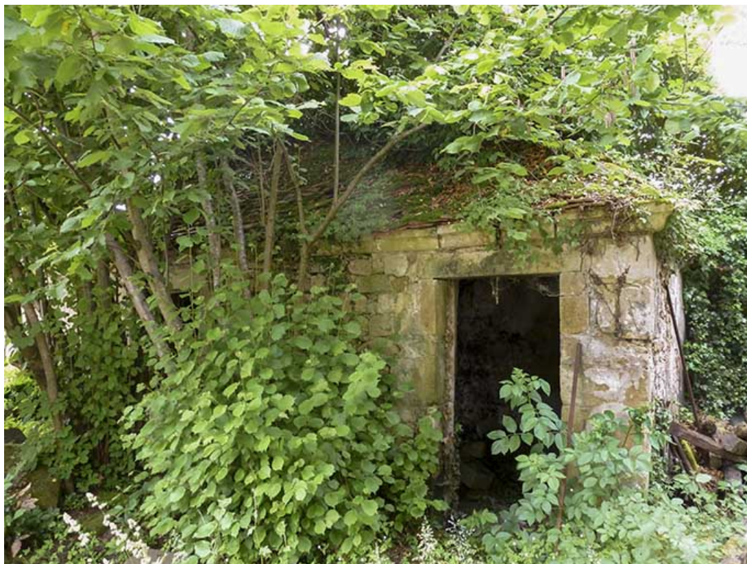
Dépendance à gauche de l'entrée.