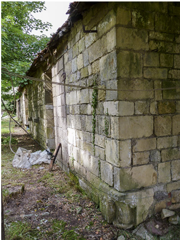
Ensemble de dépendances à droite de la maison.