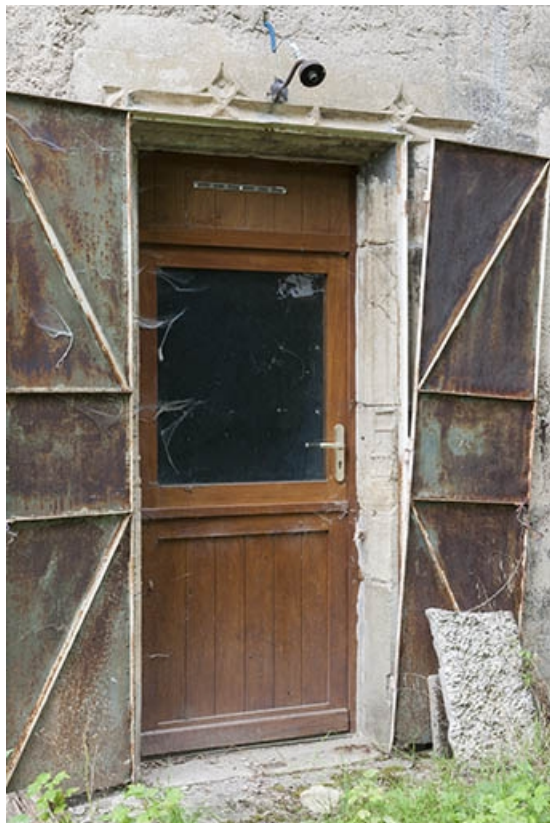
Façade latérale droite de la maison, détail de la baie en accolade modifiée. 70, Faverney, 2 rue Sadi Carnot