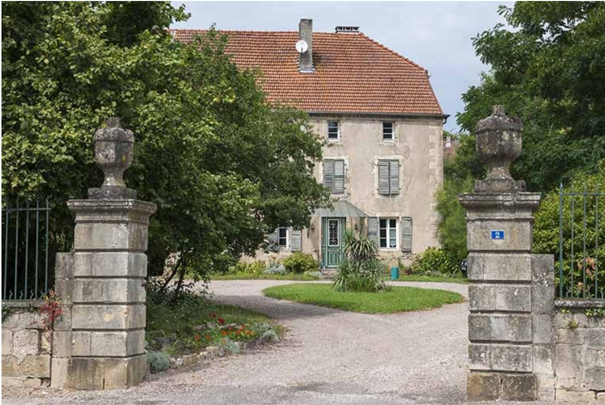
La cour depuis l'entrée.