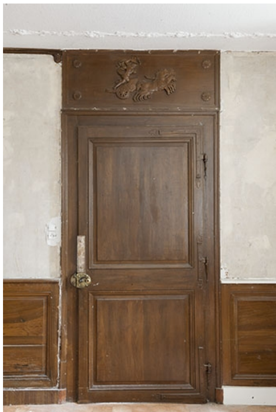
La salle à manger, vue générale de la porte ouvrant sur le vestibule. 70, Faverney, 2 rue Sadi Carnot