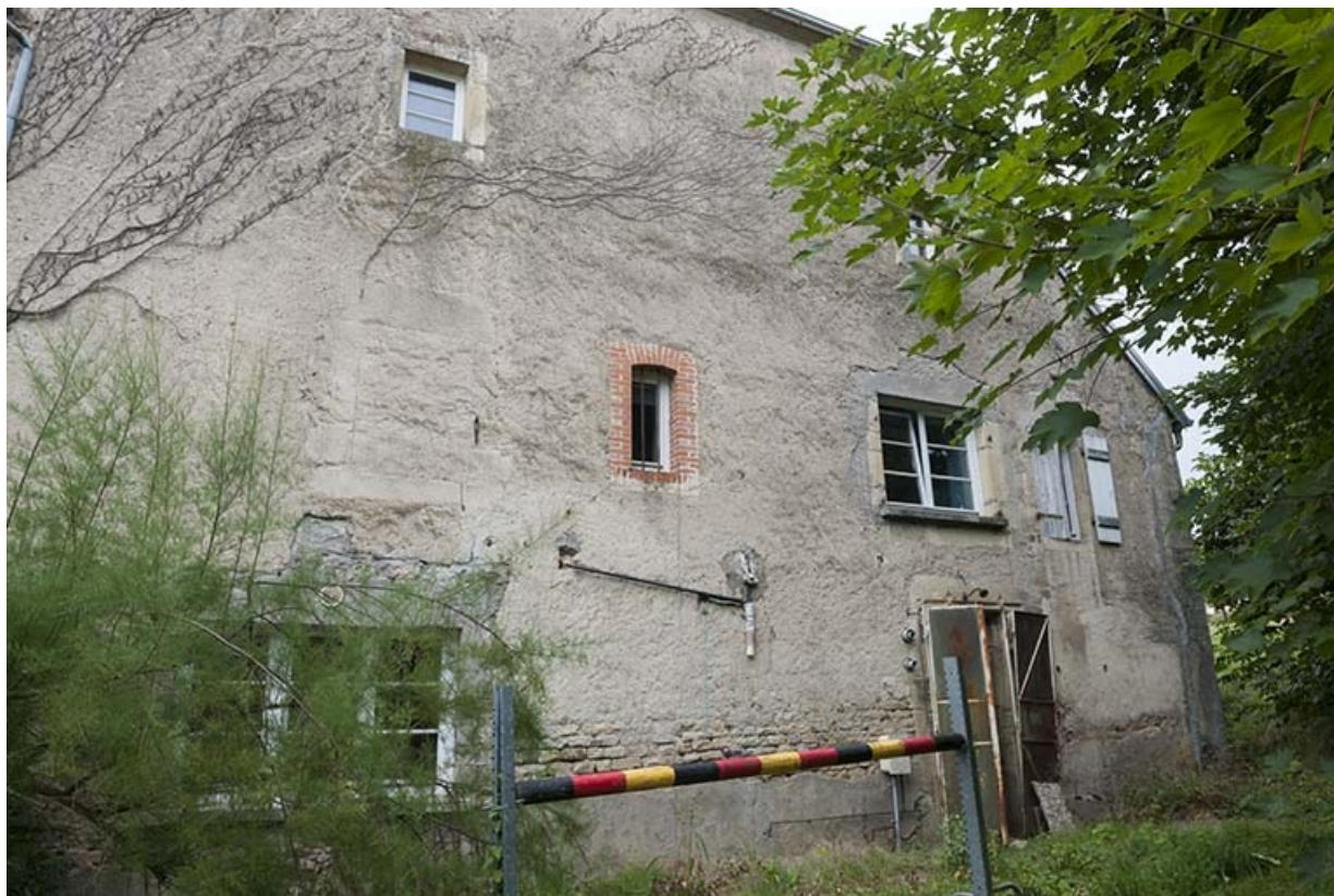
Façade latérale droite de la maison.