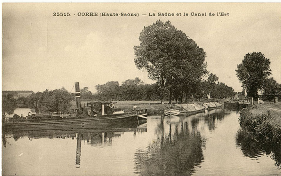
Corre. (Haute-Saône) La Saône et le canal de l'est. Carte postale n°25515.