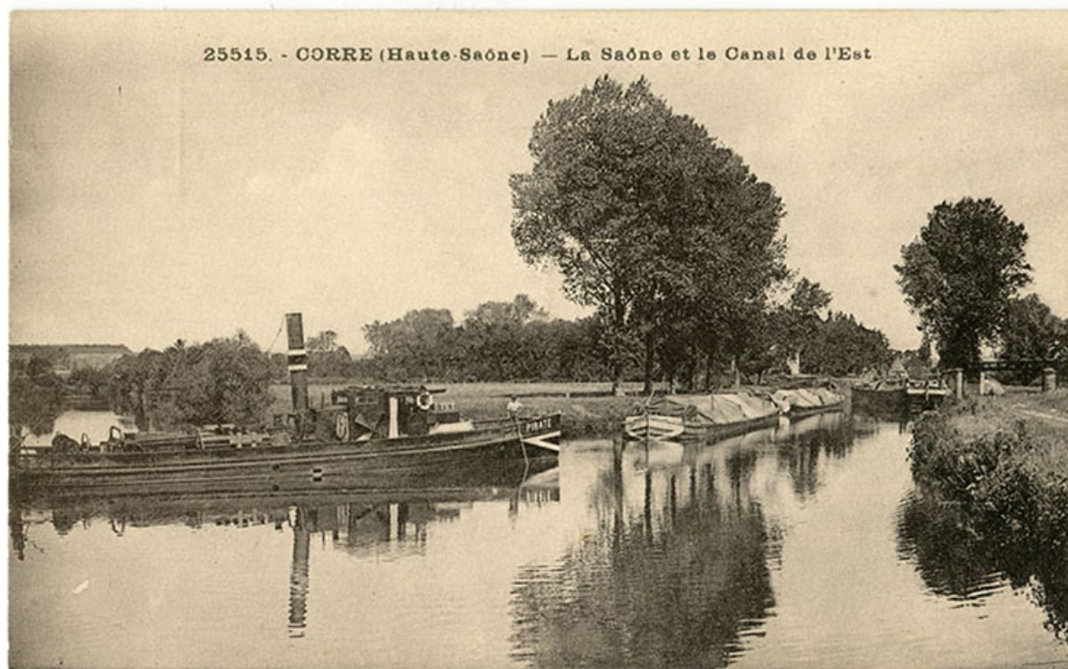
Corre. (Haute-Saône) La Saône et le canal de l'est. Carte postale n°25515. 70, Corre