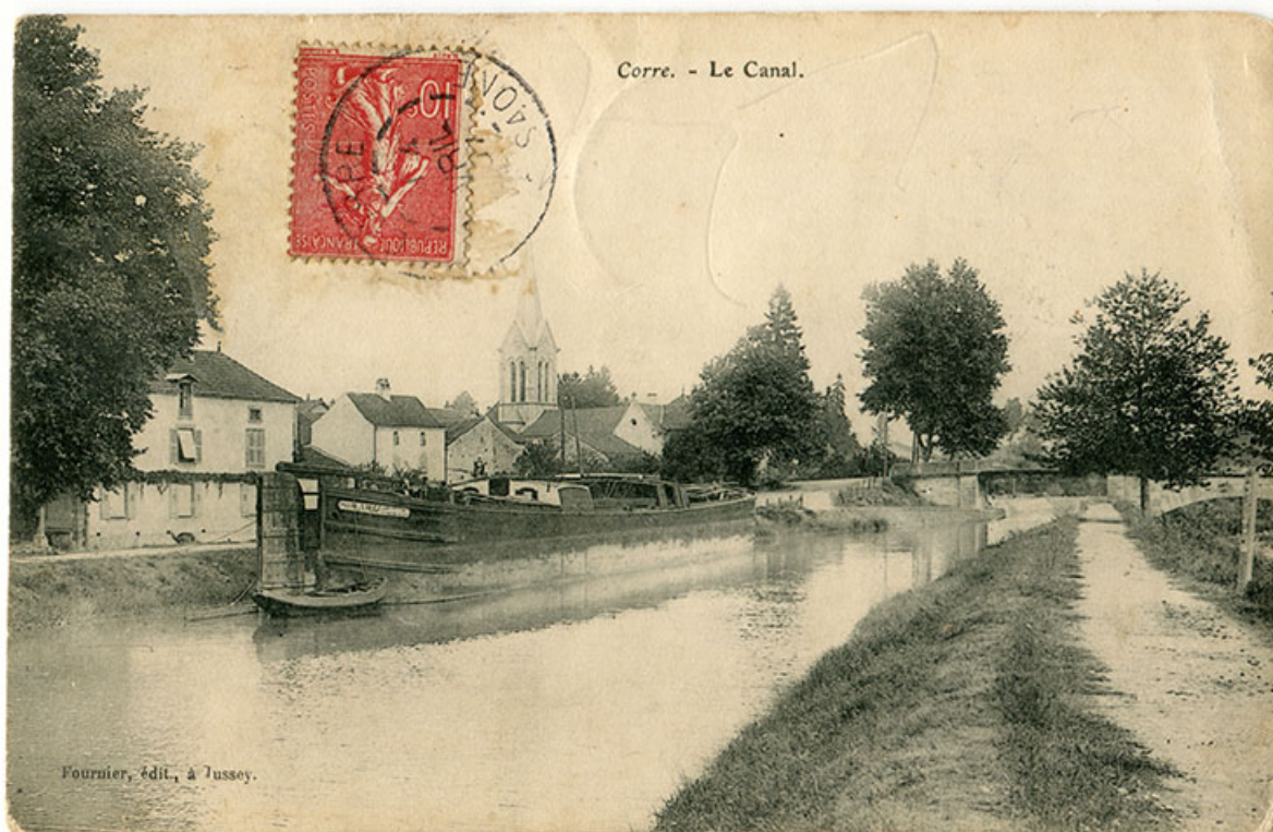
Corre. Le canal. Carte postale. (Vue antérieure à avril 1907)