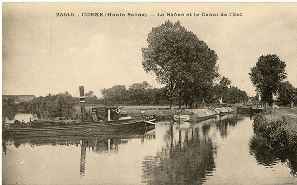
Corre. (Haute-Saône) La Saône et le canal de l'est. Carte postale n°25515. 70, Corre