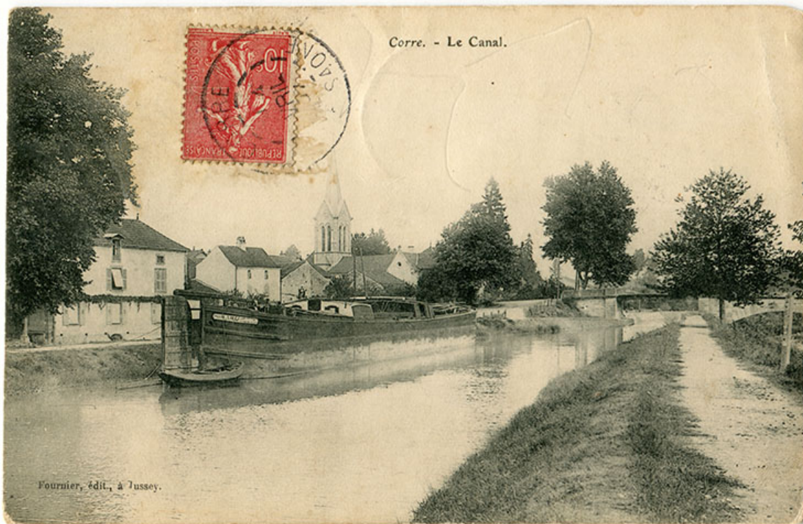
Corre. Le canal. Carte postale. (Vue antérieure à avril 1907) 70, Corre