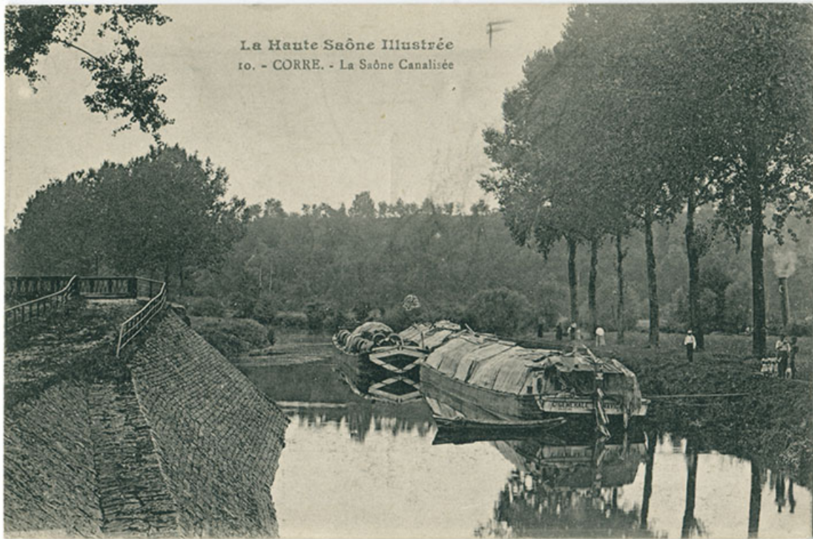
Corre. La Saône canalisée. Carte postale. 70, Corre