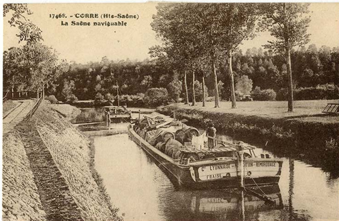
Corre. La Saône navigable. Carte postale n° 17466