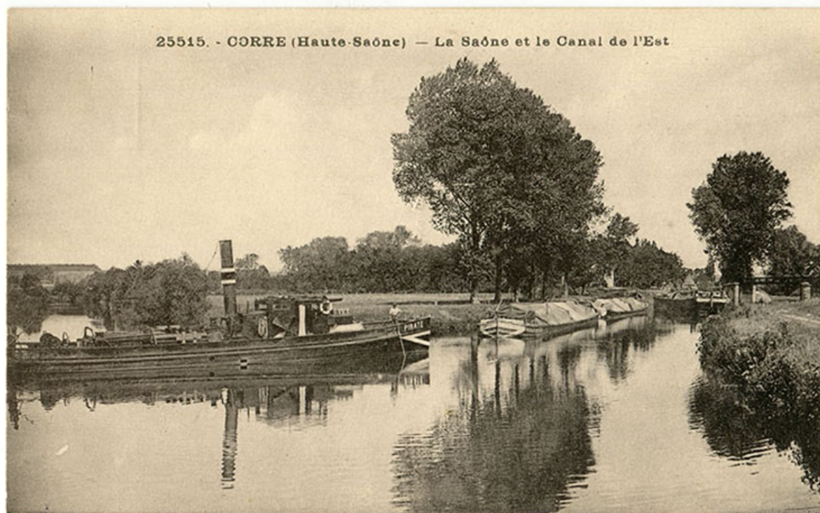
Corre. (Haute-Saône) La Saône et le canal de l'est. Carte postale n°25515.