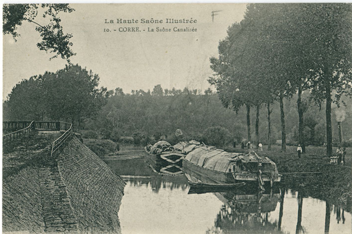
Corre. La Saône canalisée. Carte postale.