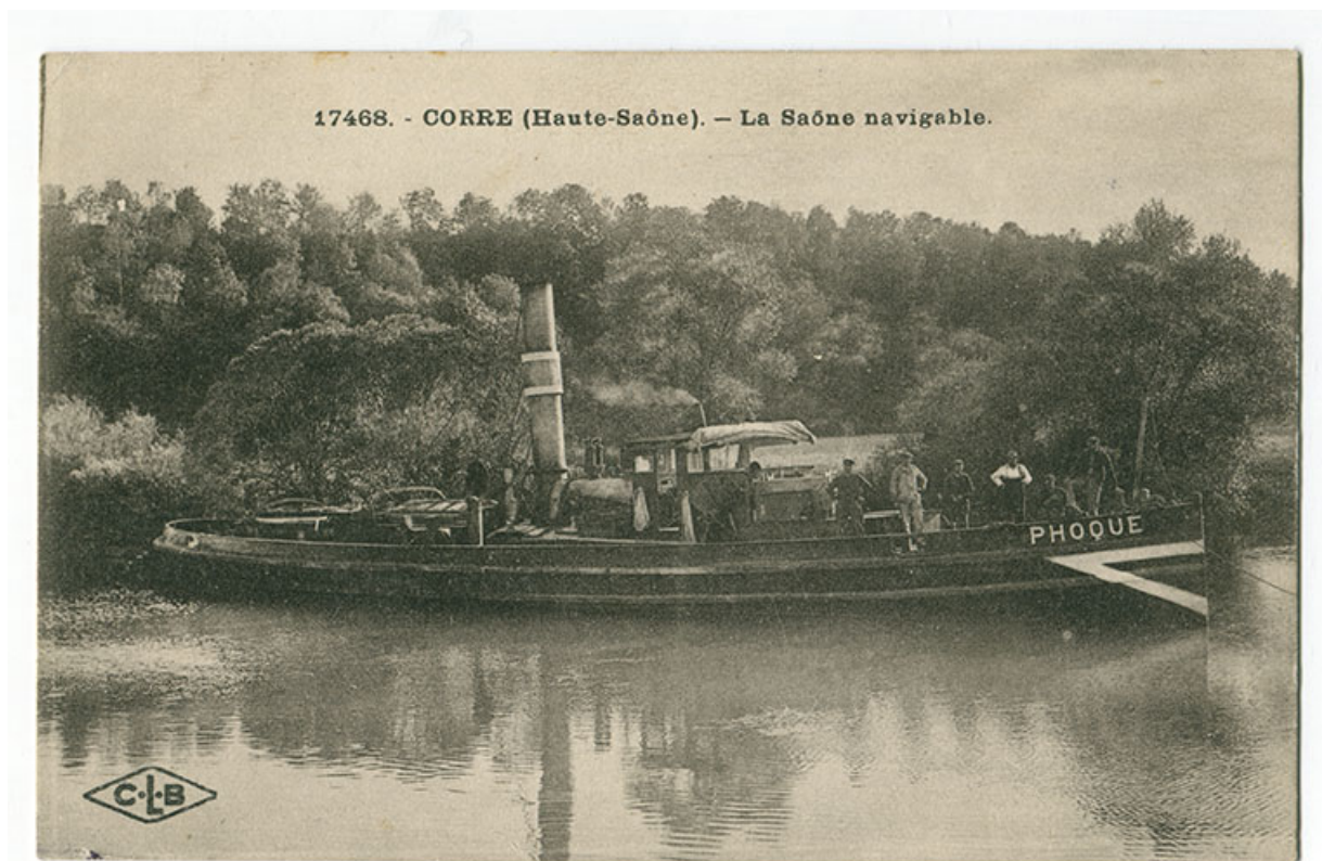
Corre. La Saône navigable. Carte postale