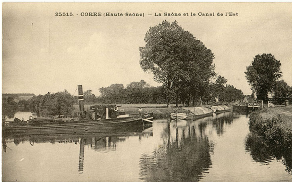
Corre. (Haute-Saône) La Saône et le canal de l'est. Carte postale n°25515.