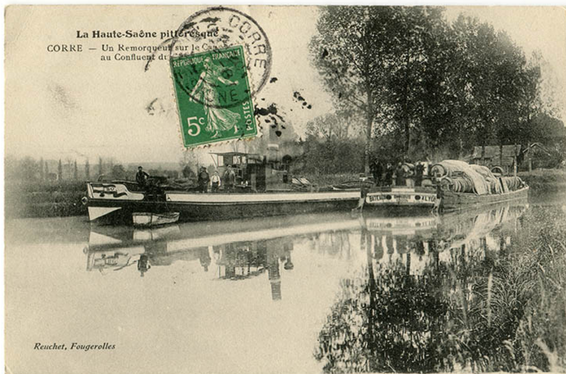
La Haute-Saône pittoresque. Un remorqueur sur le canal au confluent du Coney et de la Saône. Carte postale. 70, Corre