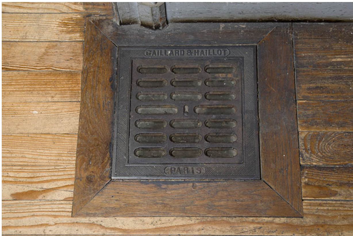
Grille de ventilation du chauffage central.

70, Passavant-la-Rochère, lieudit : la Rochère