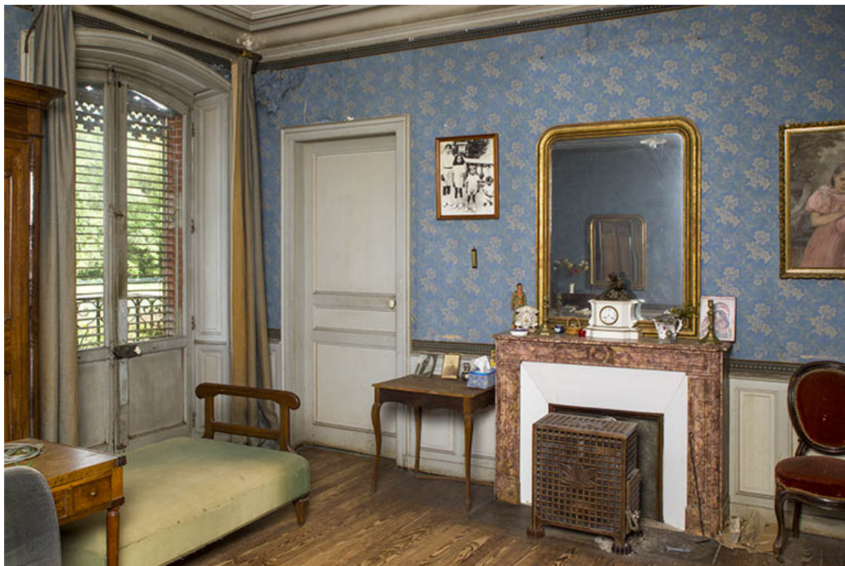
Vue générale d'une chambre, premier étage.

70, Passavant-la-Rochère, lieudit : la Rochère