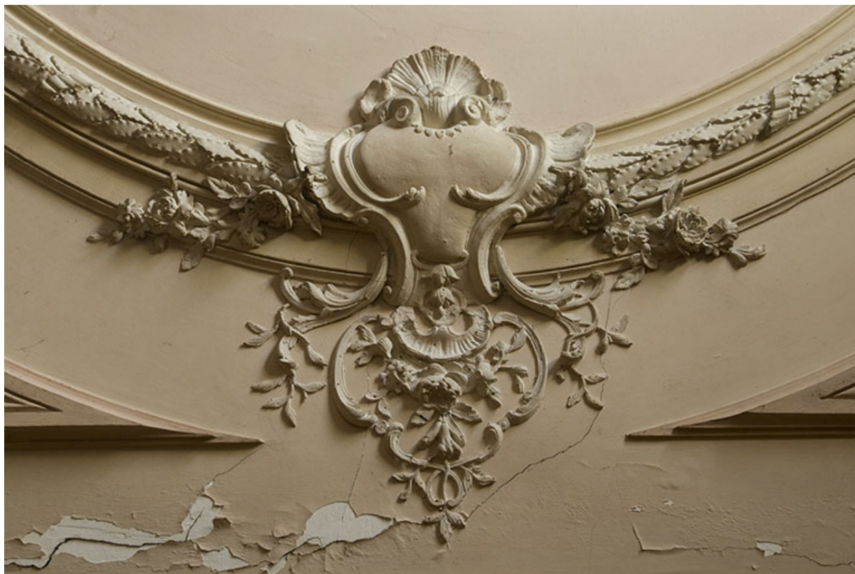
Mouures décoratives au plafond, grand salon.

70, Passavant-la-Rochère, lieudit : la Rochère