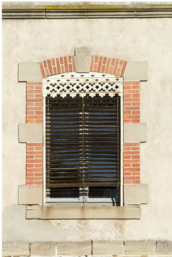
Détail d'une baie.

70, Passavant-la-Rochère, lieudit : la Rochère