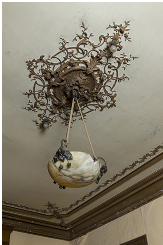
Détail d'un lustre.

70, Passavant-la-Rochère, lieudit : la Rochère