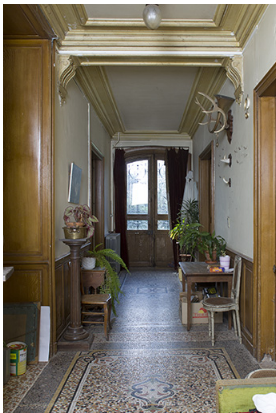
Vue d'ensemble du couloir, rez-de-chaussée.

70, Passavant-la-Rochère, lieudit : la Rochère