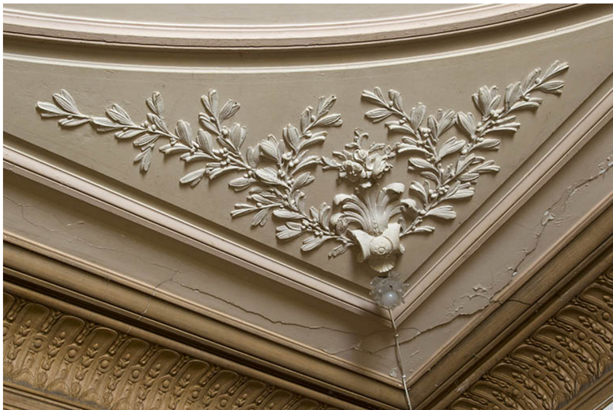
Détail de moulures au plafond.

70, Passavant-la-Rochère, lieudit : la Rochère