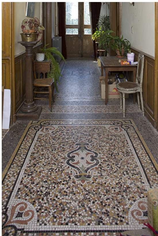
Vue de détail sur le carrelage du couloir.

70, Passavant-la-Rochère, lieudit : la Rochère