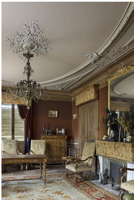
Le grand salon.

70, Passavant-la-Rochère, lieudit : la Rochère