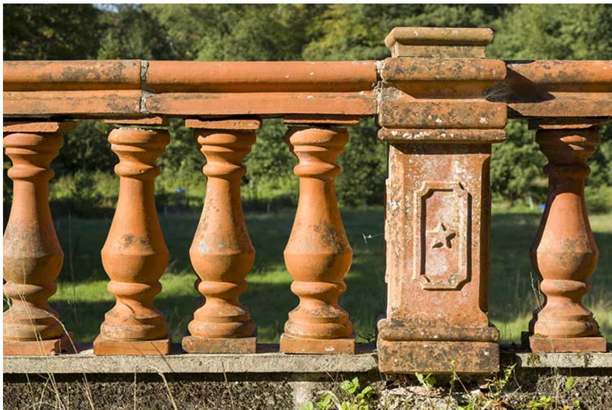
Balustrade de la terrasse, façade nord.

70, Passavant-la-Rochère, lieudit : la Rochère