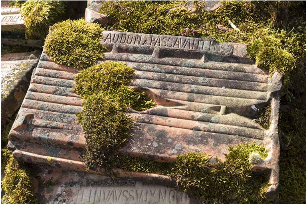
Tuile mécanique de la tuilerie Audon.