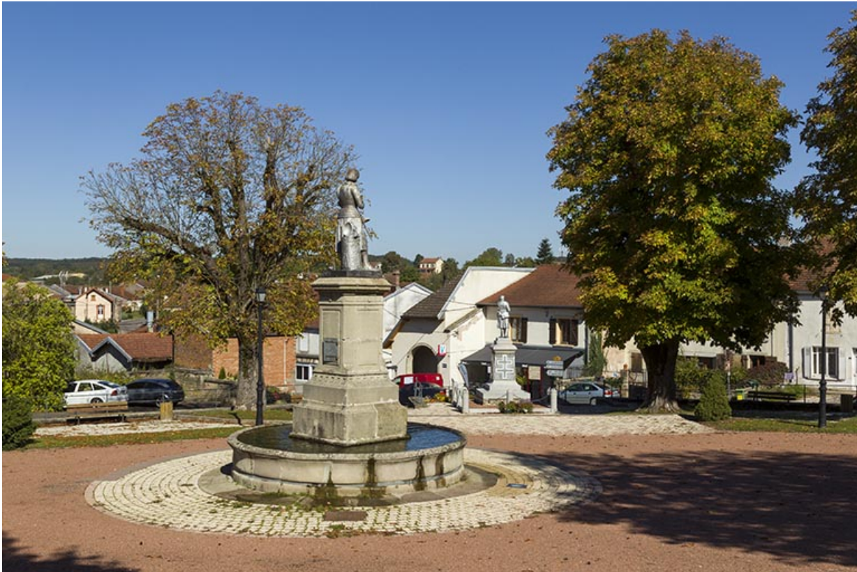
La fontaine Jeanne d'Arc sur la place publique.