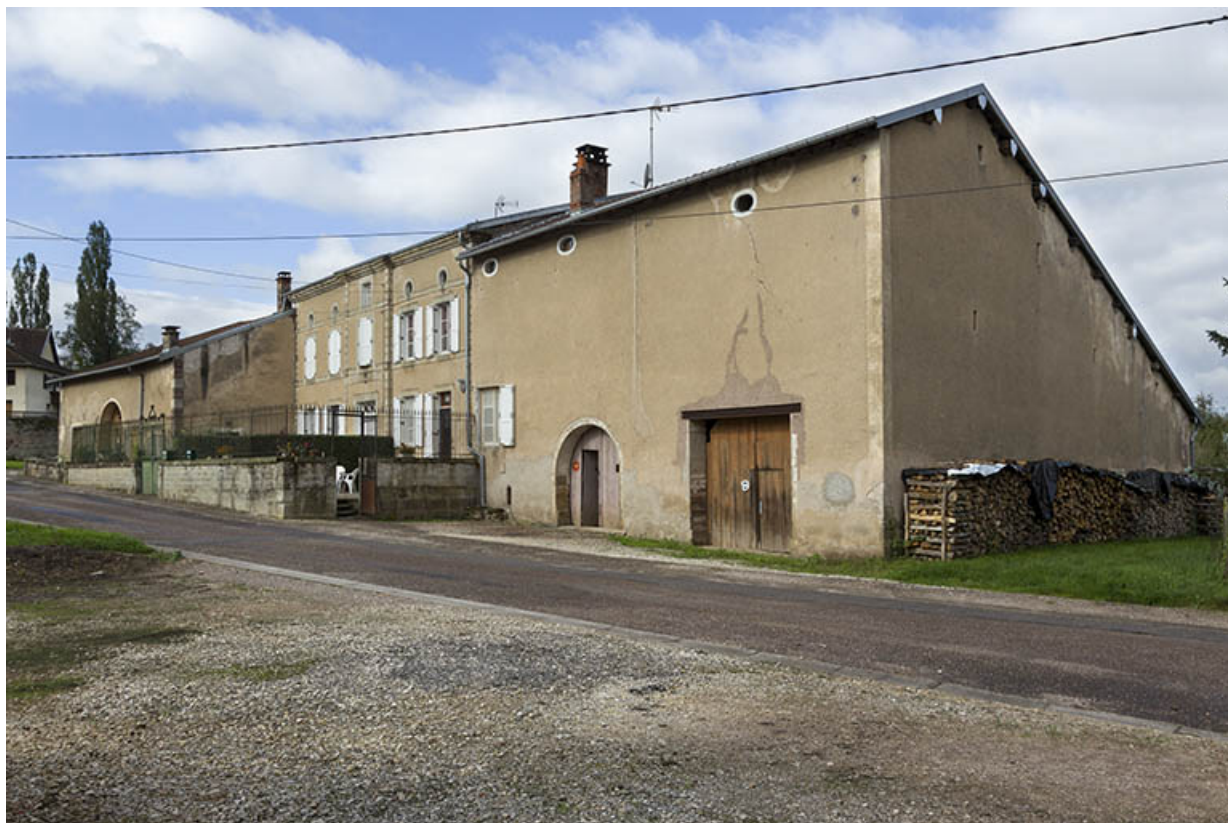
Ferme à doubles granges, rue Charrière de Vouécourt. 70, Passavant-la-Rochère