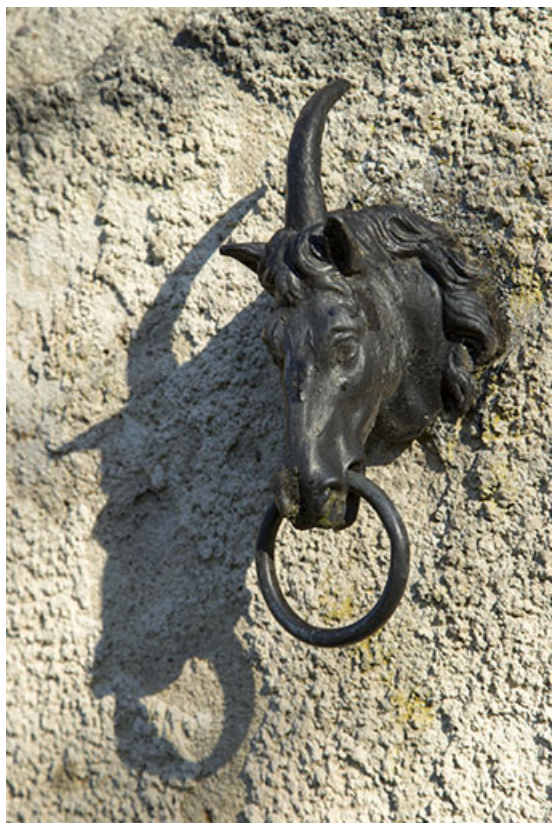
Détail d'un anneau.