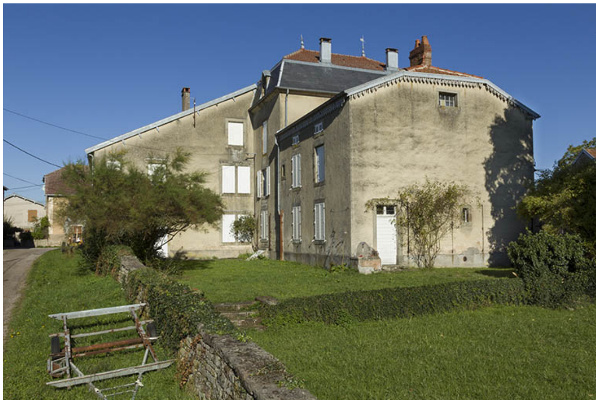
Maison, rue du Château, façades postérieures. 70, Passavant-la-Rochère