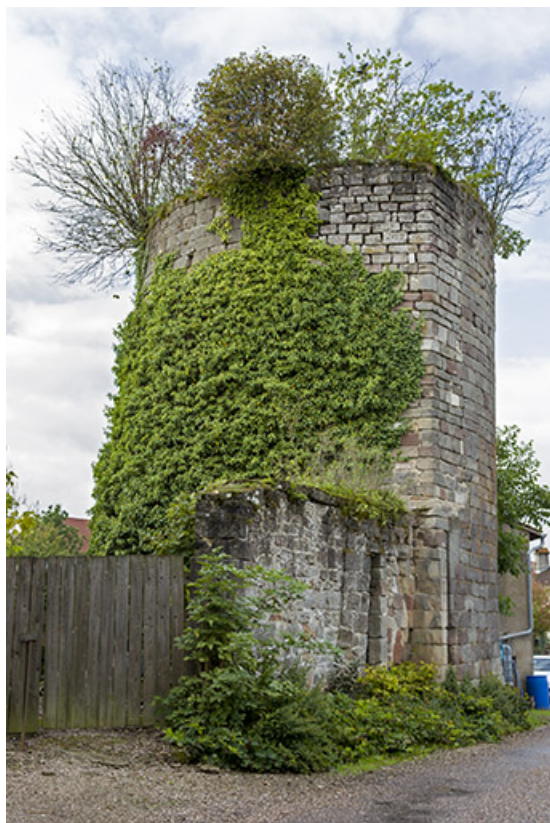
Tour dite "Mathey", faisant partie des anciennes fortifications du bourg. 70, Passavant-la-Rochère