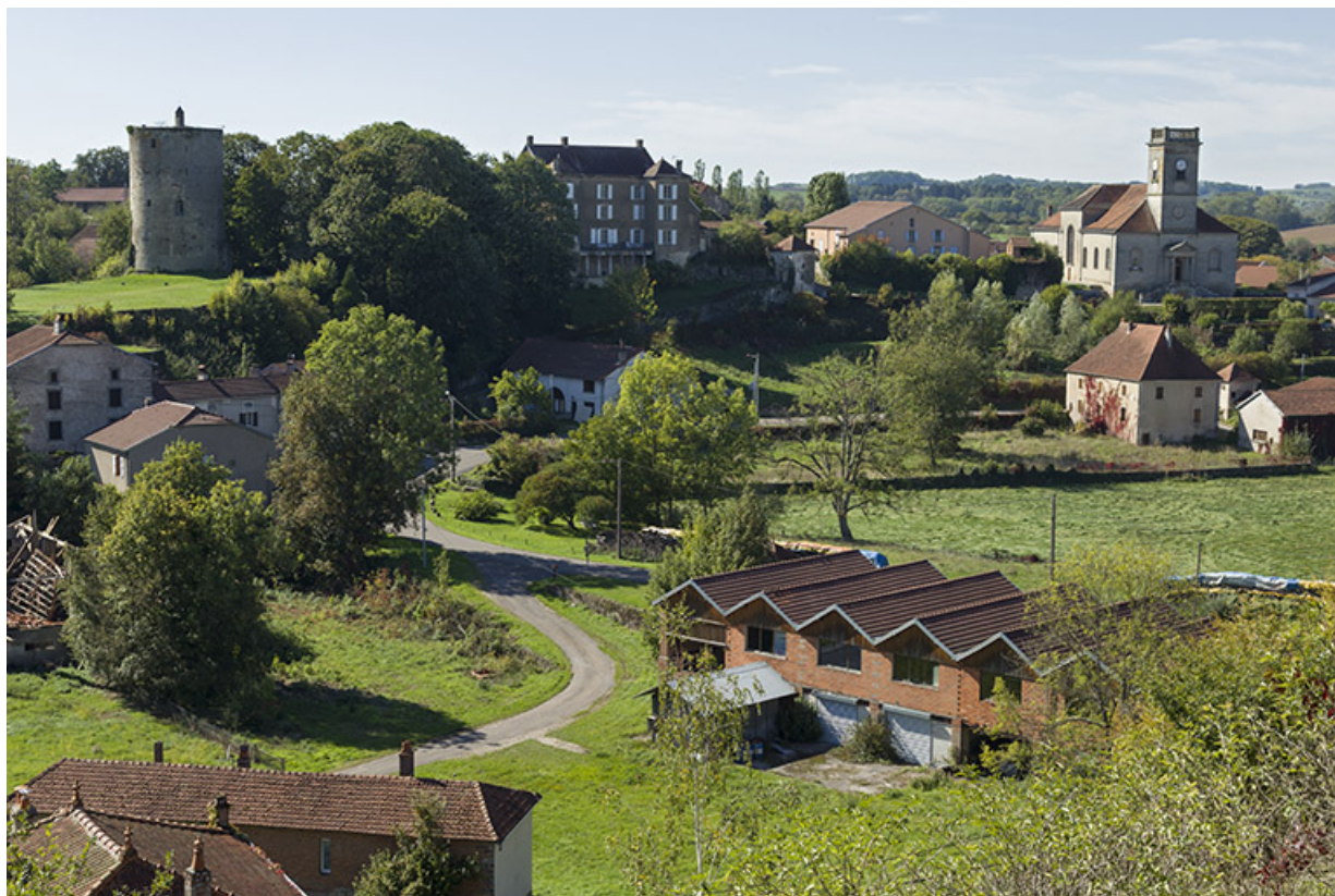
Vue sur la tuilerie Calvie et Cie depuis la "Côte". 70, Passavant-la-Rochère