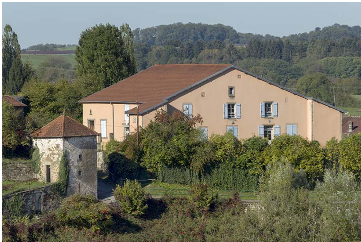
Maison comprise dans l'ancienne enceinte fortifiée du bourg.