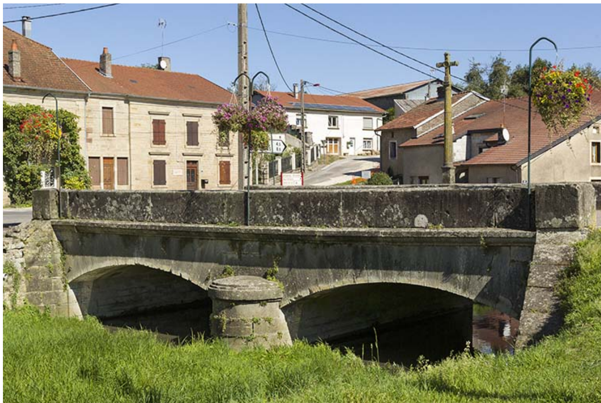
Pont avec une croix enjambant le ruisseau de la Noué. 70, Passavant-la-Rochère