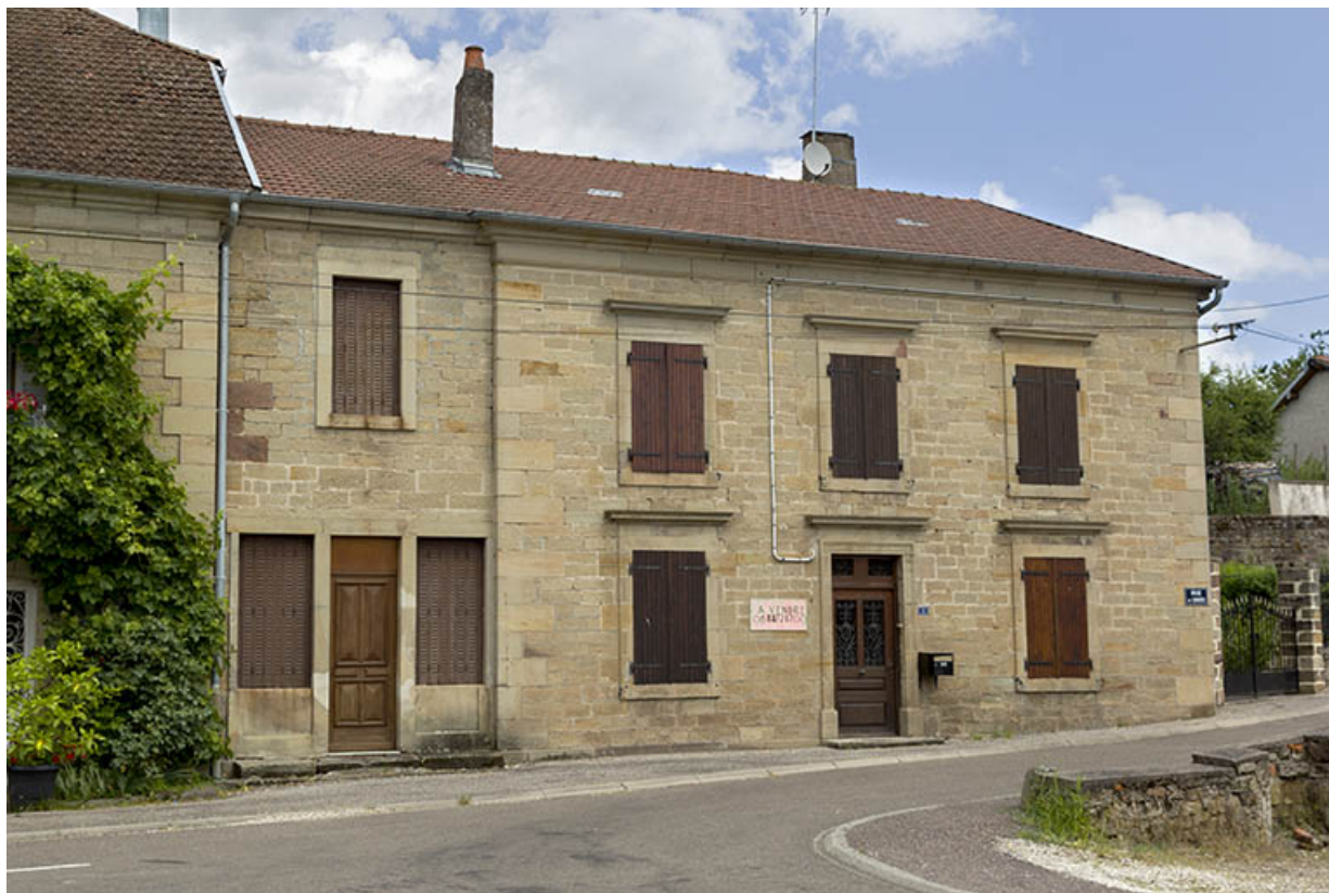
Maison, rue Couelle.