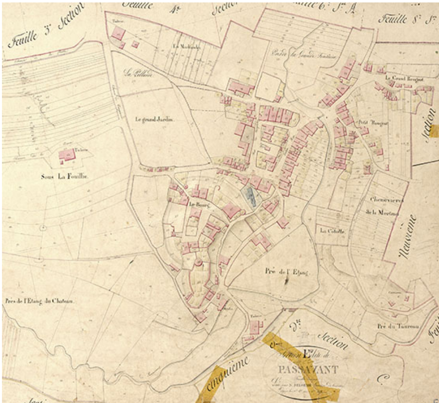
Plan du village extrait du plan cadastral, 1823. 70, Passavant-la-Rochère