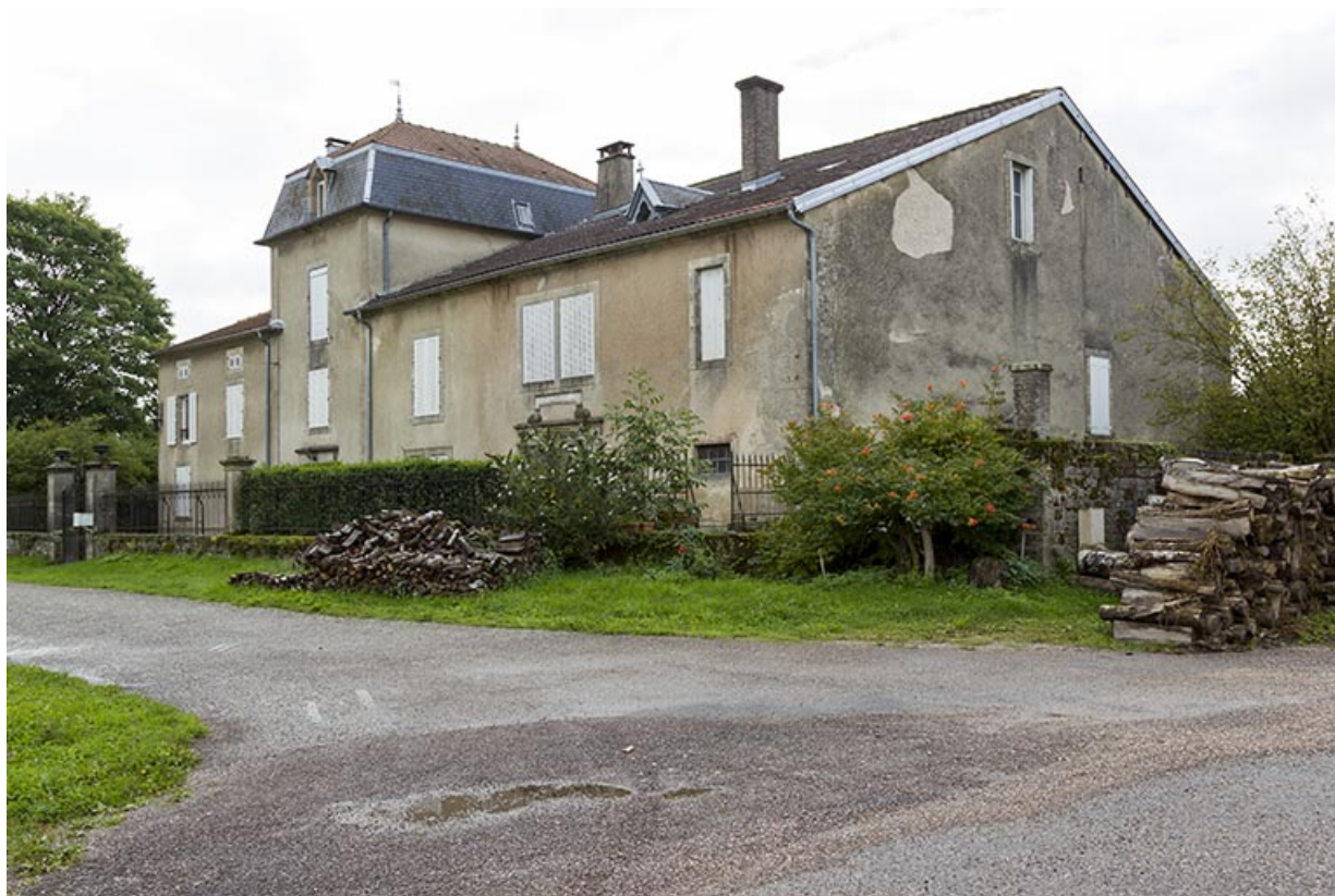
Maison située rue du Château.