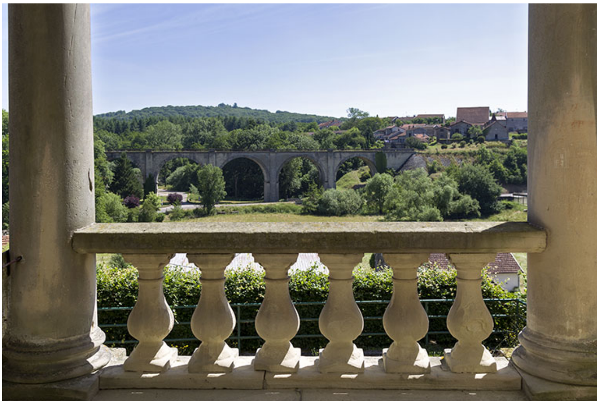
Vue sur la côte et le viaduc depuis la demeure Dutailly.