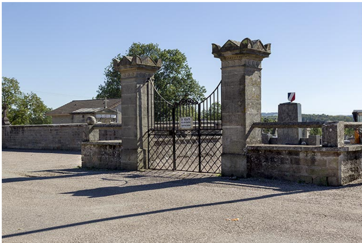
Le cimetière transféré au 19e siècle, rue du Cimetière. 70, Passavant-la-Rochère