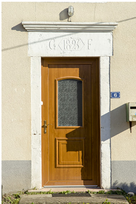
Porte avec date portée sur le linteau.