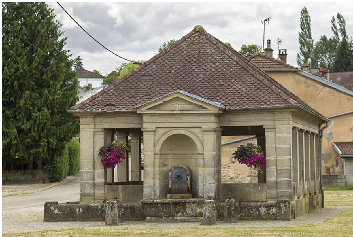
Fontaine-lavoir de la rue Charrière de Vouécourt.