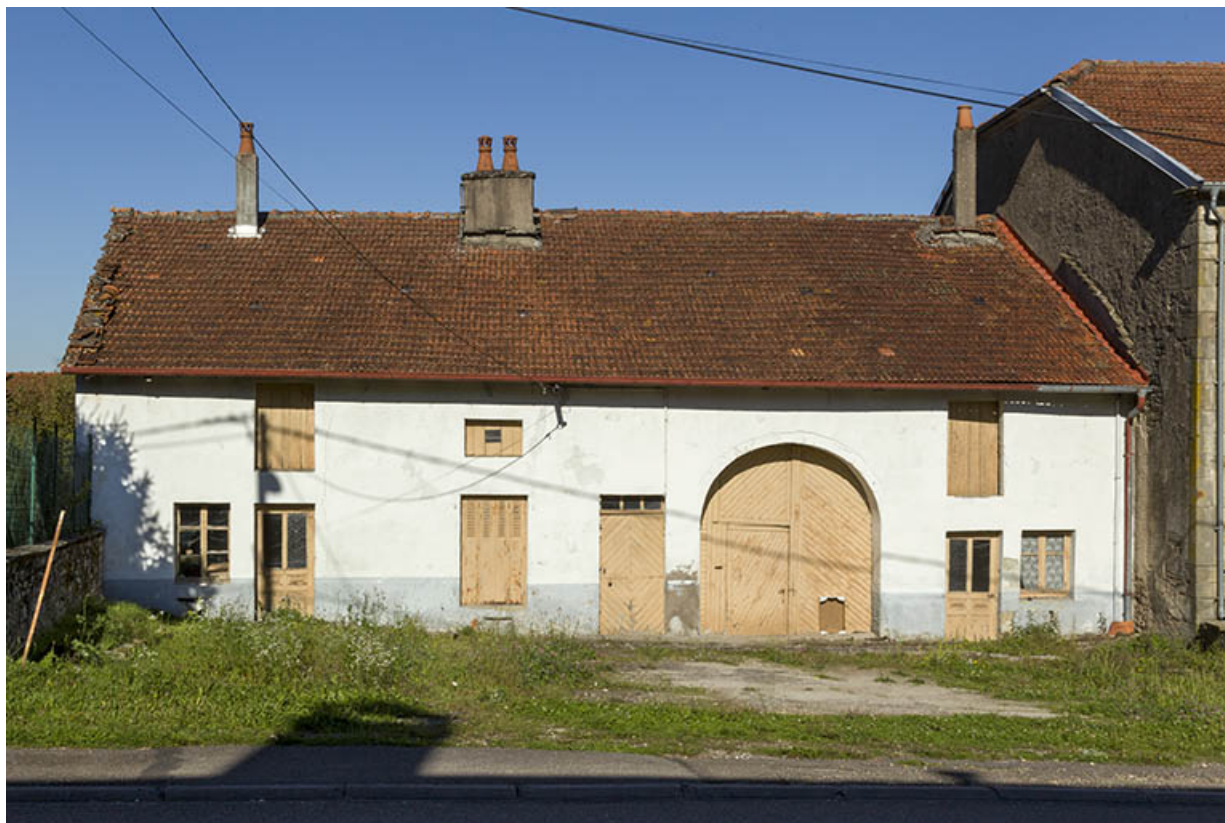
Ferme comprenant deux habitations et une partie agricole commune. 70, Passavant-la-Rochère