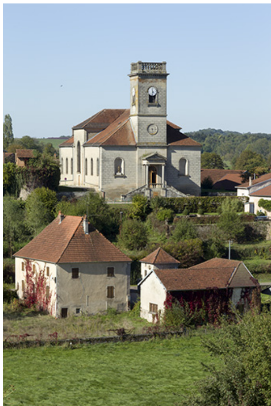
L'église et le presbytère.