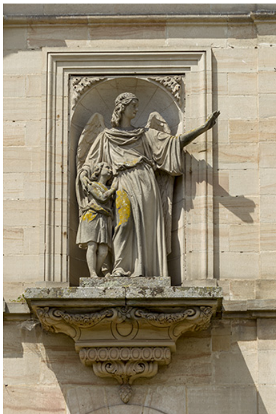
Niche abritant un ange accompagné d'un enfant, façade principale.

70, Passavant-la-Rochère, 1 place Dieu, lieudit : la Rochère