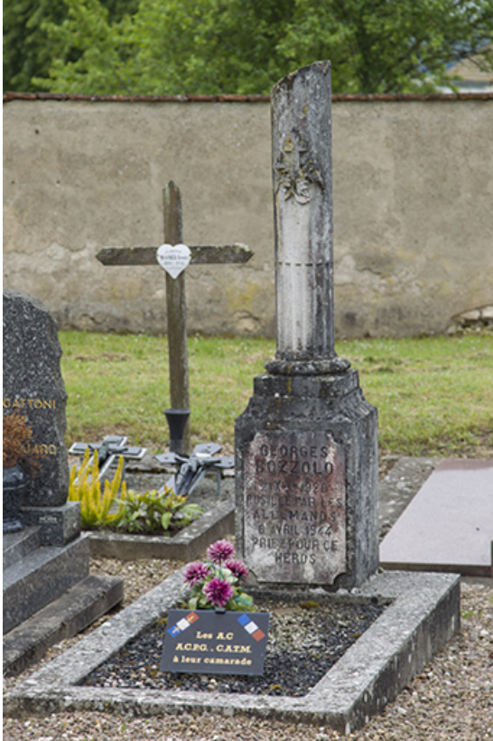
Tombeau de Bozzolo.

70, Ray-sur-Saône route de Ferrières, lieudit : Vignes Sainte-Anne