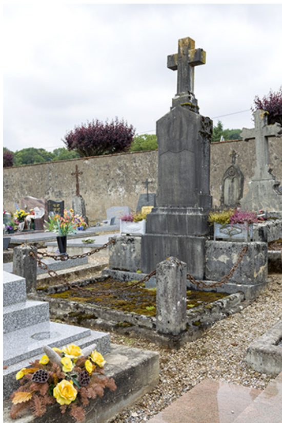
Tombeau d'Eugène Jardel.

70, Ray-sur-Saône route de Ferrières, lieudit : Vignes Sainte-Anne