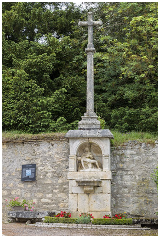
Oratoire et croix de chemin dite du Pilori, rue du Château. 70, Ray-sur-Saône rue du château