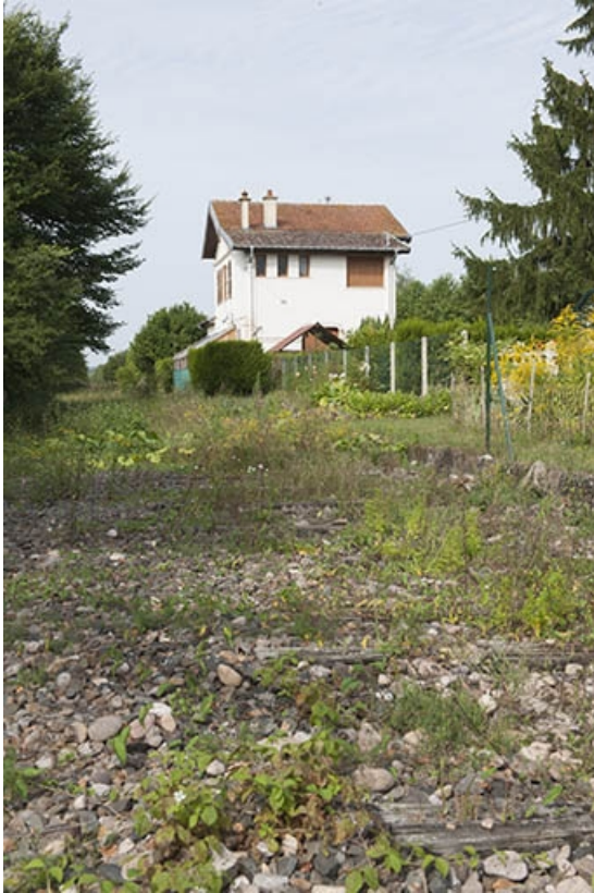
Vue générale depuis l'ancienne voie ferrée.