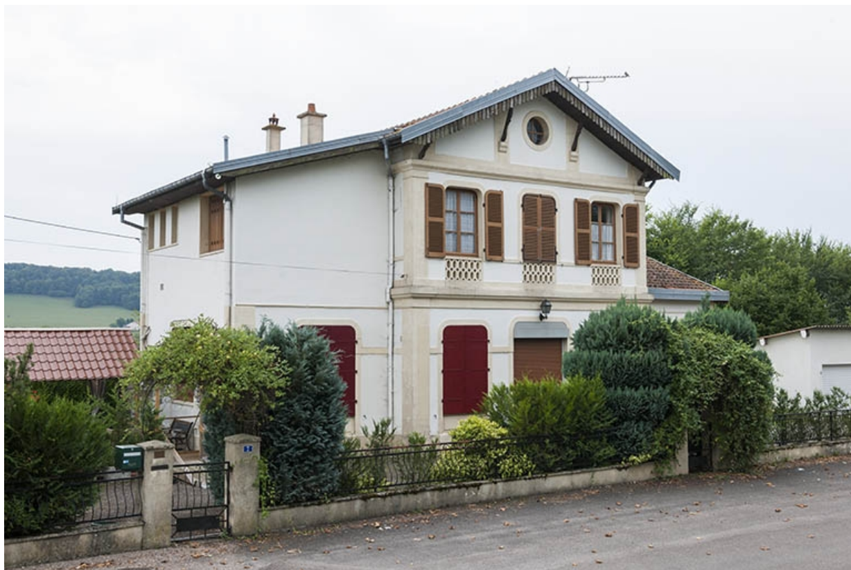
Vue générale de trois quart gauche depuis l'avenue de la Gare.