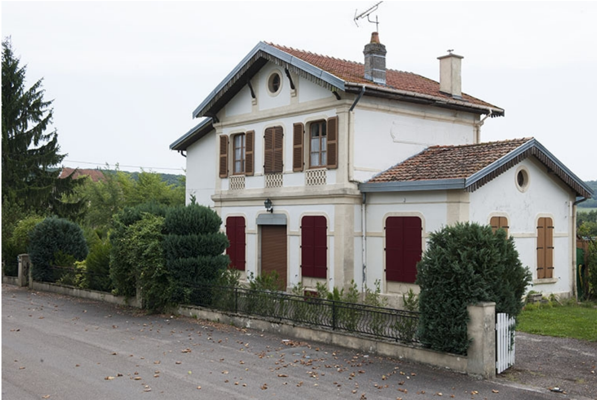
Vue générale de trois quart droit depuis l'avenue de la Gare. 70, Faverney