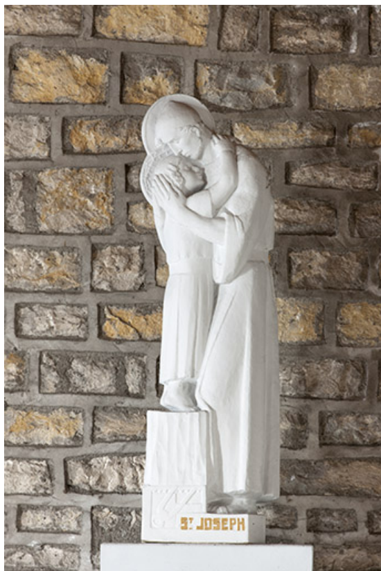
Statue de saint Joseph et l'Enfant.

70, Faverney rue de la Gare, lieudit : Port-d'Atelier-Amance