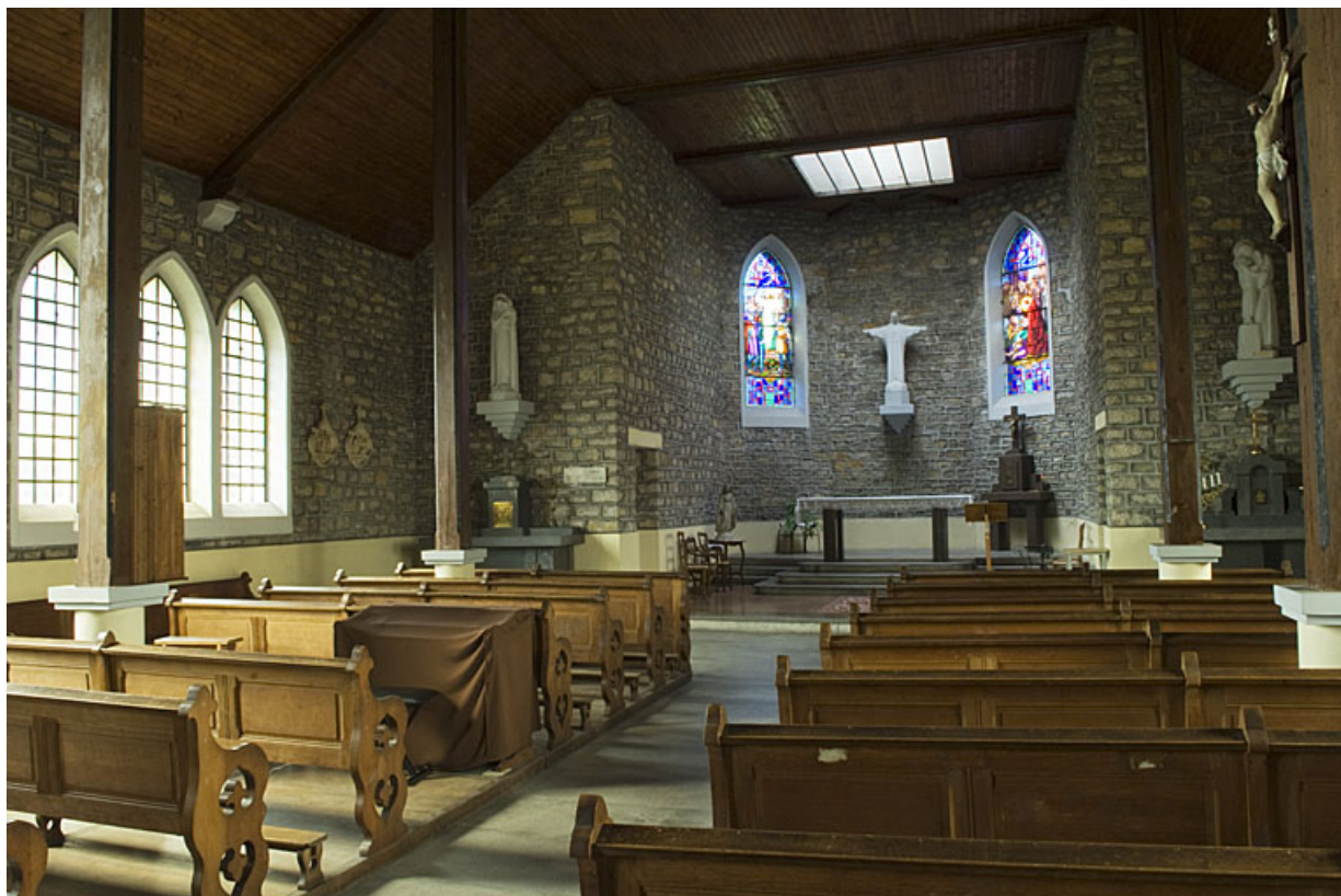
Intérieur : la nef en direction du choeur.

70, Faverney rue de la Gare, lieudit : Port-d'Atelier-Amance