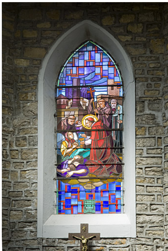
Verrière n° 2 : saint Charles Borromée donnant la communion aux pestiférés, par Benoît Frères, Nancy, 1938. Inscription : EN SOUVENIR DE CHARLES BESANCON.

70, Faverney rue de la Gare, lieudit : Port-d'Atelier-Amance