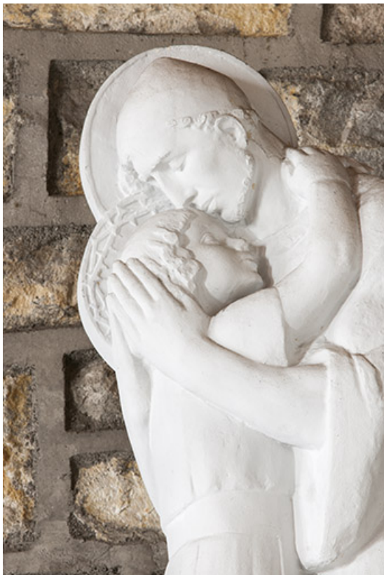
Statue de saint Joseph et l'Enfant, détail : vue en buste. 70, Faverney rue de la Gare, lieudit : Port-d'Atelier-Amance