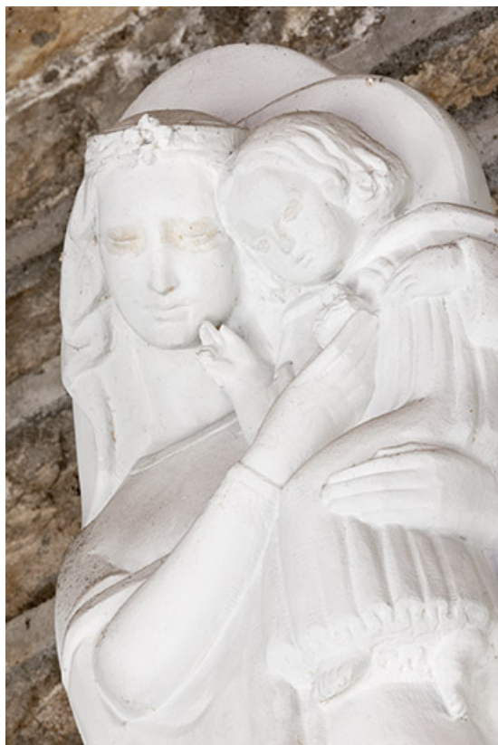
Statue de Vierge à l'Enfant, détail : vue en buste.

70, Faverney rue de la Gare, lieudit : Port-d'Atelier-Amance