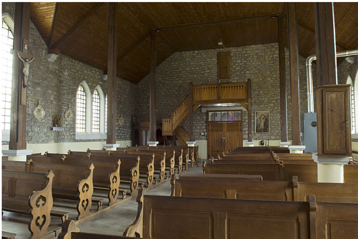
Intérieur : la nef en direction de l'entrée.

70, Faverney rue de la Gare, lieudit : Port-d'Atelier-Amance