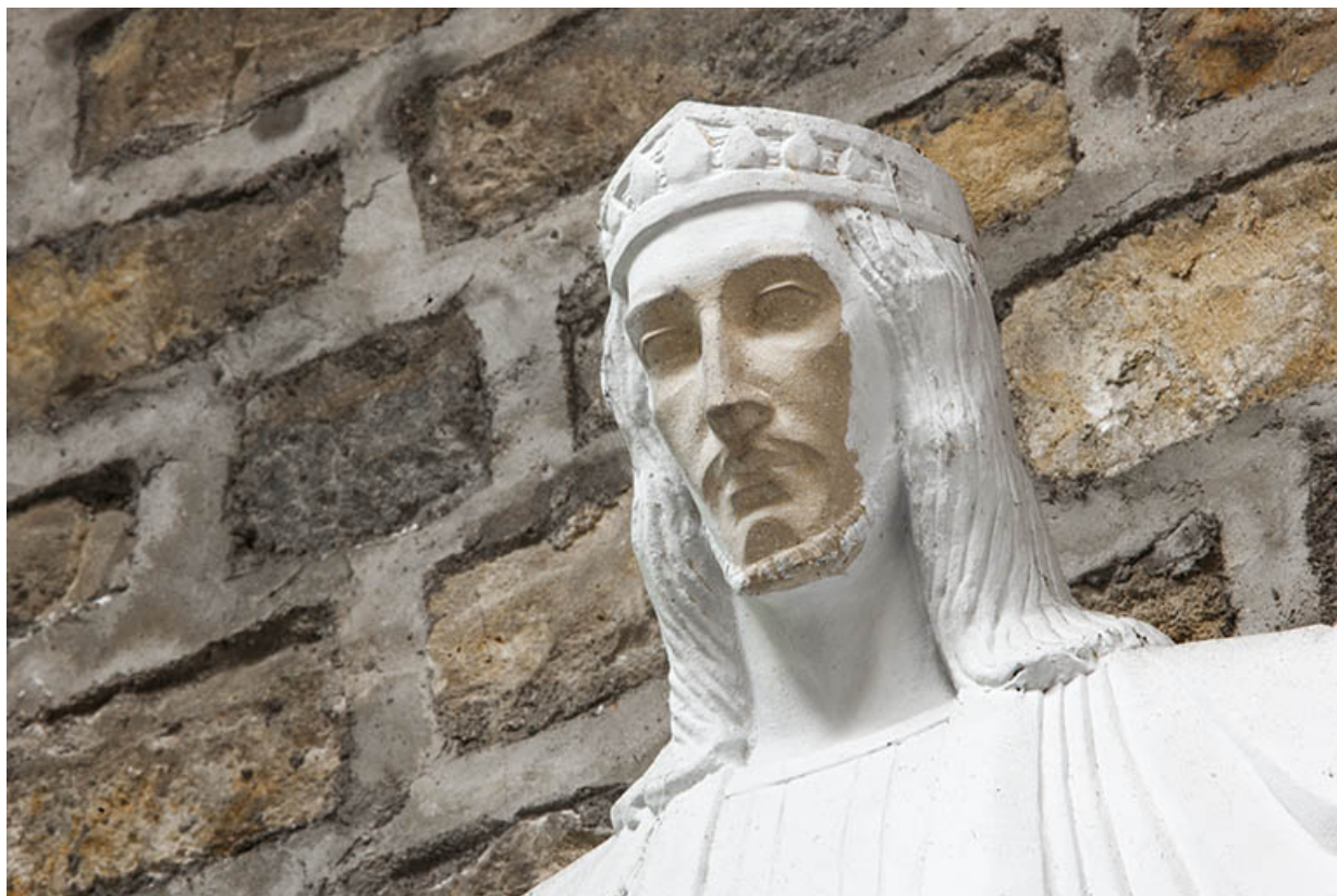
Statue du Sacré Coeur, détail : le visage.

70, Faverney rue de la Gare, lieudit : Port-d'Atelier-Amance