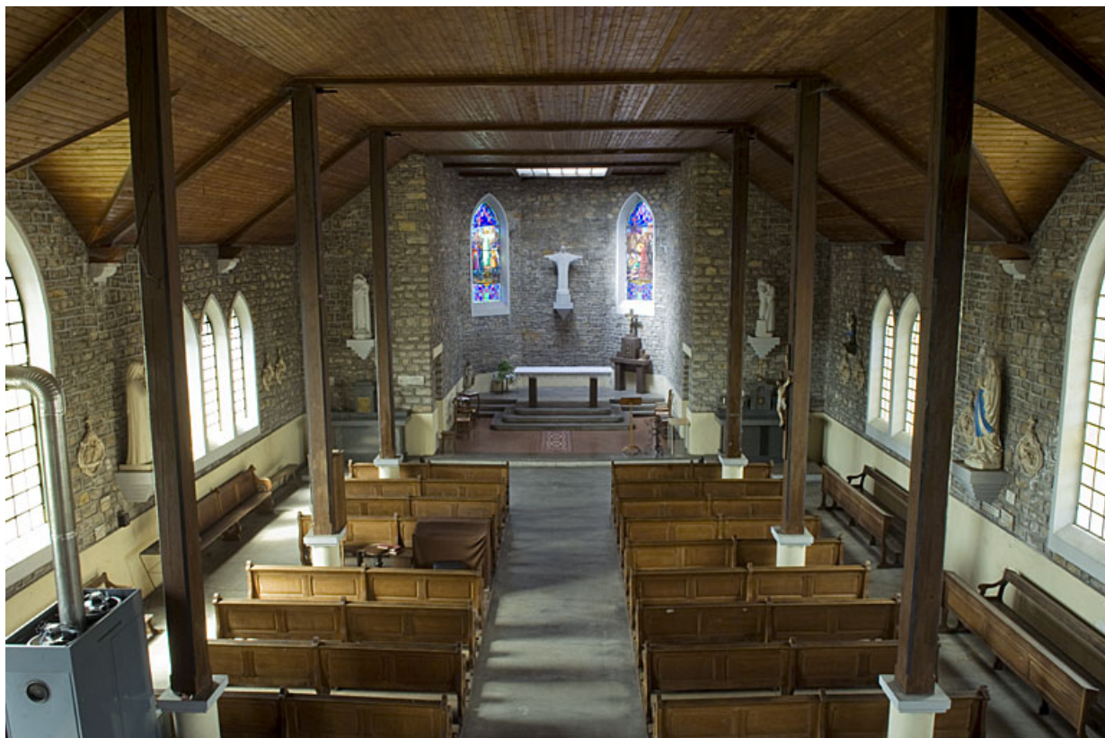
Intérieur : la nef et le choeur depuis la tribune.

70, Faverney rue de la Gare, lieudit : Port-d'Atelier-Amance