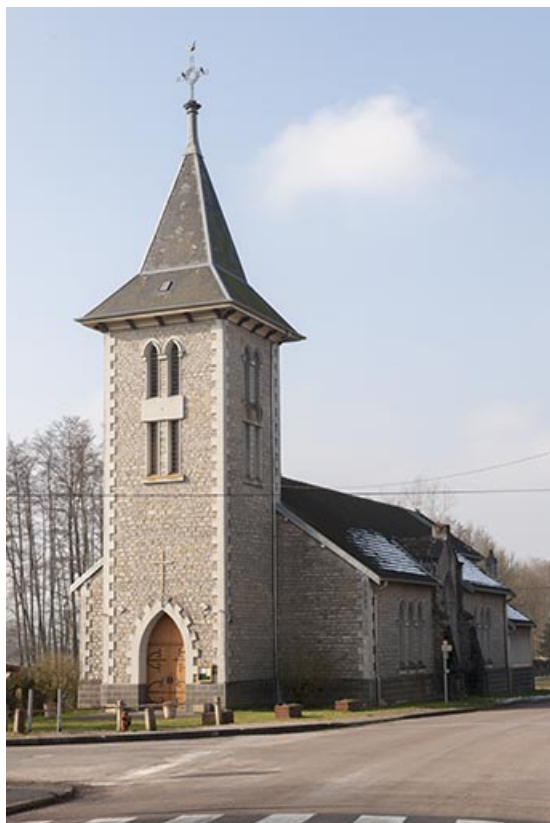
Façade antérieure, vue de trois quart droite.

70, Faverney rue de la Gare, lieudit : Port-d'Atelier-Amance