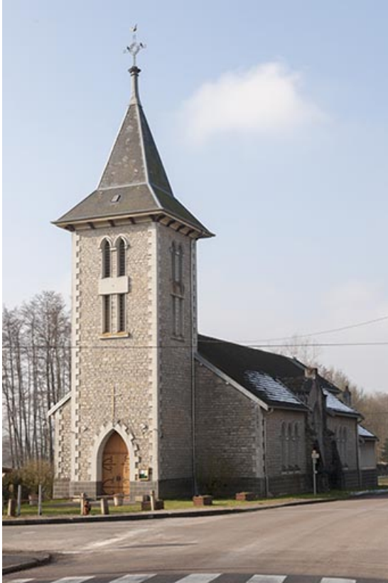
Façade antérieure, vue de trois quart droite.

70, Faverney rue de la Gare, lieudit : Port-d'Atelier-Amance