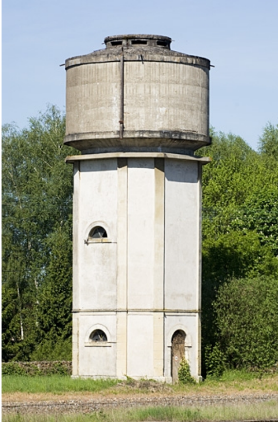
Le château d'eau.

70, Faverney rue de la Gare, lieudit : Port-d'Atelier-Amance