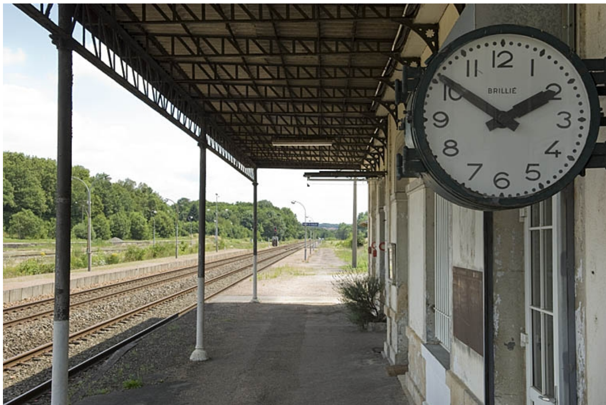
Bâtiment des voyageurs, détail : la pendule Brillié.

70, Faverney rue de la Gare, lieudit : Port-d'Atelier-Amance