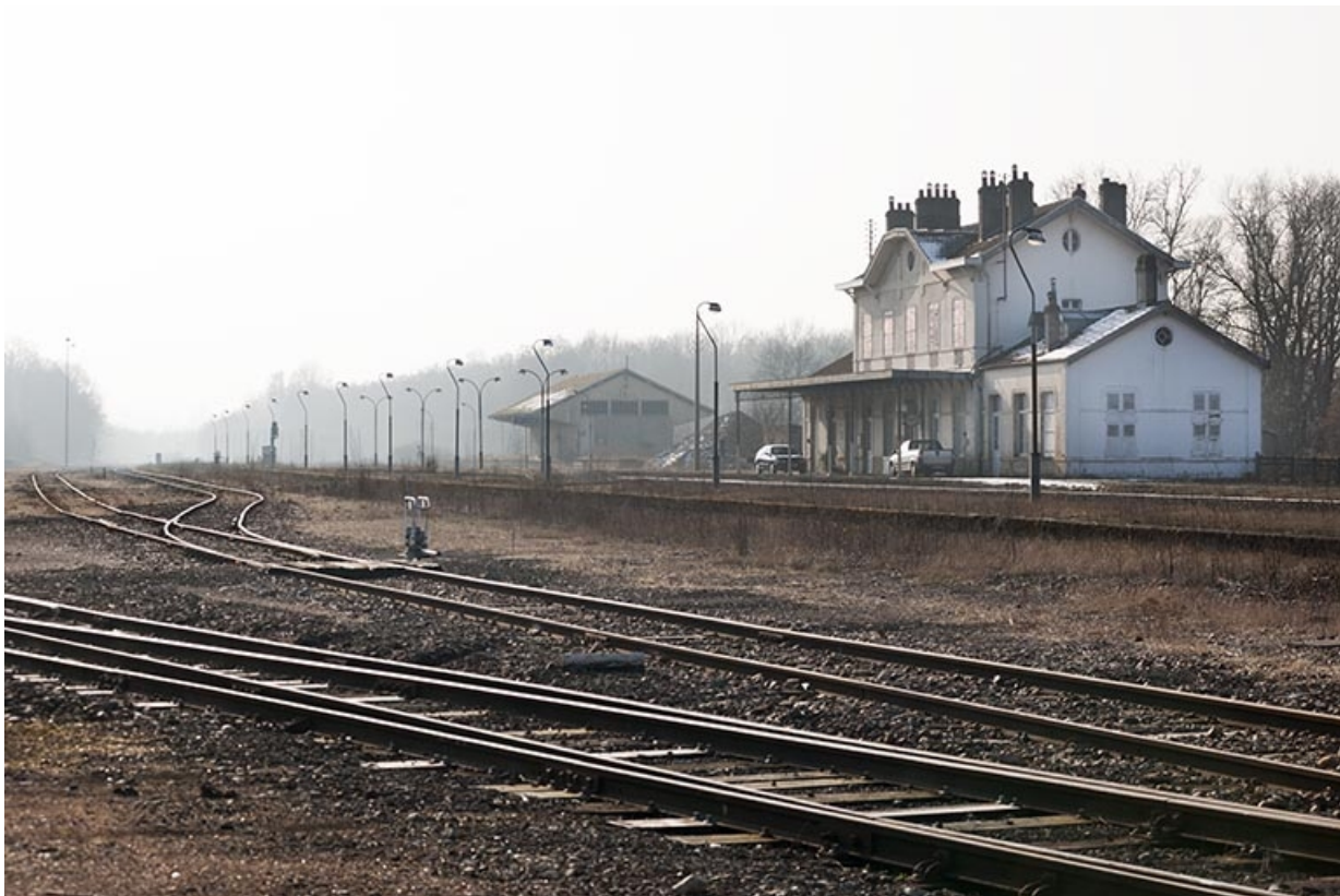
Vue d'ensemble de la gare des voyageurs et de celle des marchandises.