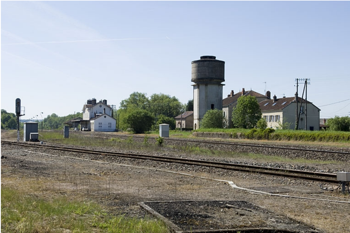
Vue générale du site depuis le nord.