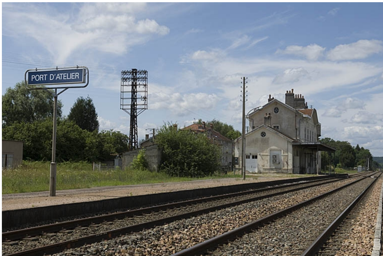
Vue générale du bâtiment des voyageurs depuis le sud-est.

70, Faverney rue de la Gare, lieudit : Port-d'Atelier-Amance