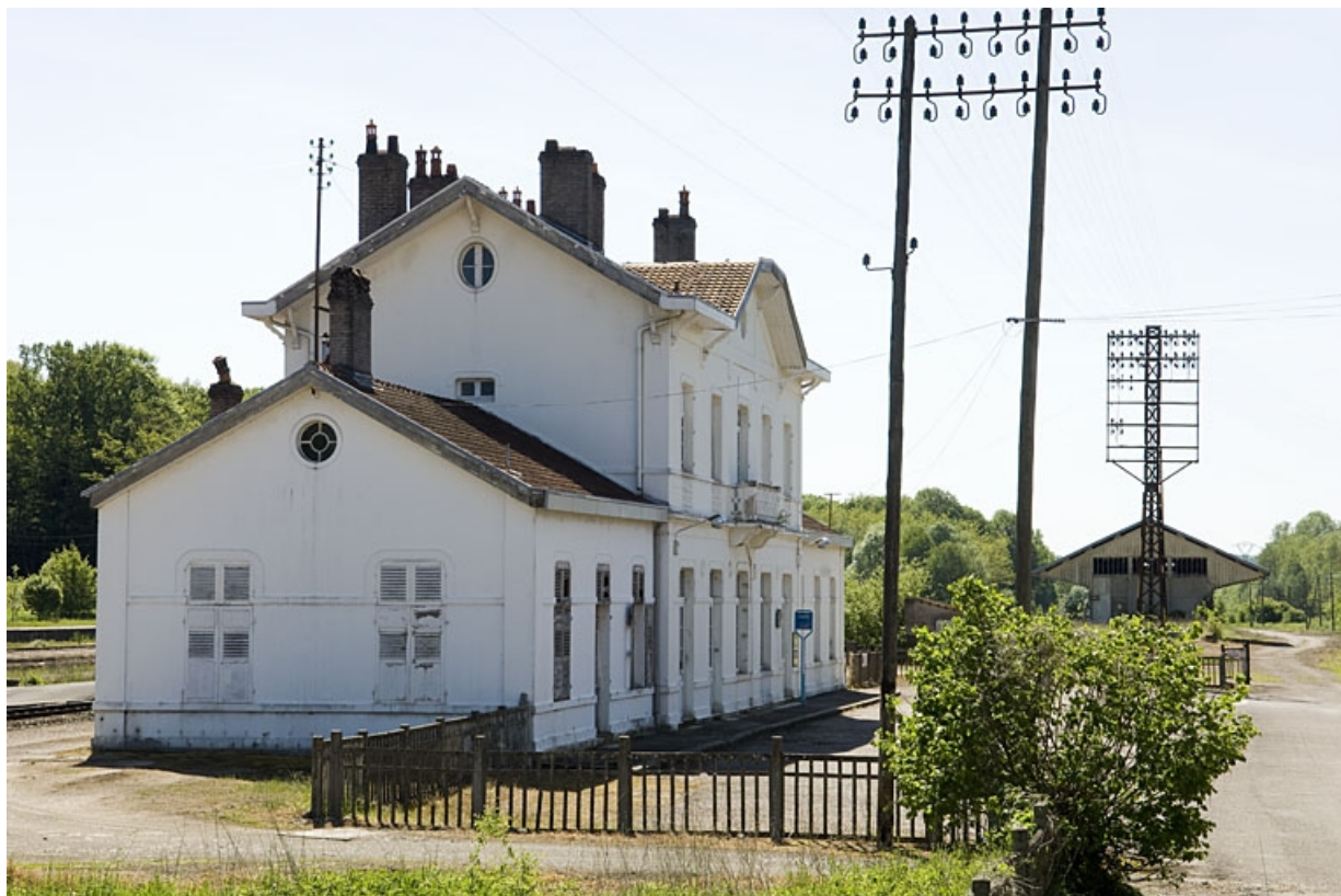
Bâtiment des voyageurs : vue de trois quarts depuis l'esplanade.

70, Faverney rue de la Gare, lieudit : Port-d'Atelier-Amance