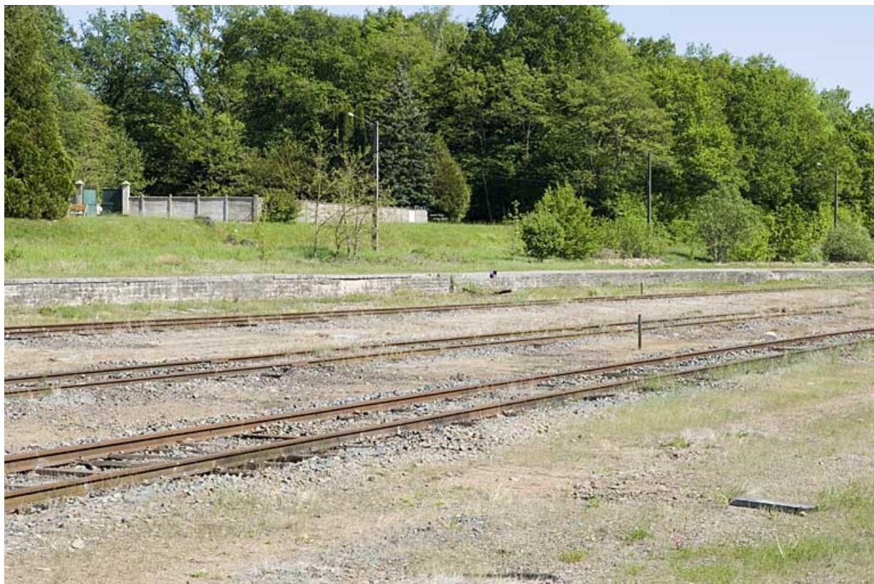
Quai de la voie XIV.