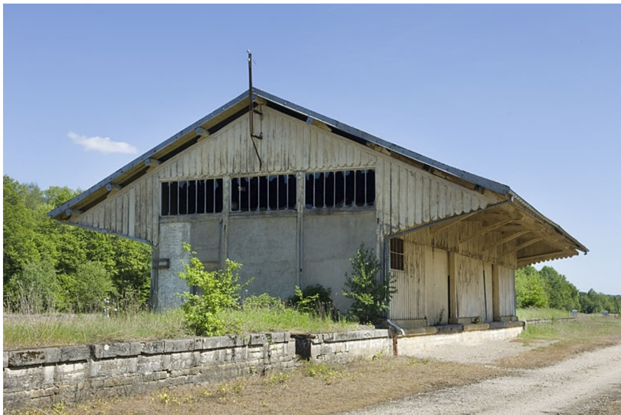
Gare des marchandises vue de trois-quarts.

70, Faverney rue de la Gare, lieudit : Port-d'Atelier-Amance