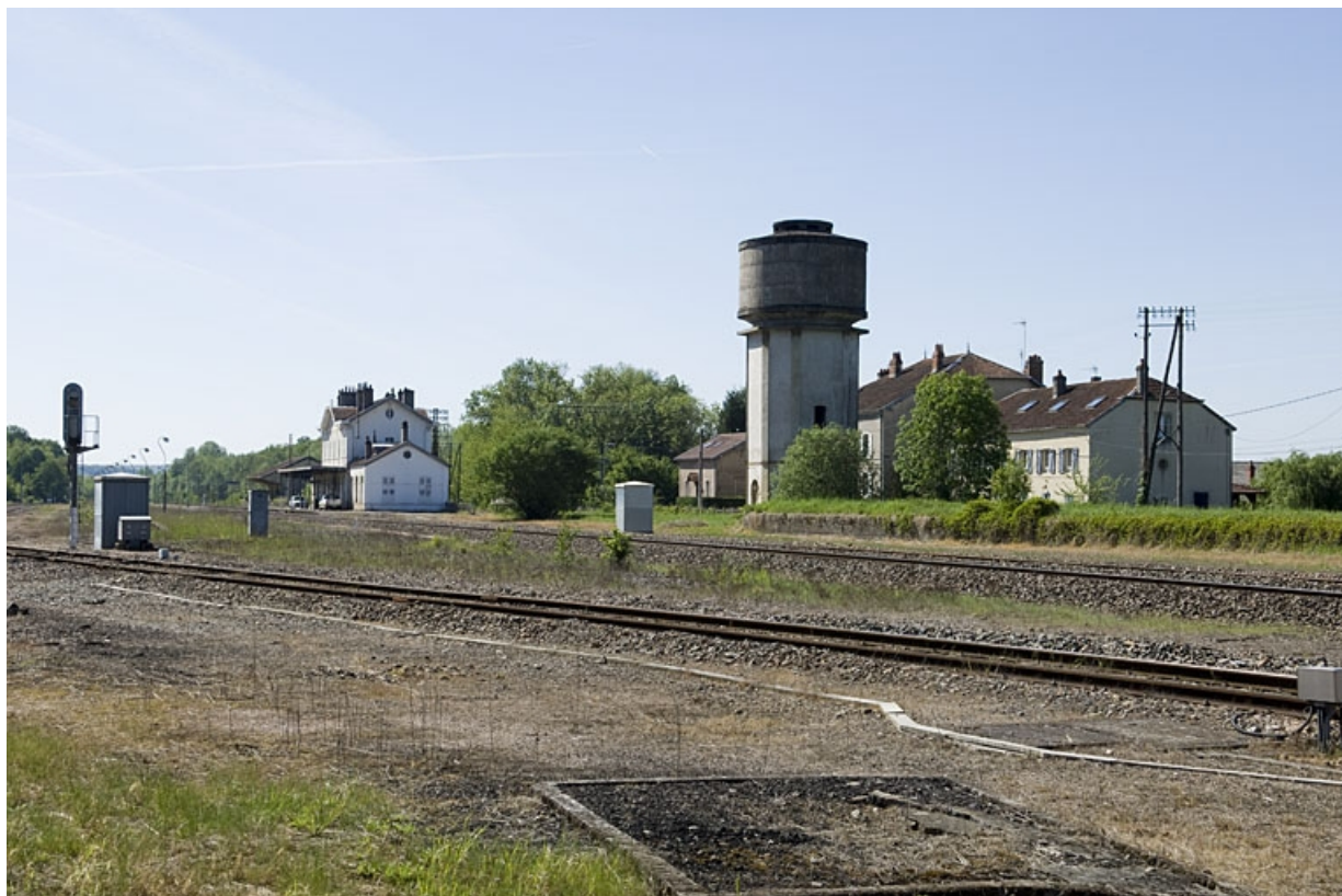
Vue générale du site depuis le nord.