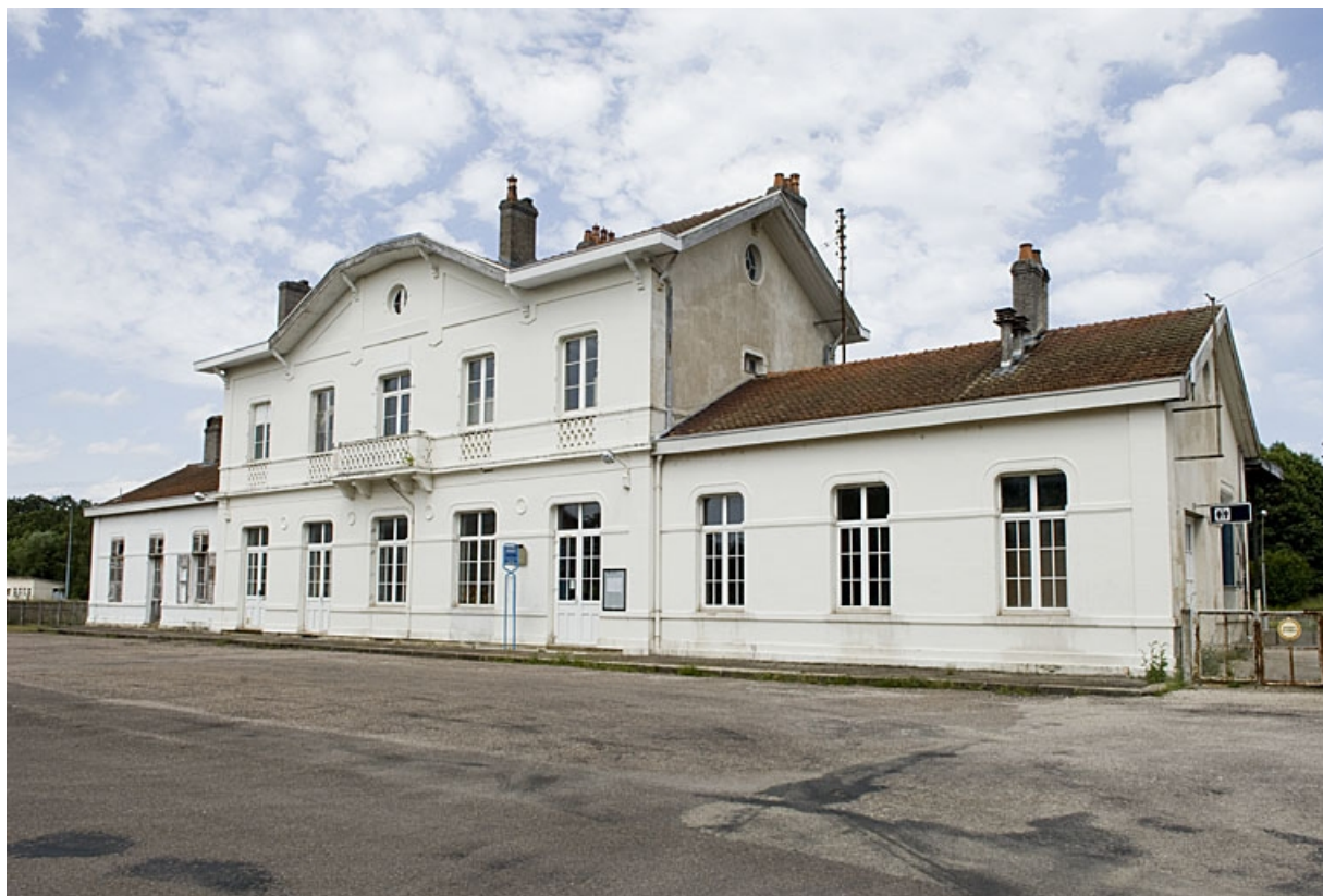
Bâtiment des voyageurs : vue générale depuis l'esplanade.

70, Faverney rue de la Gare, lieudit : Port-d'Atelier-Amance