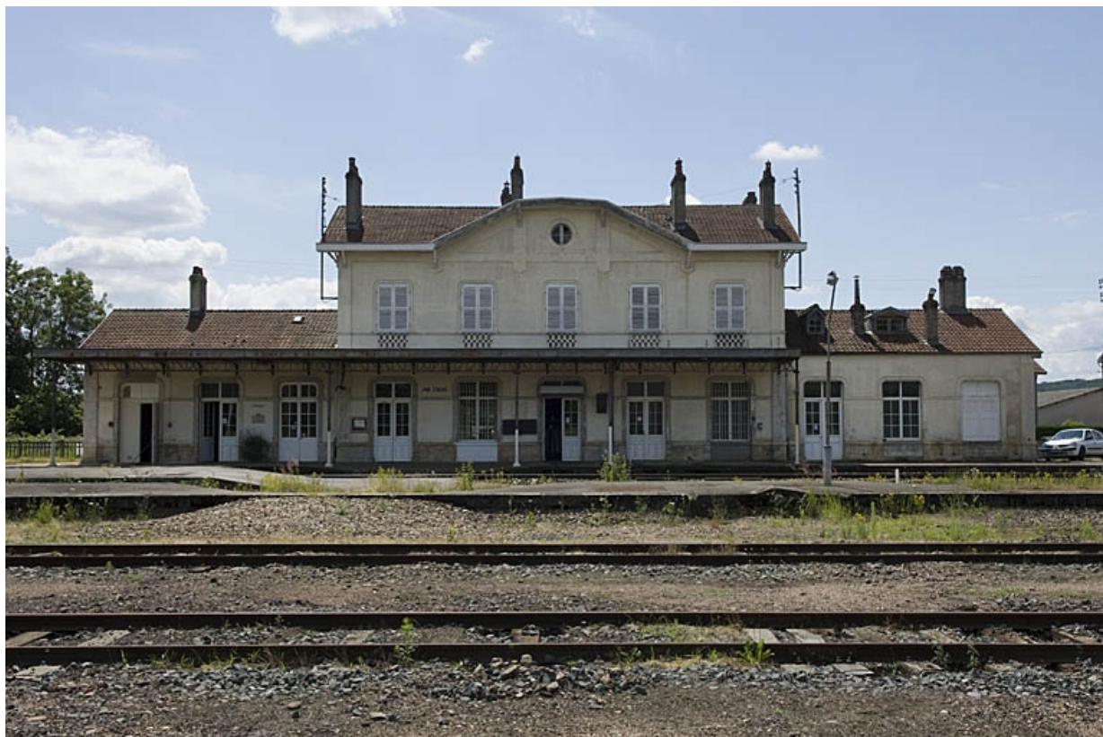
Bâtiment des voyageurs : vue générale depuis les voies.

70, Faverney rue de la Gare, lieudit : Port-d'Atelier-Amance