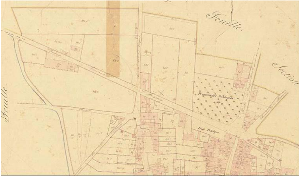
L'emplacement de l'hôtel de ville sur le cadastre de 1837