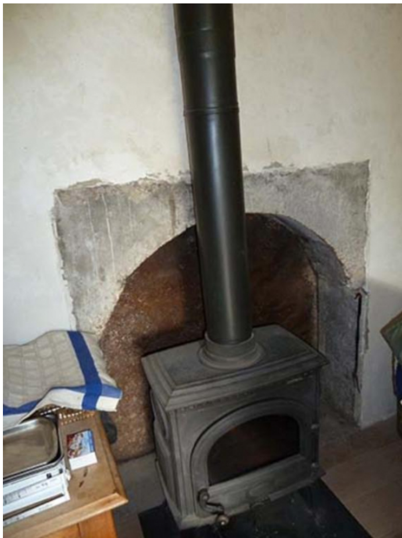
Le poêle, vue du revers de la cheminée du rez-de-chaussée 70, Gy, 30 rue des Capucins