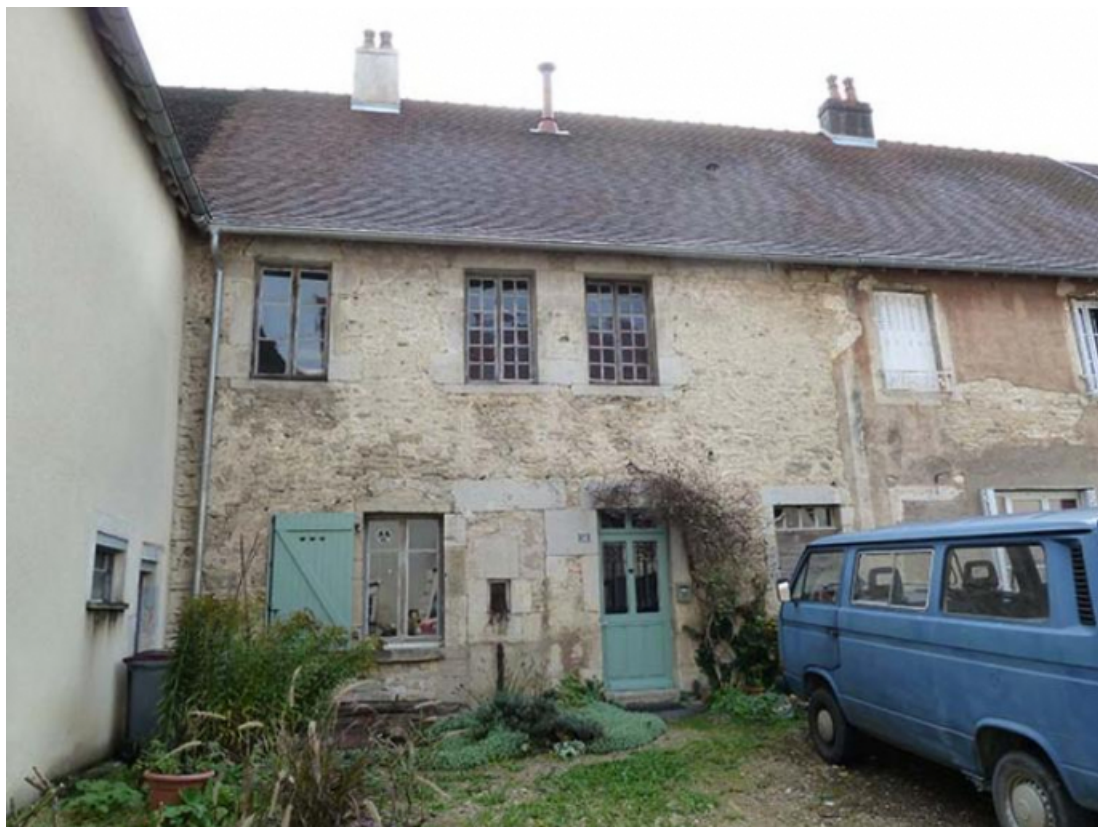
Vue générale nord-ouest