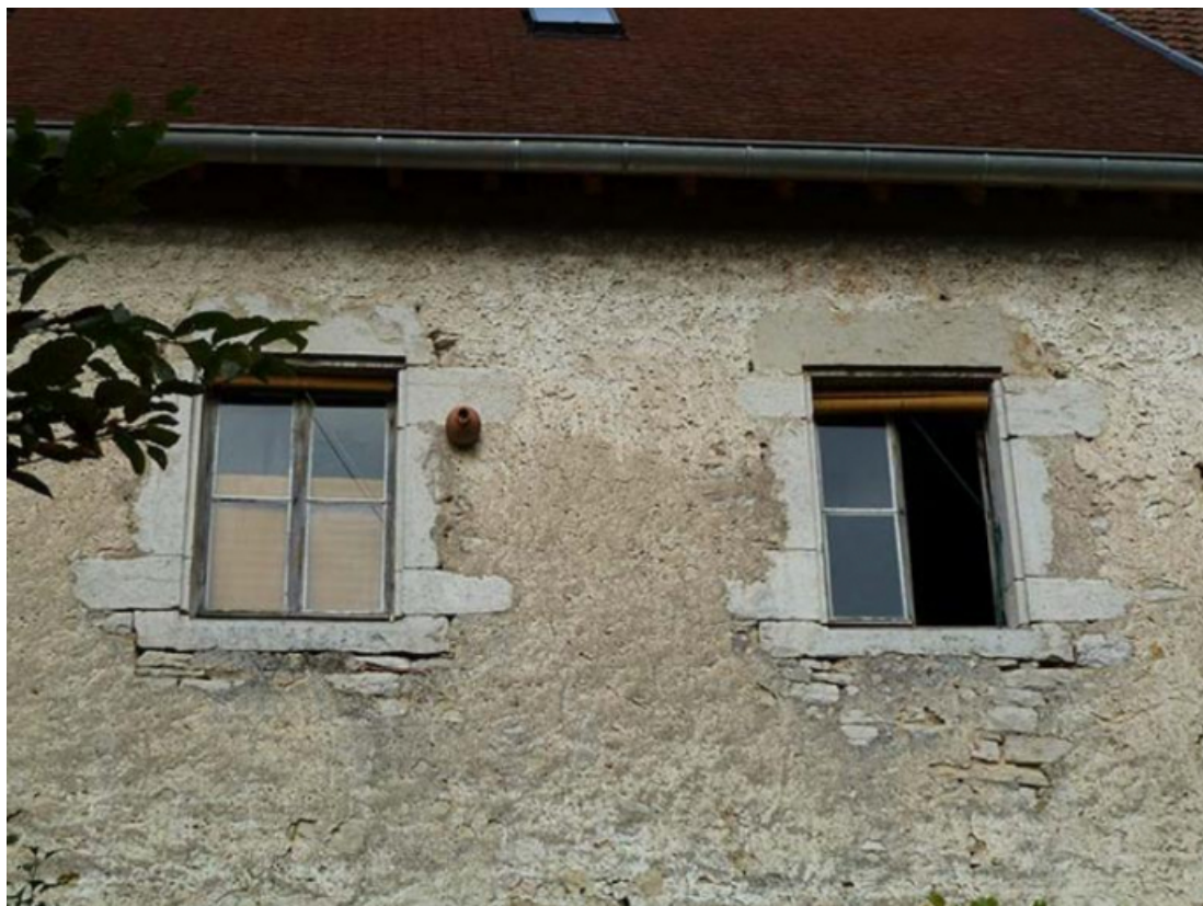
Détail des baies de l'étage de la façade sud