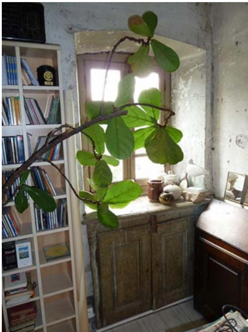
Baie de la façade sud, étage 70, Gy, 30 rue des Capucins