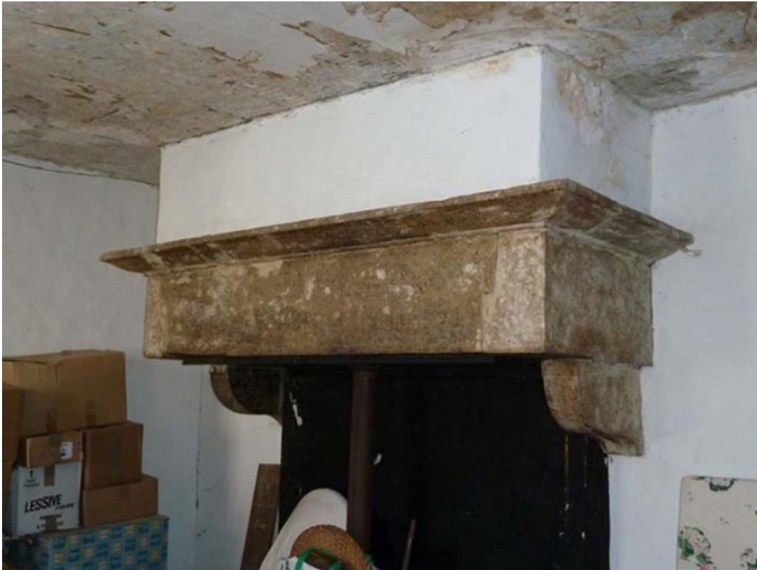
Cheminée de l'étage