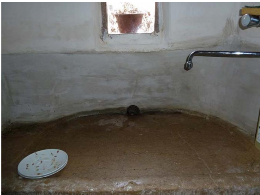
Détail de la pierre d'évier