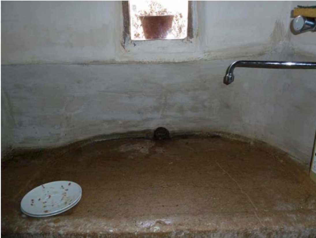
Détail de la pierre d'évier