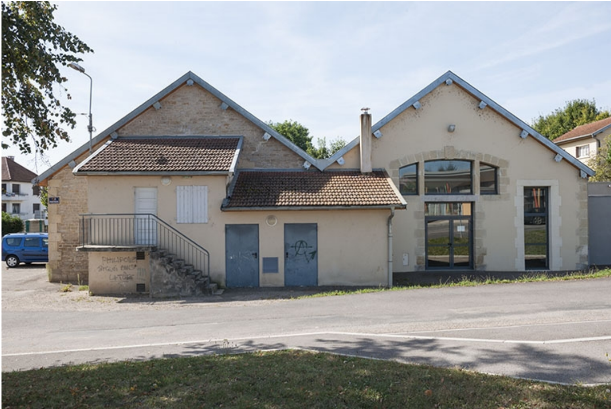
Vue d'ensemble des deux anciennes écuries.