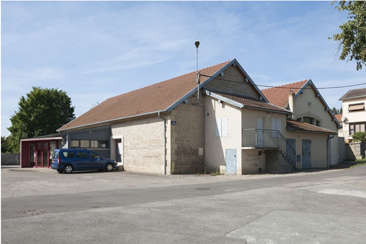
Les deux anciennes écuries, actuellement salle des fêtes.