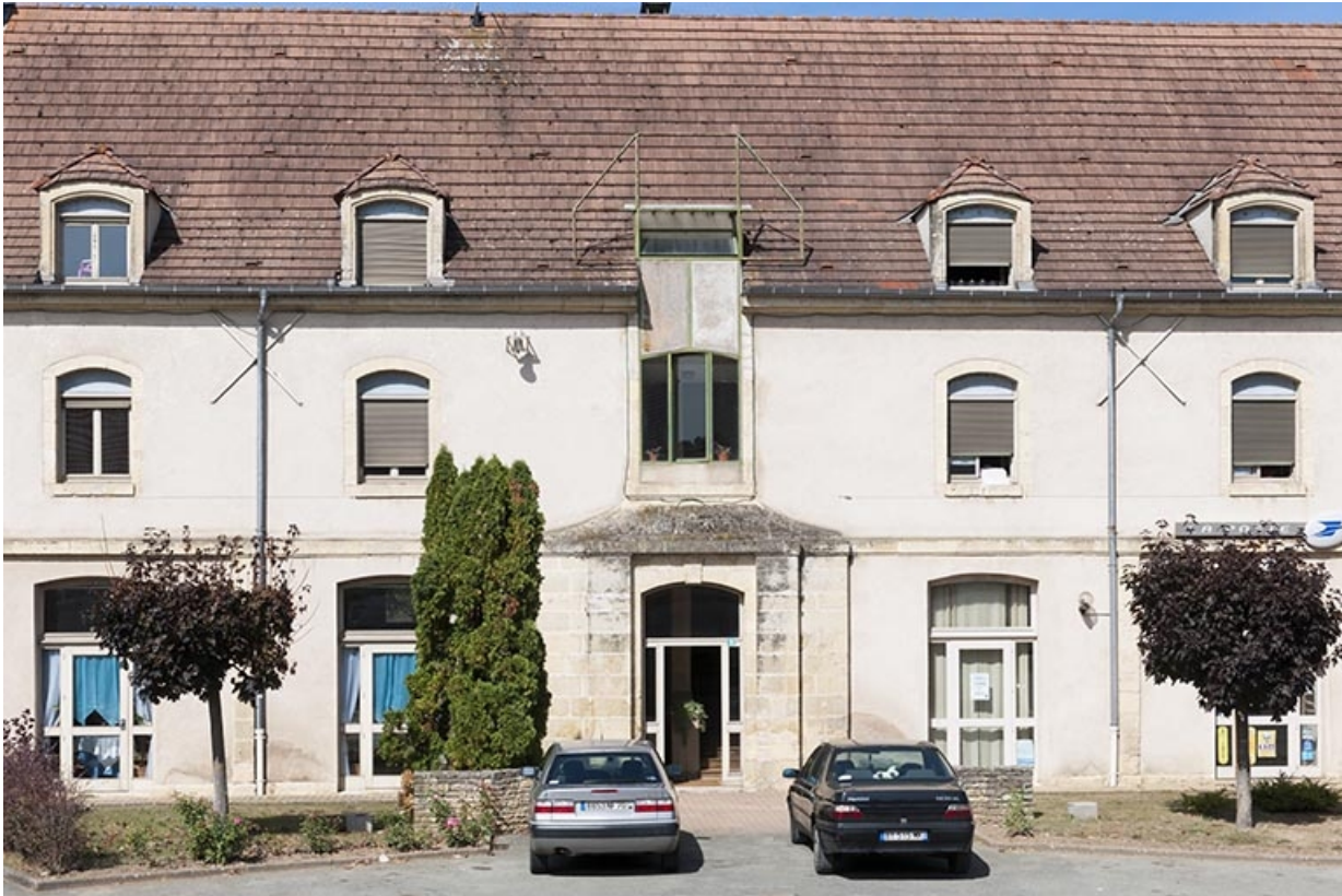
Façade antérieure : le corps central.