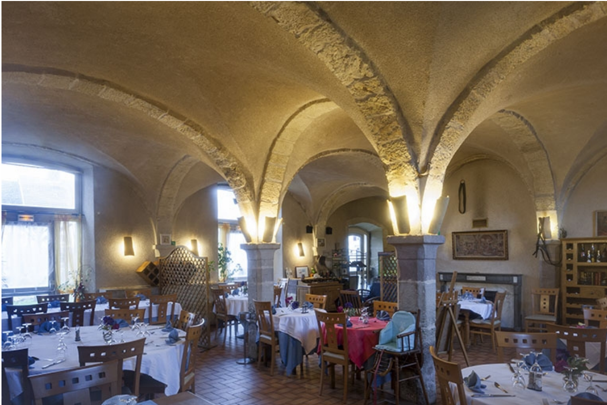
Intérieur : vue de trois quart depuis l'entrée.