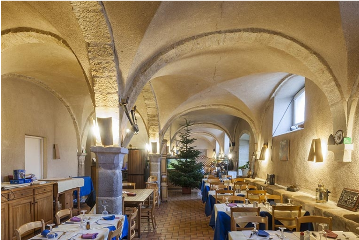
Intérieur : vue prise du fond de la salle.