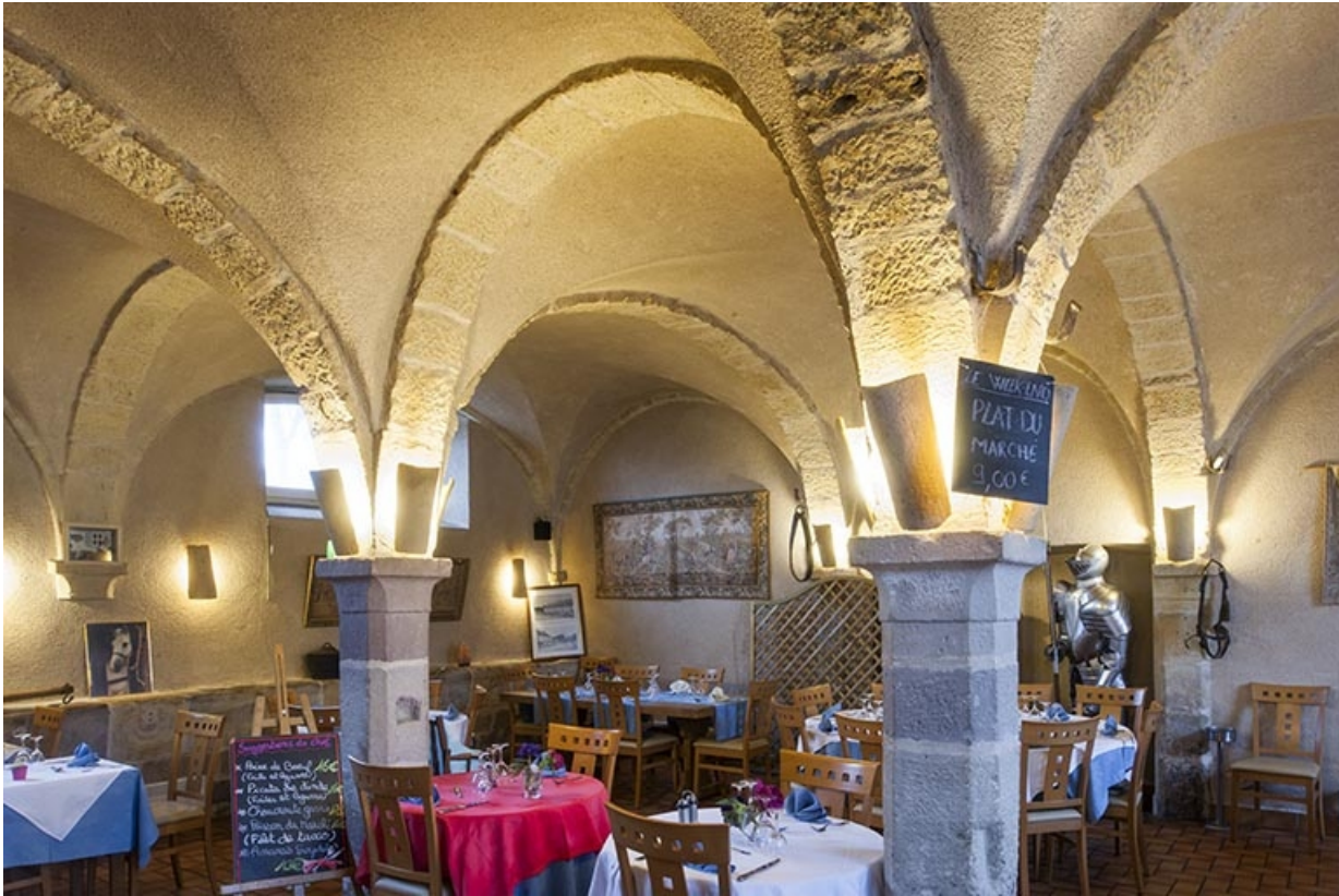
Intérieur : vue depuis l'entrée de trois quart rapprochée.