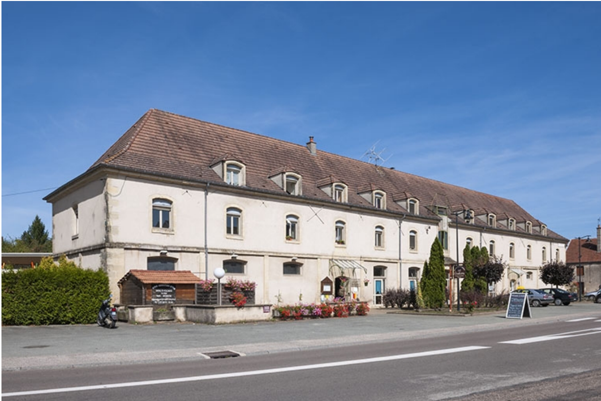
Vue de trois quarts depuis la place Charles de Gaulle.