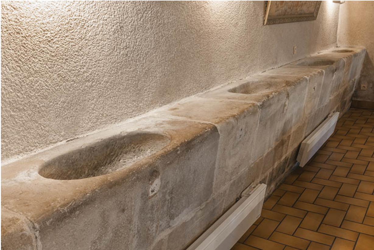
Intérieur : vue partielle des auges.