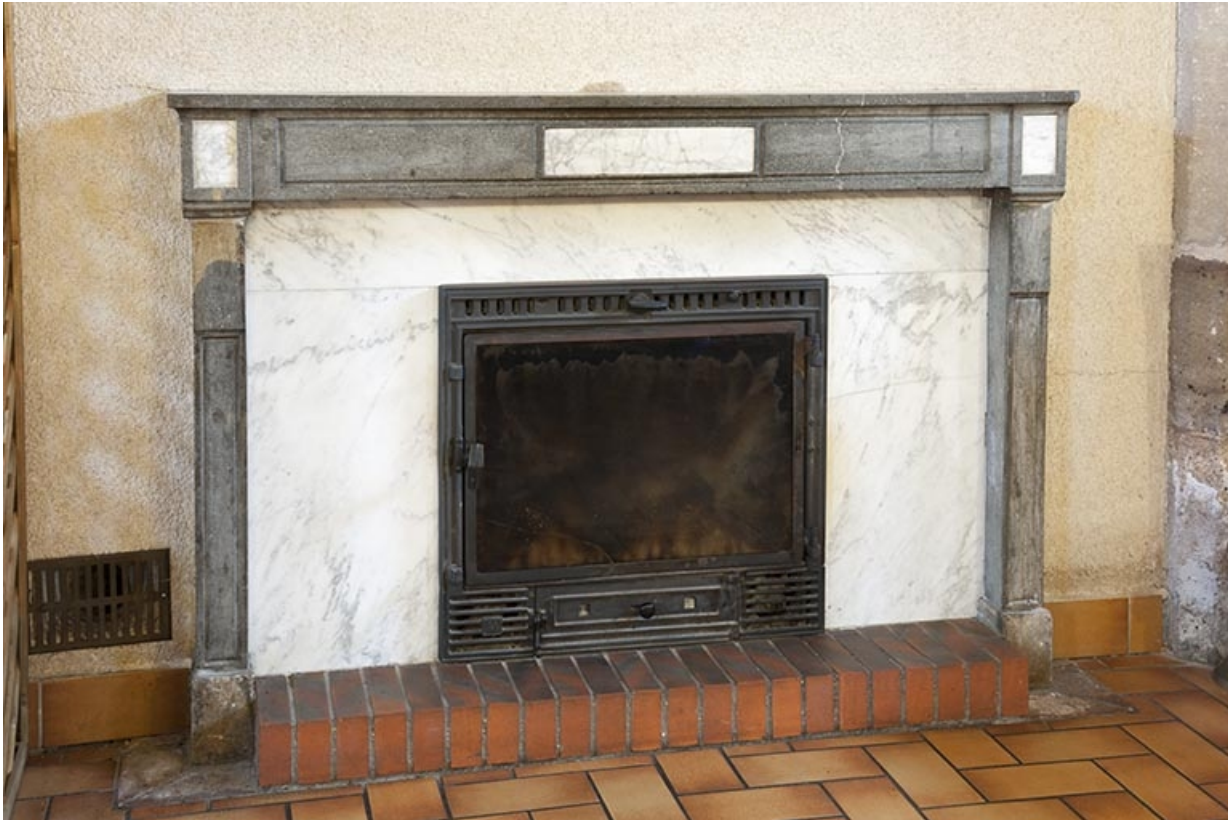
Intérieur : la cheminée.