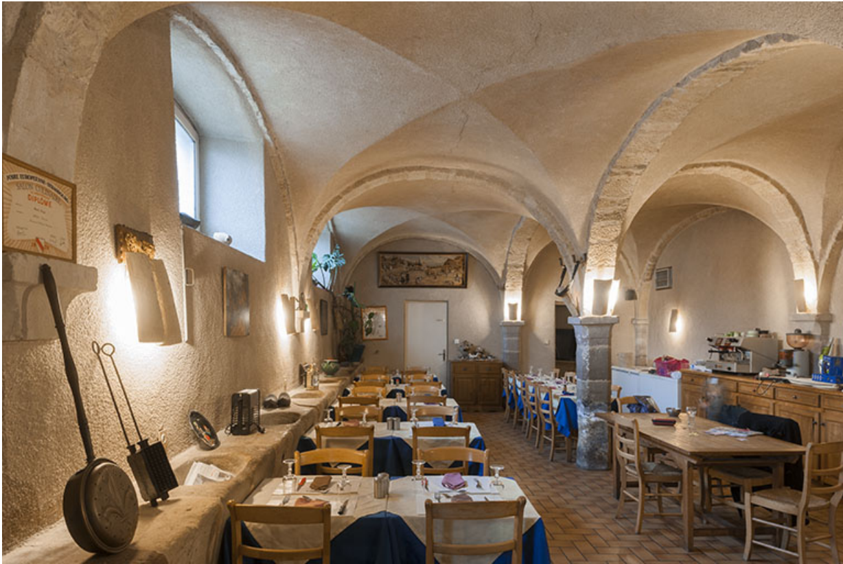
Intérieur : vue depuis l'entrée.