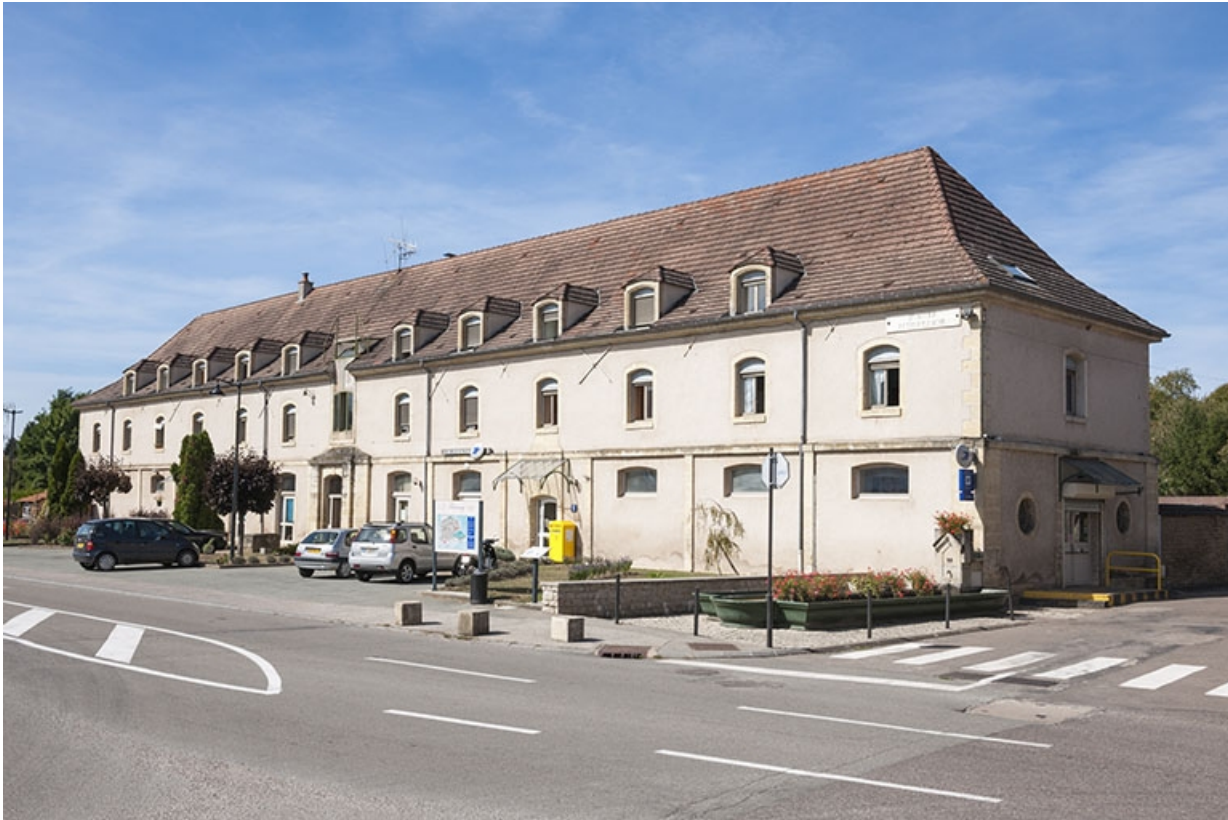
Vue de trois quart à l'angle de la place du Général de Gaulle et de la rue Catinat.