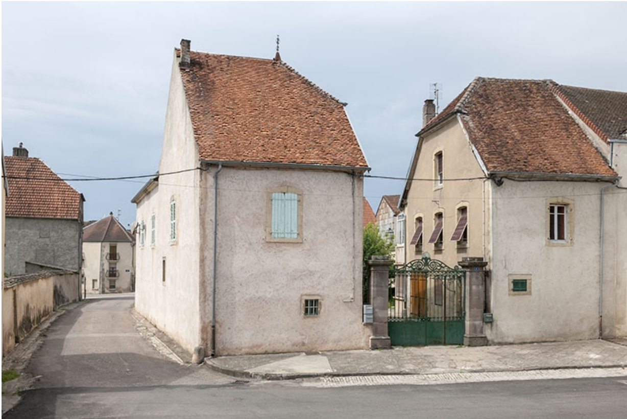
Vue d'ensemble à l'angle de la rue Bayard et de la place de la République.

70, Faverney, 6, 8 place de la République