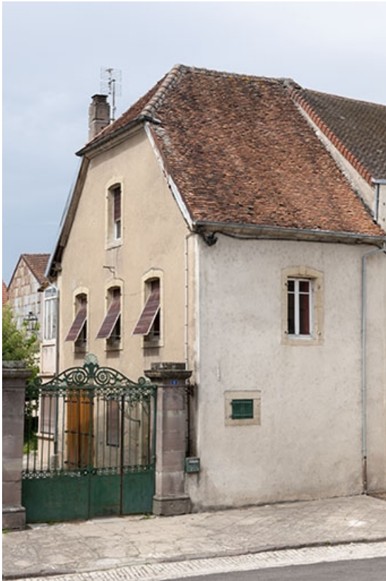
Partie droite de l'ancienne grange, actuellement occupée par des logements.

70, Faverney, 6, 8 place de la République