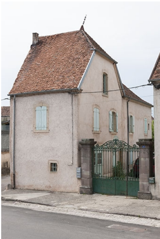
Partie gauche de l'ancienne grange, actuellement occupée par des logements.

70, Faverney, 6, 8 place de la République