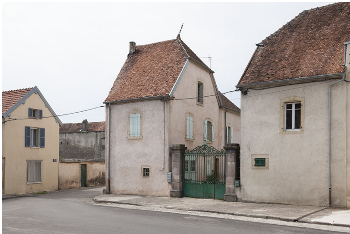
Vue d'ensemble depuis la place de la République.

70, Faverney, 6, 8 place de la République