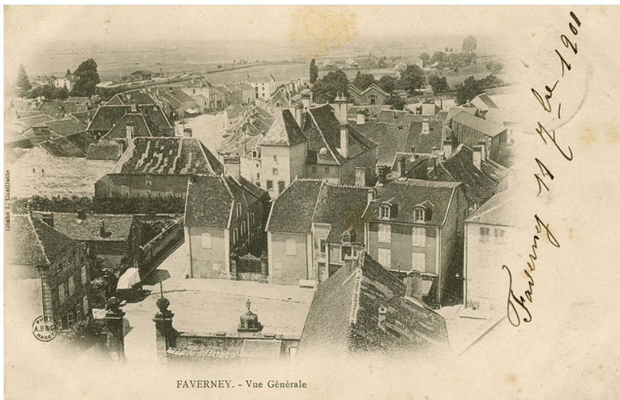
Demeure dite hôtel de Citey, puis château de Poinctes, carte postale, date manuscrite 11 septembre 1901

70, Faverney, 6, 8 place de la République