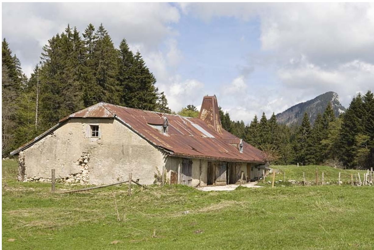
Vue générale de la Bécasse et de l'Aiguillon de Baulmes. 25, Jougne