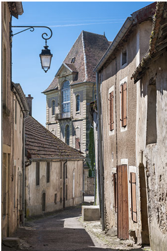
Maisons, rue d'Enfer (en direction de la rue de l'Official). 25, Jougne