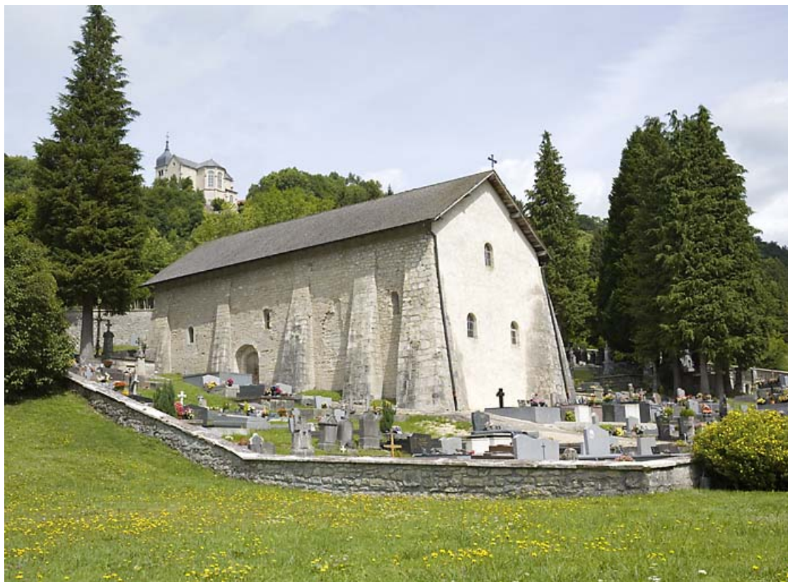
Jougne (Doubs) : chapelle Saint-Maurice.