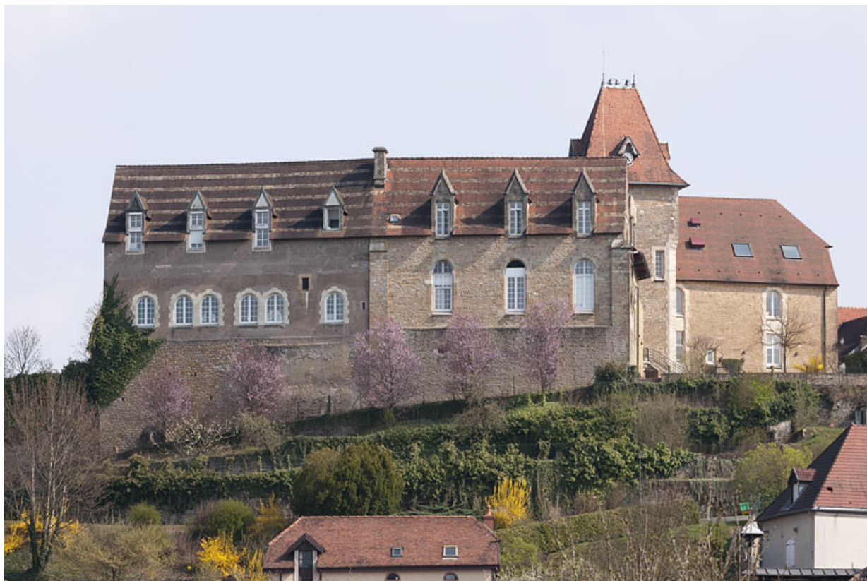
Bâtiment (C) et chapelle (D), vue depuis le village. 25, Jougne