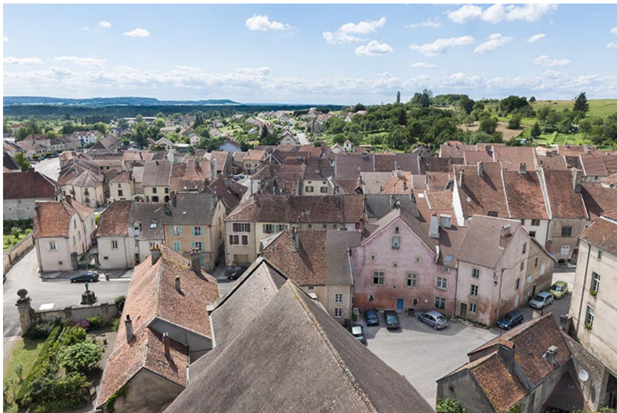
Le village (place Sainte-Gude, rue Pradier, rue Thiers et au-delà en direction d'Amance), depuis la tour du grand clocher. 25, Jougne