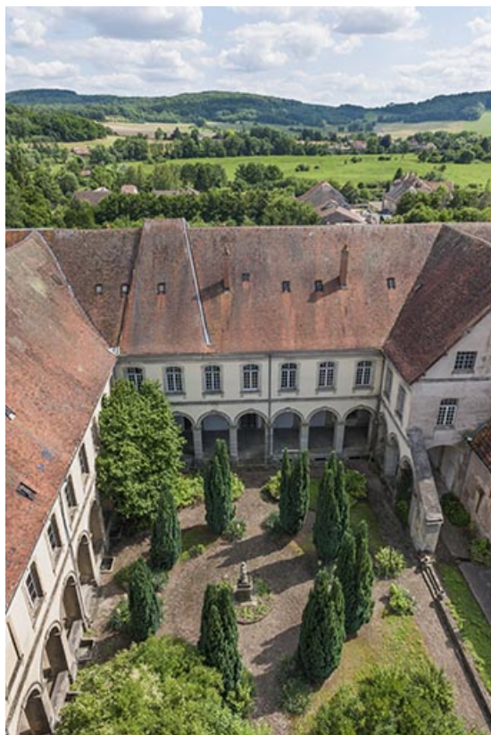
Vue générale du cloître depuis le grand clocher sud-ouest. 25, Jougue