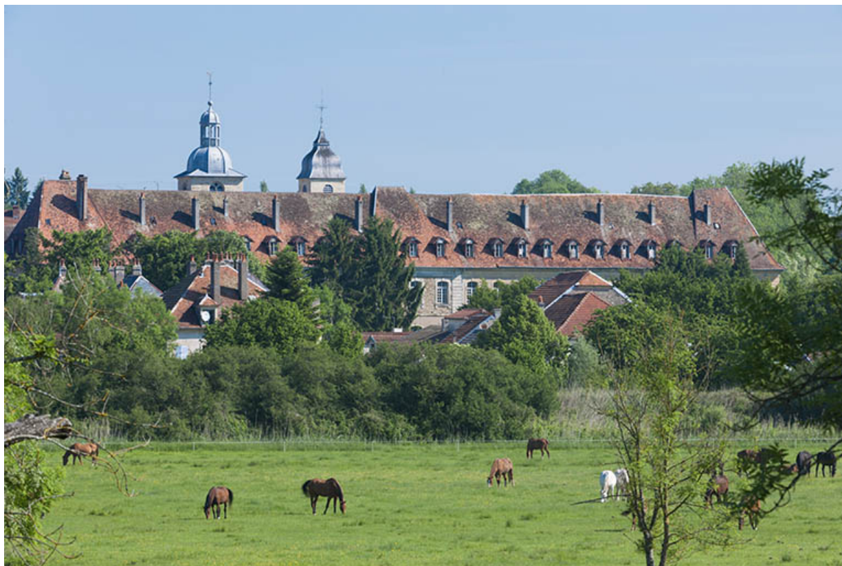
Vue générale rapprochée depuis le sud. 25, Jougne