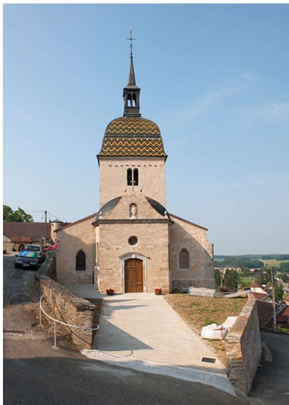
Vue de la façade principale.