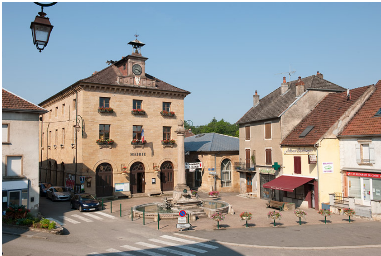
Vue générale de trois quart gauche. 25, Jougne