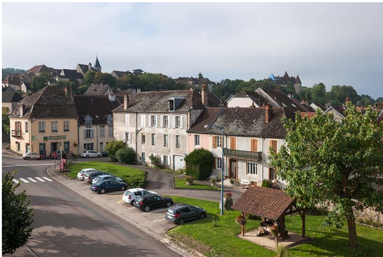
Place de l'hôtel de ville 70, Gy