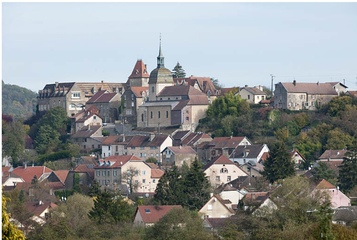
La ville et l'église, vues de l'ouest.