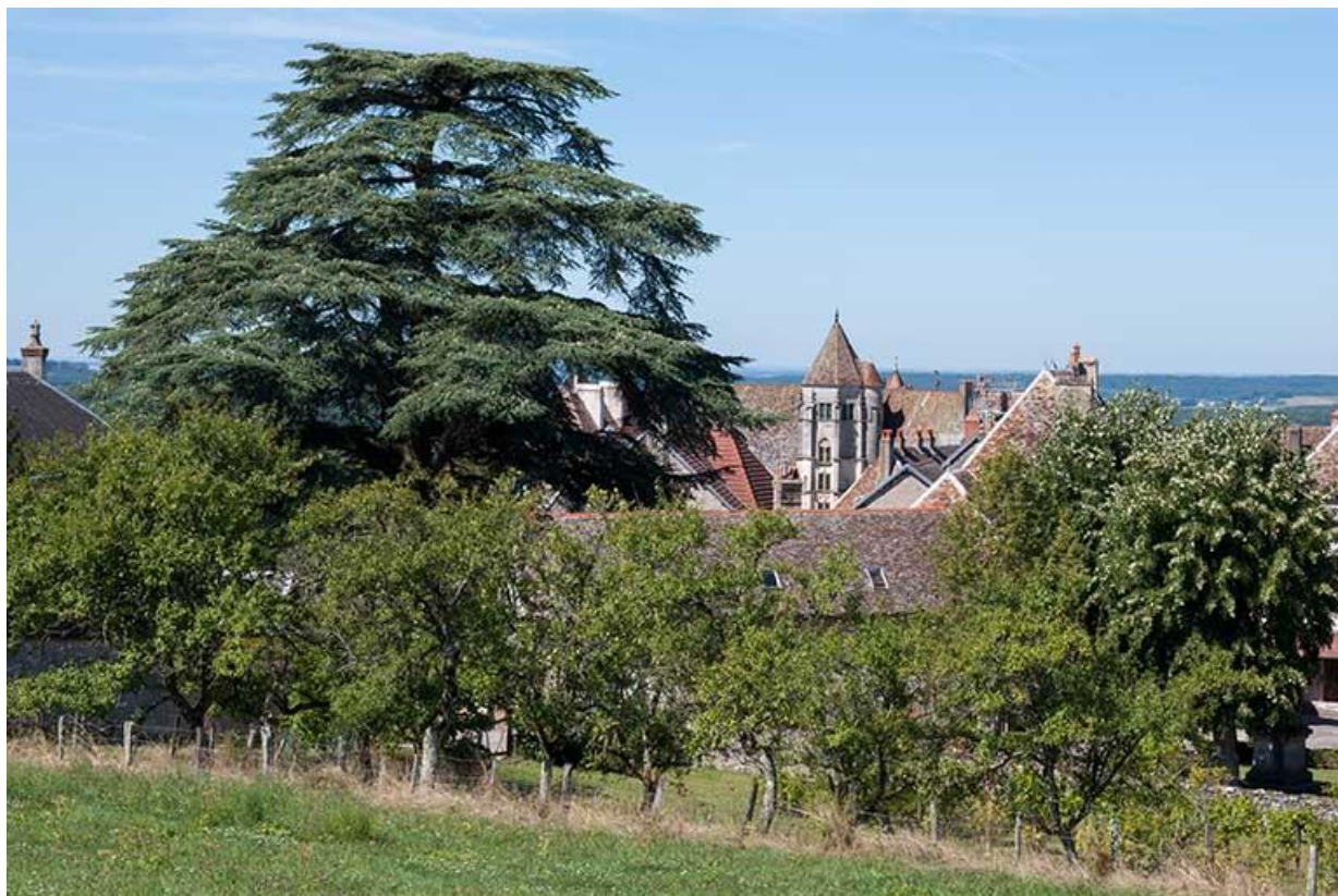
Vue générale sud