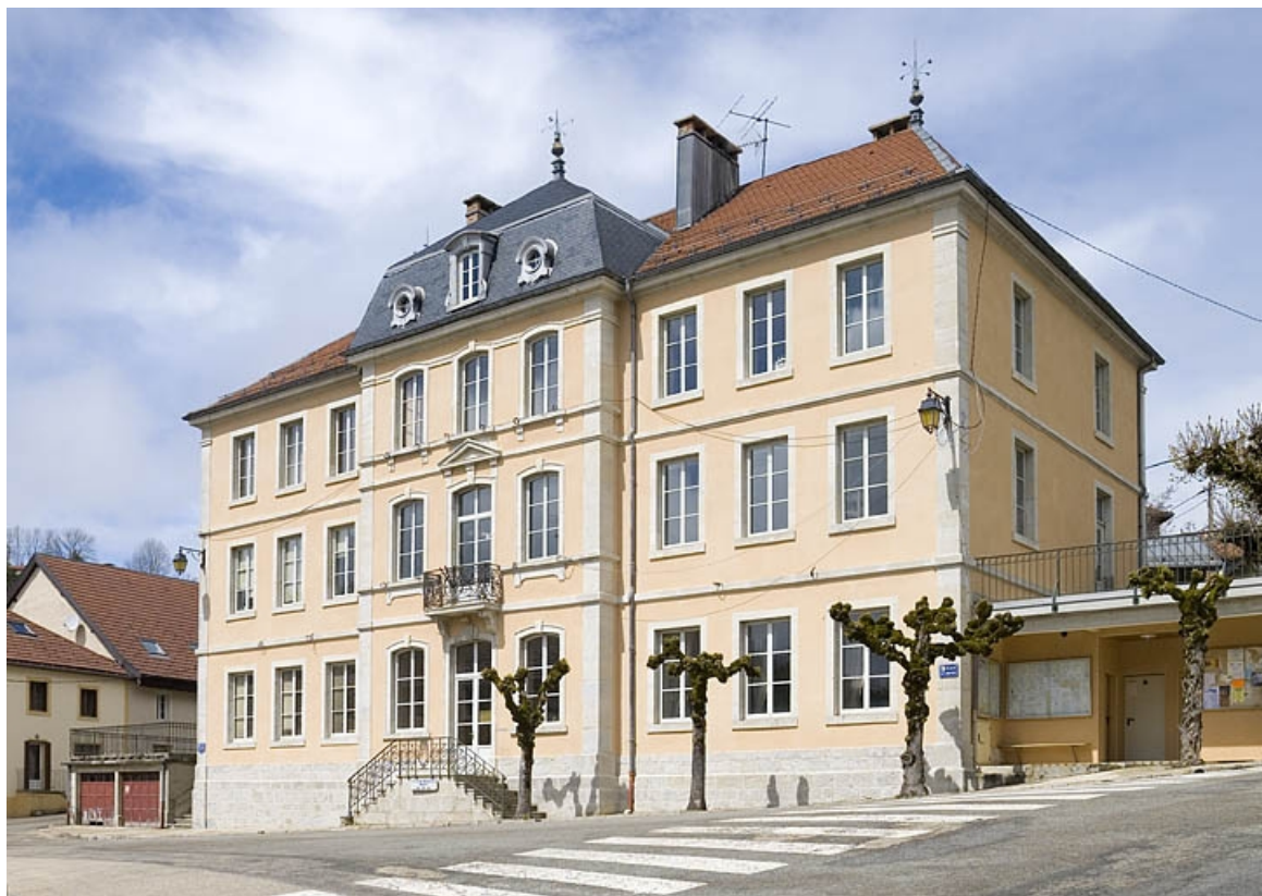
Façade antérieure et façade latérale droite. 25, Jougne place de la Mairie