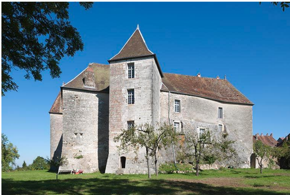
Vue générale ouest 70, Gy