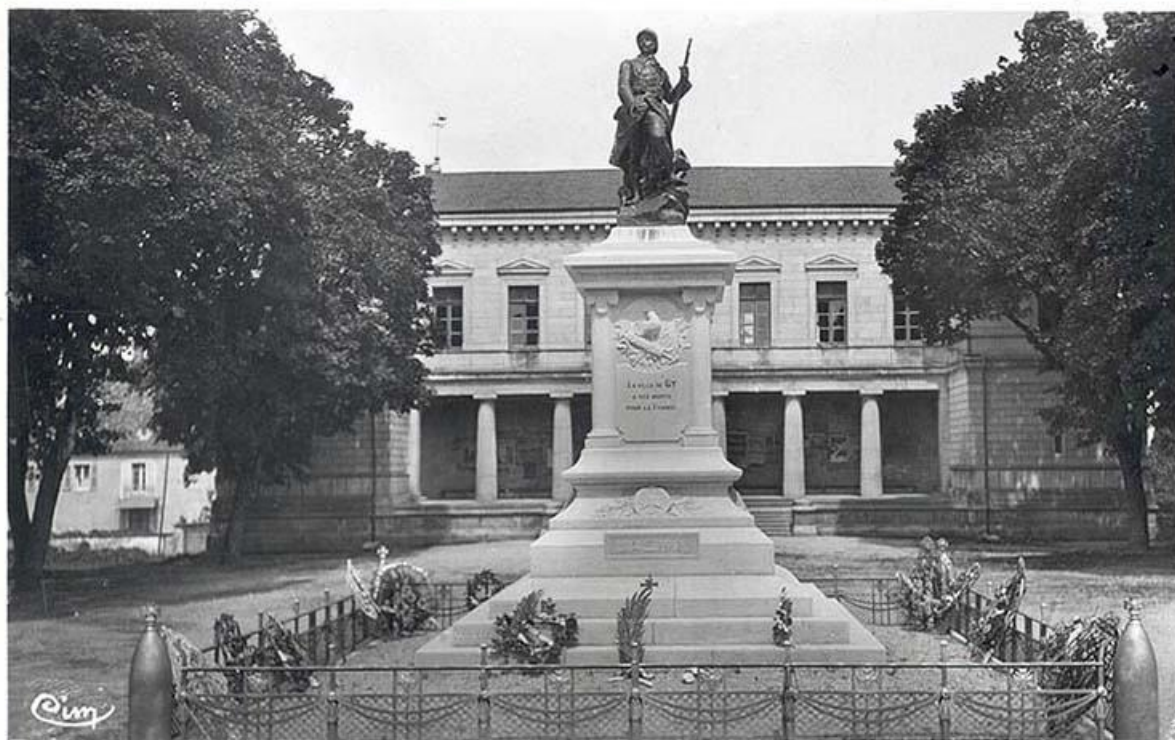
L'hôtel de ville et le monument aux morts