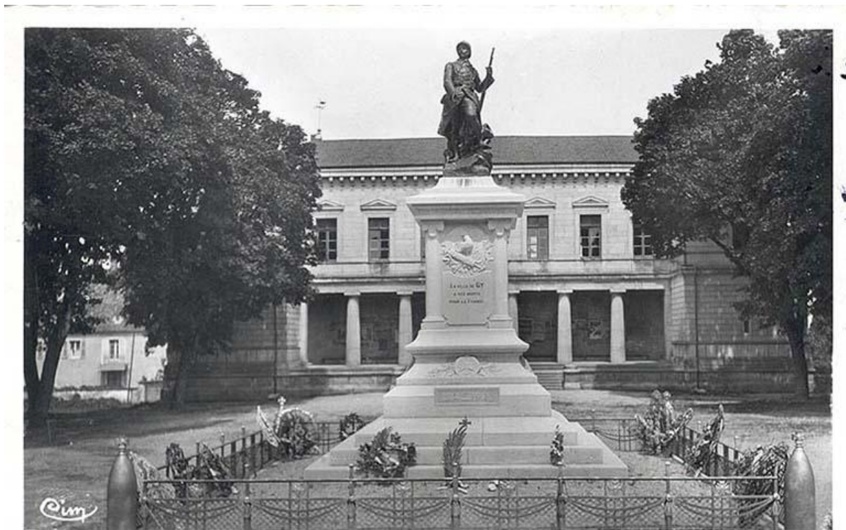
L'hôtel de ville et le monument aux morts