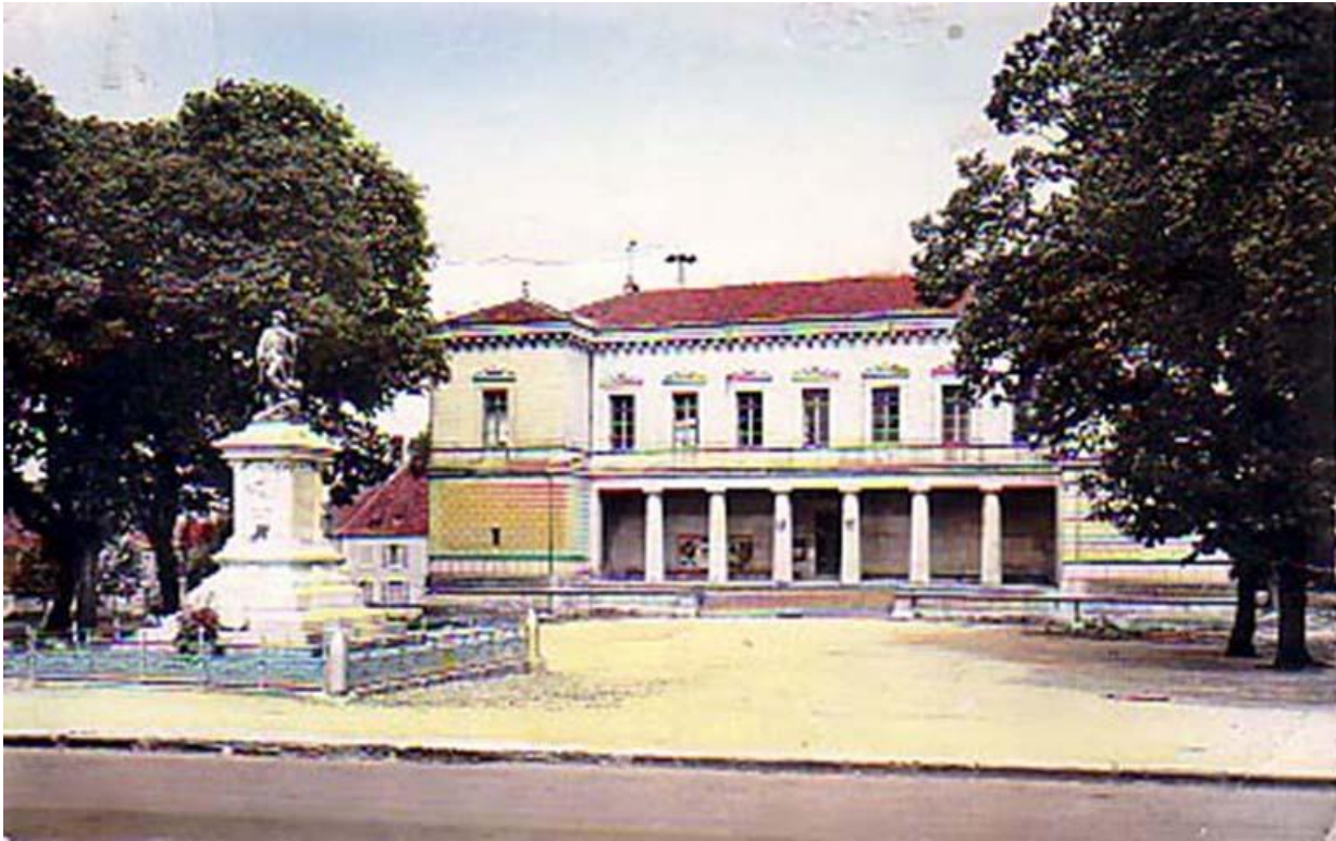
L'hôtel de ville et la monument aux morts sur une carte postale