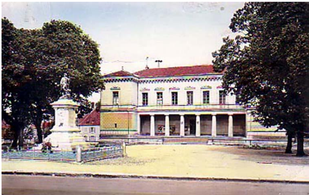
L'hôtel de ville et la monument aux morts sur une carte postale