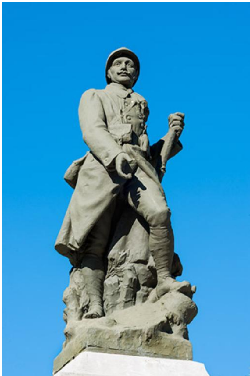
Détail de la statue du poilu