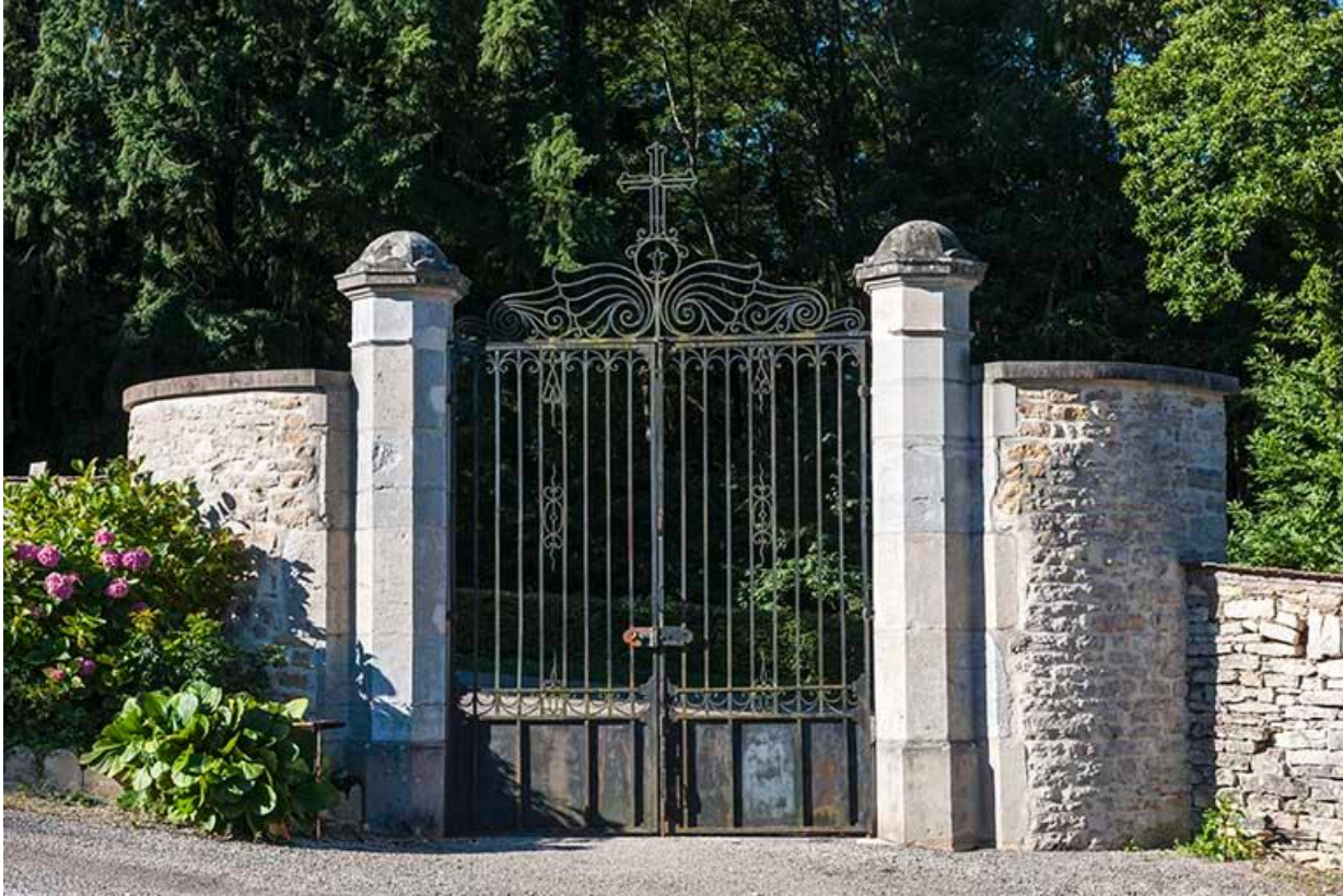
Le portail d'entrée depuis l'intérieur du cimetière