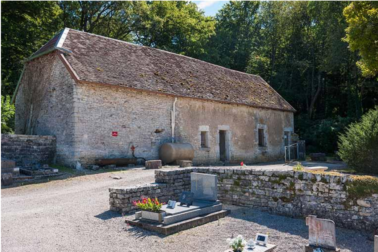
Ancienne ferme située au sud-ouest du cimetière