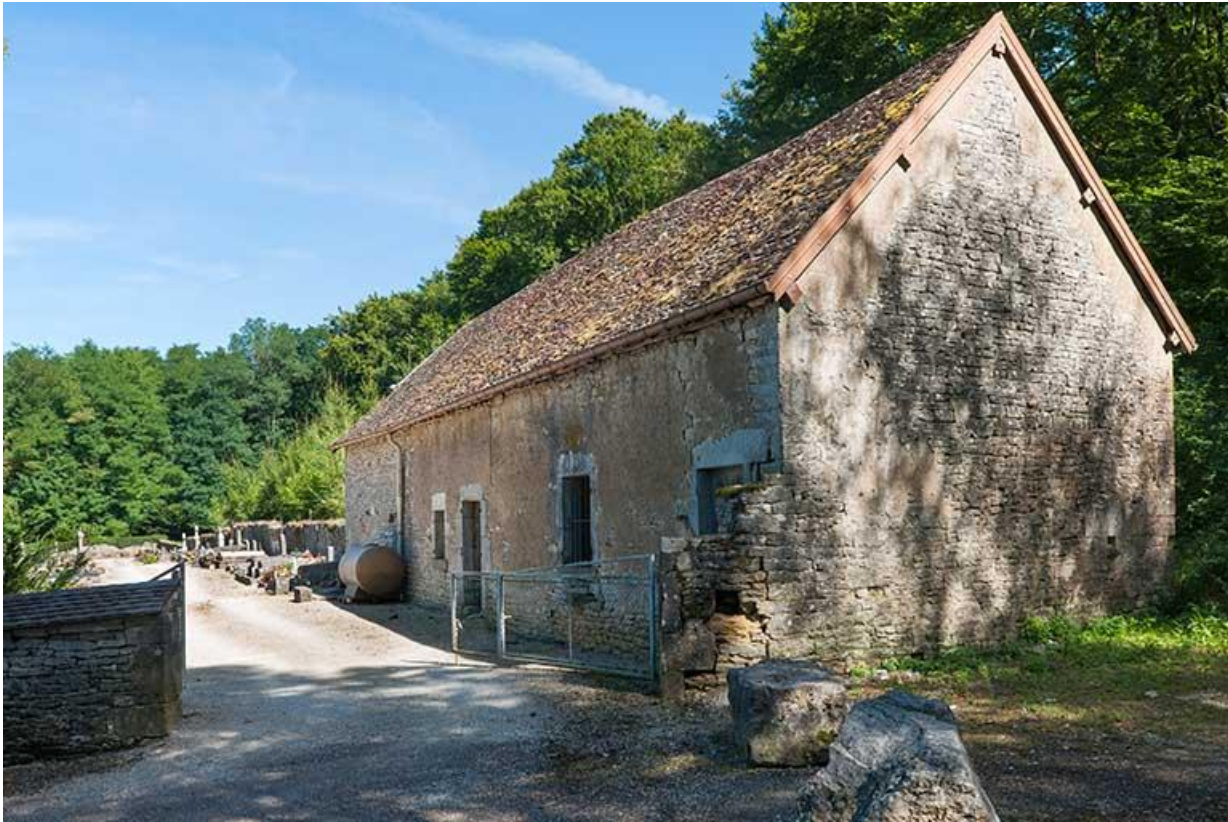
Ancienne ferme située au sud-ouest du cimetière