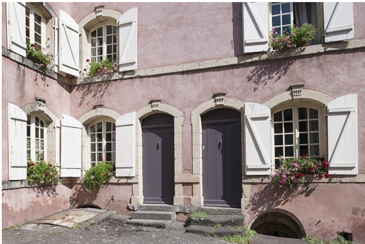
Détail de la façade postérieure, rue Thiers.