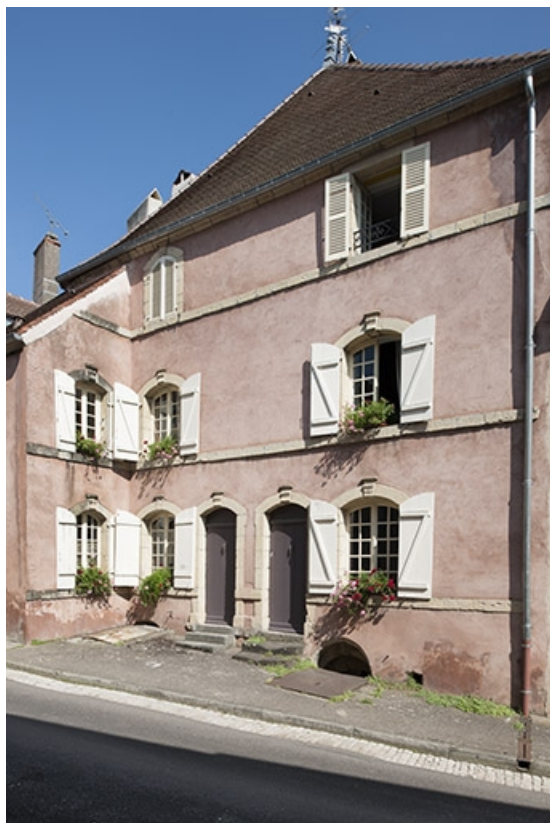
Maison dite des Hôtes : façade du 18e siècle au 4 rue Thiers. 70, Faverney