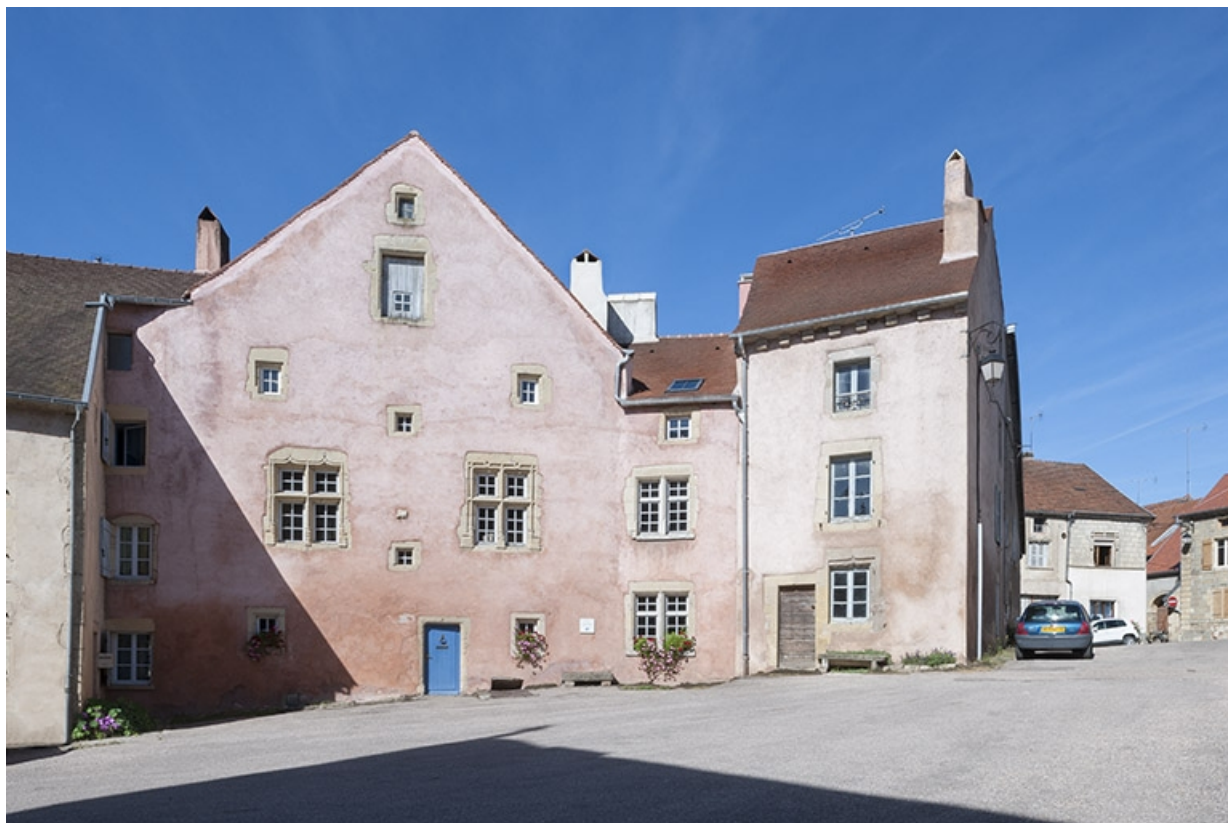
Maison dite des Hôtes : façade du 16e siècle au 2 place Sainte-Gude. 70, Faverney