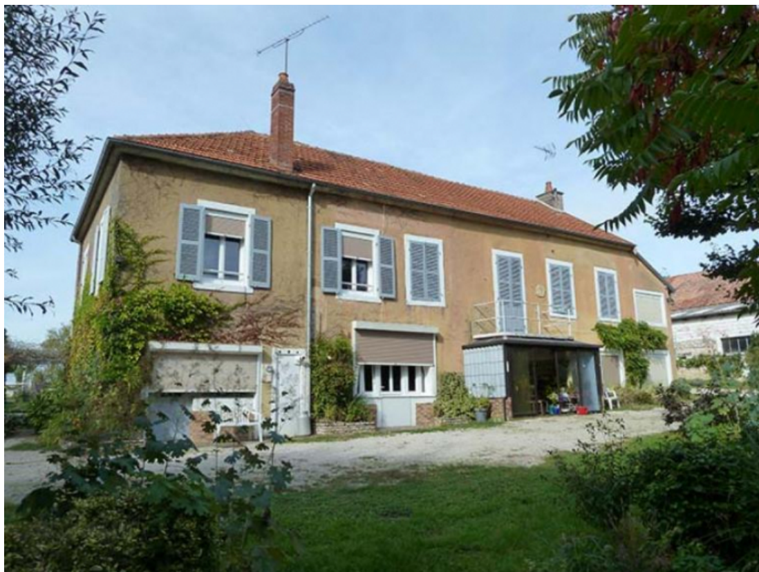
Vue sud-ouest du logis