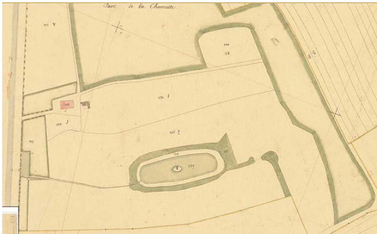
La Charmotte sur le cadastre de 1837 (feuille de section B2), détail 70, Gy, lieudit : la Charmotte