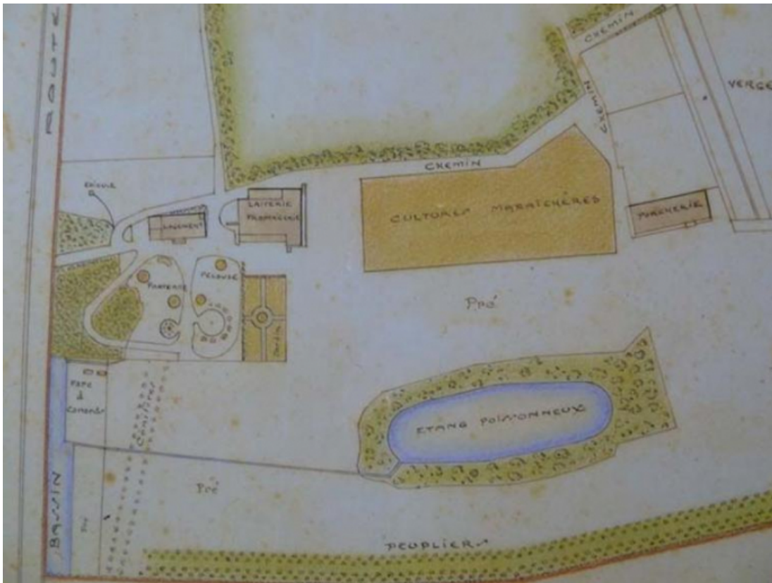
Plan de 1931, détail