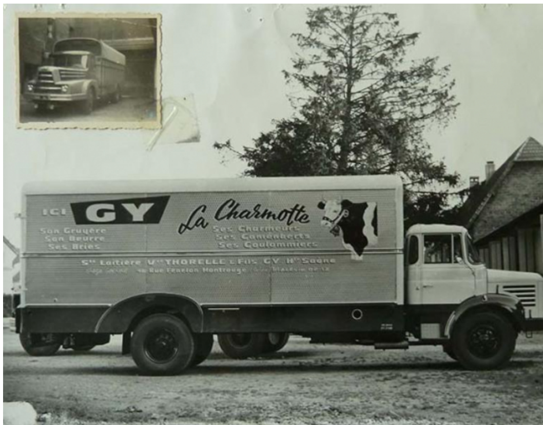
La Charmotte, photographie ancienne