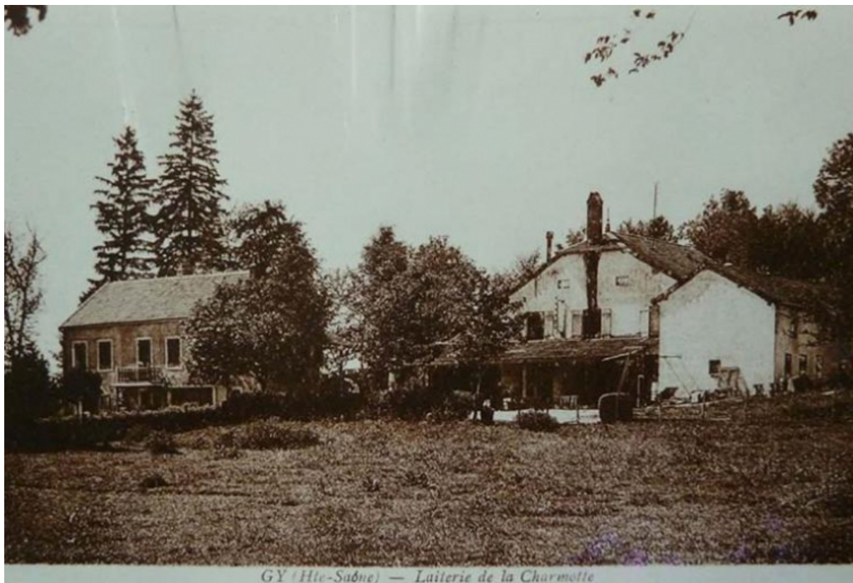
La Charmotte sur une carte postale ancienne