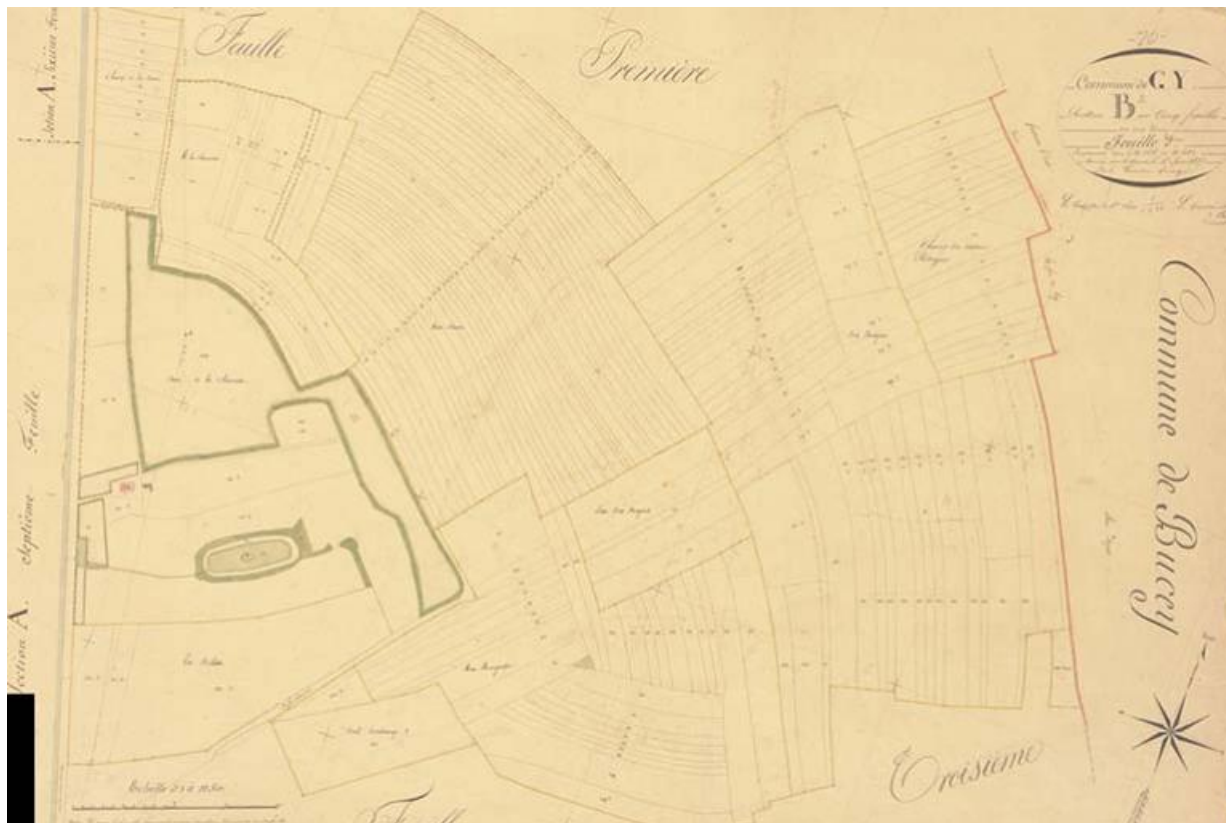
La Charmotte sur le cadastre de 1837 (feuille de section B2) 70, Gy, lieudit : la Charmotte