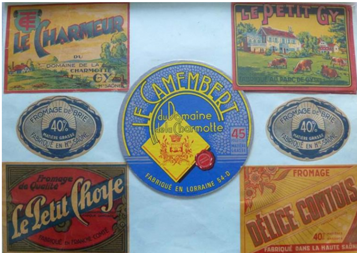
"Étiquettes" témoignant de la production de la laiterie