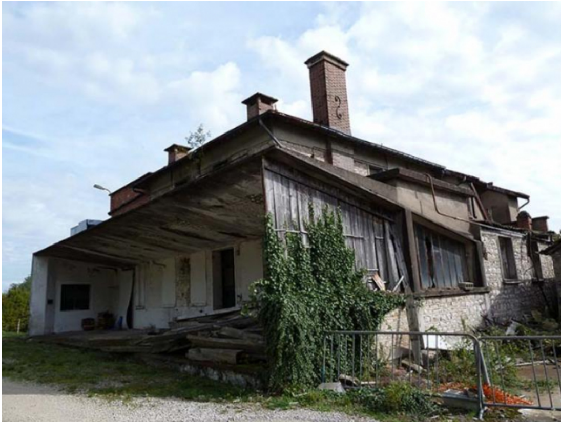
Vue générale nord ouest de la laiterie