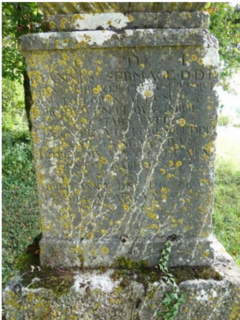
Détail du socle de la croix situé au nord des bâtiments