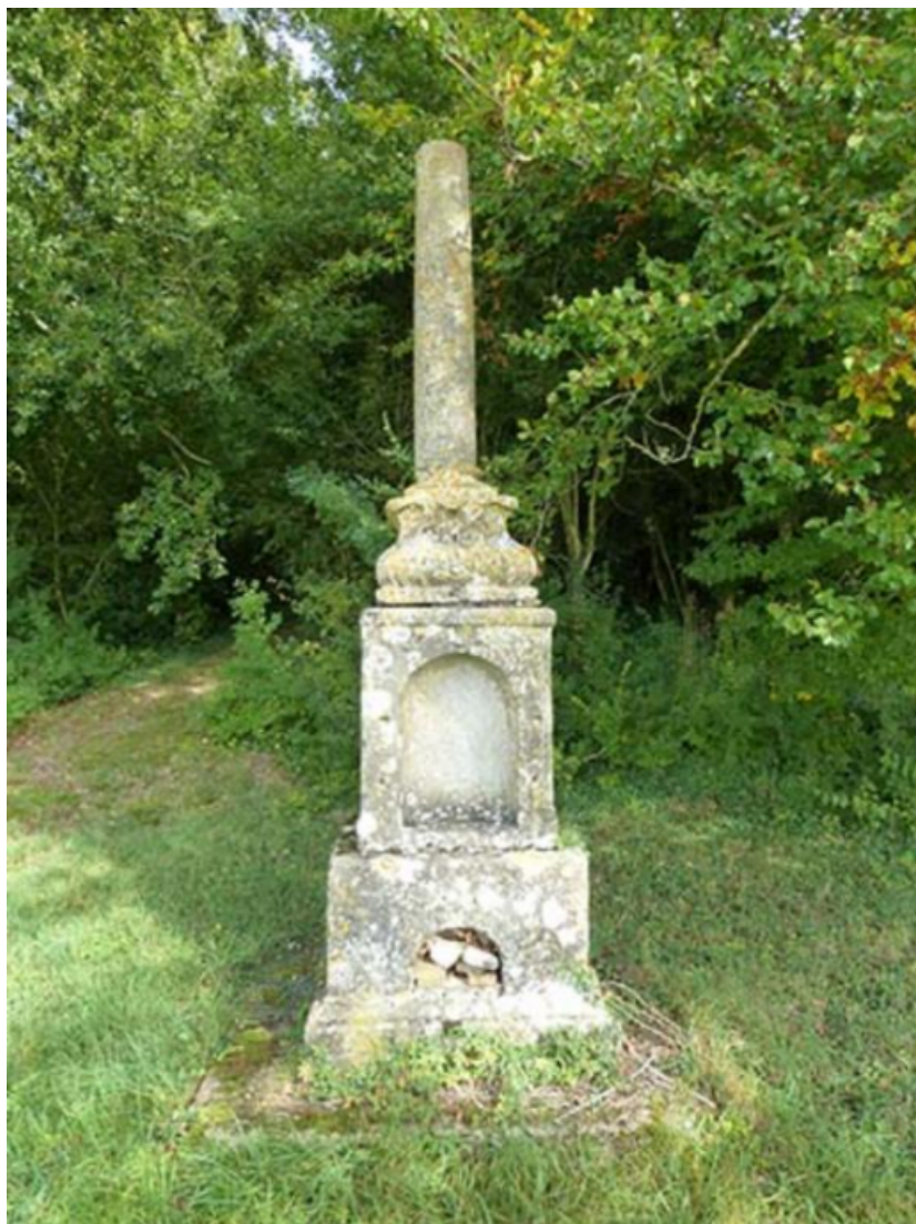
Vestiges de la croix située au nord des bâtiments