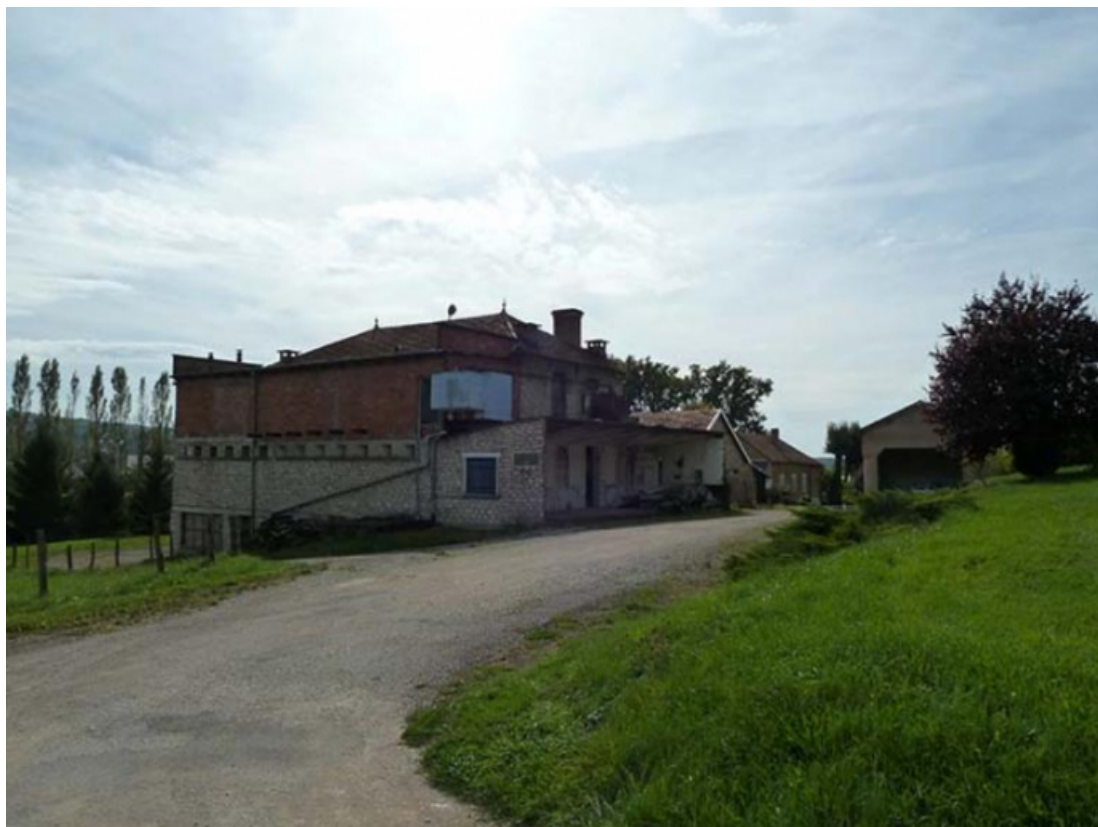
Vue générale nord-est