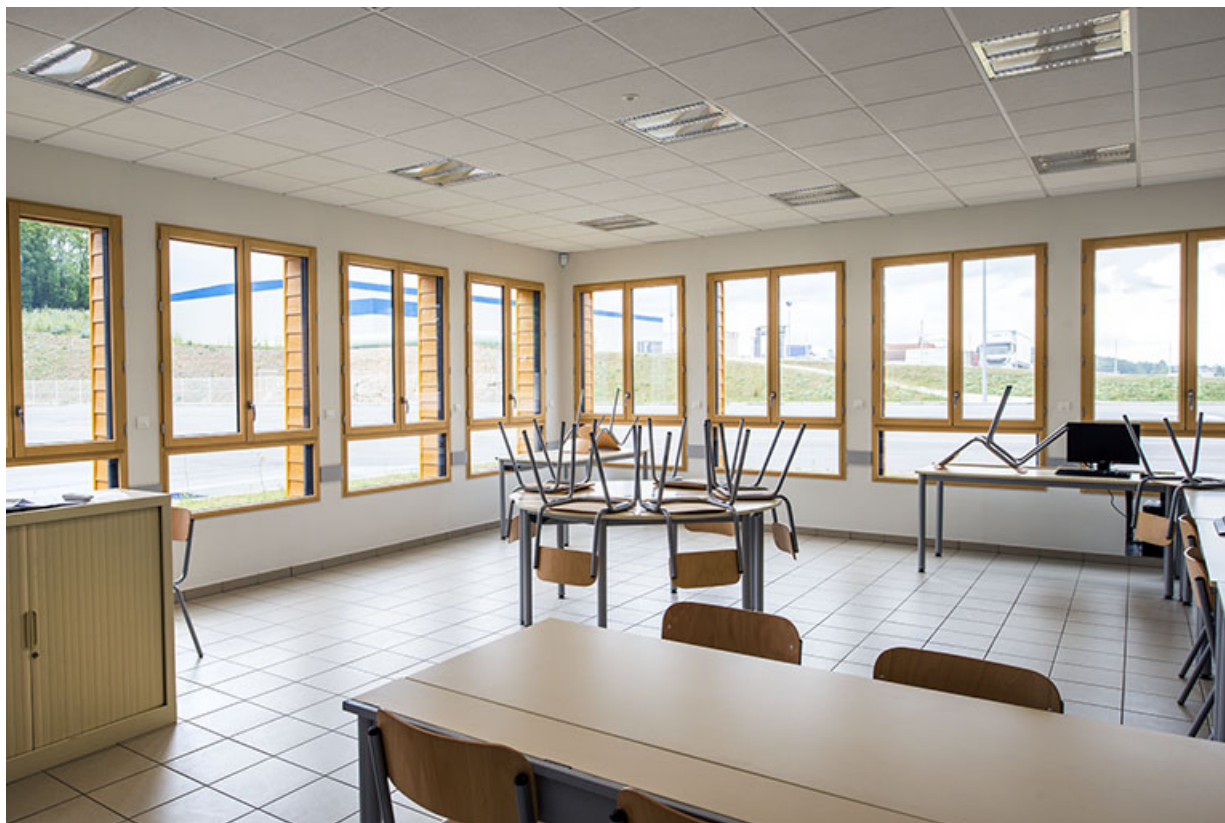
Salle de pistes dans le bâtiment d'enseignement.