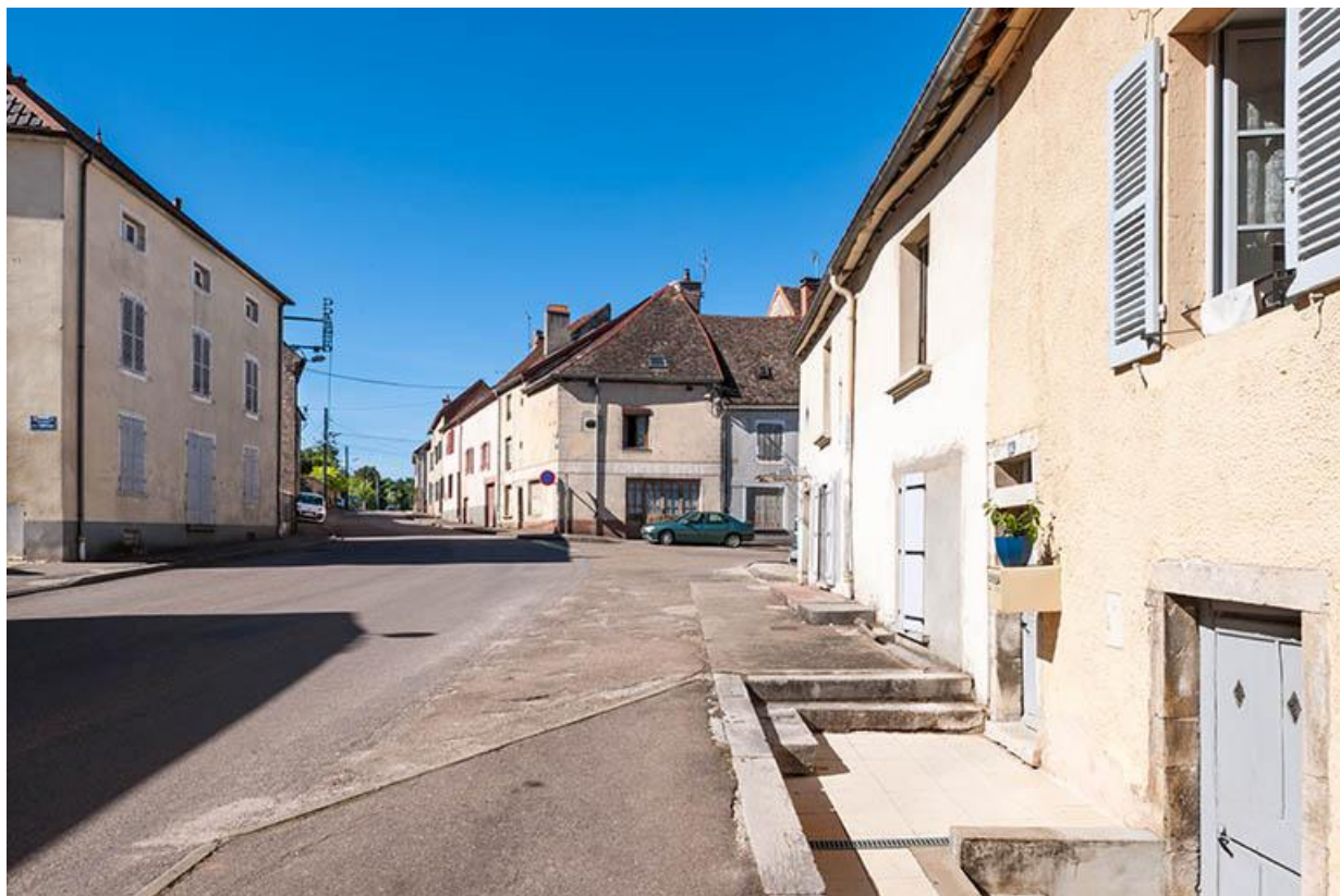
La Grande Rue 70, Gy