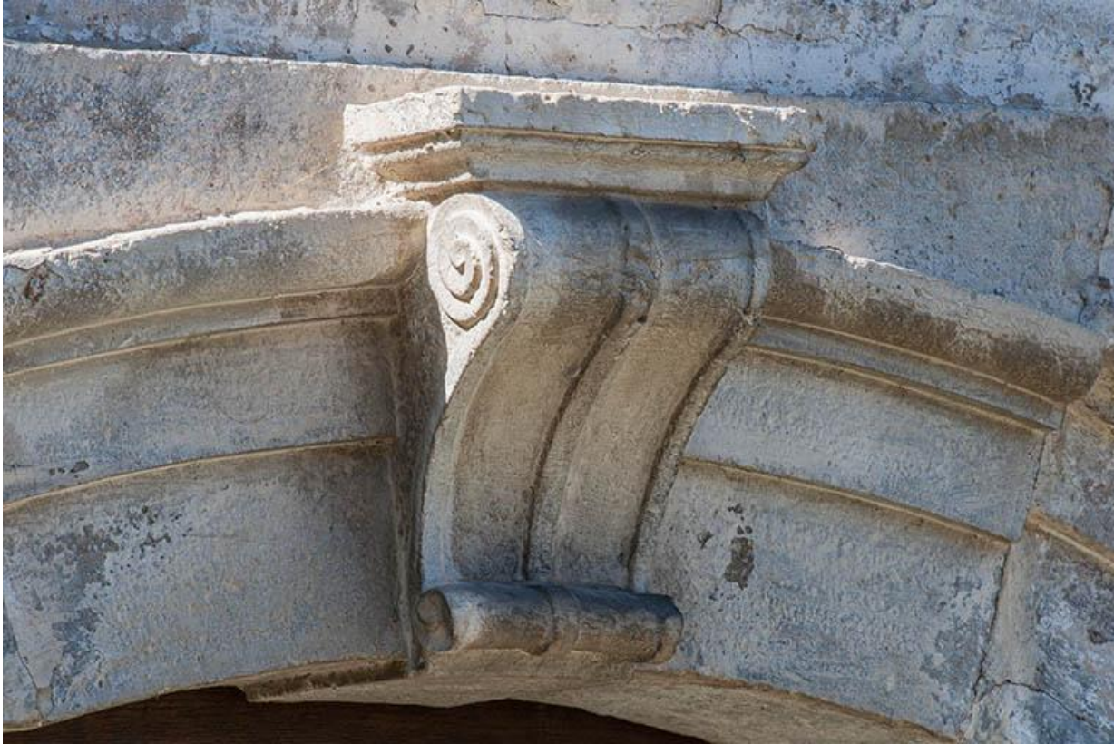
Détail de la porte 70, Gy Grande Rue