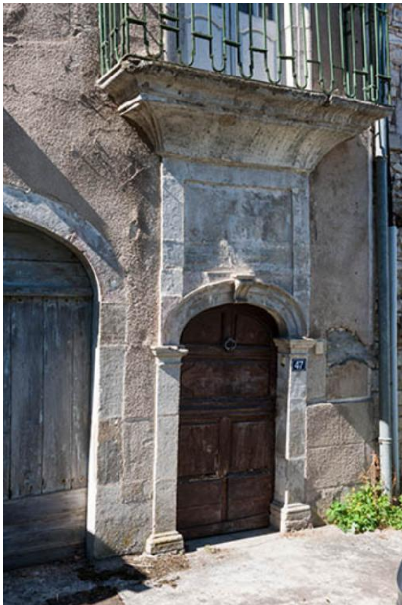
Porte du 47 Grande Rue