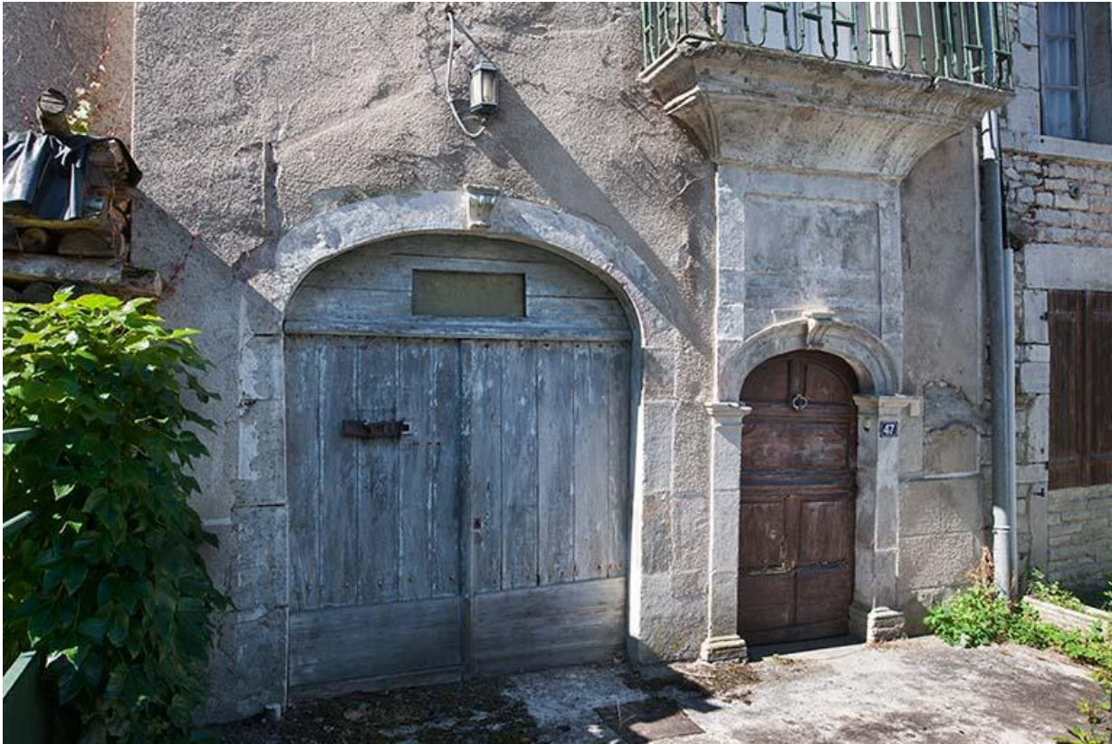
47 Grande Rue 70, Gy Grande Rue