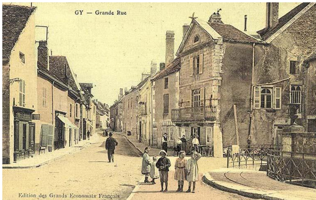
Le bâtiment sur une carte postale ancienne 70, Gy