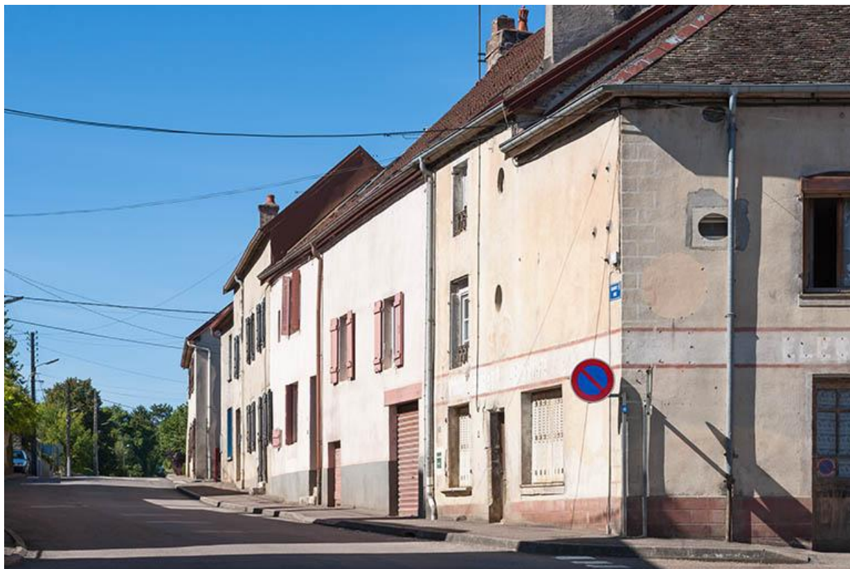
Maisons de la partie ouest de la Grande Rue