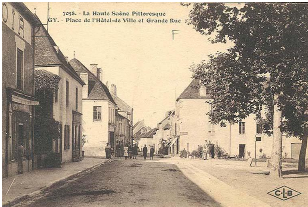
La Grande rue sur une carte postale ancienne