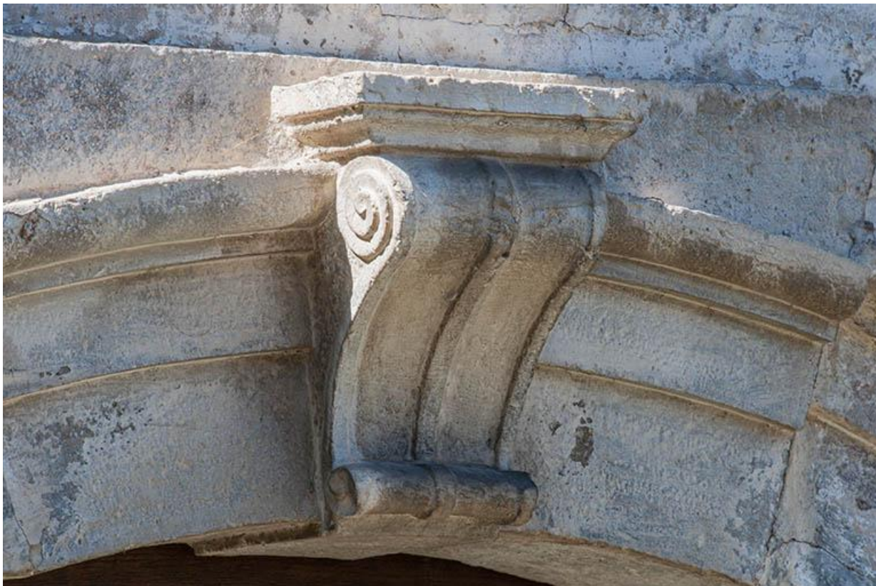
Détail de la porte 70, Gy Grande Rue