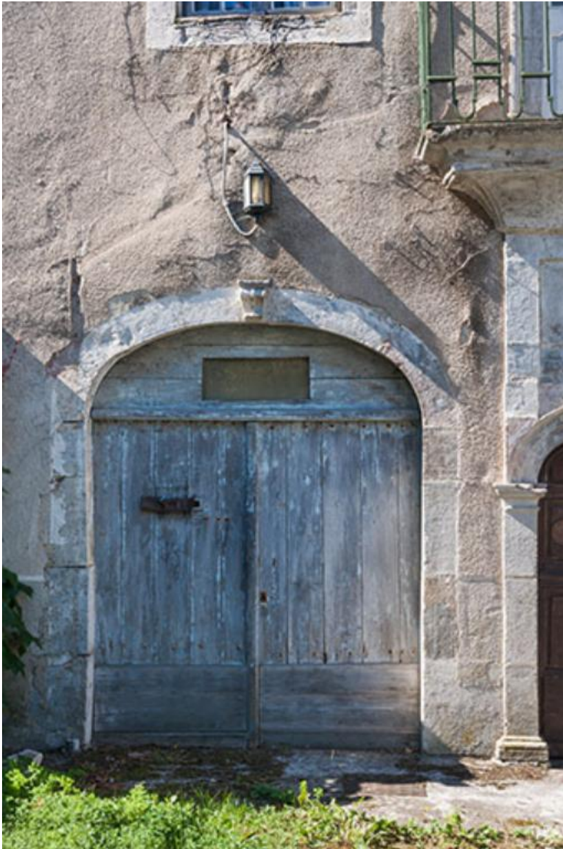
Détail d'une porte, 47 Grande Rue 70, Gy Grande Rue