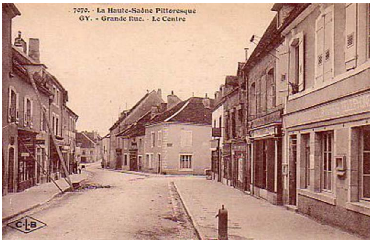
La grande rue sur une carte postale ancienne