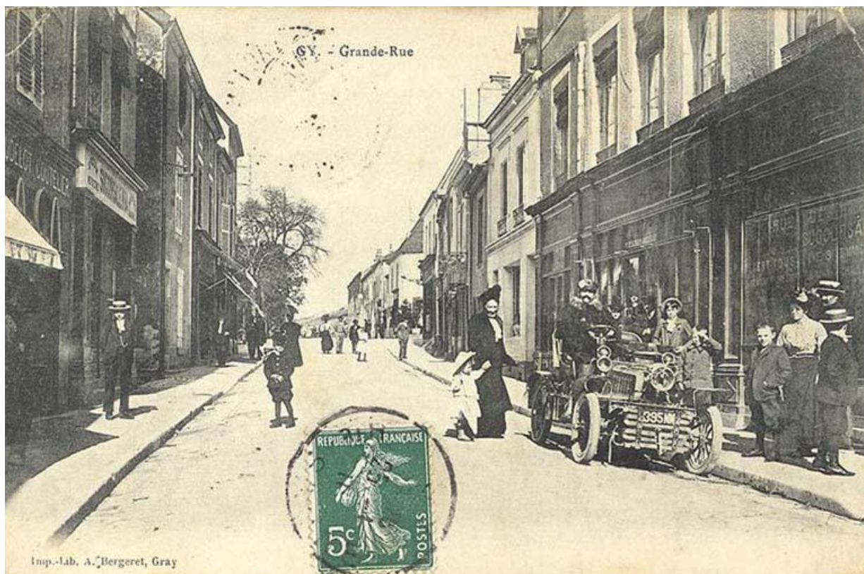
La Grande Rue au début du 20e siècle 70, Gy