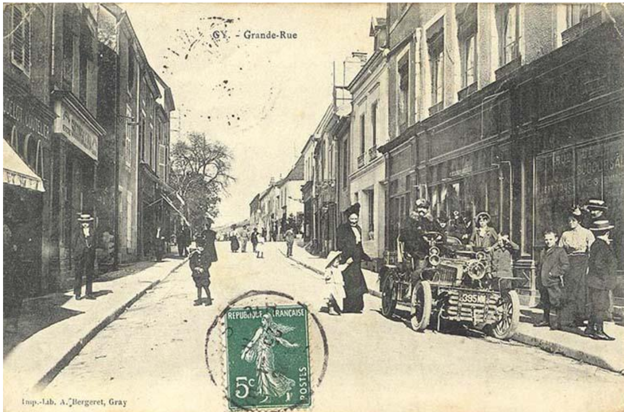
La Grande Rue au début du 20e siècle 70, Gy