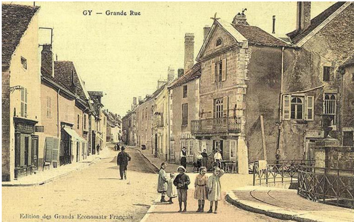
Le bâtiment sur une carte postale ancienne 70, Gy