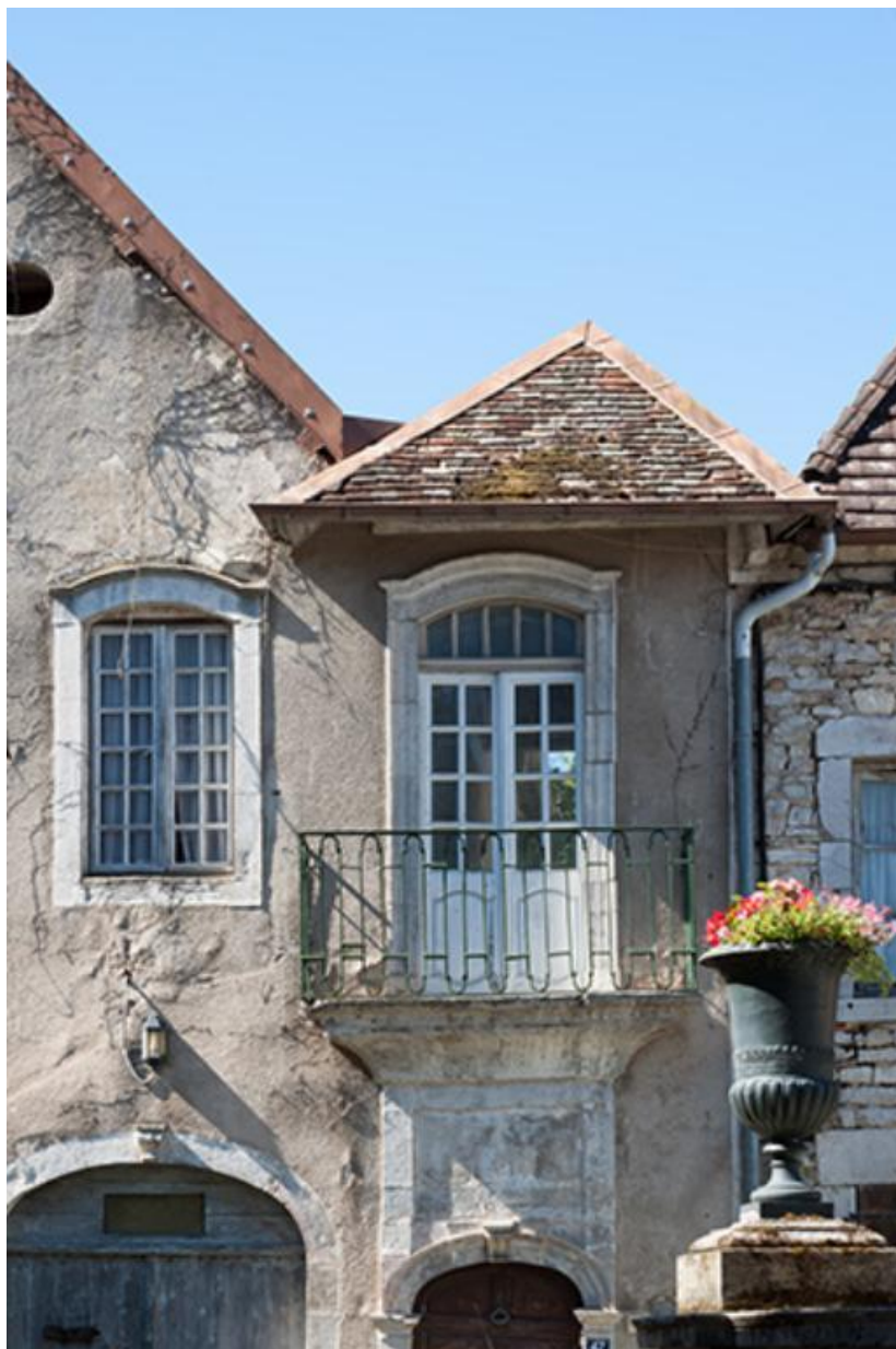
Détail d'architecture, 47 Grande Rue