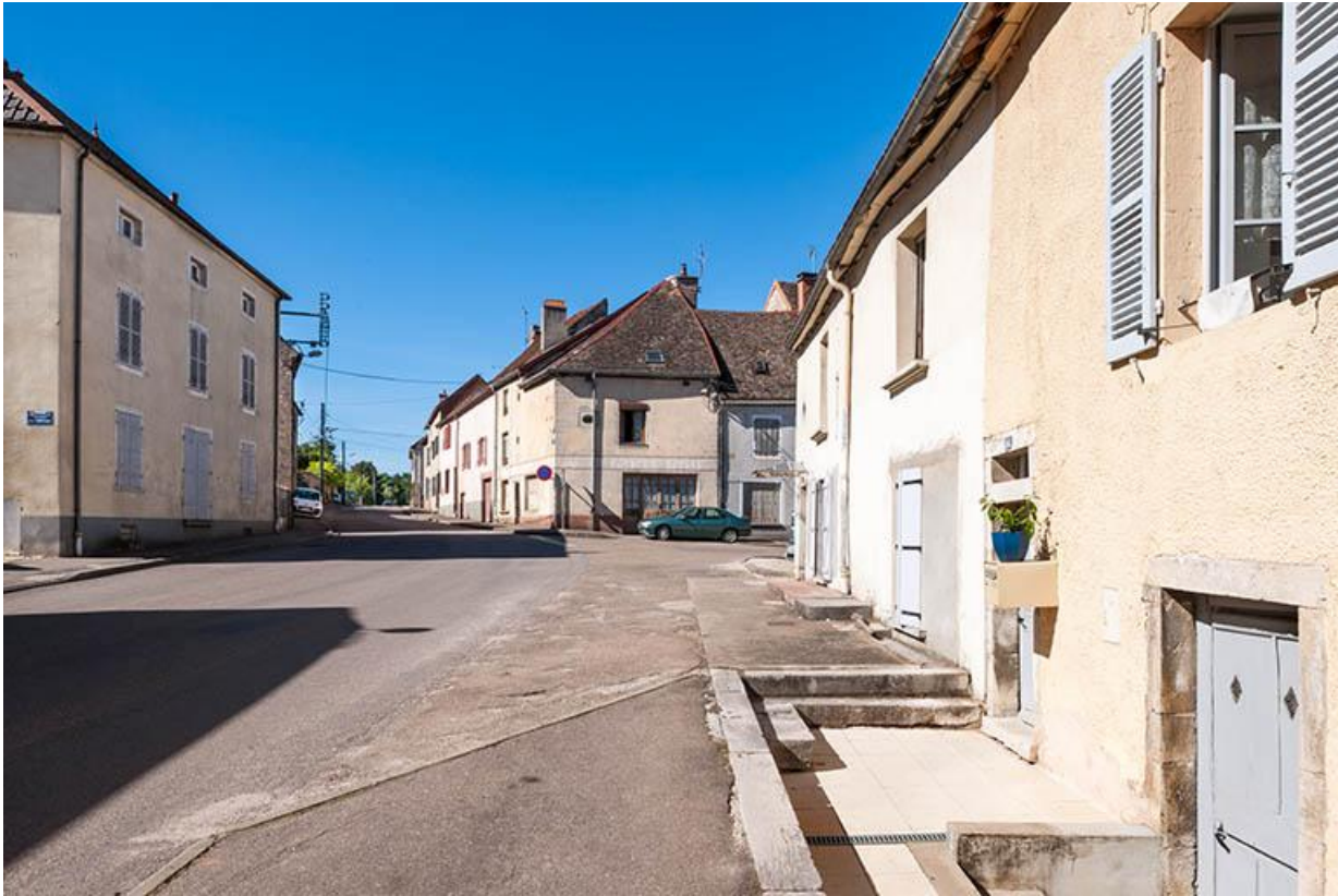
La Grande Rue 70, Gy