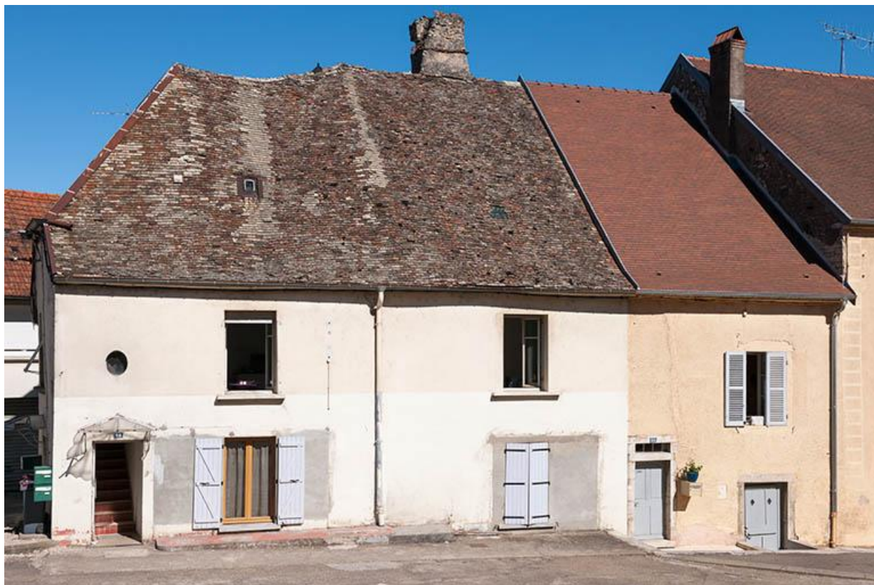
Maisons de la partie ouest de la Grande Rue