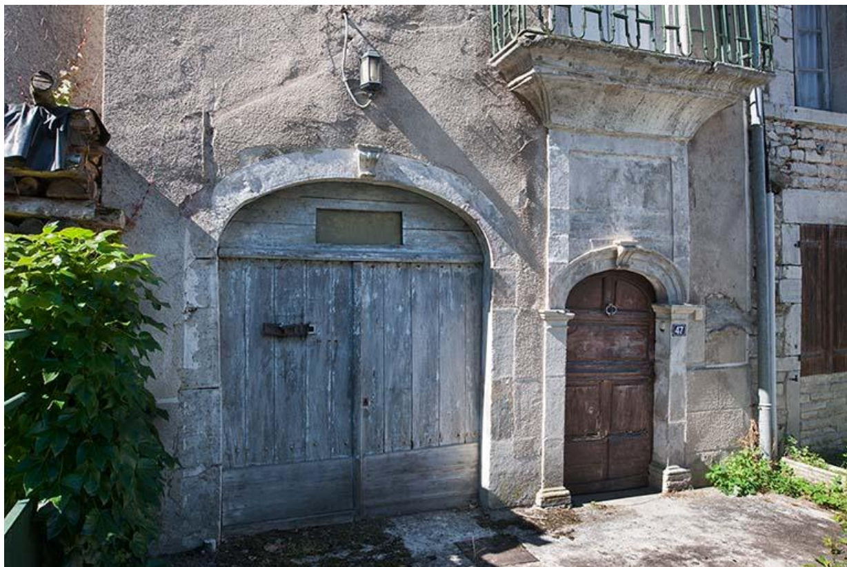
47 Grande Rue 70, Gy Grande Rue