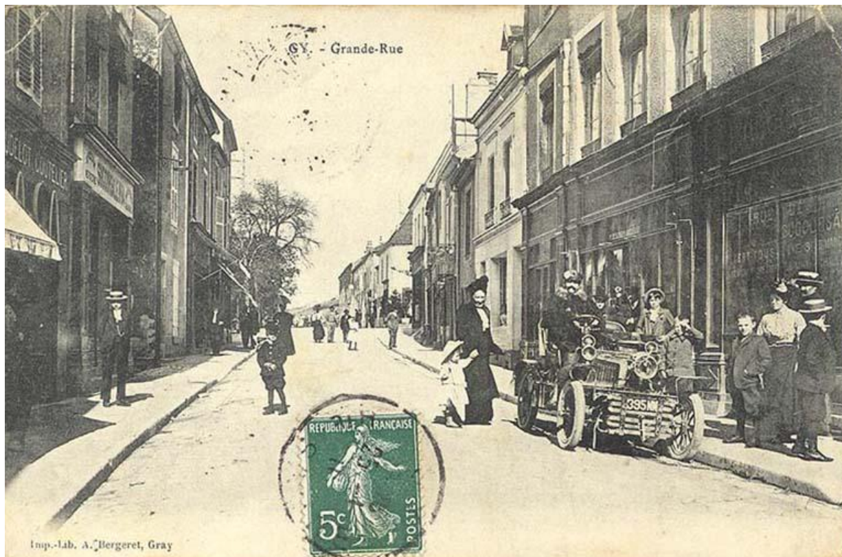
La Grande Rue au début du 20e siècle 70, Gy