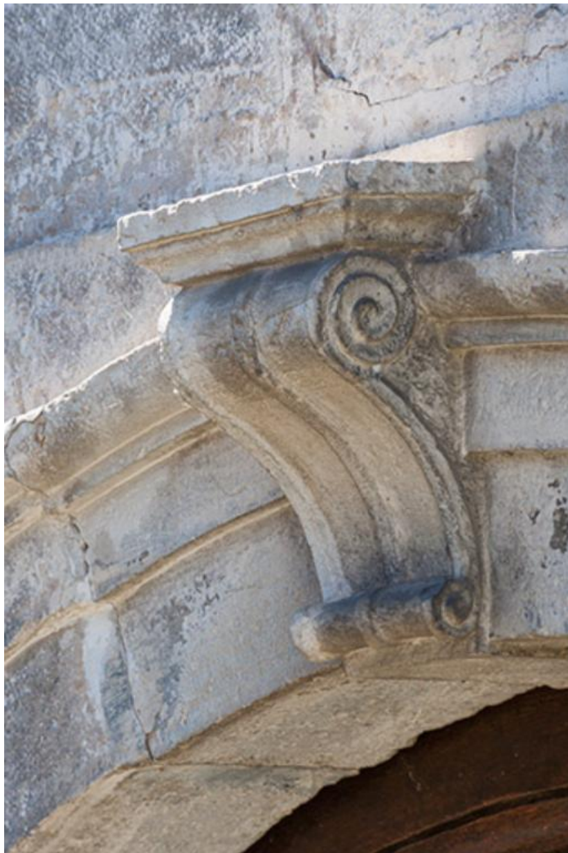
Détail de la porte 70, Gy Grande Rue