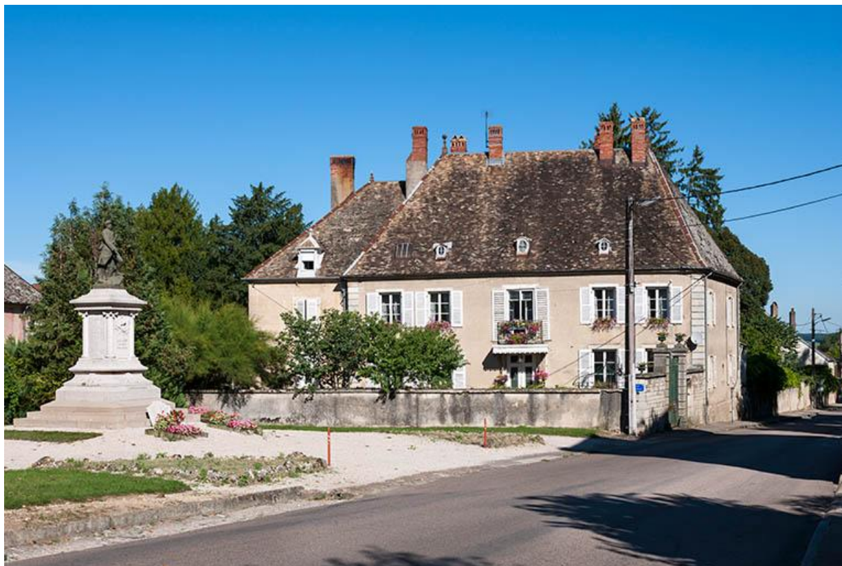
Vue générale sud-est 70, Gy