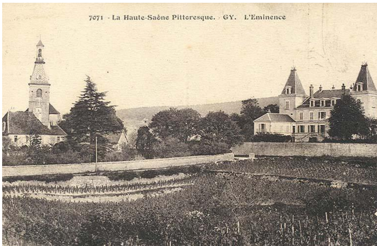
L'église sur une carte postale ancienne