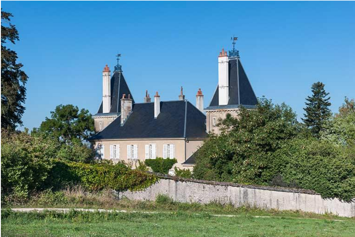
Vue générale sud-est