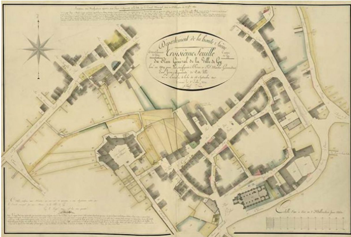
Le bâtiment sur le plan d'alignement de 1839 70, Gy