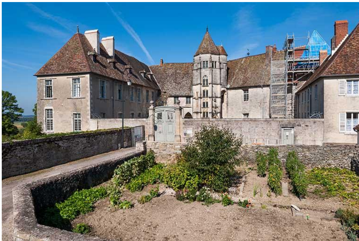
Vue générale sud-est 70, Gy