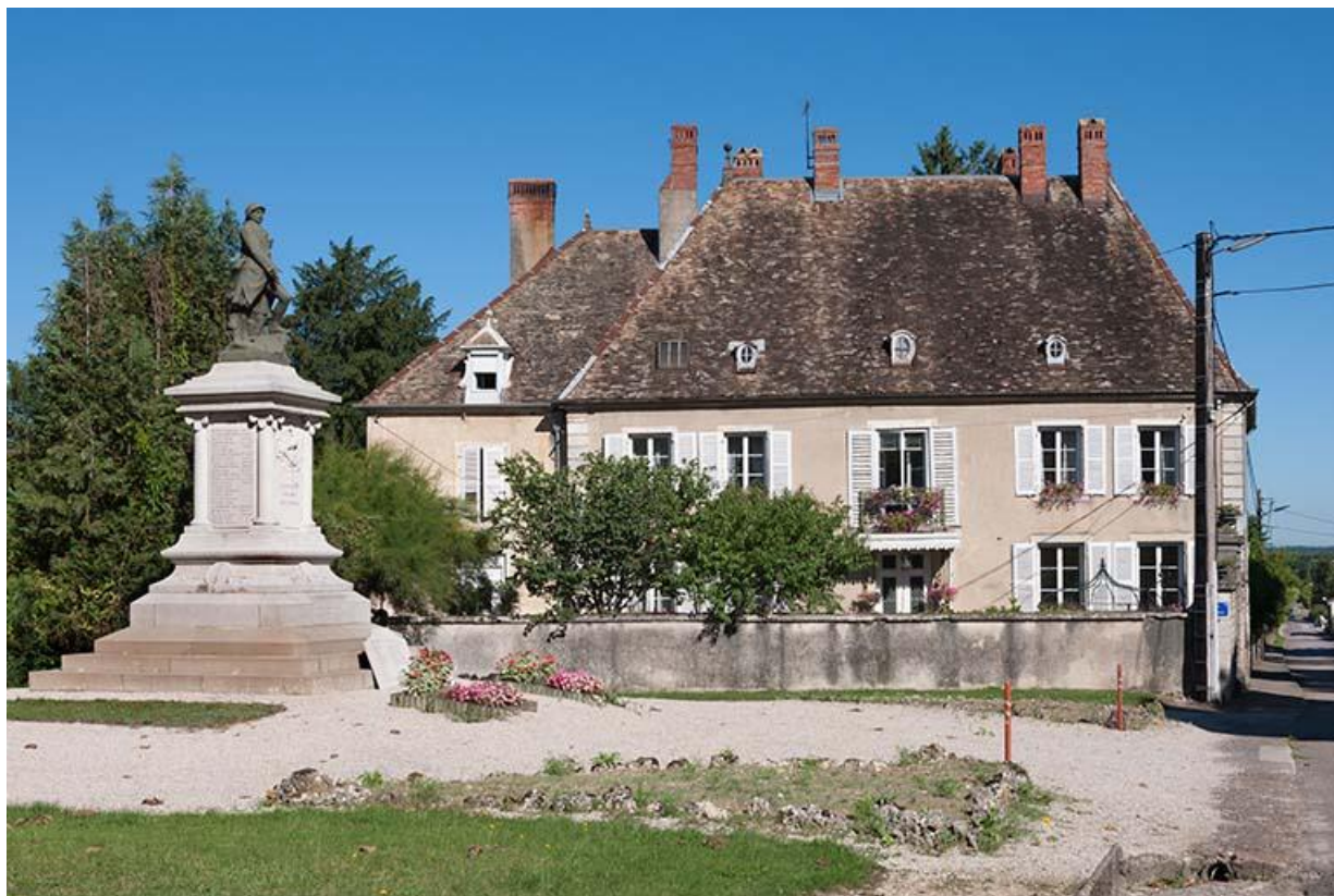
Vue sud 70, Gy