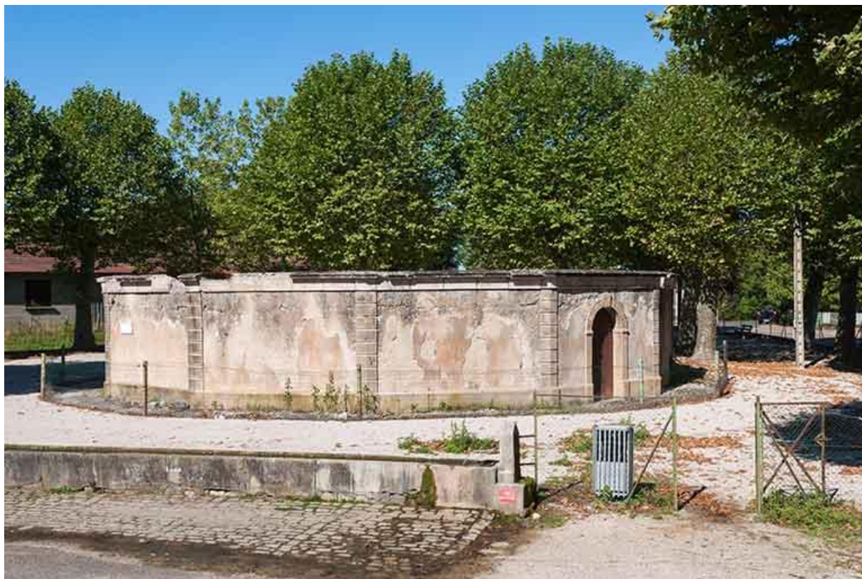
Vue générale 70, Gy