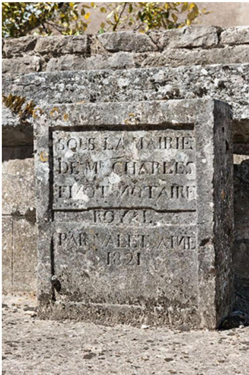
Détail de la stèle