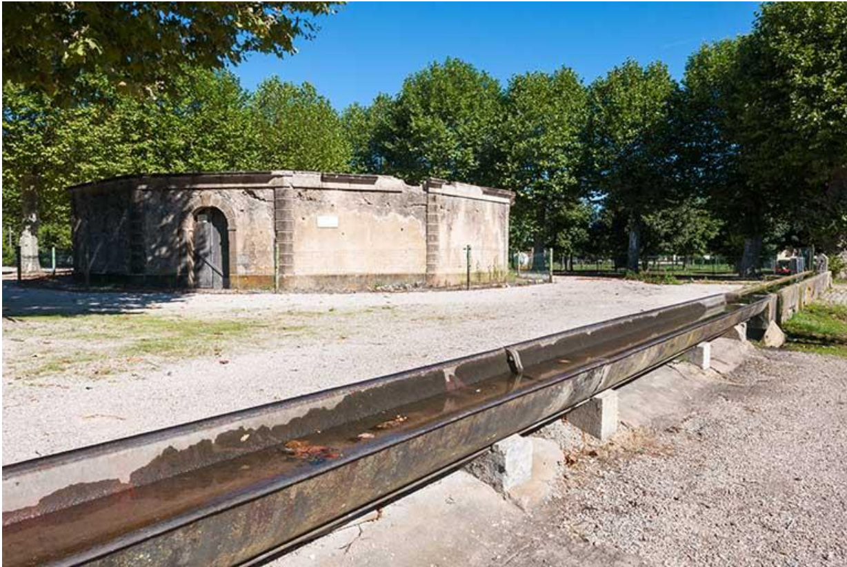
Vue générale du lavoir et de l'abreuvoir 70, Gy