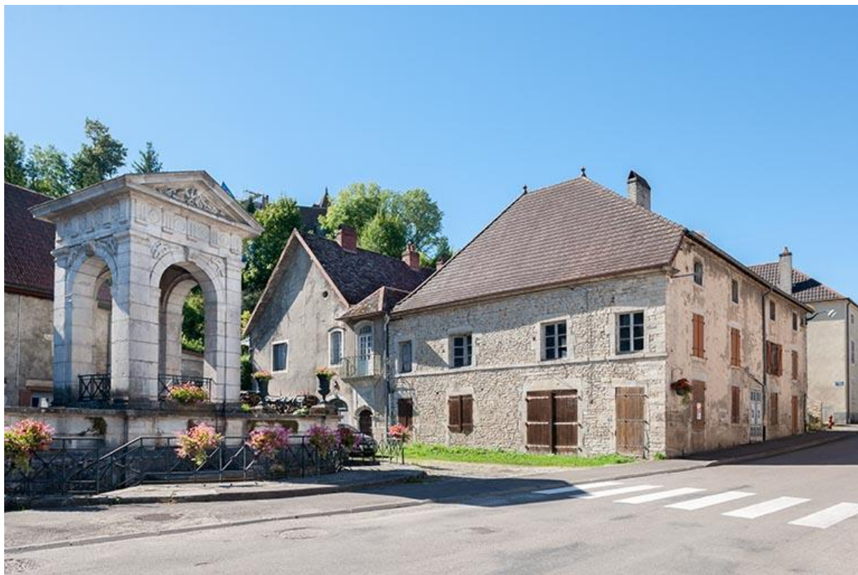
Vue d'ensemble nord-est 70, Gy