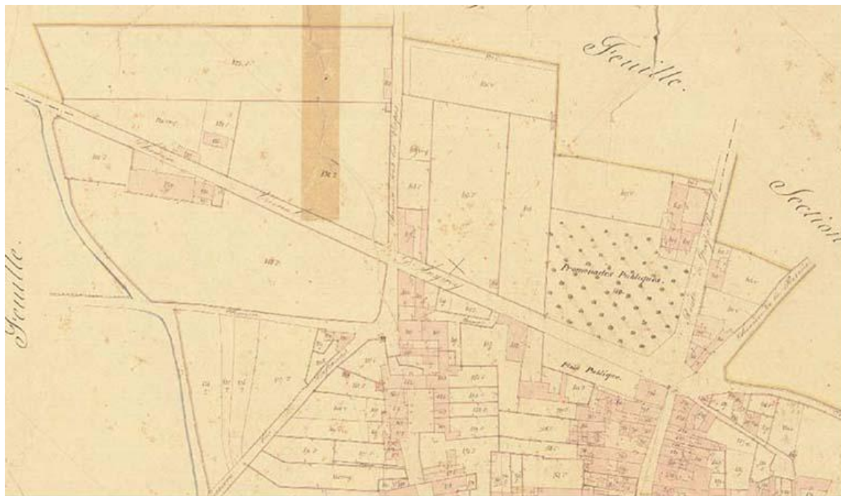
L'emplacement de l'hôtel de ville sur le cadastre de 1837