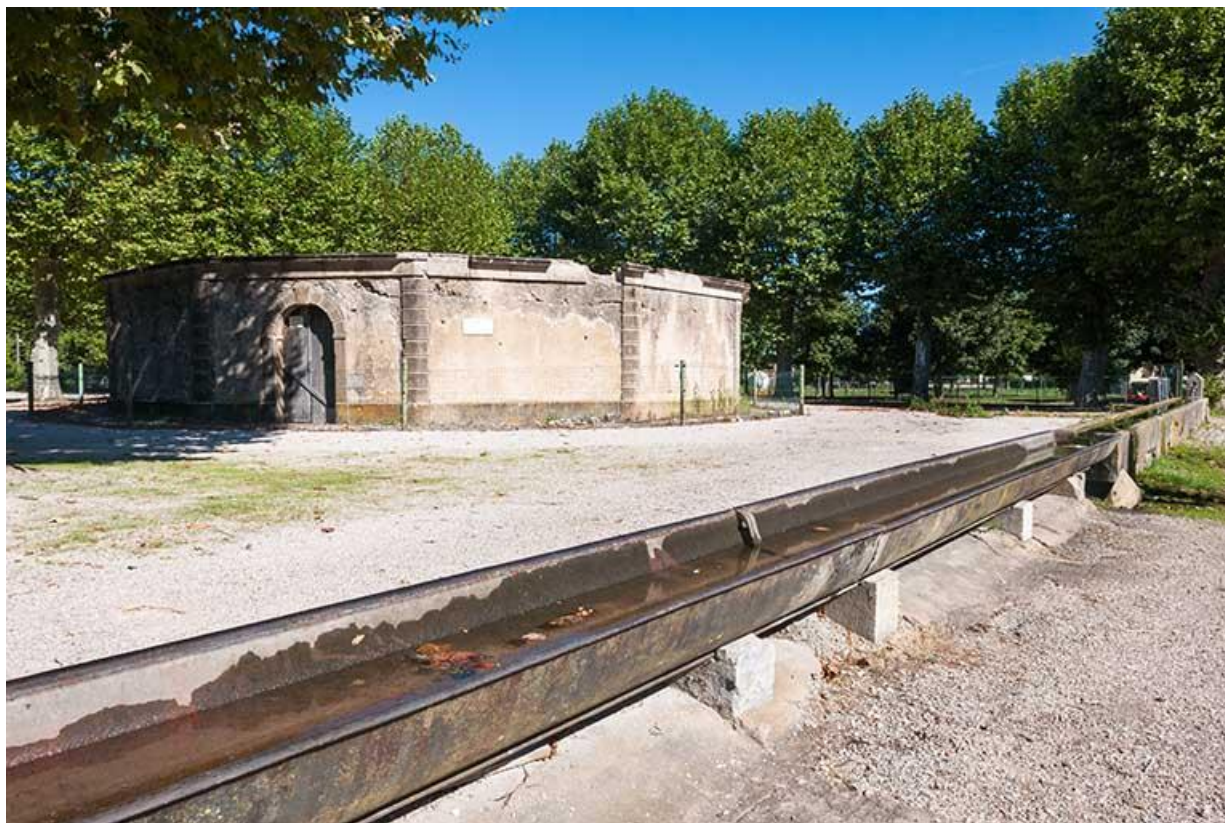
Vue générale du lavoir et de l'abreuvoir 70, Gy