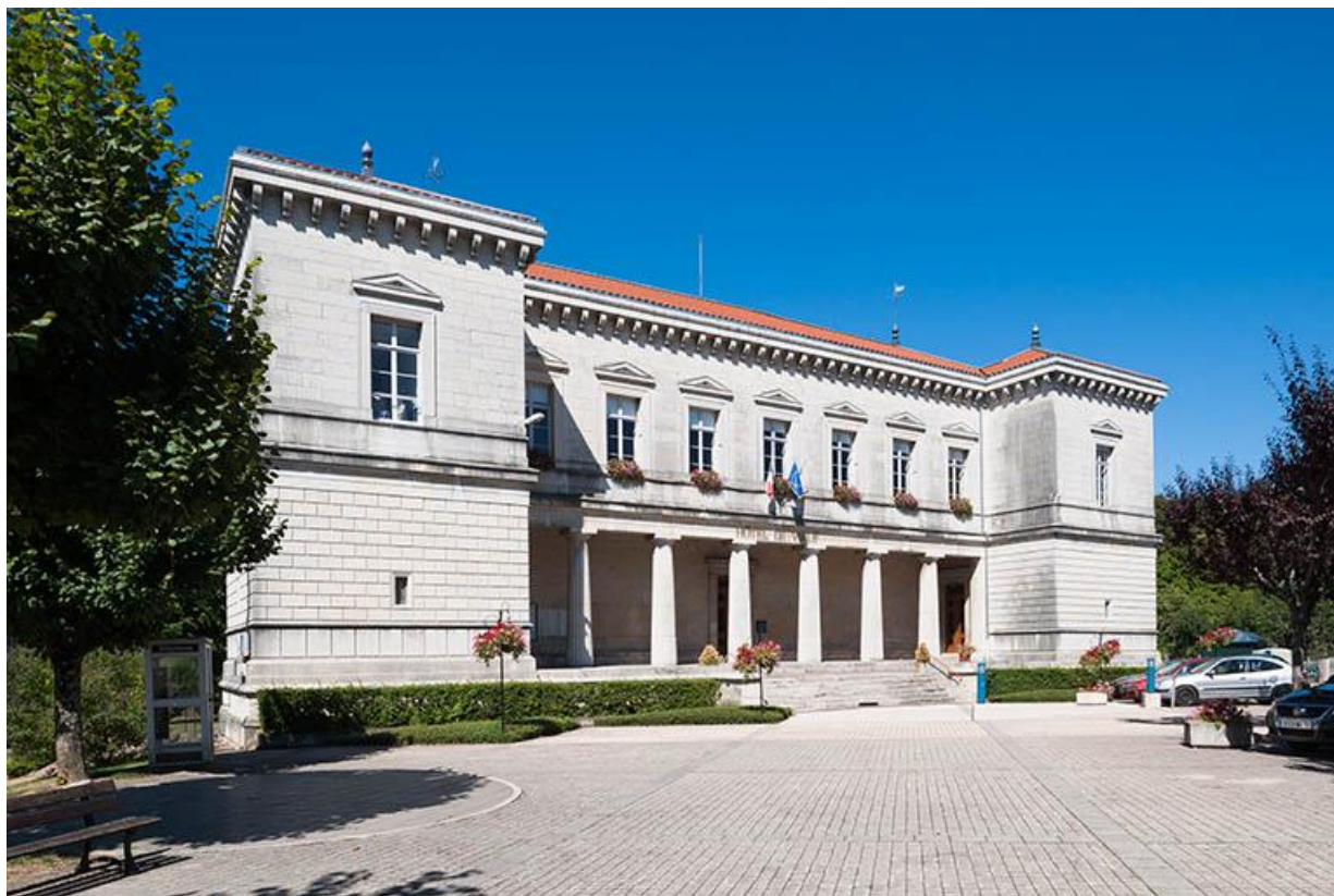
Vue générale sud-ouest 70, Gy