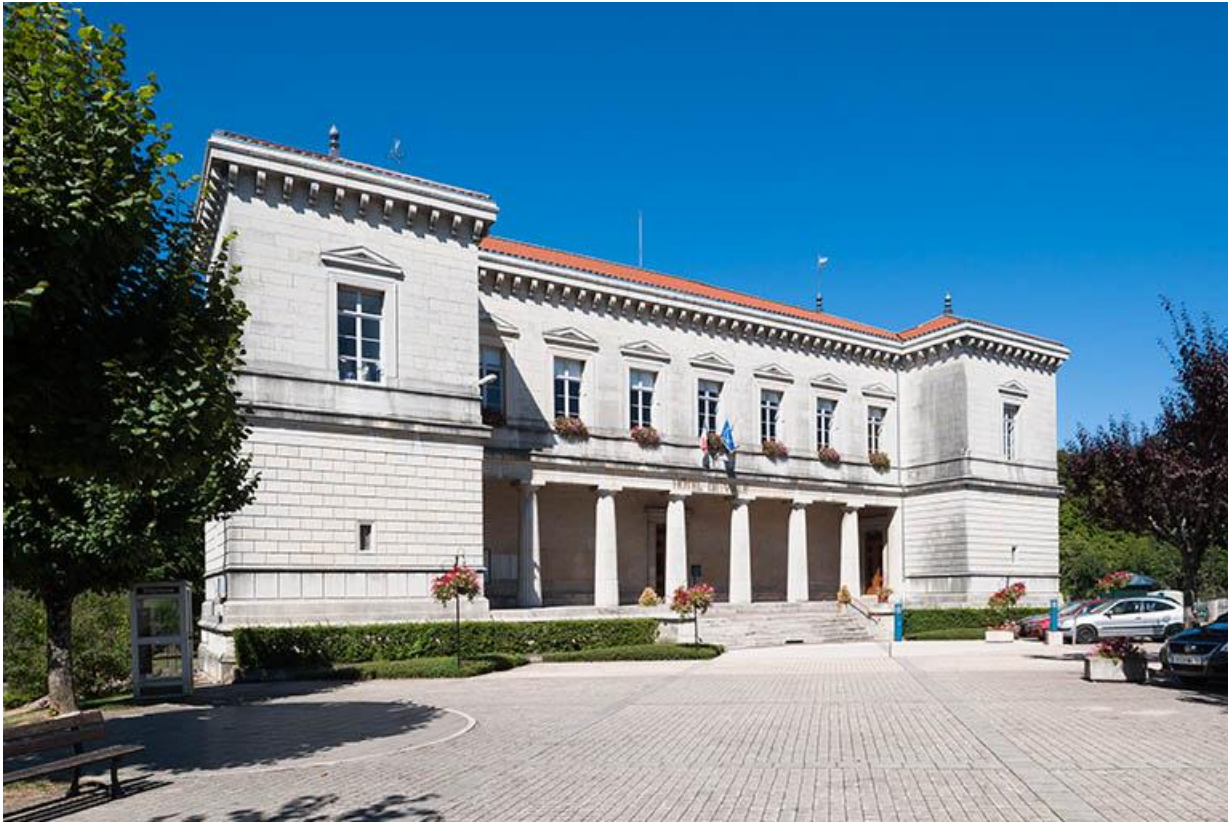
Vue générale sud-ouest 70, Gy