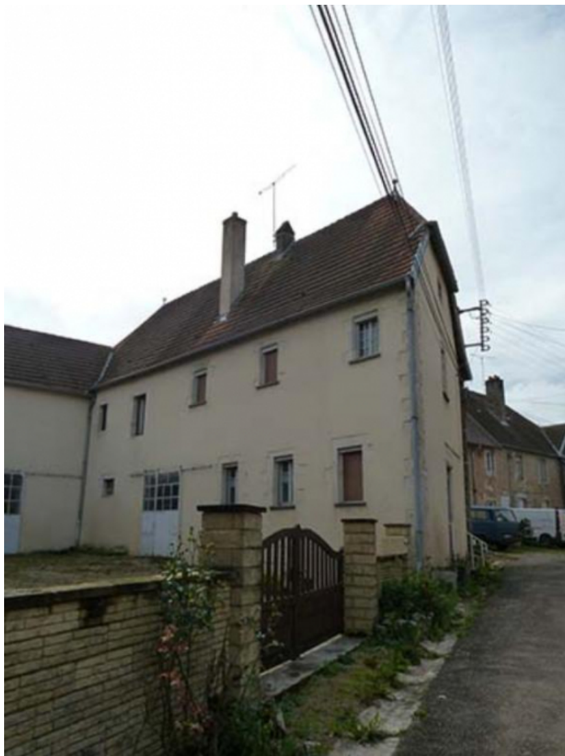
Vestiges des bâtiments du couvent des Capucins