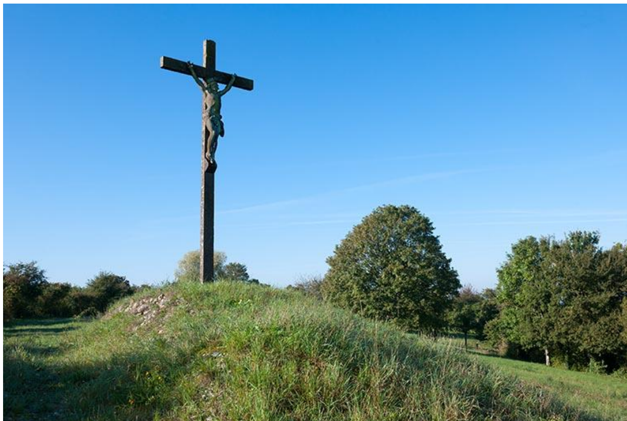
Croix située à l'ouest du château 70, Gy