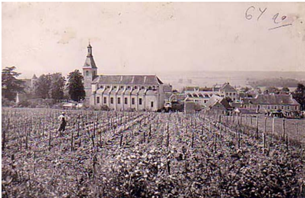
Vue sud de l'église sur une carte postale