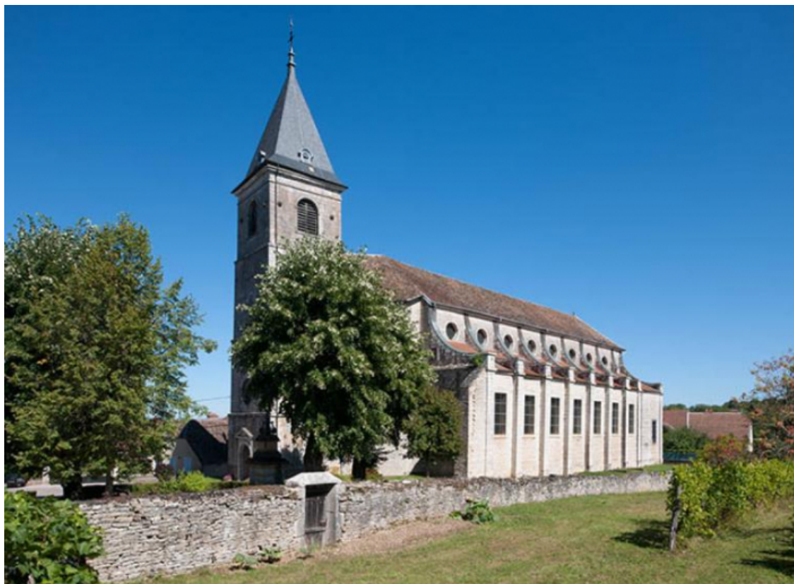
Vue générale sud-ouest de l'église