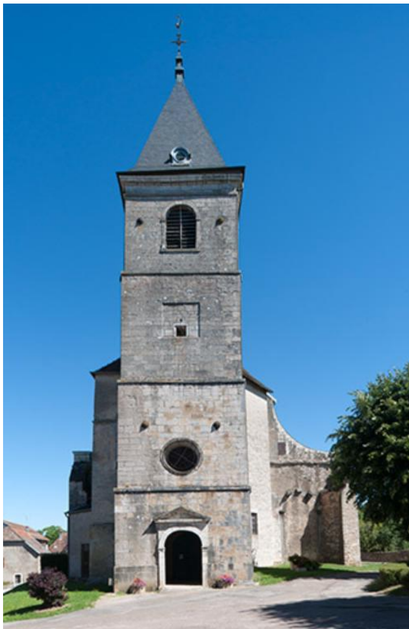
Façade ouest de l'église