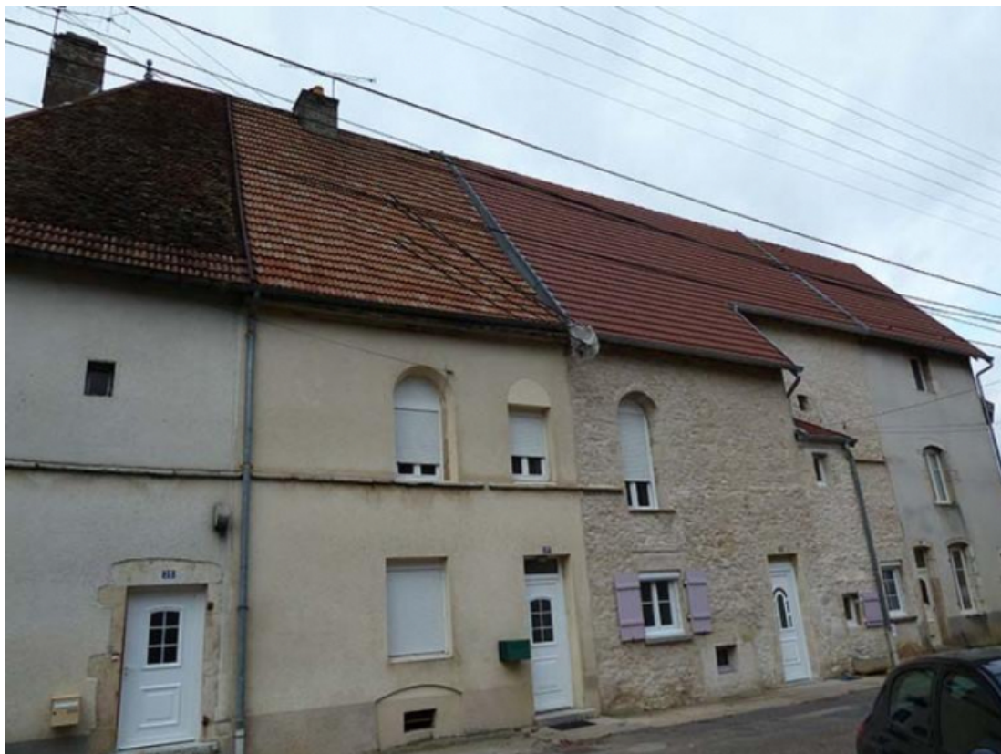
Vue générale sud-ouest 70, Gy