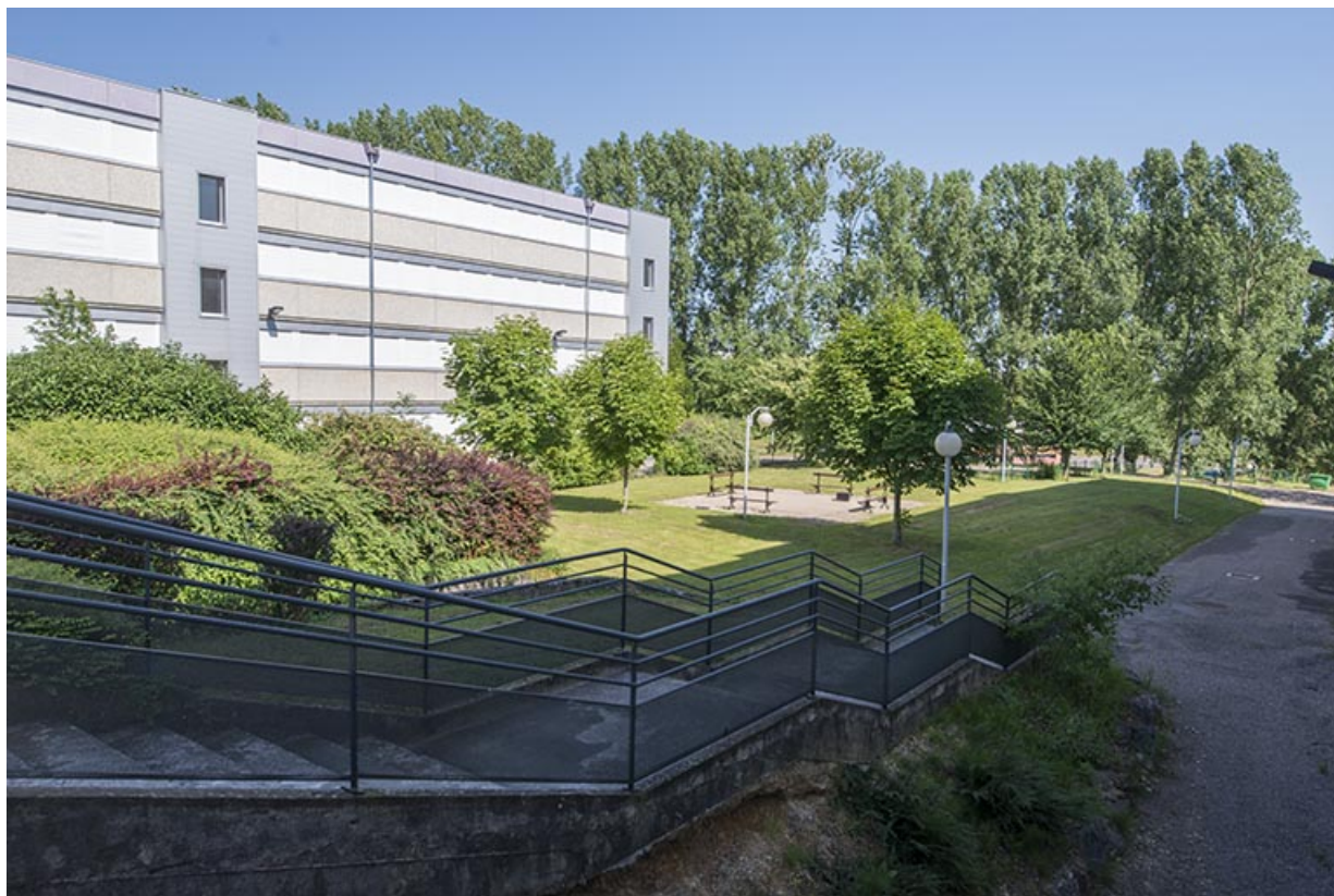
Espaces verts et de circulation, entre l'internat affecté au lycée Munier (B) et l'externat et internat nord. 70, Vesoul, 18 rue Edouard Belin, lieudit : Grand Mont Marin