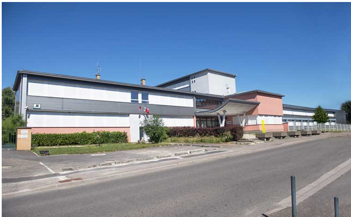
Façade antérieure sur rue.

70, Vesoul, 18 rue Edouard Belin, lieudit : Grand Mont Marin