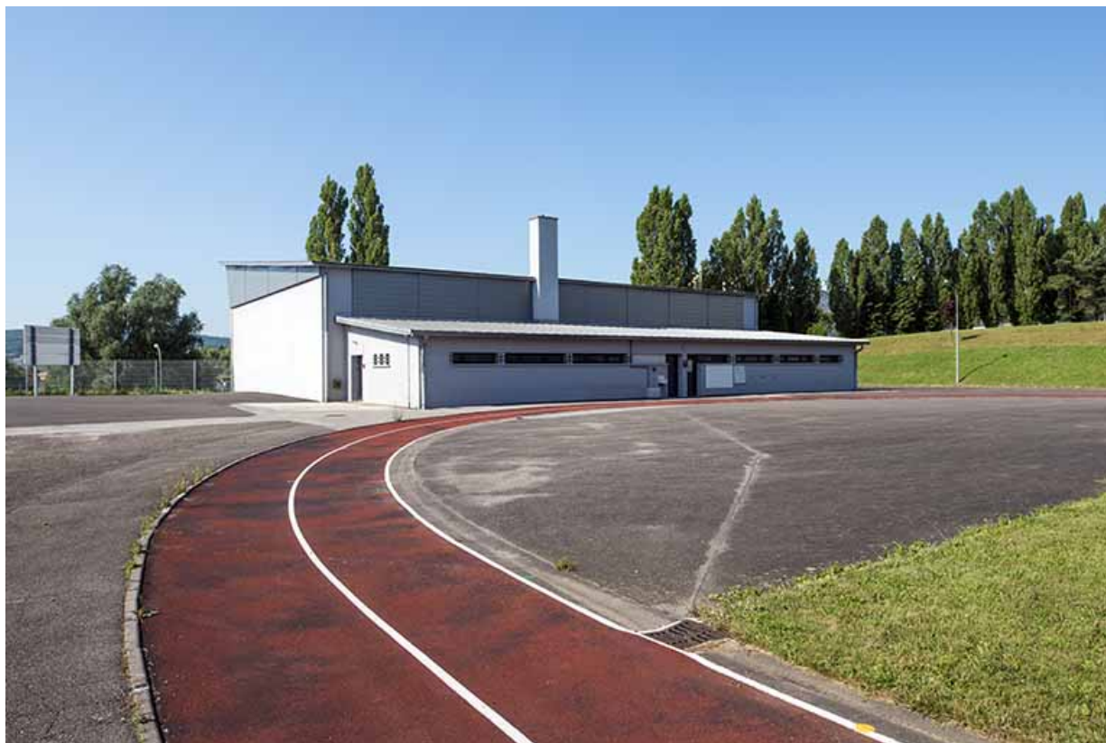
Angle nord-est du gymnase.

70, Vesoul, 18 rue Edouard Belin, lieudit : Grand Mont Marin