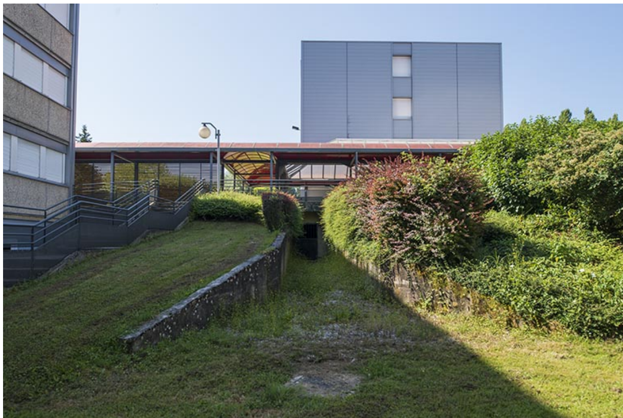
Espaces de circulation, pour parties couvertes, et pignon nord de l'externat et internat sud-ouest.

70, Vesoul, 18 rue Edouard Belin, lieudit : Grand Mont Marin