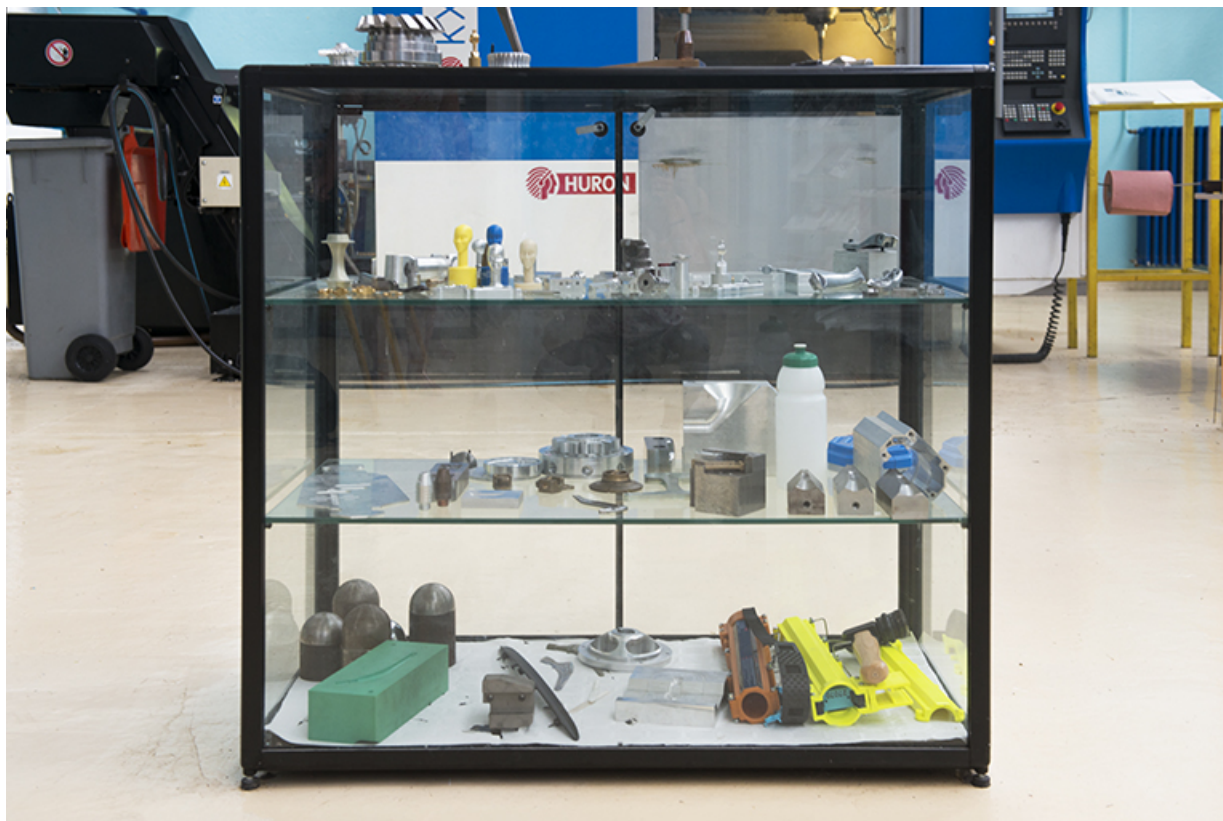
Vitrine d'objets résultants de l'atelier d'usinage à grande vitesse.

70, Vesoul, 18 rue Edouard Belin, lieudit : Grand Mont Marin