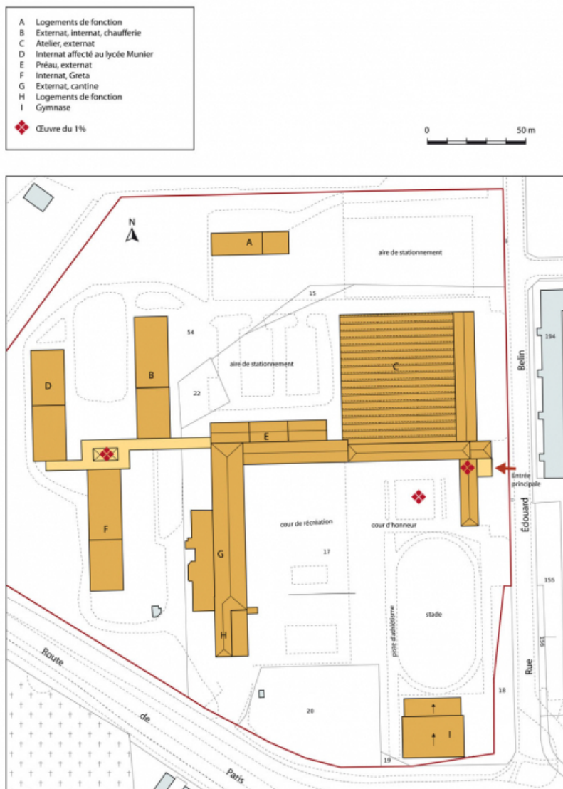
Plan-masse et de situation. Extrait du plan cadastral numérisé, section BI, échelle 1:1000. 70, Vesoul, 18 rue Edouard Belin, lieudit : Grand Mont Marin