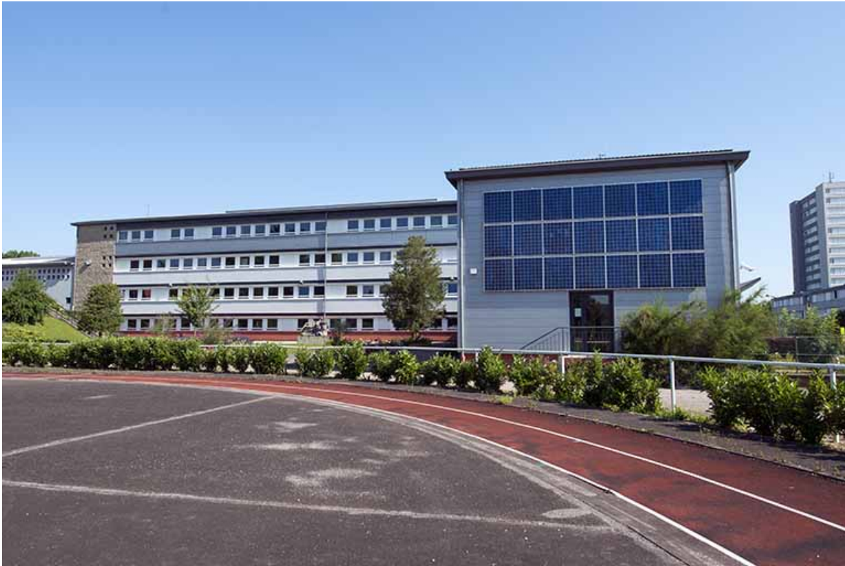
Pignon sud du bâtiment d'administration, façades sud des bâtiments d'externat et du préau.

70, Vesoul, 18 rue Edouard Belin, lieu-dit : Grand Mont Marin