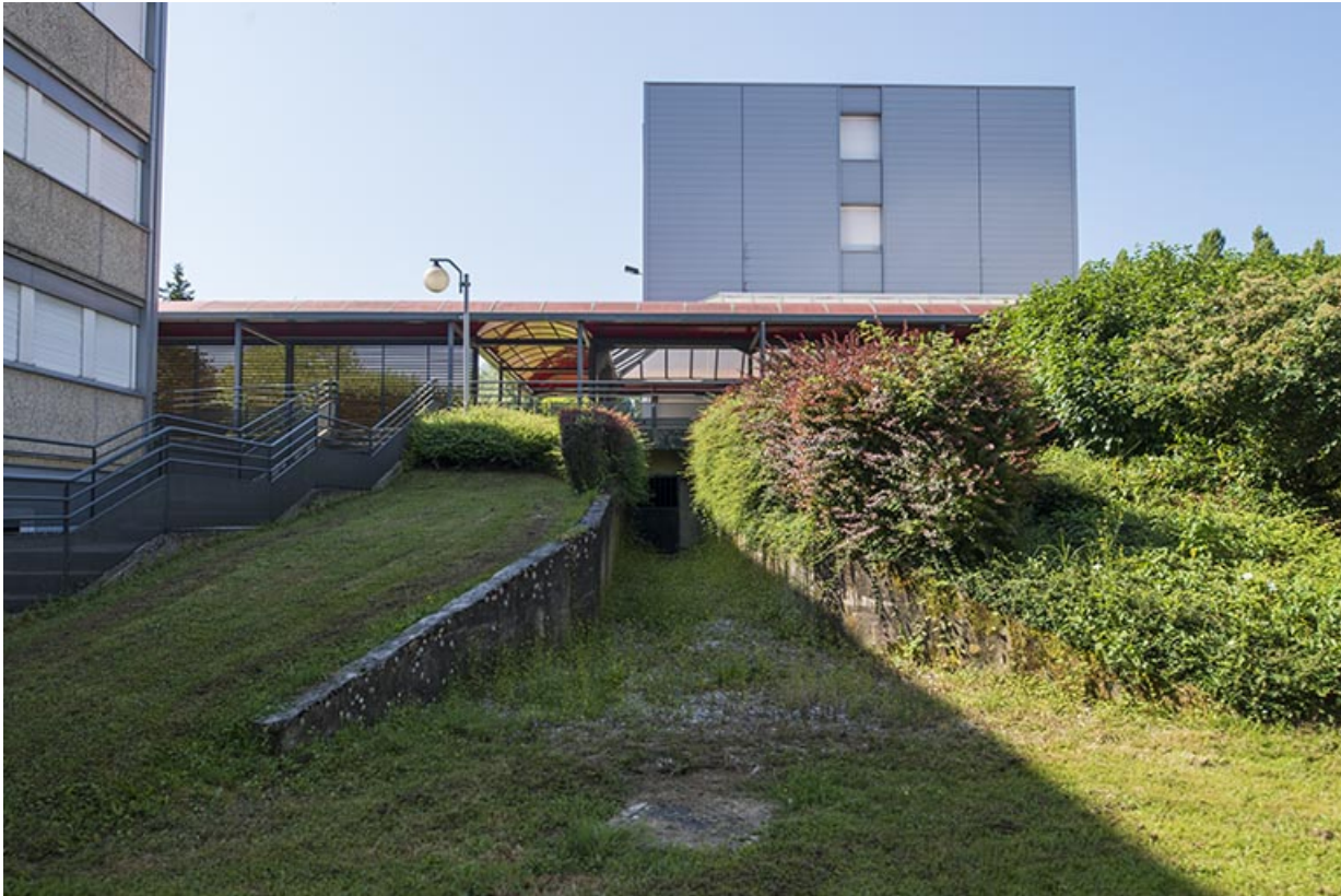
Espaces de circulation, pour parties couvertes, et pignon nord de l'externat et internat sud-ouest. 70, Vesoul, 18 rue Edouard Belin, lieudit : Grand Mont Marin