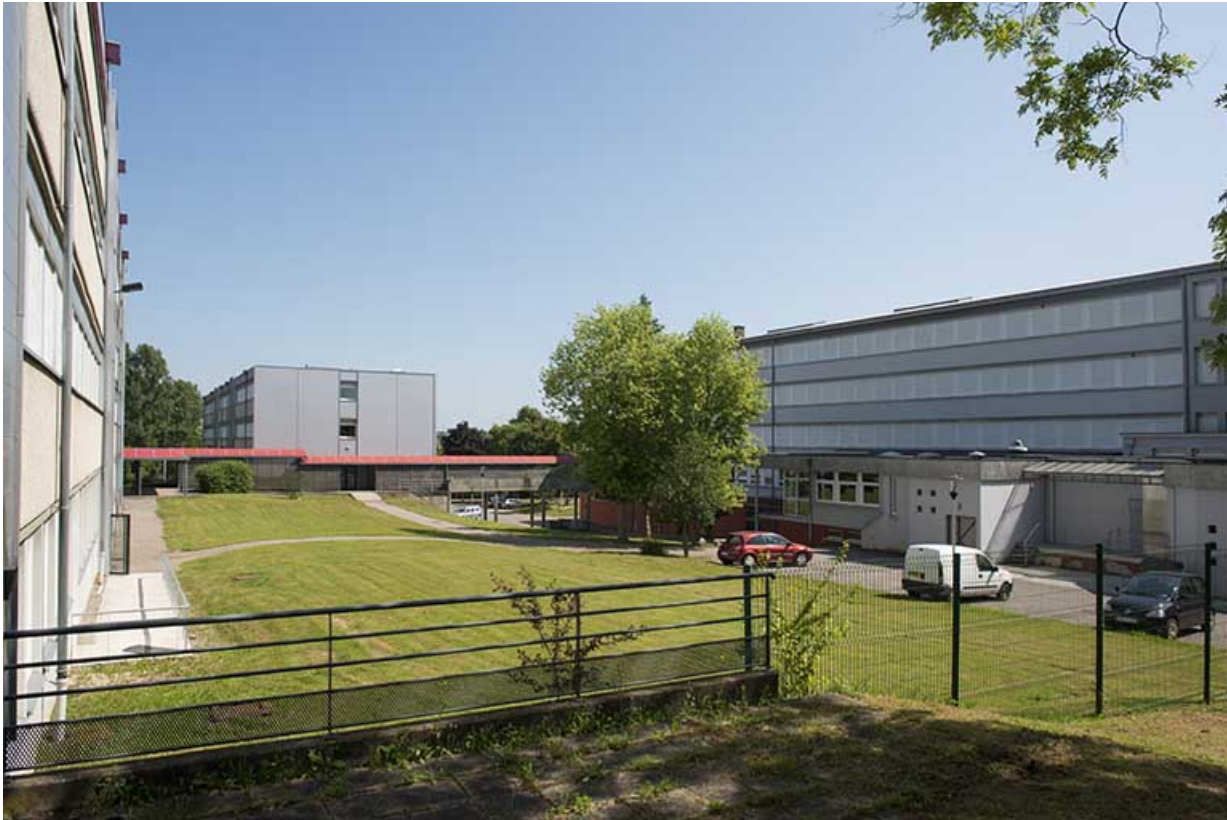
Espaces verts et de circulation, pour parties couvertes, entre les trois bâtiments d'externat et d'internat. 70, Vesoul, 18 rue Edouard Belin, lieu-dit : Grand Mont Marin