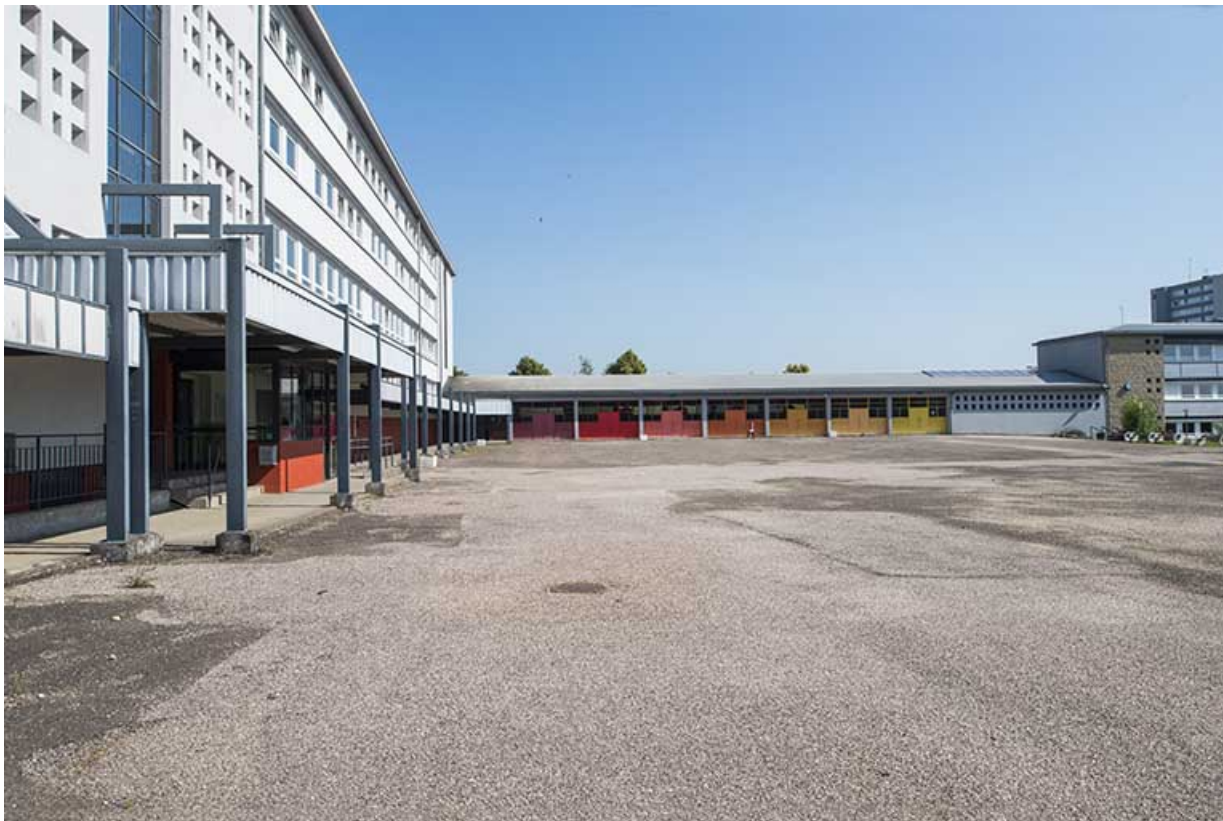
Cour devant les préaux et l'externat.

70, Vesoul, 18 rue Edouard Belin, lieudit : Grand Mont Marin