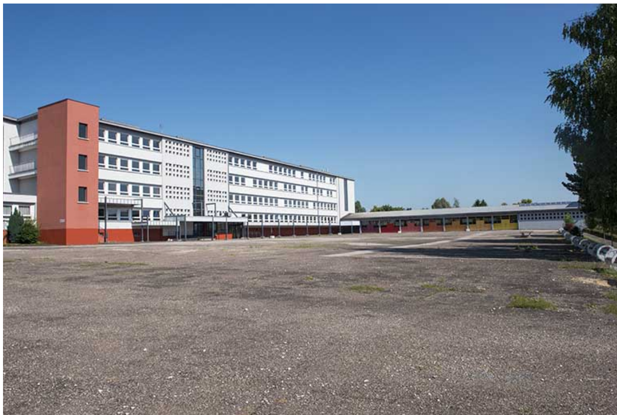
Cour devant les préaux et l'externat.

70, Vesoul, 18 rue Edouard Belin, lieudit : Grand Mont Marin