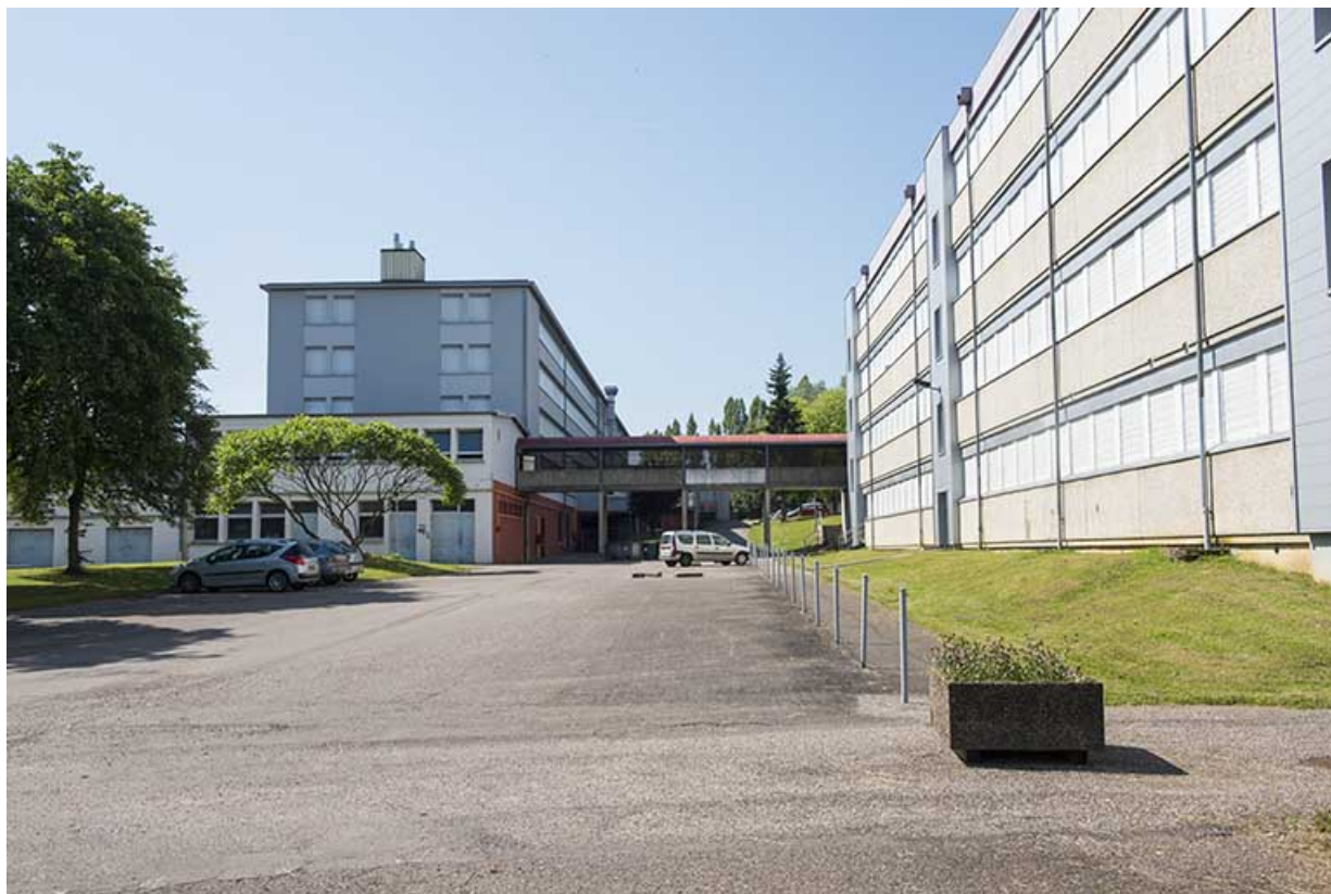
Aire de stationnement des véhicules des professeurs, angle nord-est du bâtiment d'externat et d'internat nord, façades nord du préau et de l'externat.

70, Vesoul, 18 rue Edouard Belin, lieudit : Grand Mont Marin