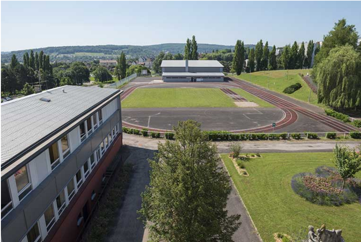
Le bâtiment d'administration, la piste d'athlétisme et le gymnase.

70, Vesoul, 18 rue Edouard Belin, lieudit : Grand Mont Marin