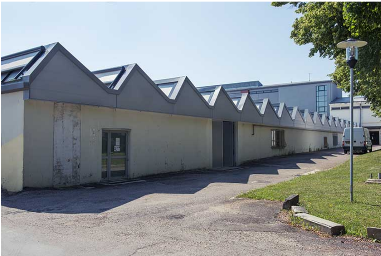
Façade est des ateliers sous sheds.

70, Vesoul, 18 rue Edouard Belin, lieudit : Grand Mont Marin