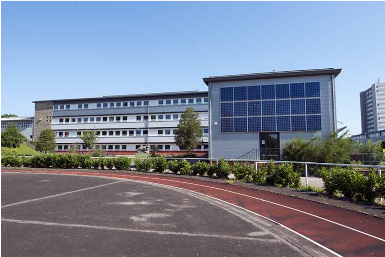
Pignon sud du bâtiment d'administration, façades sud des bâtiments d'externat et du préau.

70, Vesoul, 18 rue Edouard Belin, lieu-dit : Grand Mont Marin