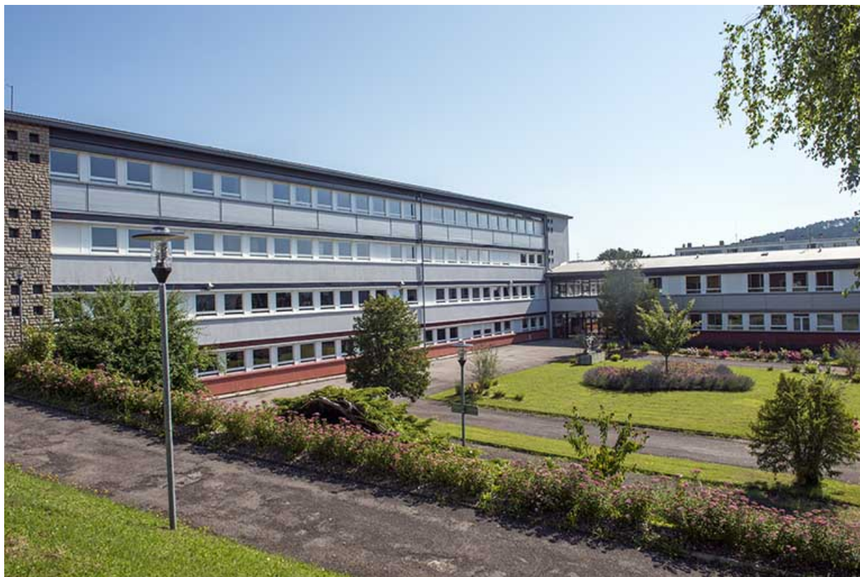
Cour d'honneur entre la façade ouest de l'administration et la façade sud de l'externat.

70, Vesoul, 18 rue Edouard Belin, lieudit : Grand Mont Marin