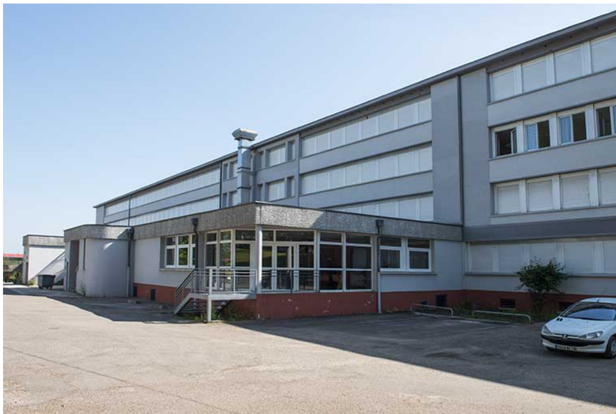
Façade ouest postérieure du bâtiment d'externat et de restauration.

70, Vesoul, 18 rue Edouard Belin, lieudit : Grand Mont Marin