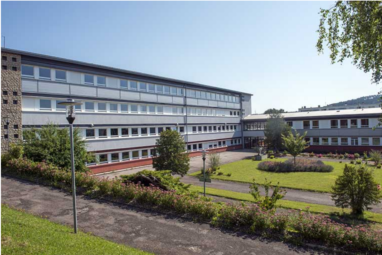
Cour d'honneur entre la façade ouest de l'administration et la façade sud de l'externat.

70, Vesoul, 18 rue Edouard Belin, lieudit : Grand Mont Marin