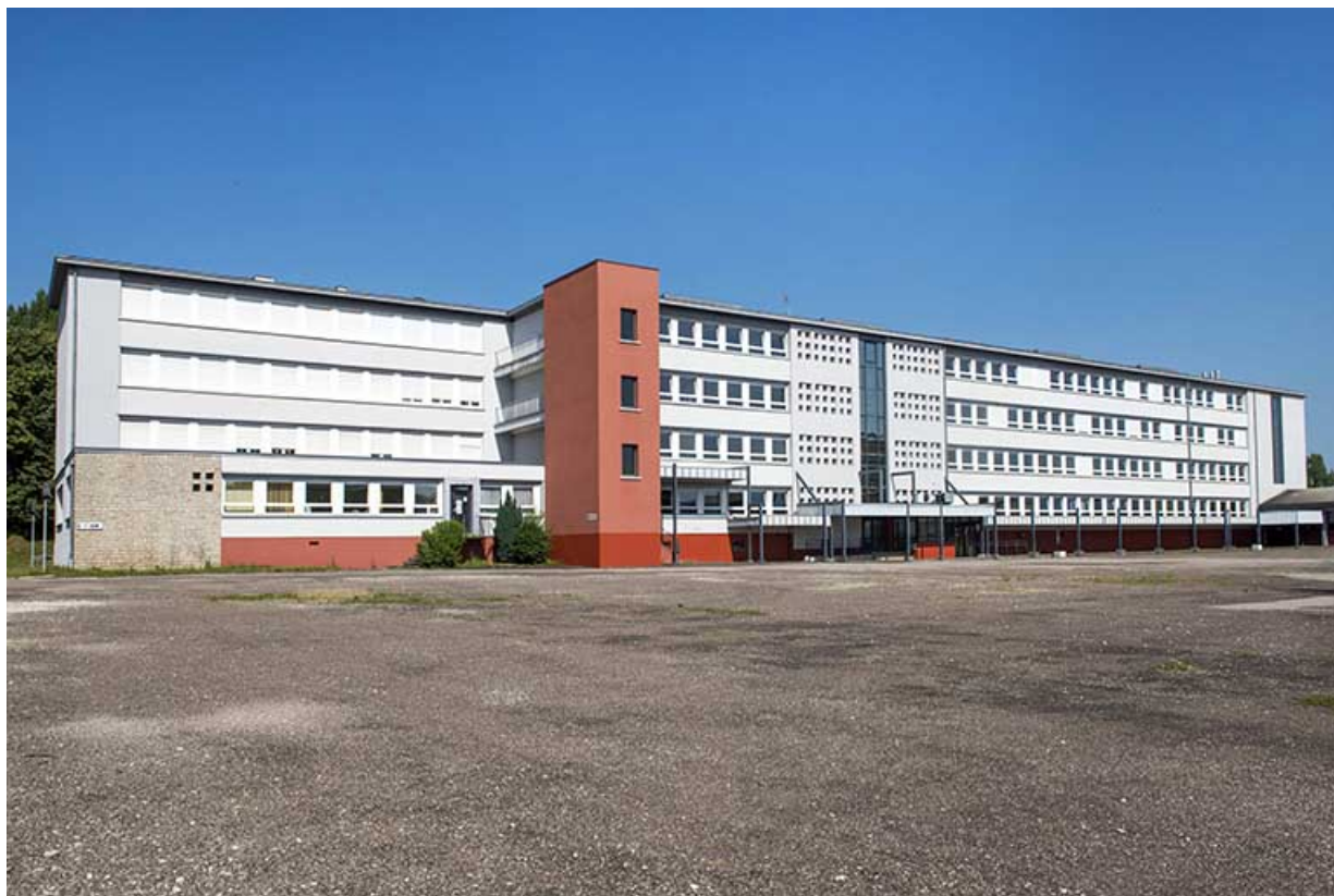
Façade orientale de l'externat donnant sur la cour.

70, Vesoul, 18 rue Edouard Belin, lieudit : Grand Mont Marin