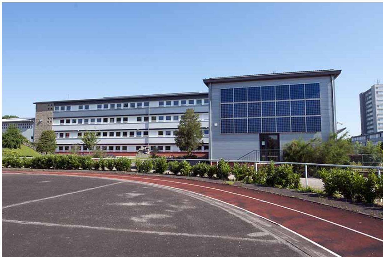
Pignon sud du bâtiment d'administration, façades sud des bâtiments d'externat et du préau.

70, Vesoul, 18 rue Edouard Belin, lieudit : Grand Mont Marin