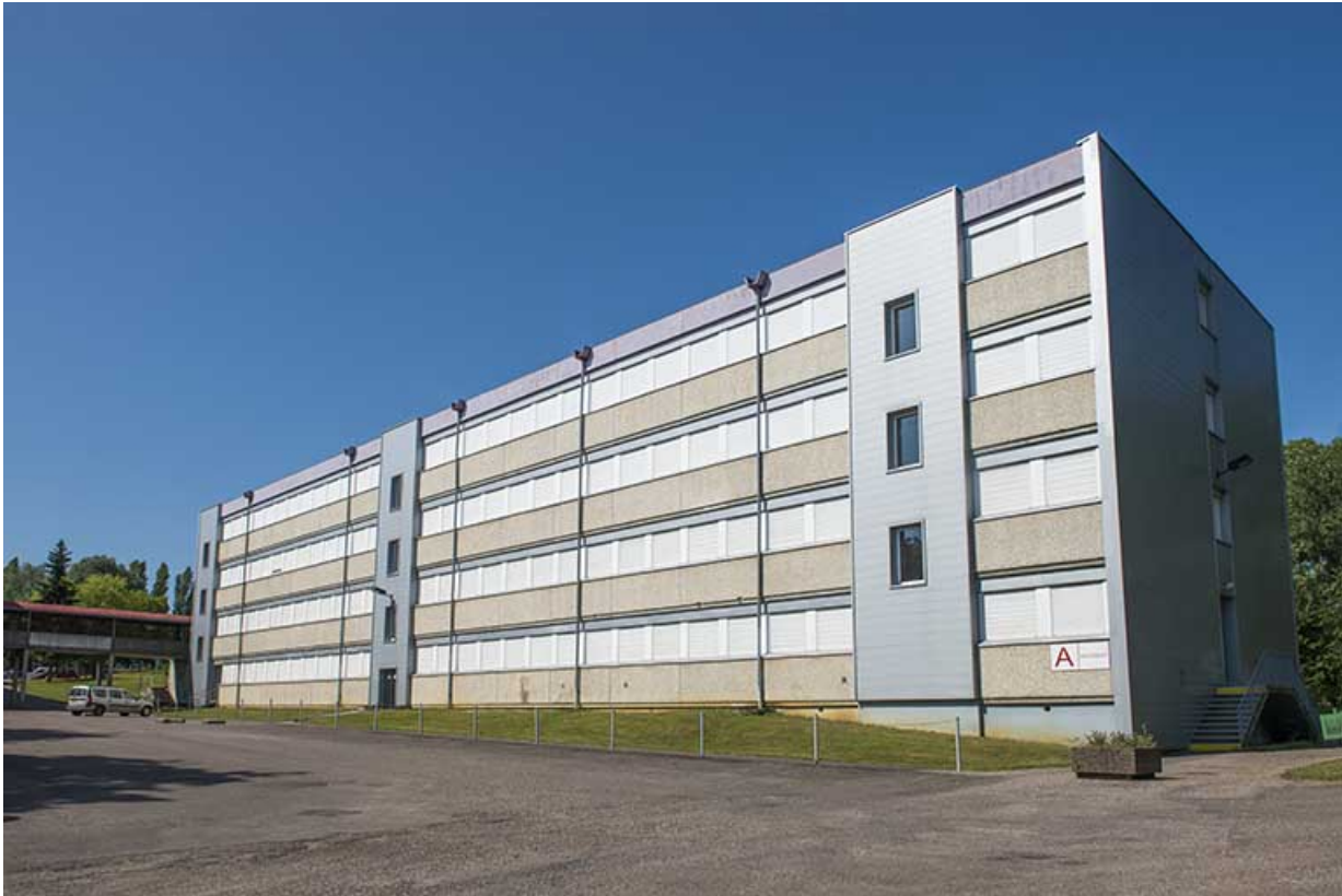
Nord-est de la façade antérieure du bâtiment d'externat et d'internat nord (A). 70, Vesoul, 18 rue Edouard Belin, lieudit : Grand Mont Marin