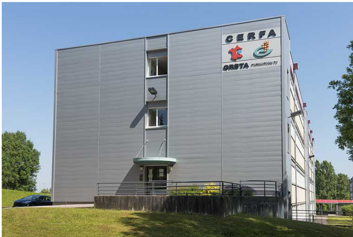
Angle sud-est du bâtiment d'externat et d'internat, dont cette moitié sud abrite le Greta.

70, Vesoul, 18 rue Edouard Belin, lieudit : Grand Mont Marin