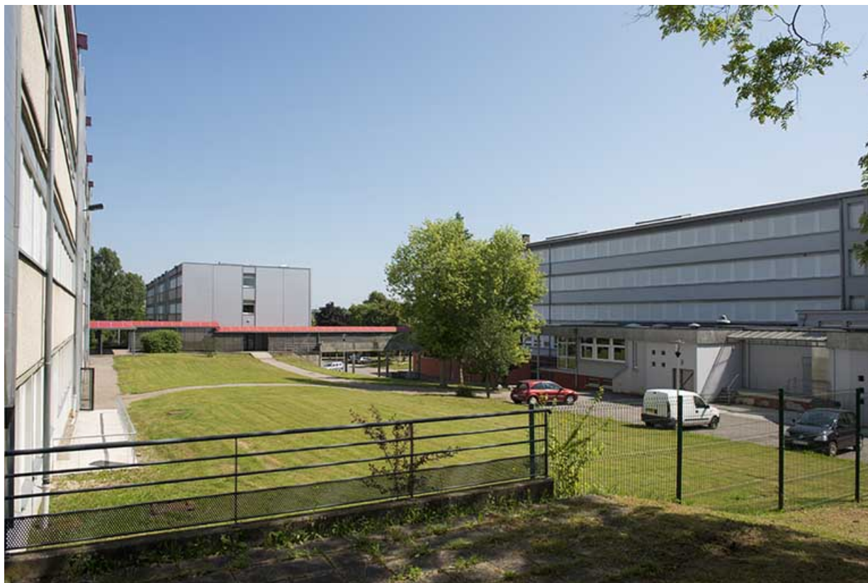
Espaces verts et de circulation, pour parties couvertes, entre les trois bâtiments d'externat et d'internat. 70, Vesoul, 18 rue Edouard Belin, lieu-dit : Grand Mont Marin