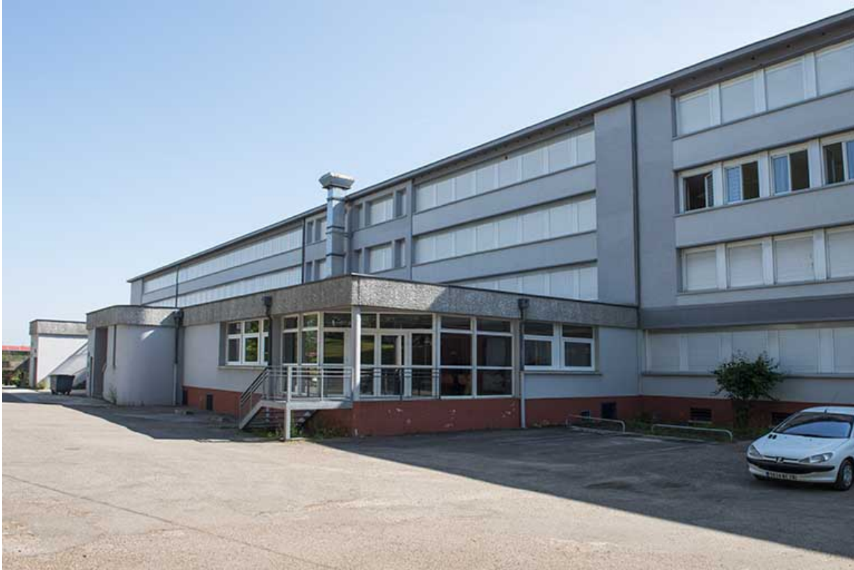
Façade ouest postérieure du bâtiment d'externat et de restauration.

70, Vesoul, 18 rue Edouard Belin, lieudit : Grand Mont Marin