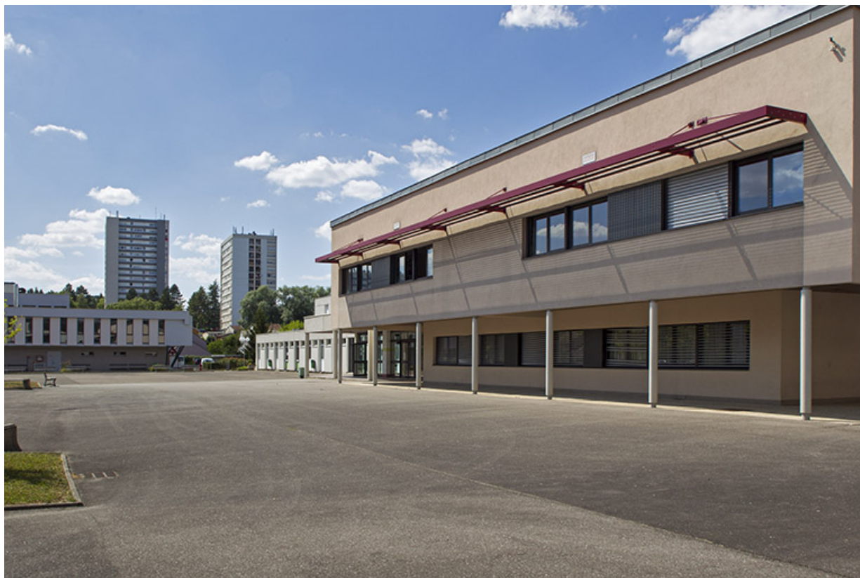
La cour vue de l'est.

70, Vesoul place Jacques Brel, lieudit : les rêpes