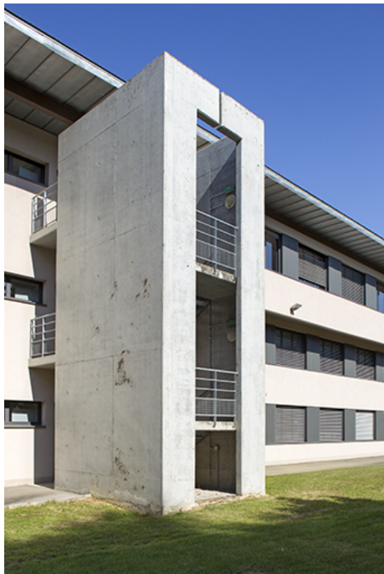
Détail de l'escalier de secours sur la façade postérieure de l'externat est, vu du sud-est.

70, Vesoul place Jacques Brel, lieudit : les rêpes