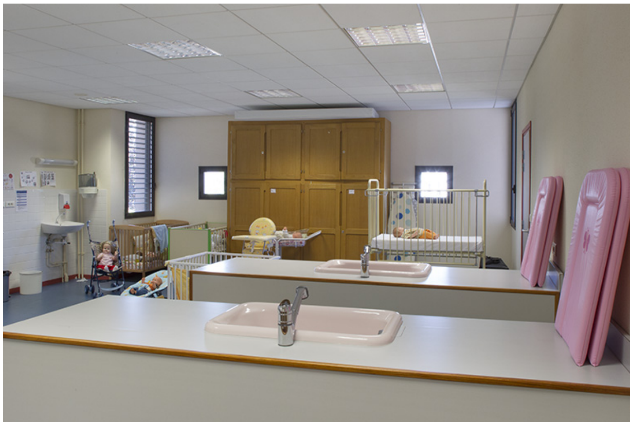
Salle de cours et d'exercice des formations de soins et services à la personne

70, Vesoul place Jacques Brel, lieudit : les rêpes