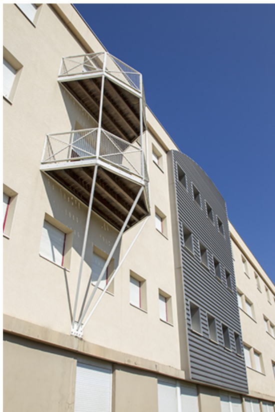
Détail de la façade est de l'internat.

70, Vesoul place Jacques Brel, lieudit : les rêpes