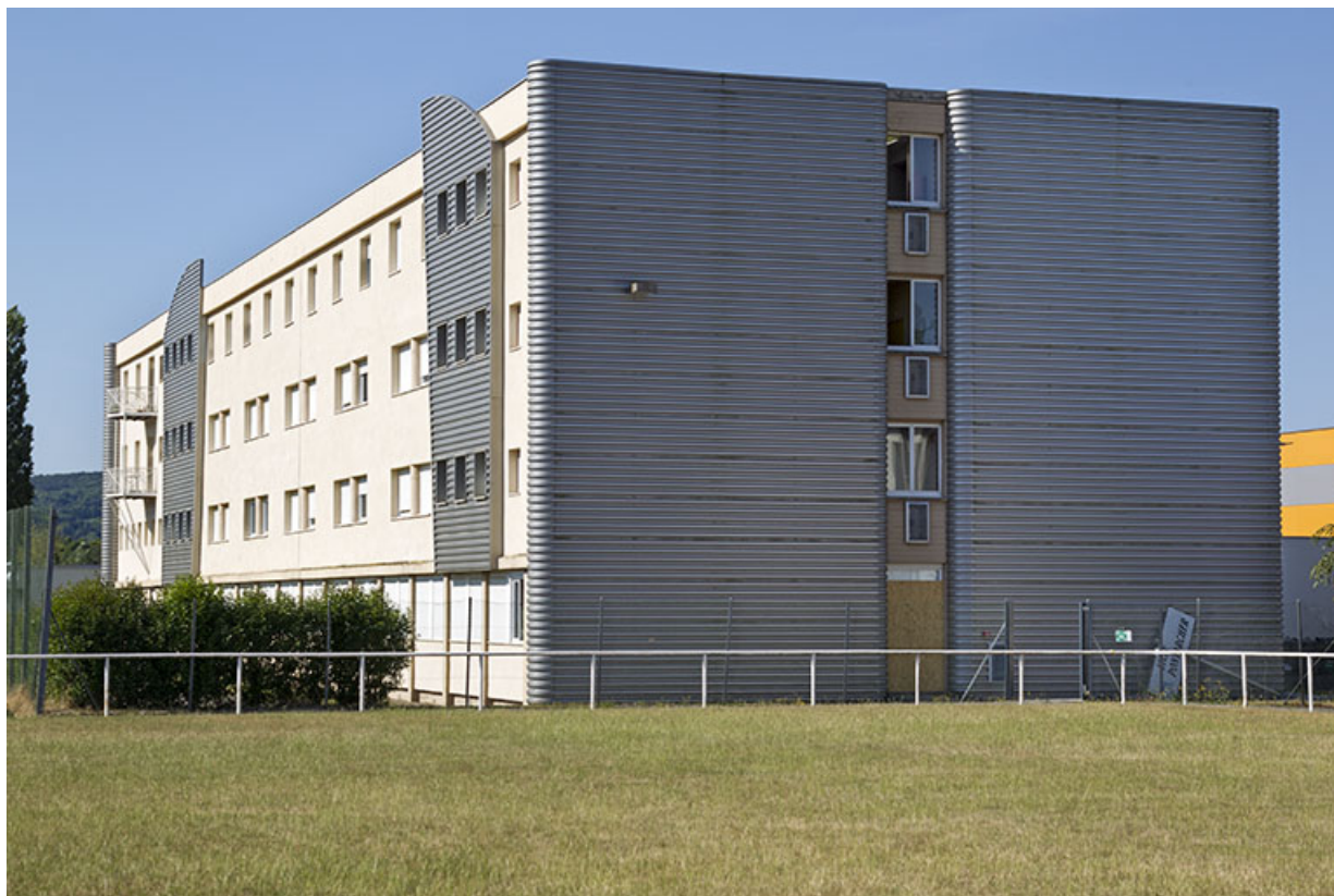
Pignon nord de l'internat.

70, Vesoul place Jacques Brel, lieudit : les rêpes