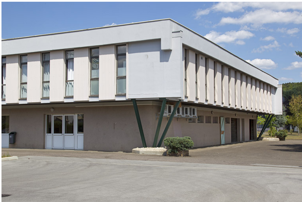
Angle sud-ouest de la cantine.

70, Vesoul place Jacques Brel, lieudit : les rêpes