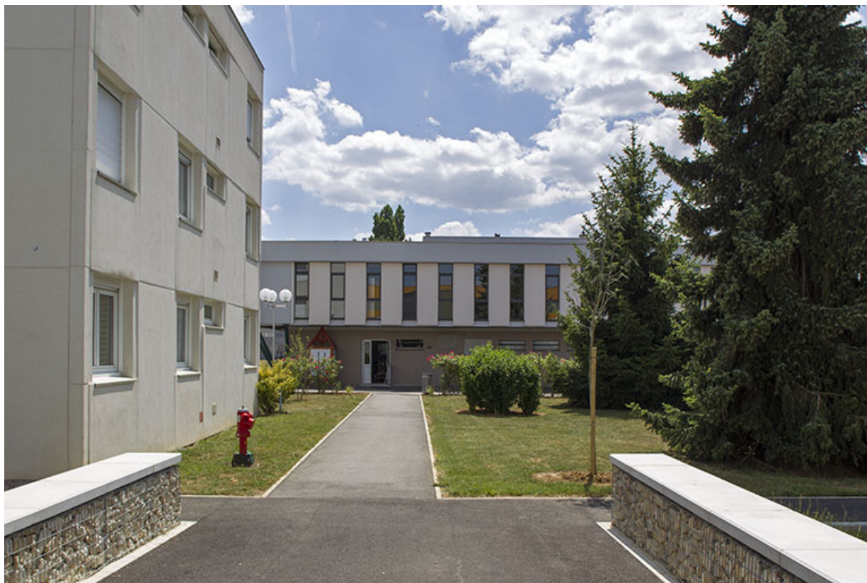
Détail de la façade nord de la cantine, vue depuis le long du pignon ouest des logements.

70, Vesoul place Jacques Brel, lieudit : les rêpes