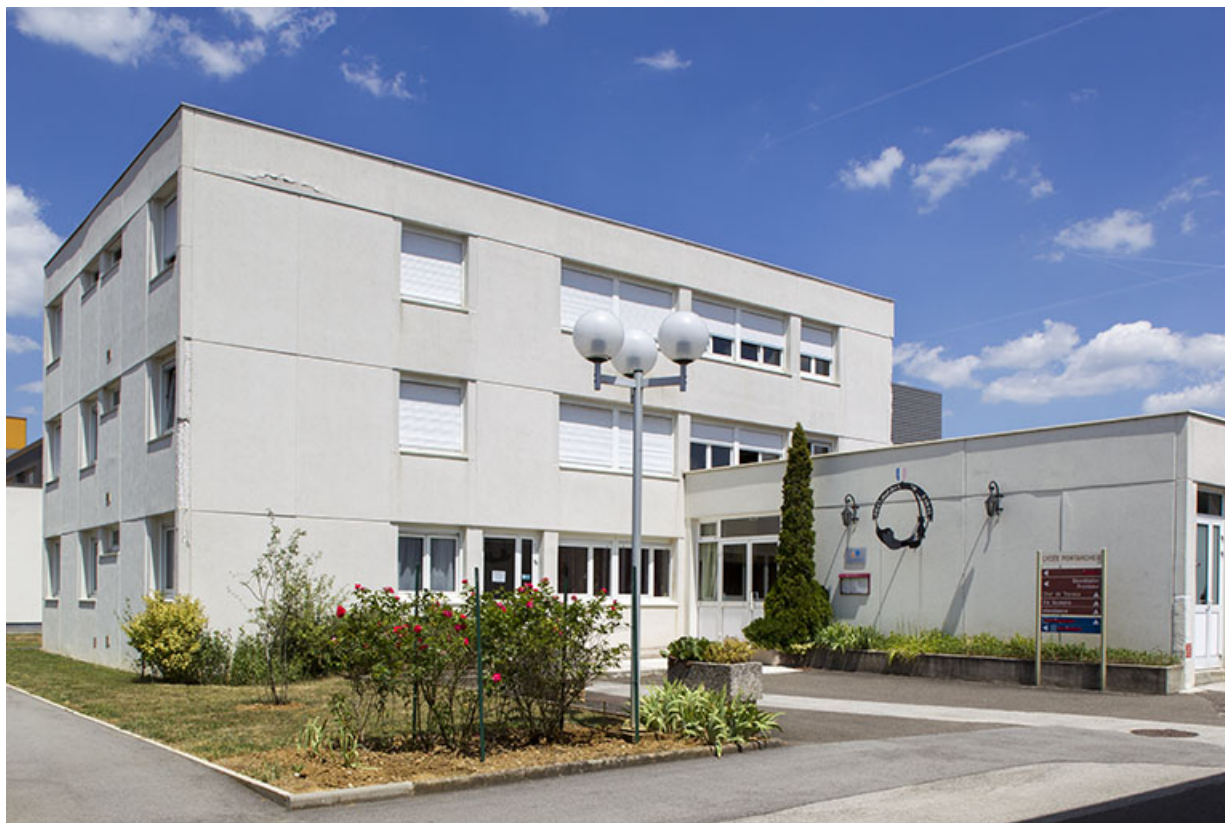
Entrée de l'ancien restaurant pédagogique et logements.

70, Vesoul place Jacques Brel, lieudit : les rêpes