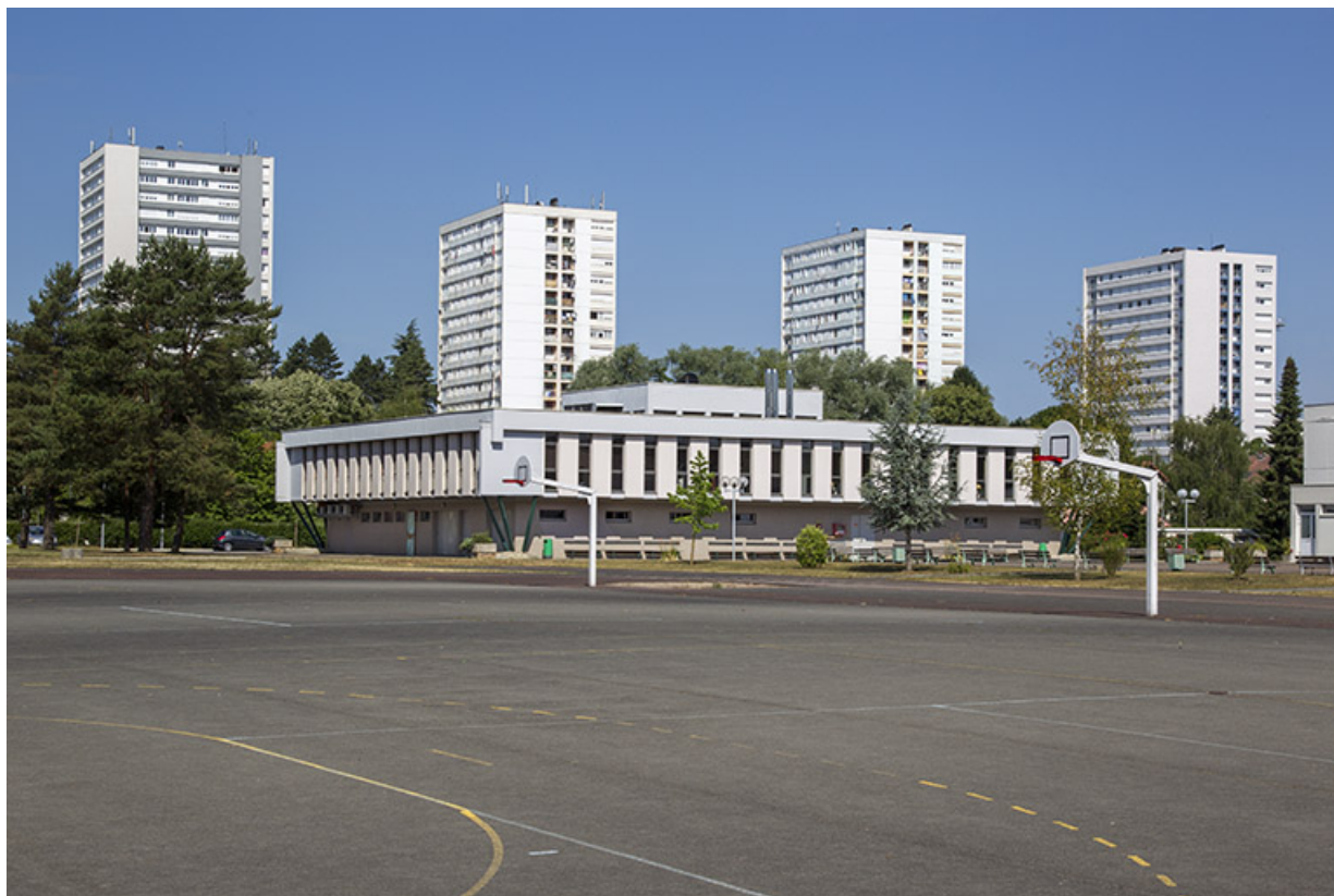
Vue éloignée de la cantine dans son quartier, depuis le sud-est.

70, Vesoul place Jacques Brel, lieudit : les rêpes