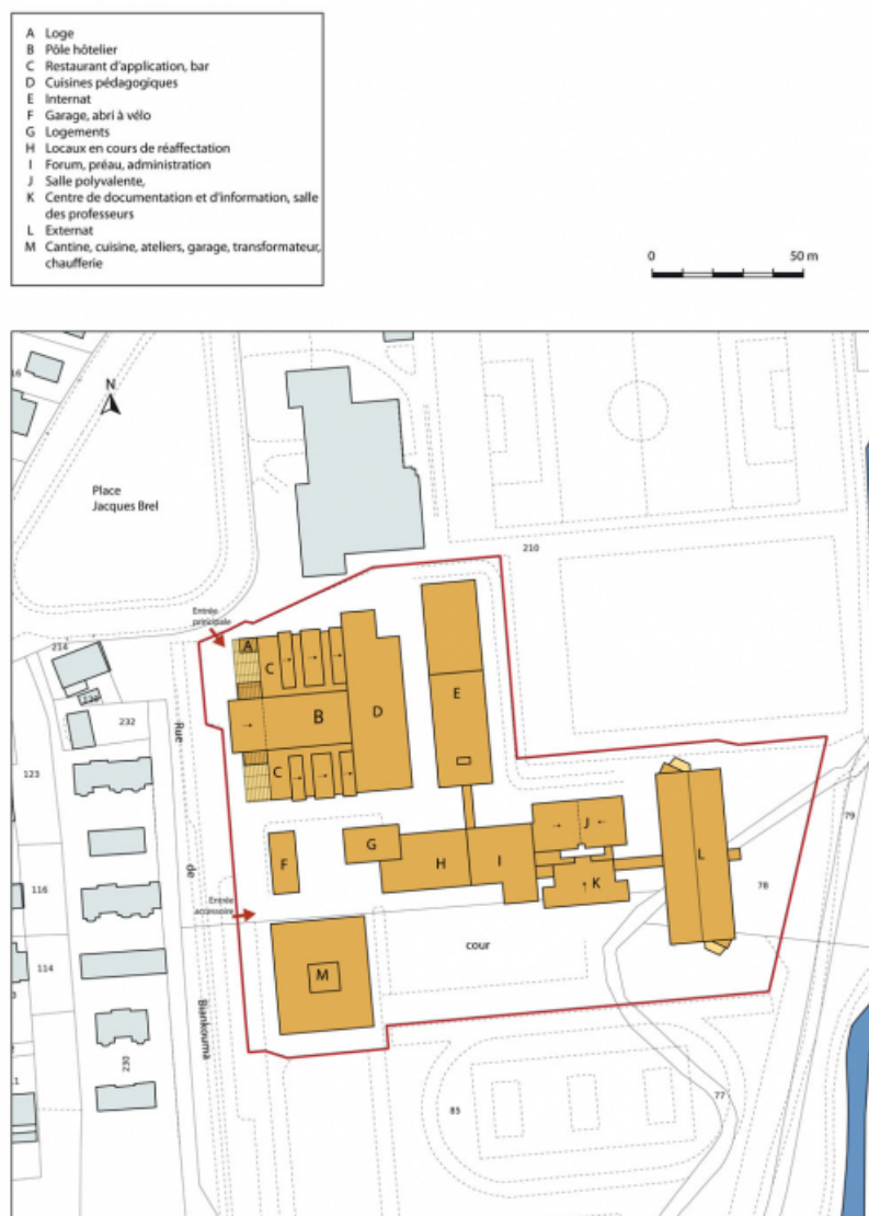
Plan-masse et de situation. Extrait du plan cadastral numérisé, section BO, échelle 1:1000.

70, Vesoul place Jacques Brel, lieudit : les rêpes