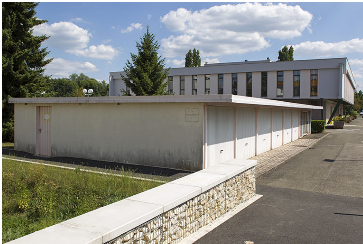
Vue d'ensemble des façades ouest du local à vélo et garages et de la cantine.

70, Vesoul place Jacques Brel, lieudit : les rêpes