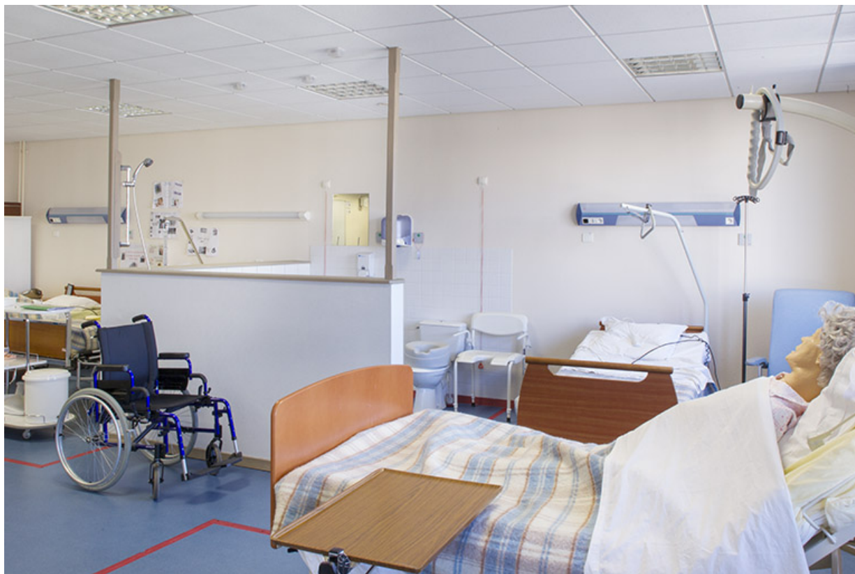
Salle de cours et d'exercice des formations de soins et services à la personne.

70, Vesoul place Jacques Brel, lieudit : les rêpes