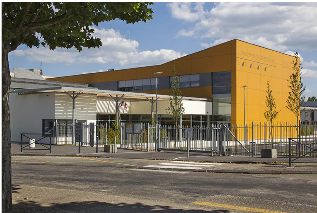
Vesoul : entrée du lycée professionnel Pontarcher.

70, Vesoul place Jacques Brel, lieudit : les rêpes