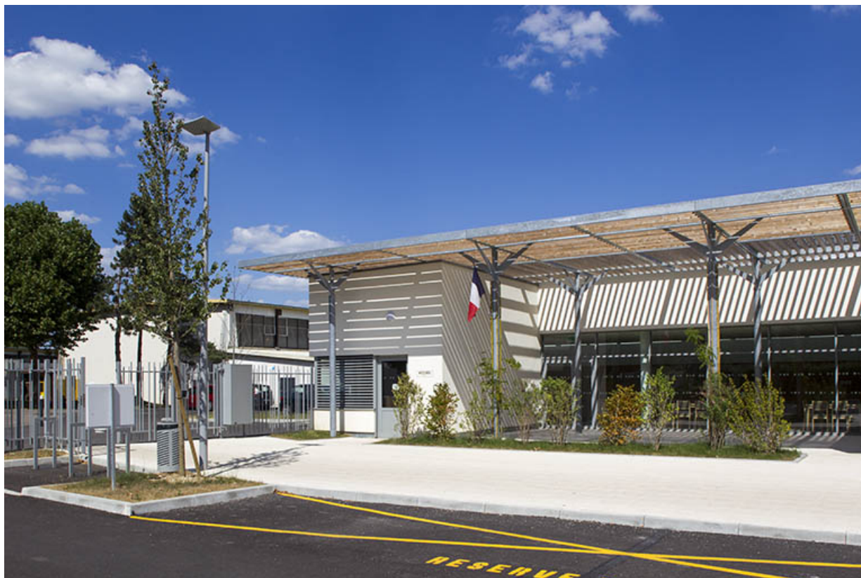
Détail de l'entrée sur la rue vue de la cour.

70, Vesoul place Jacques Brel, lieudit : les rêpes