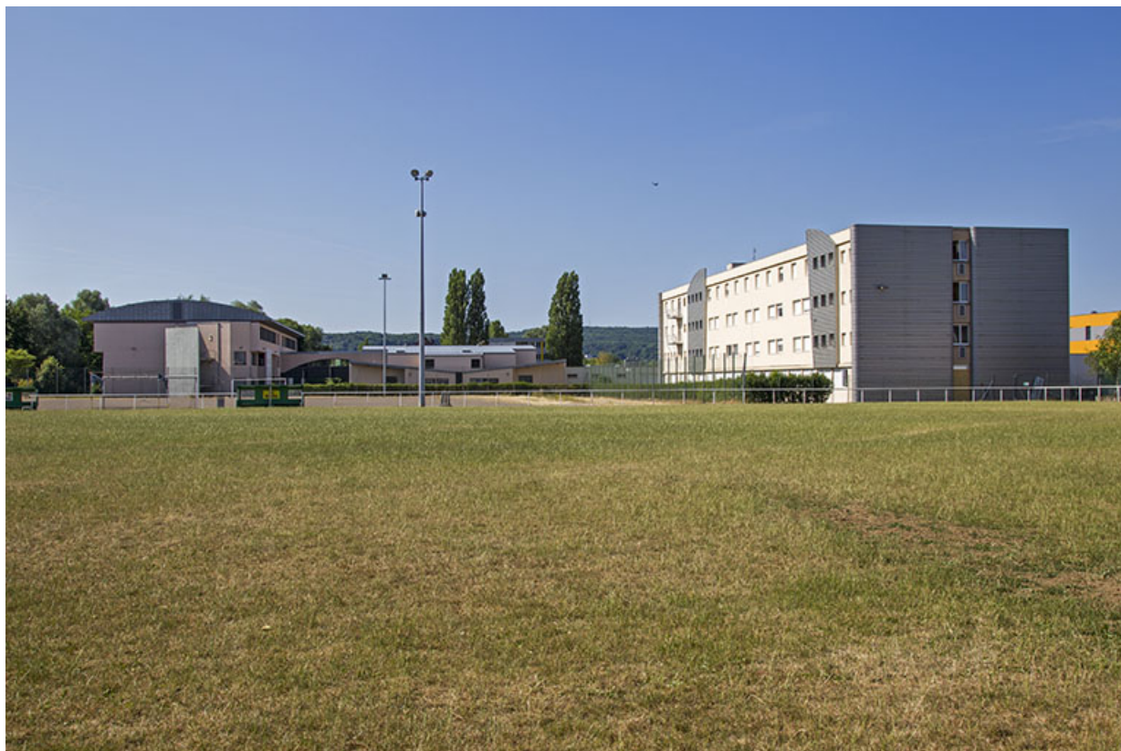
Façades nord des externats depuis le stade au nord.

70, Vesoul place Jacques Brel, lieudit : les rêpes