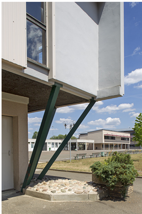
Détail de l'angle sud-est de la cantine.

70, Vesoul place Jacques Brel, lieudit : les rêpes