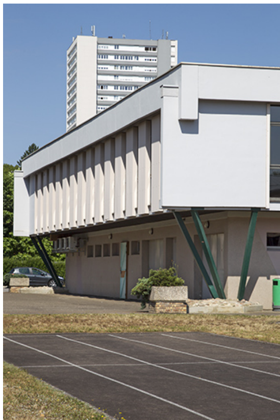
Pignon sud de la cantine.

70, Vesoul place Jacques Brel, lieudit : les rêpes