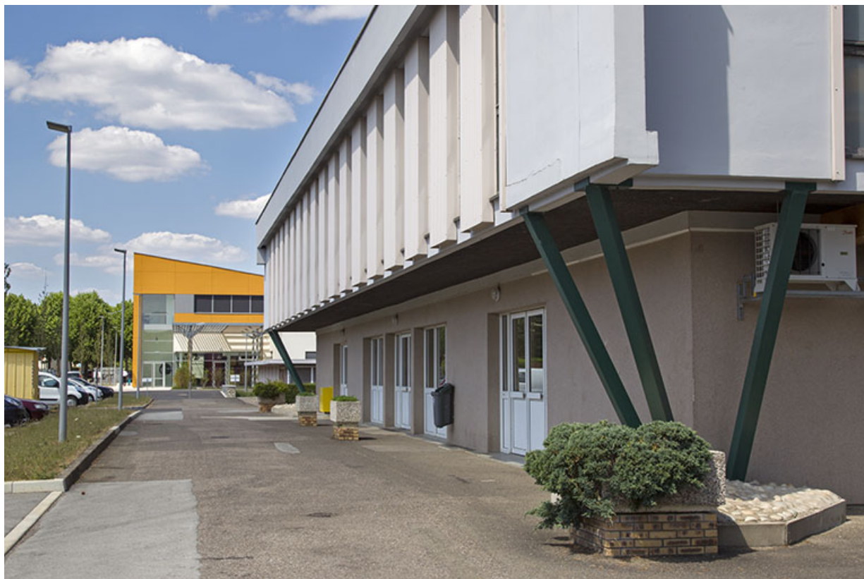
Angle sud-ouest de la cantine, les entrées et sorties sur la façade ouest.

70, Vesoul place Jacques Brel, lieudit : les rêpes