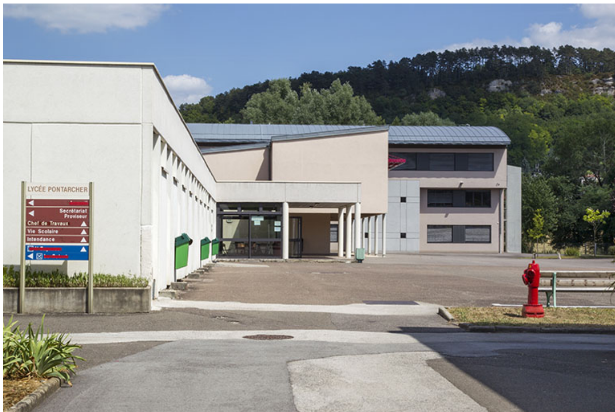
Cour, façade sud de l'externat, façade ouest de l'externat est.

70, Vesoul place Jacques Brel, lieudit : les rêpes