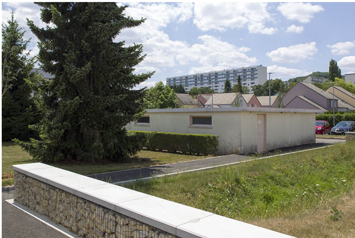
Façade postérieure est et pignon nord du local à vélo et garages.

70, Vesoul place Jacques Brel, lieudit : les rêpes