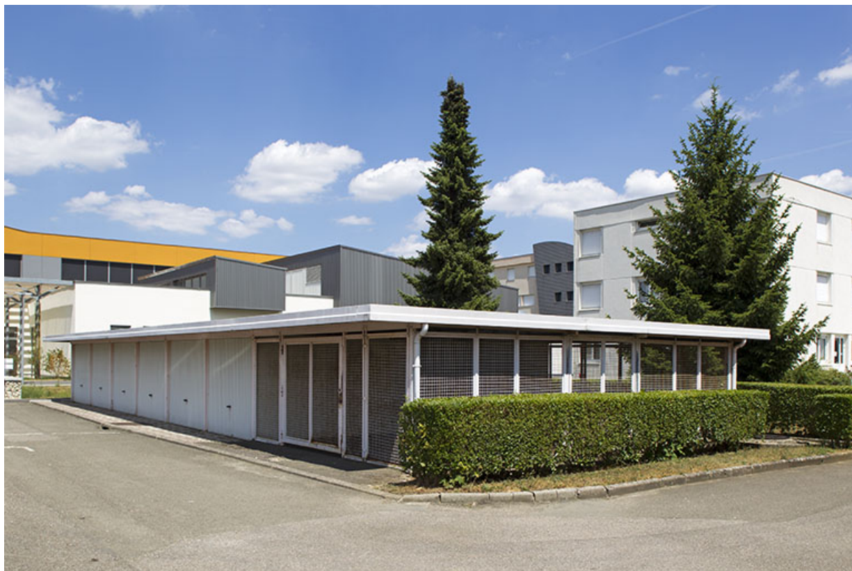
Vue d'ensemble depuis l'angle sud-ouest du local à vélo et garages.

70, Vesoul place Jacques Brel, lieudit : les rêpes