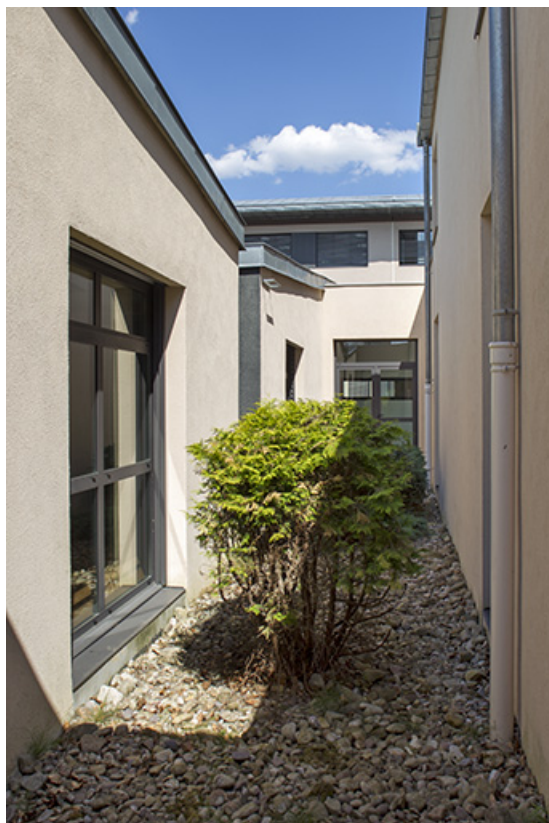
Puits de lumière jouxtant le centre de documentation et d'information.

70, Vesoul place Jacques Brel, lieudit : les rêpes