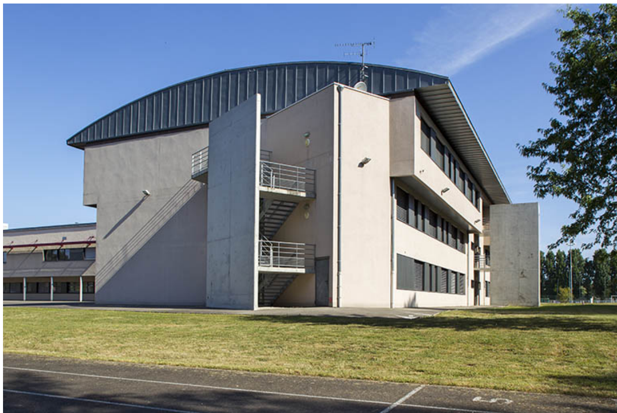
Angle sud-est de l'externat est.

70, Vesoul place Jacques Brel, lieudit : les rêpes