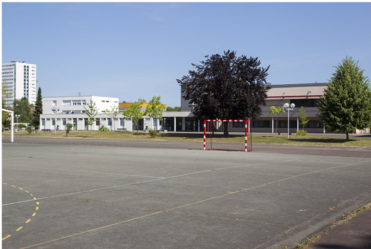
Vue du sud-est sur l'administration et l'externat.

70, Vesoul place Jacques Brel, lieudit : les rêpes