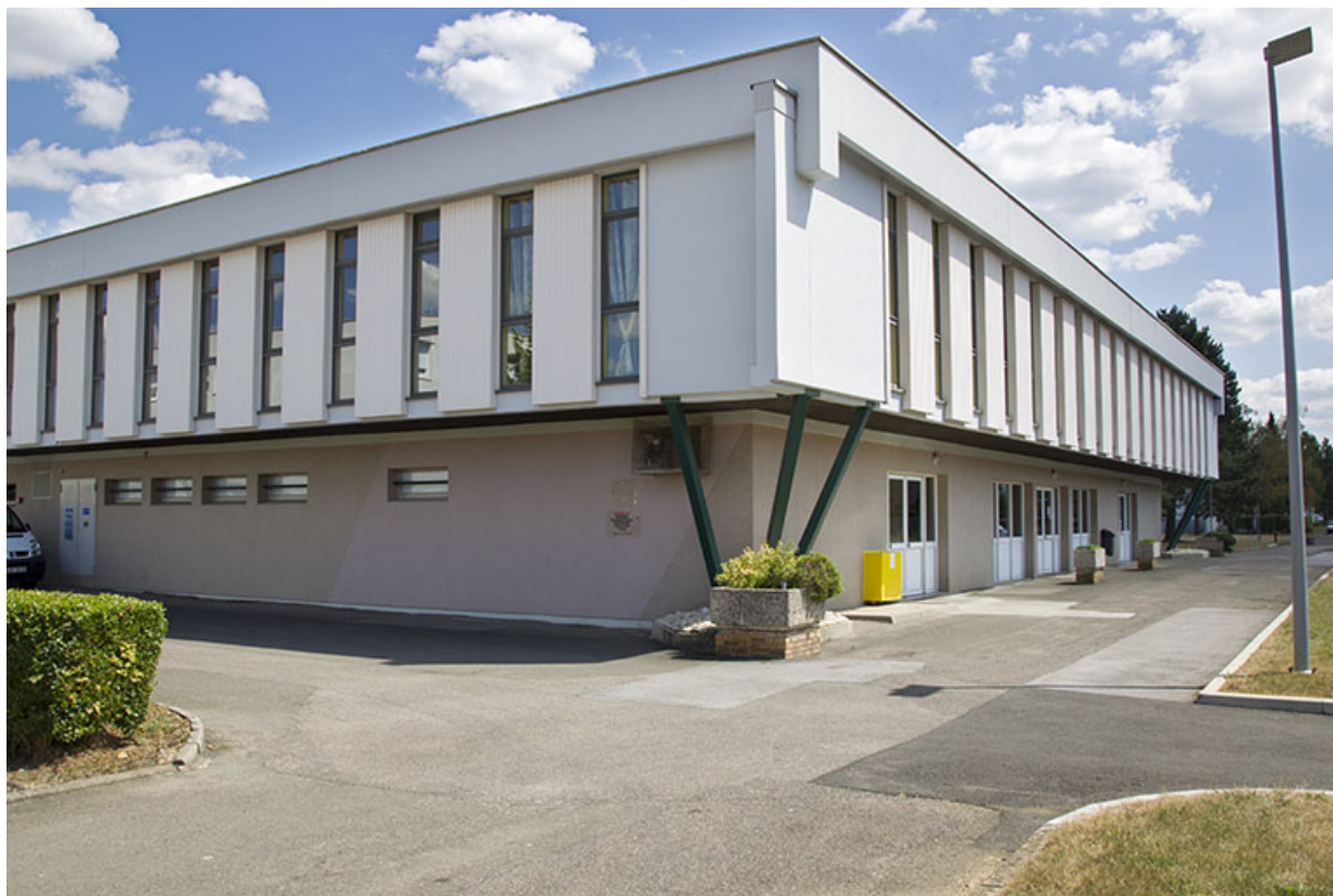
Angle nord-ouest de la cantine, les entrées et sorties sur la façade ouest.

70, Vesoul place Jacques Brel, lieudit : les rêpes