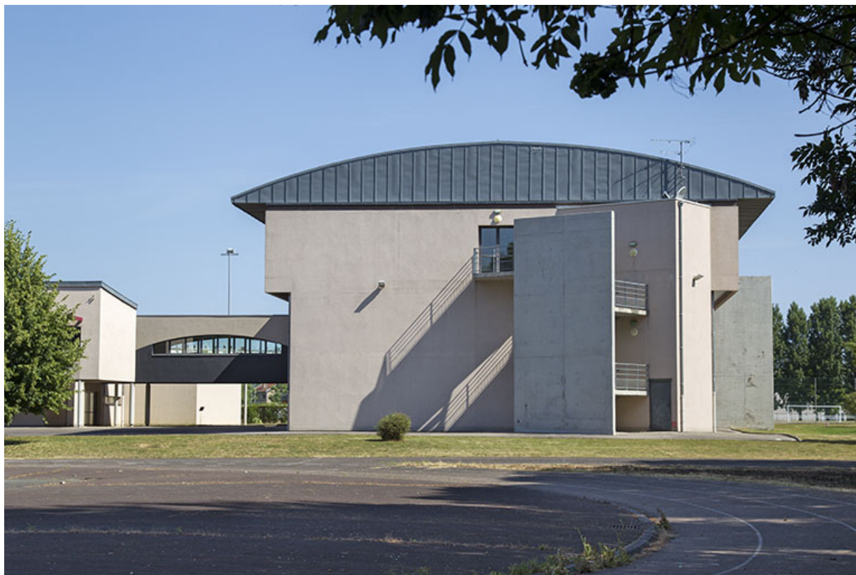
Pignon sud de l'externat est.

70, Vesoul place Jacques Brel, lieudit : les rêpes