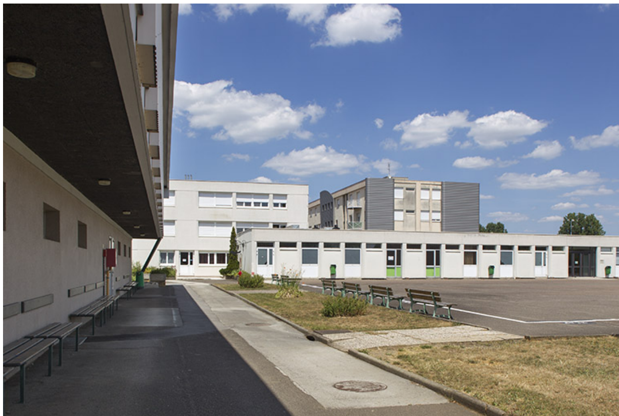
Le long de la façade est de la cantine, vue sur les façades sud de l'administration et le pignon sud de l'internat.

70, Vesoul place Jacques Brel, lieudit : les rêpes