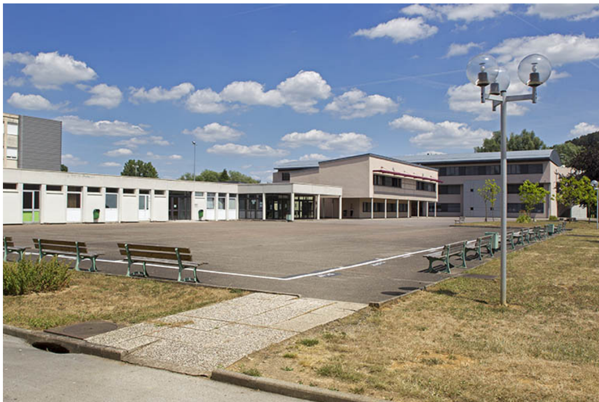
La cour vue du sud-ouest.

70, Vesoul place Jacques Brel, lieudit : les rêpes