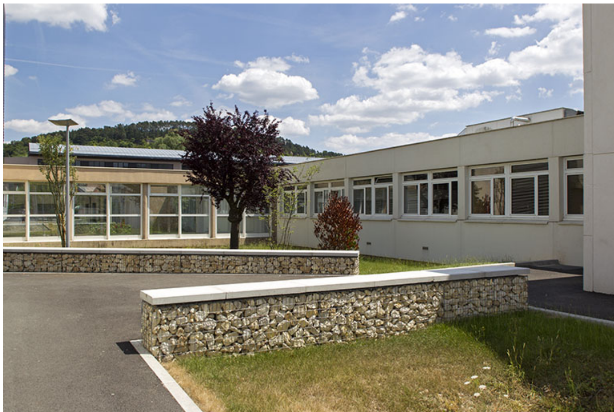
Façade postérieure nord du bâtiment de l'administration et couloir de liaison vers l'internat.

70, Vesoul place Jacques Brel, lieudit : les rêpes