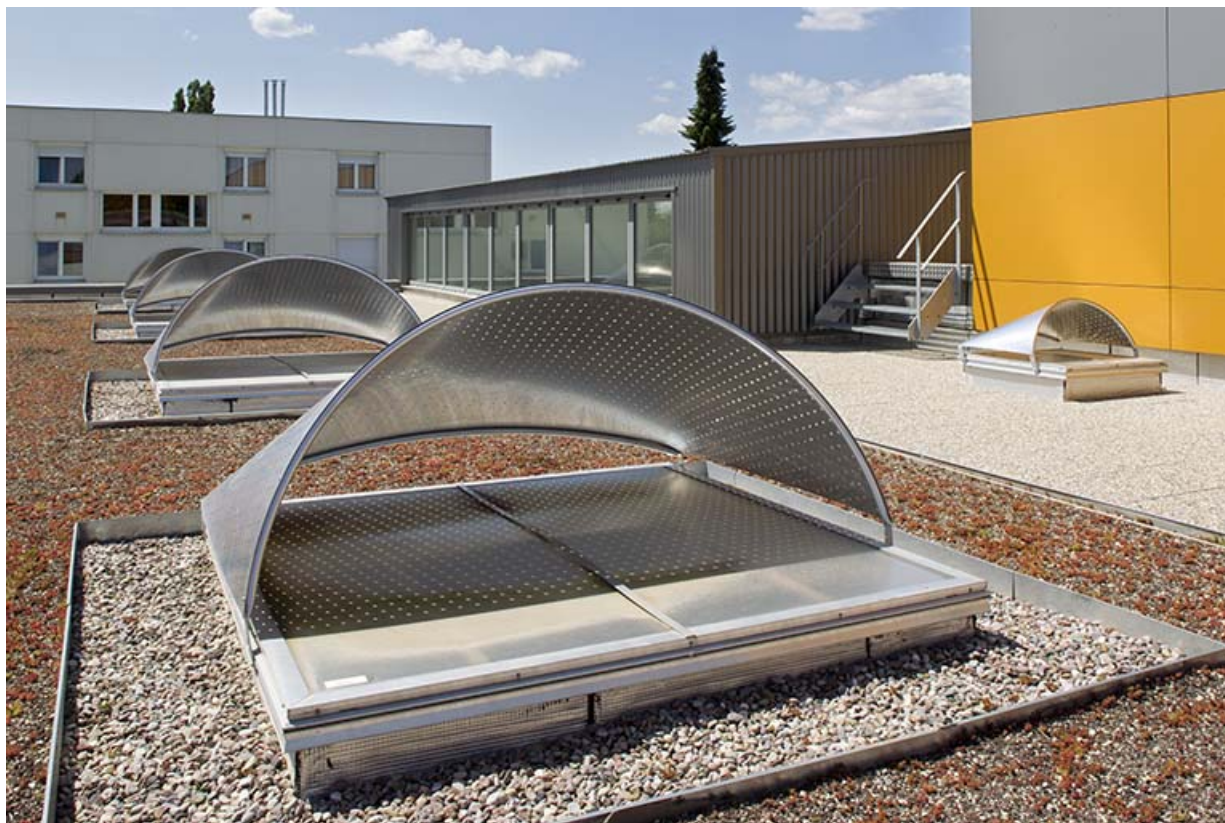
Détails des terrasses sud du pôle hôtelier, vus du nord.

70, Vesoul place Jacques Brel, lieudit : les rêpes