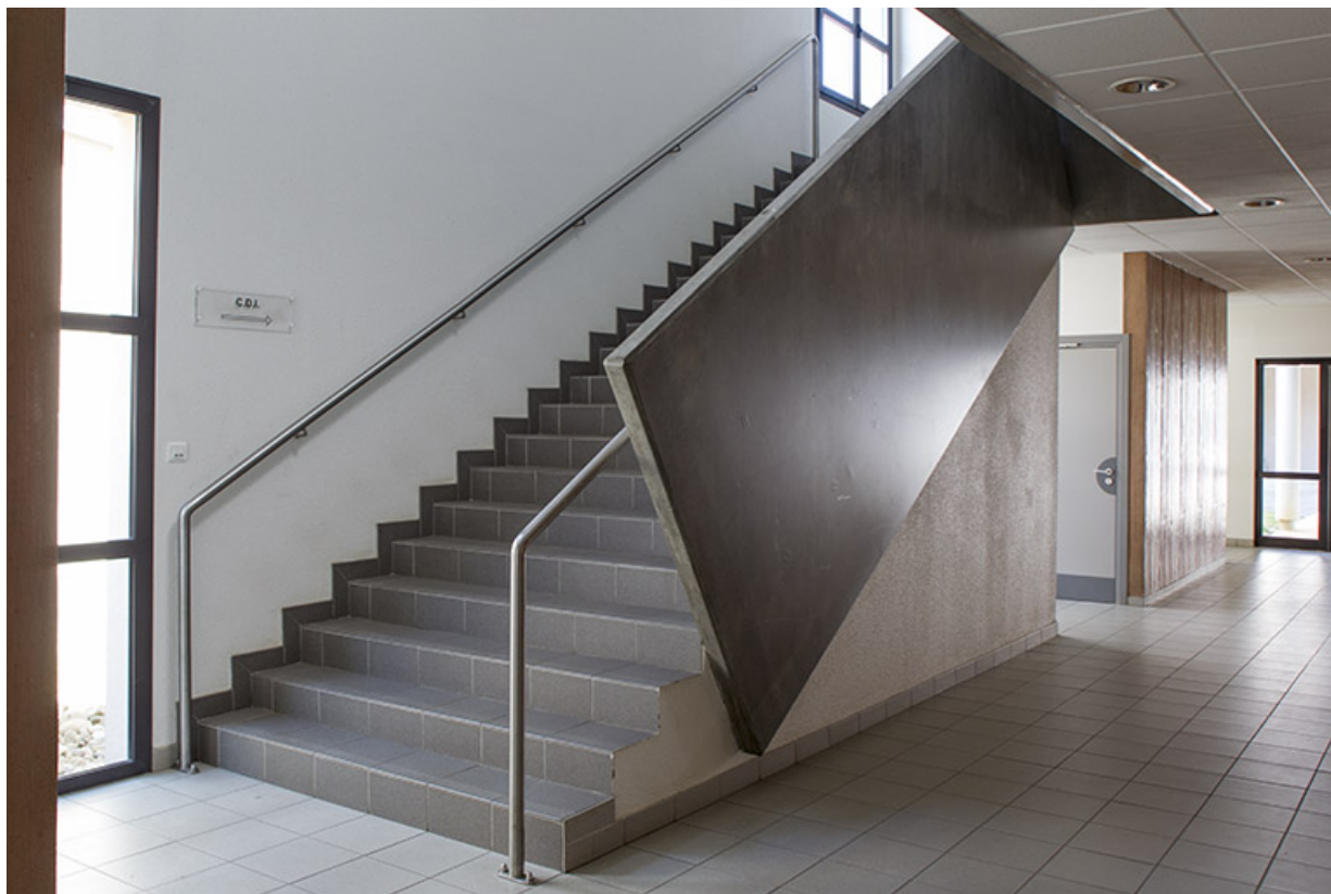
Détail d'escalier dans l'externat est.

70, Vesoul place Jacques Brel, lieudit : les rêpes