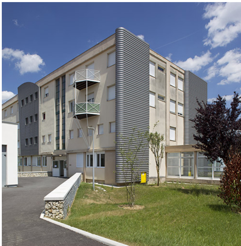
Angle sud-ouest, pignon sud de l'internat.

70, Vesoul place Jacques Brel, lieudit : les rêpes