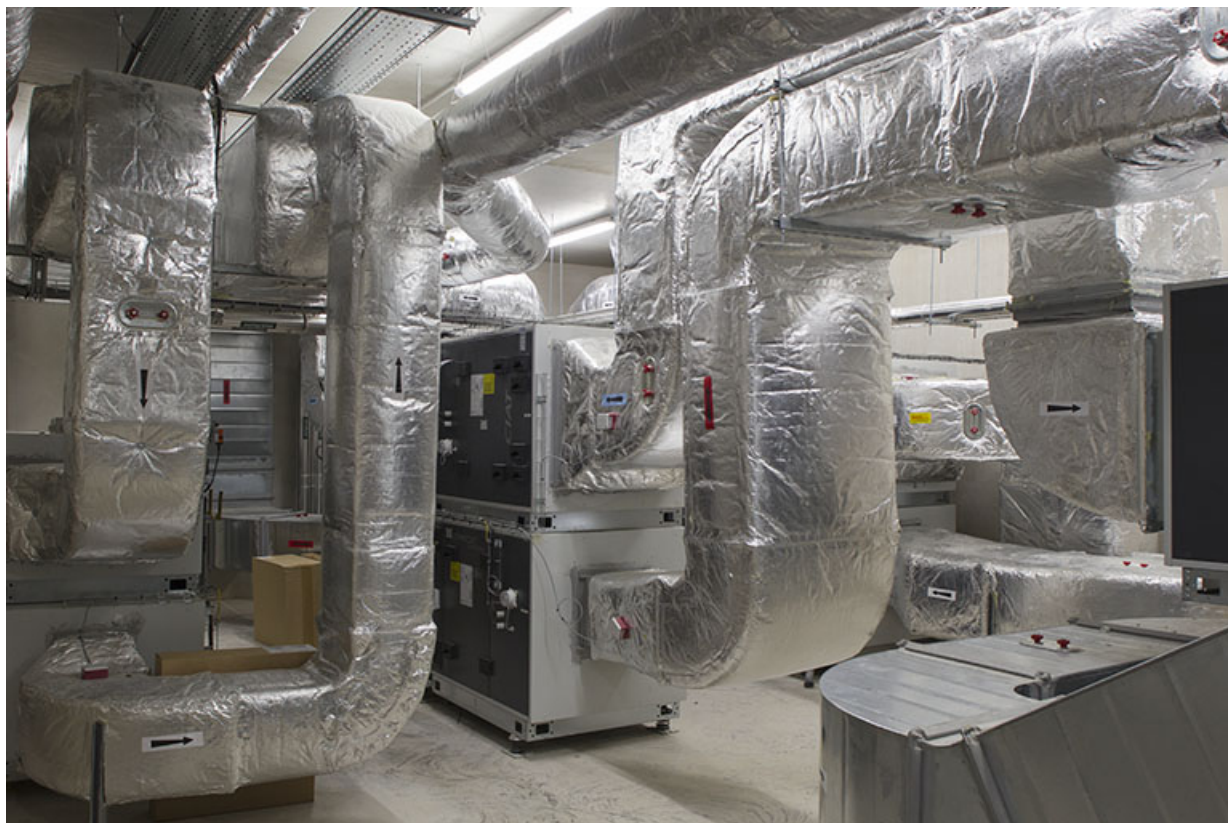
Machinerie d'extraction d'air du pôle hôtelier.

70, Vesoul place Jacques Brel, lieudit : les rêpes