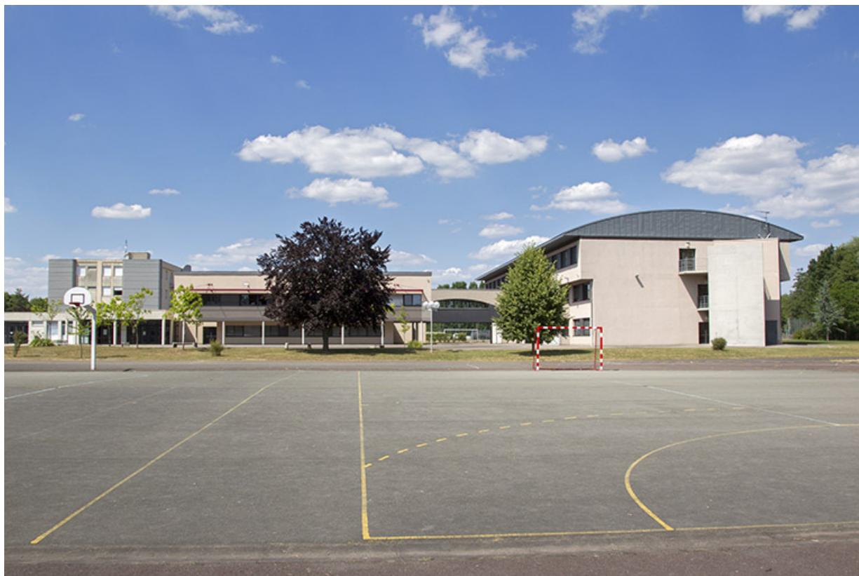
Terrain de sport et façades et pignon sud des externats.

70, Vesoul place Jacques Brel, lieudit : les rêpes