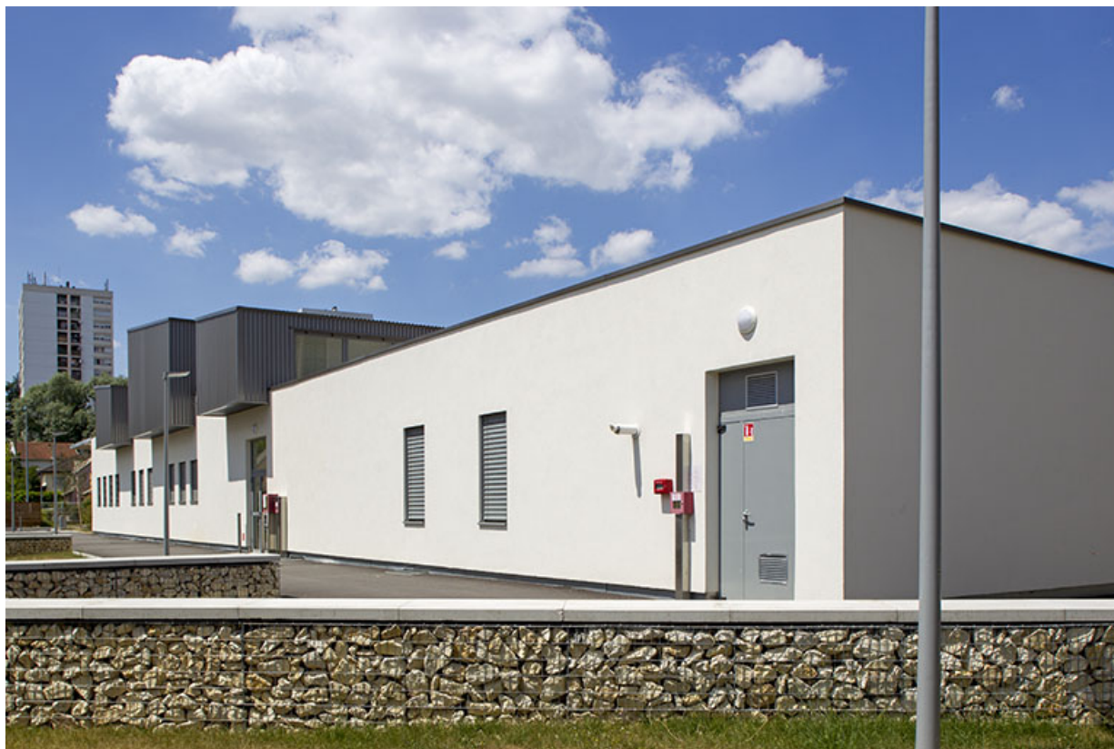
Façade sud du pôle hôtelier, vue de trois-quart sud-est.

70, Vesoul place Jacques Brel, lieudit : les rêpes