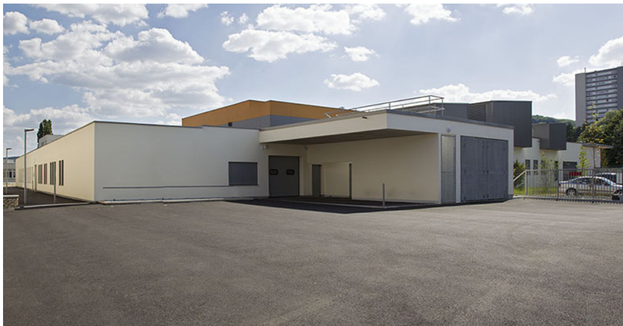
Façades postérieures du pôle hôtelier, vues de trois-quart nord-est.

70, Vesoul place Jacques Brel, lieudit : les rêpes