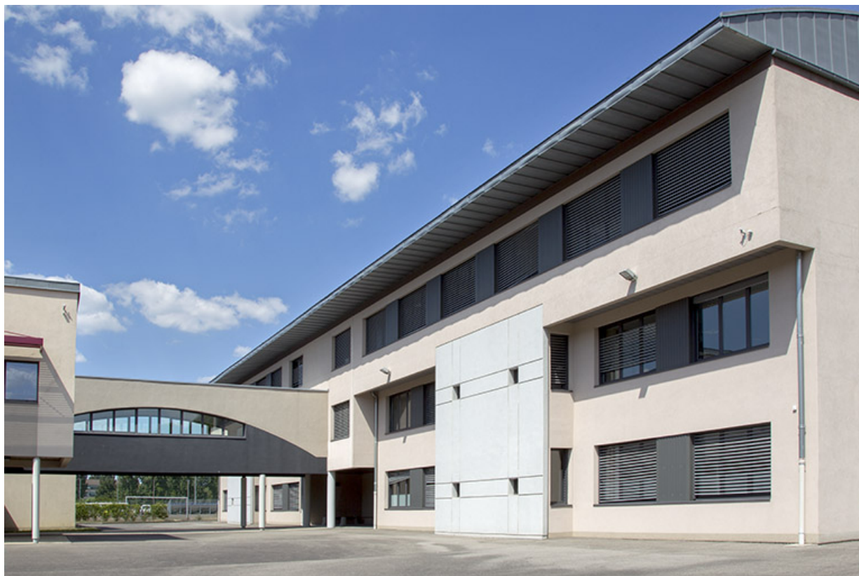
Vue de trois-quart sud-ouest de la façade antérieure de l'externat est et sa liaison aérienne.

70, Vesoul place Jacques Brel, lieudit : les rêpes