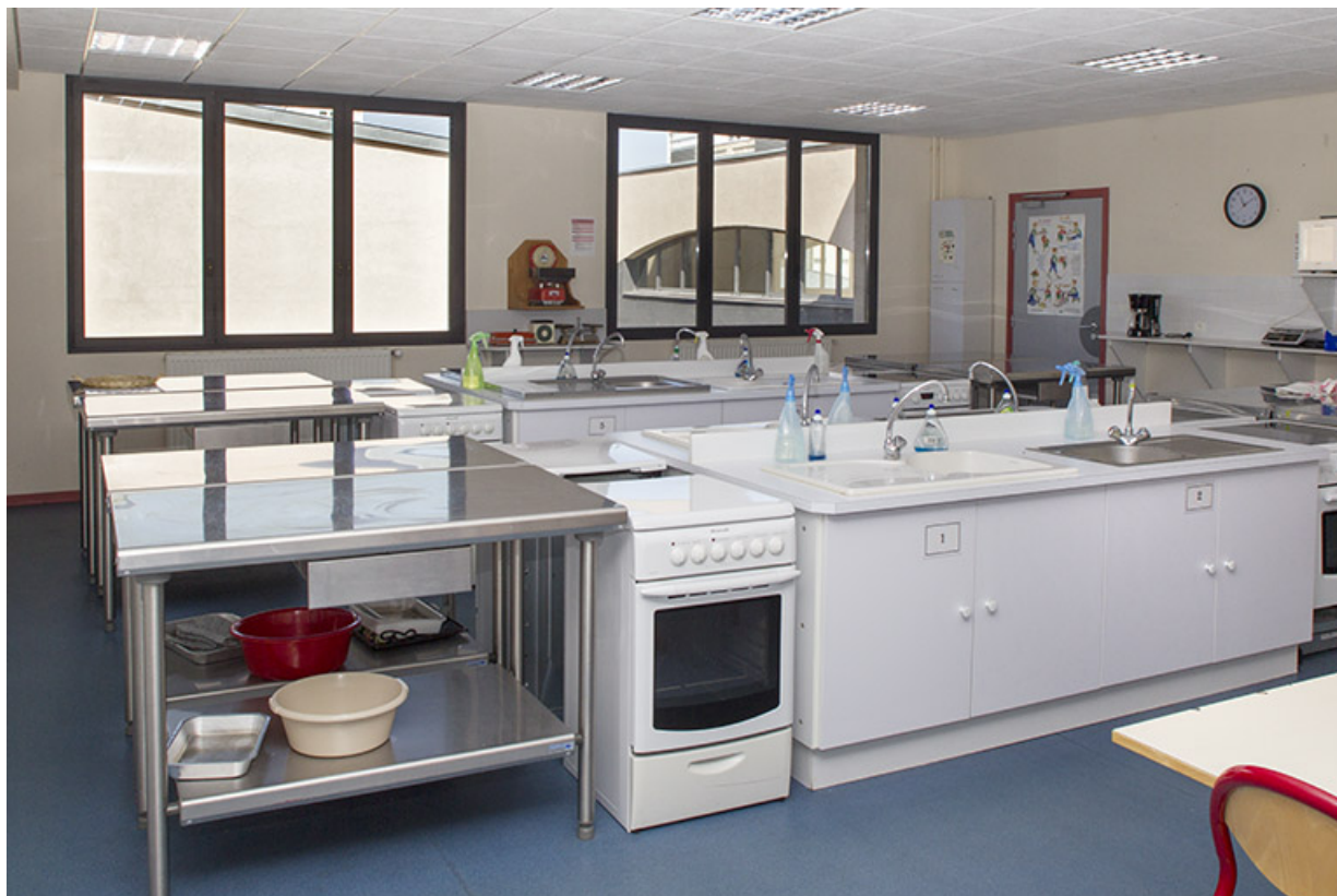
Salle de cours et d'exercice des formations de soins et services à la personne.

70, Vesoul place Jacques Brel, lieudit : les rêpes