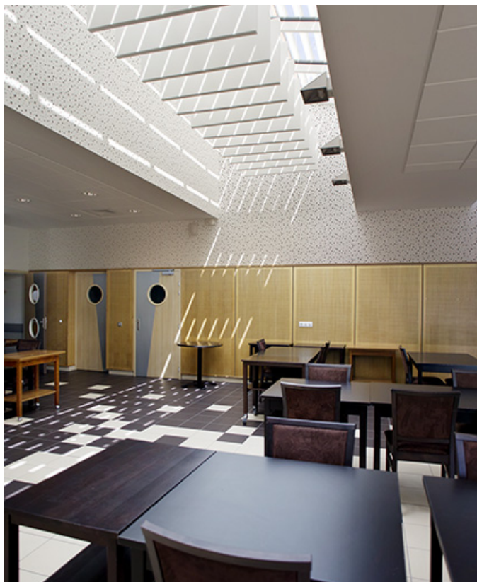
Détail : restaurant pédagogique.

70, Vesoul place Jacques Brel, lieudit : les rêpes