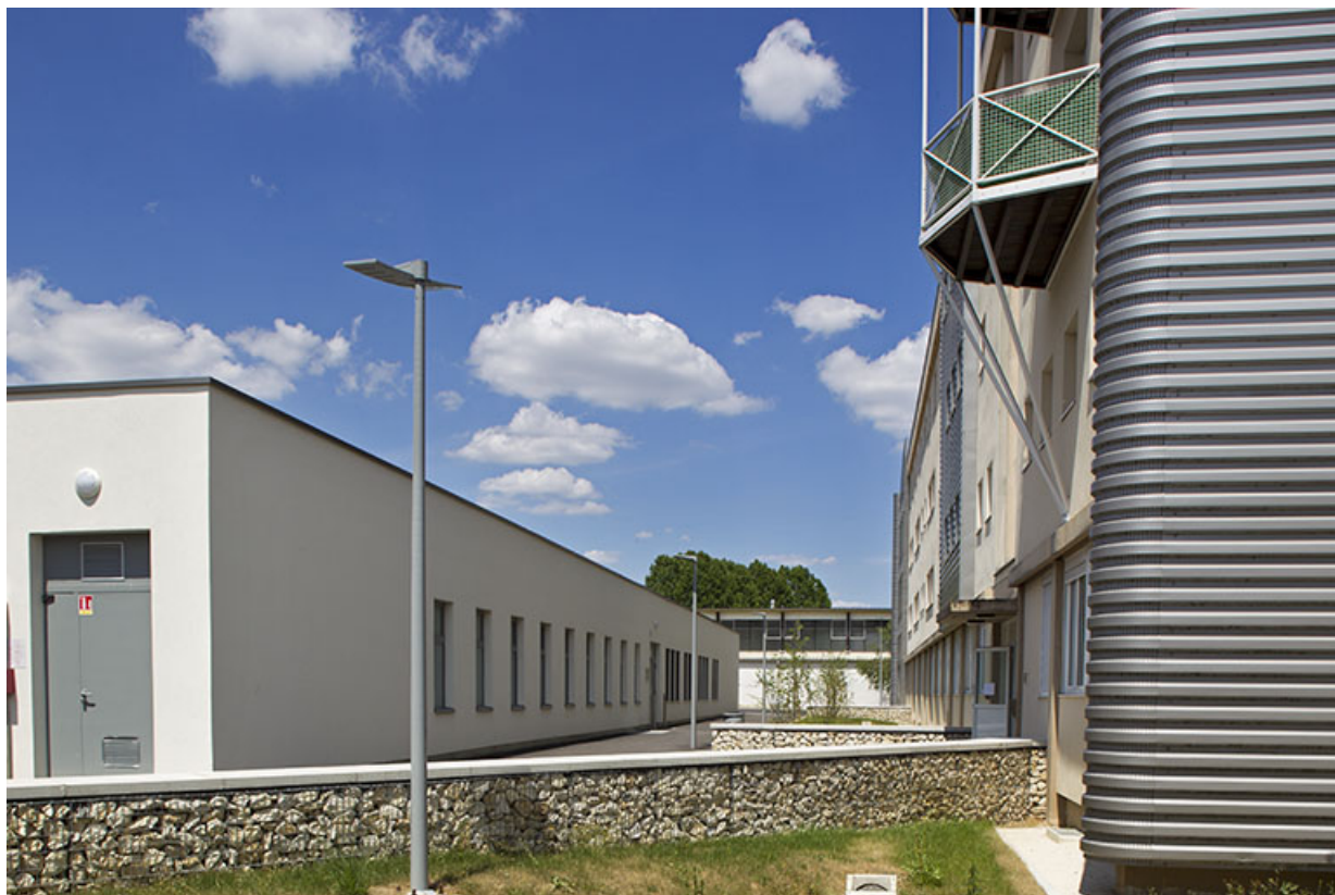
Façade est du pôle hôtelier, vue de trois-quart sud-est.

70, Vesoul place Jacques Brel, lieudit : les rêpes