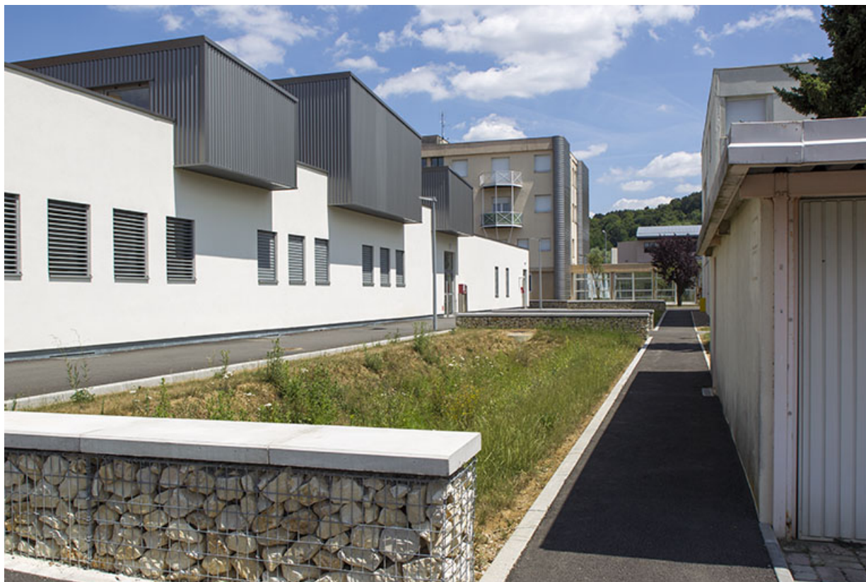
Façade sud du pôle hôtelier, vue de trois-quart sud-ouest.

70, Vesoul place Jacques Brel, lieudit : les rêpes