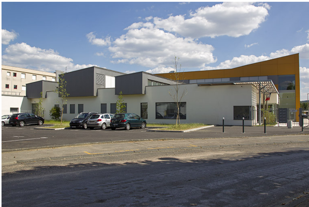
Façade ouest du pôle hôtelier, vue de la rue, à l'ouest.

70, Vesoul place Jacques Brel, lieudit : les rêpes