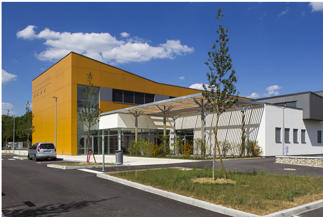
Pôle hôtelier vu du sud-est.

70, Vesoul place Jacques Brel, lieudit : les rêpes