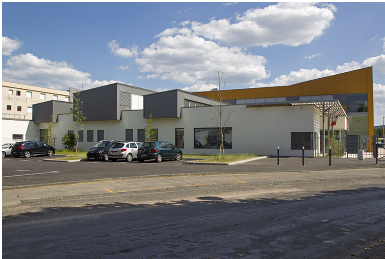
Façade ouest du pôle hôtelier, vue de la rue, à l'ouest.

70, Vesoul place Jacques Brel, lieudit : les rêpes