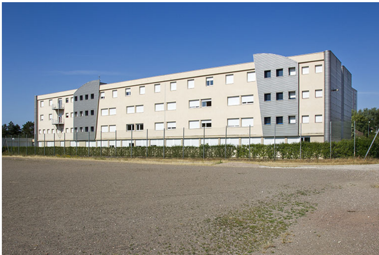
Façade est et pignon nord de l'internat.

70, Vesoul place Jacques Brel, lieudit : les rêpes