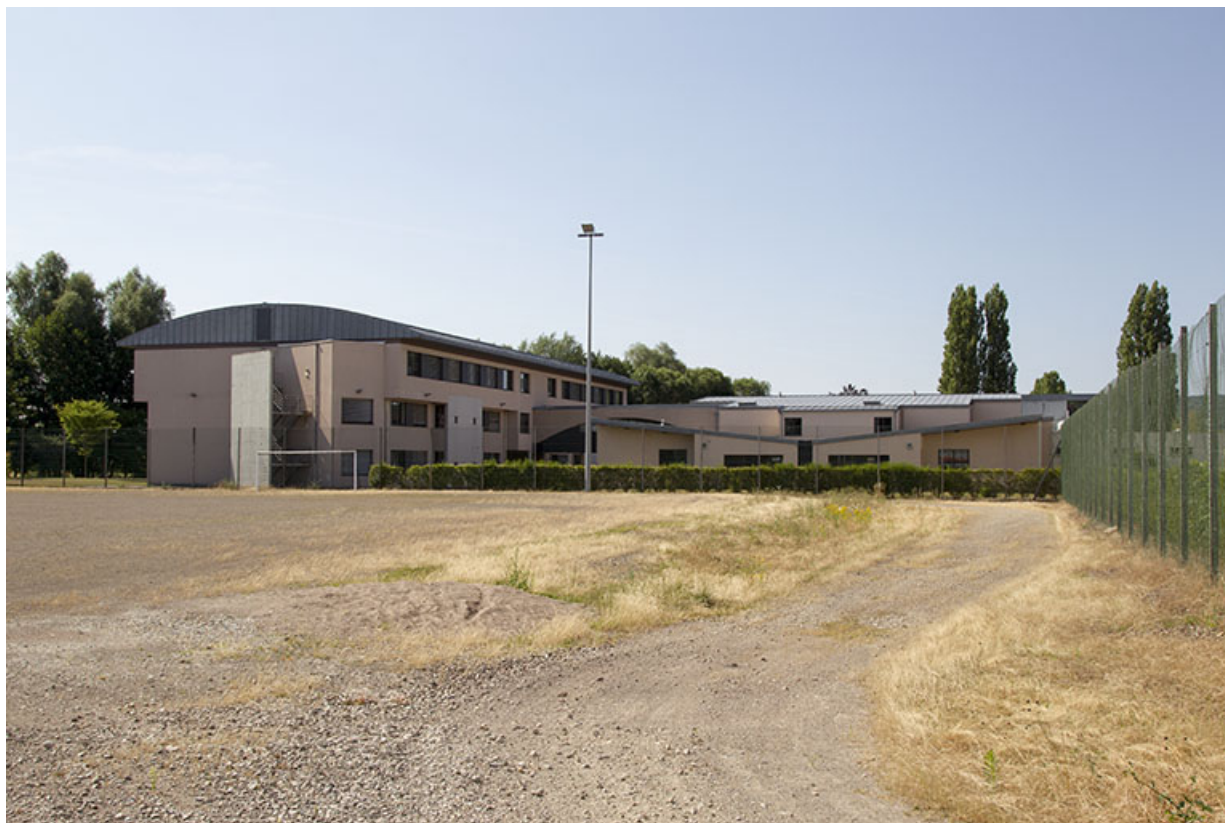
Façades et pignons nord des externats depuis le stade au nord.

70, Vesoul place Jacques Brel, lieudit : les rêpes