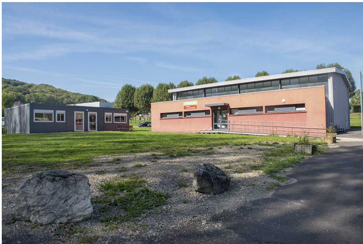
Façade sud-est du gymnase, façade nord-est du préfabriqué ouest.

70, Vesoul, 16 rue Edouard Belin, lieudit : Grand Mont Marin