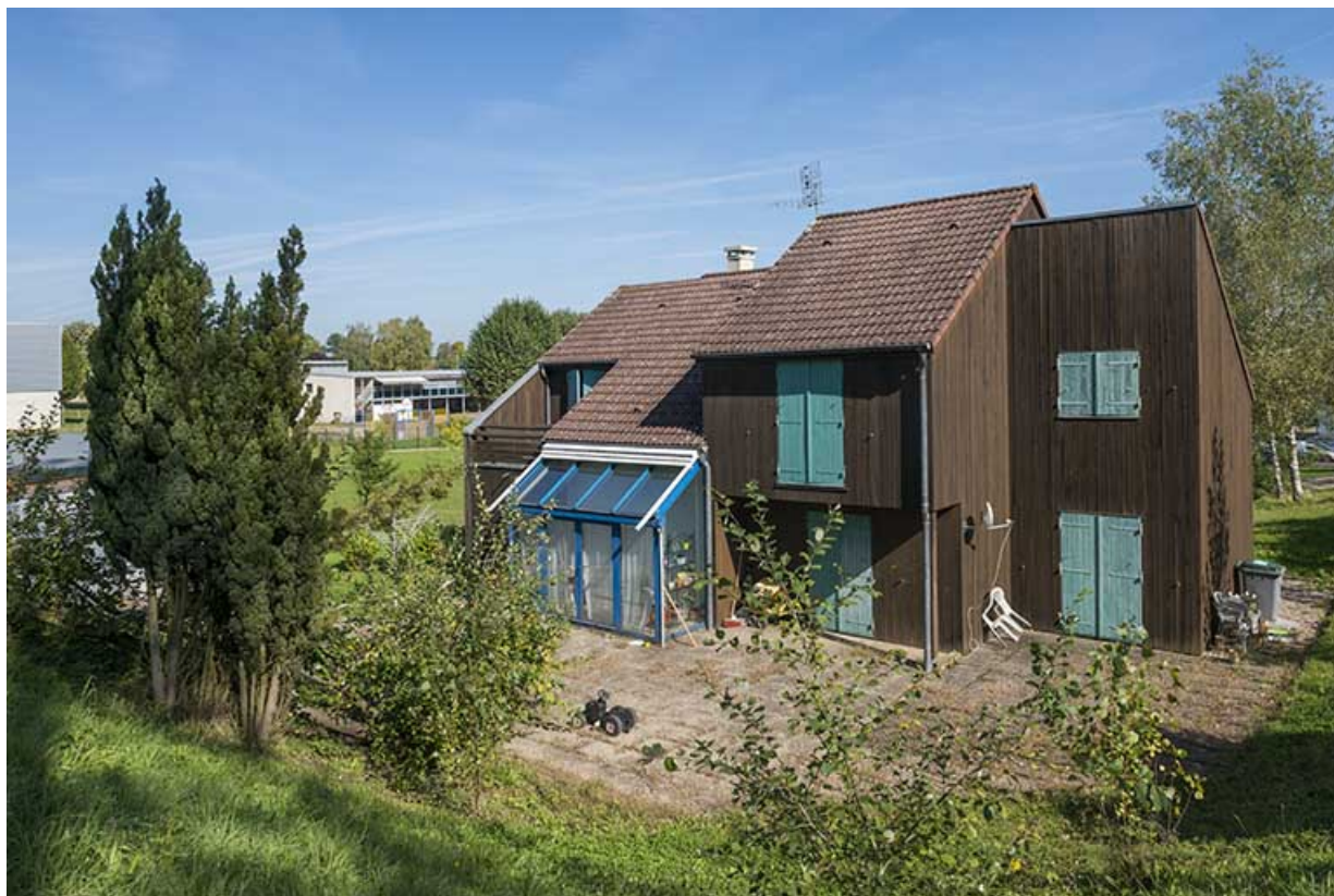
Façade postérieure sud-ouest du pavillon du directeur. 70, Vesoul, 16 rue Edouard Belin, lieudit : Grand Mont Marin