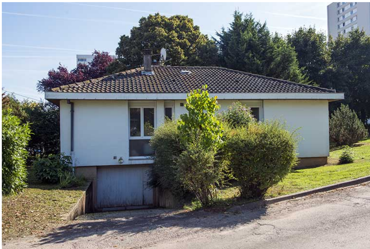
Façade ouest du pavillon logement.

70, Vesoul, 16 rue Edouard Belin, lieudit : Grand Mont Marin