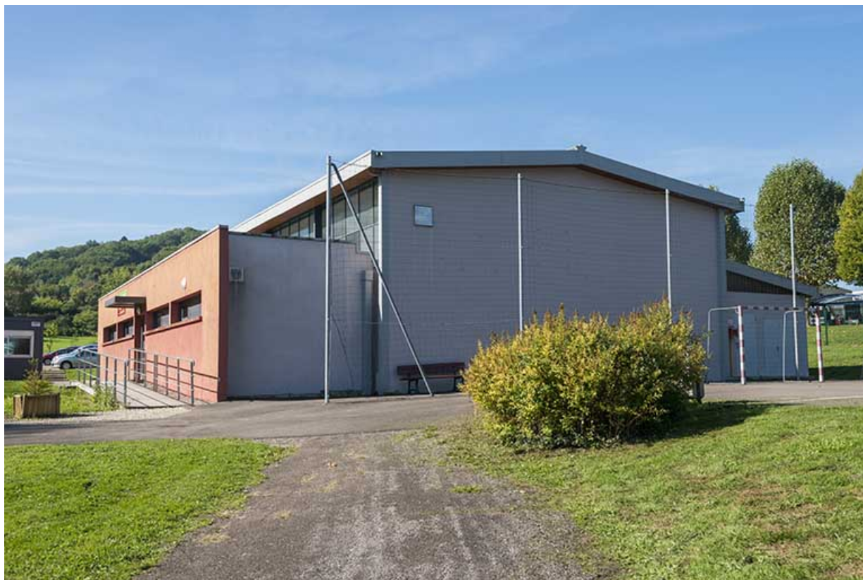
Angle est et pignon nord-est du gymnase.

70, Vesoul, 16 rue Edouard Belin, lieudit : Grand Mont Marin