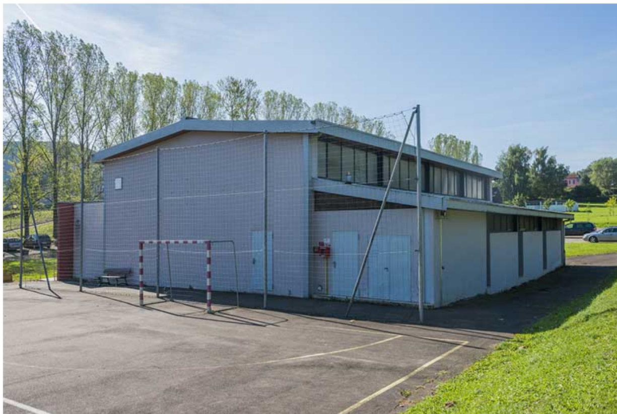
Angle nord et pignon nord-est du gymnase

70, Vesoul, 16 rue Edouard Belin, lieudit : Grand Mont Marin