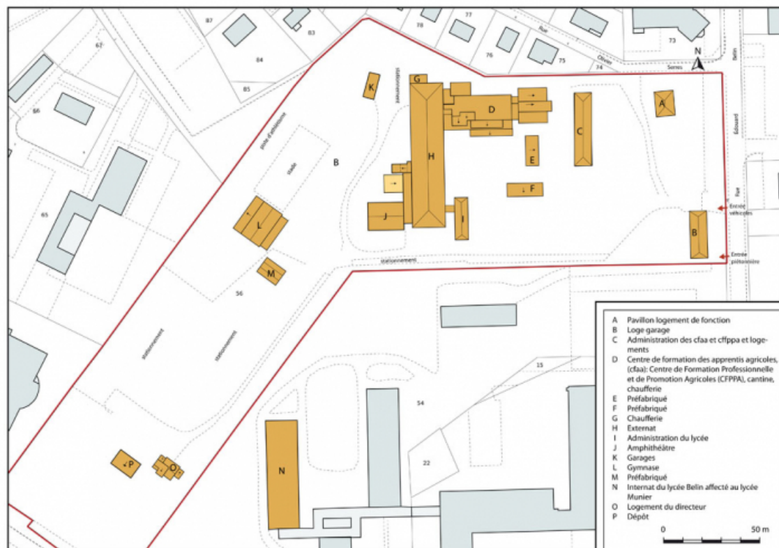
Plan-masse et de situation. Extrait du plan cadastral numérisé, section BI, échelle 1:1000.

70, Vesoul, 16 rue Edouard Belin, lieudit : Grand Mont Marin