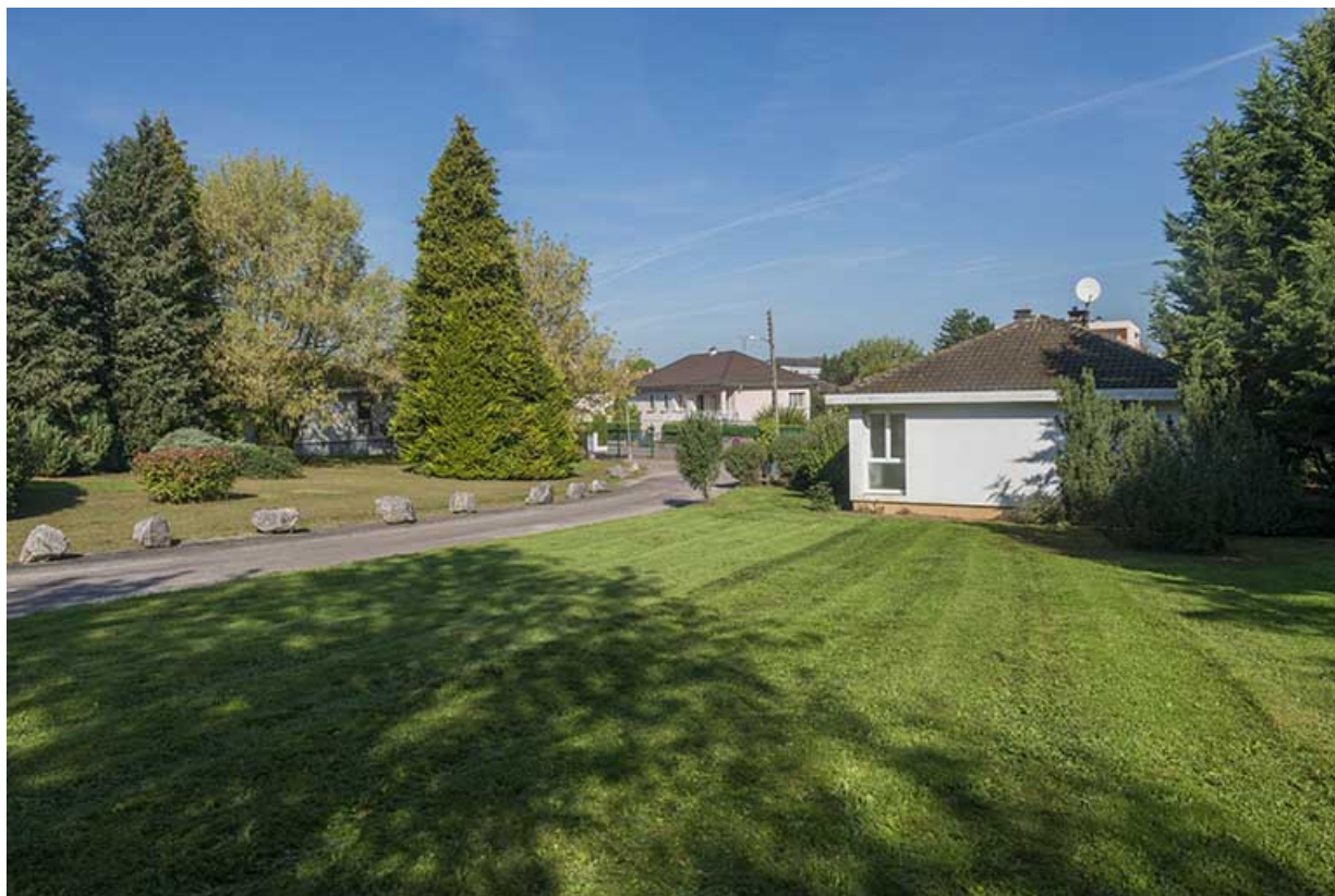
Pignon sud du pavillon de logement.

70, Vesoul, 16 rue Edouard Belin, lieudit : Grand Mont Marin