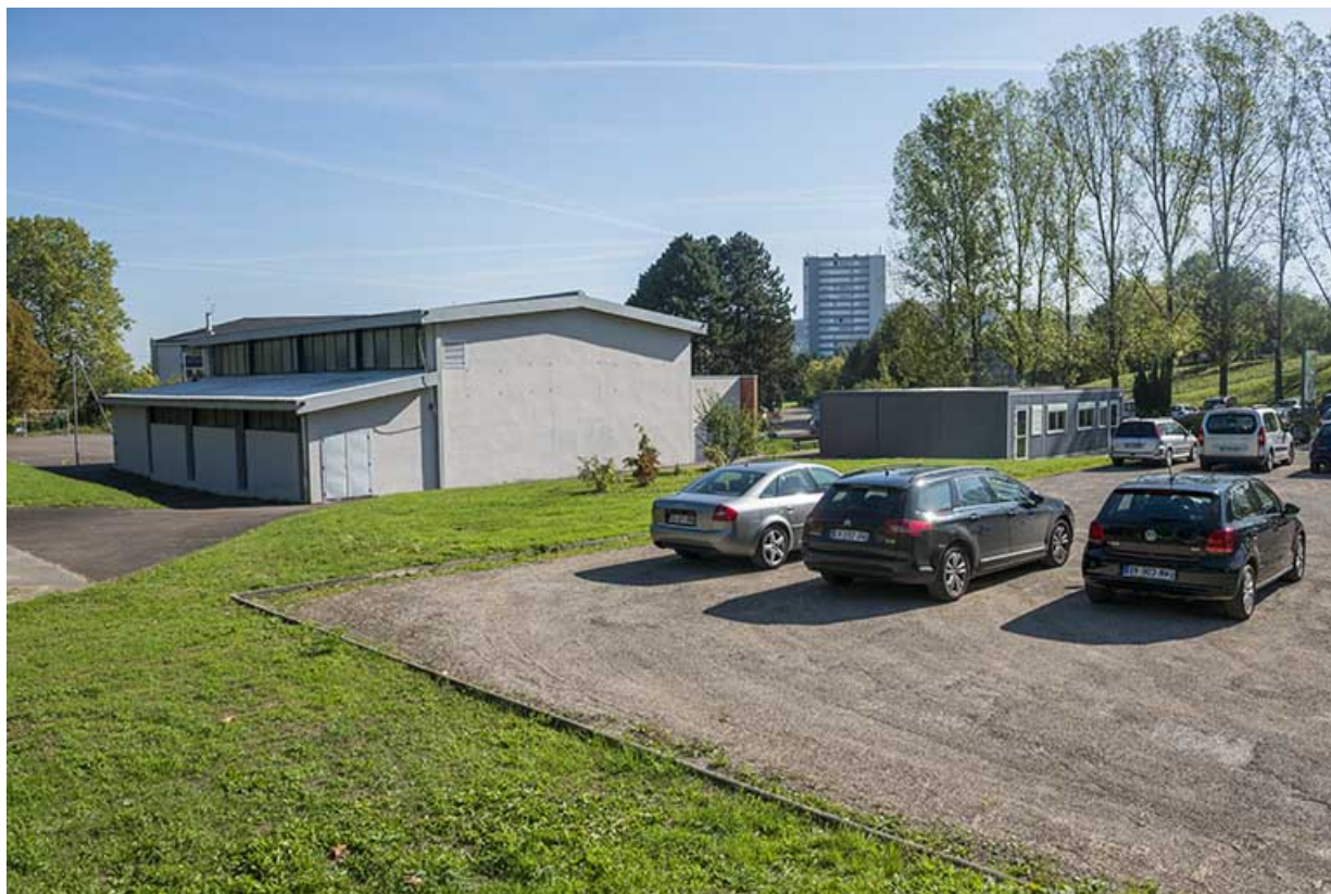
Aire de stationnement, angle ouest et pignon sud-est du gymnase, angle ouest et pignon nord-ouest du préfabriqué ouest. 70, Vesoul, 16 rue Edouard Belin, lieudit : Grand Mont Marin