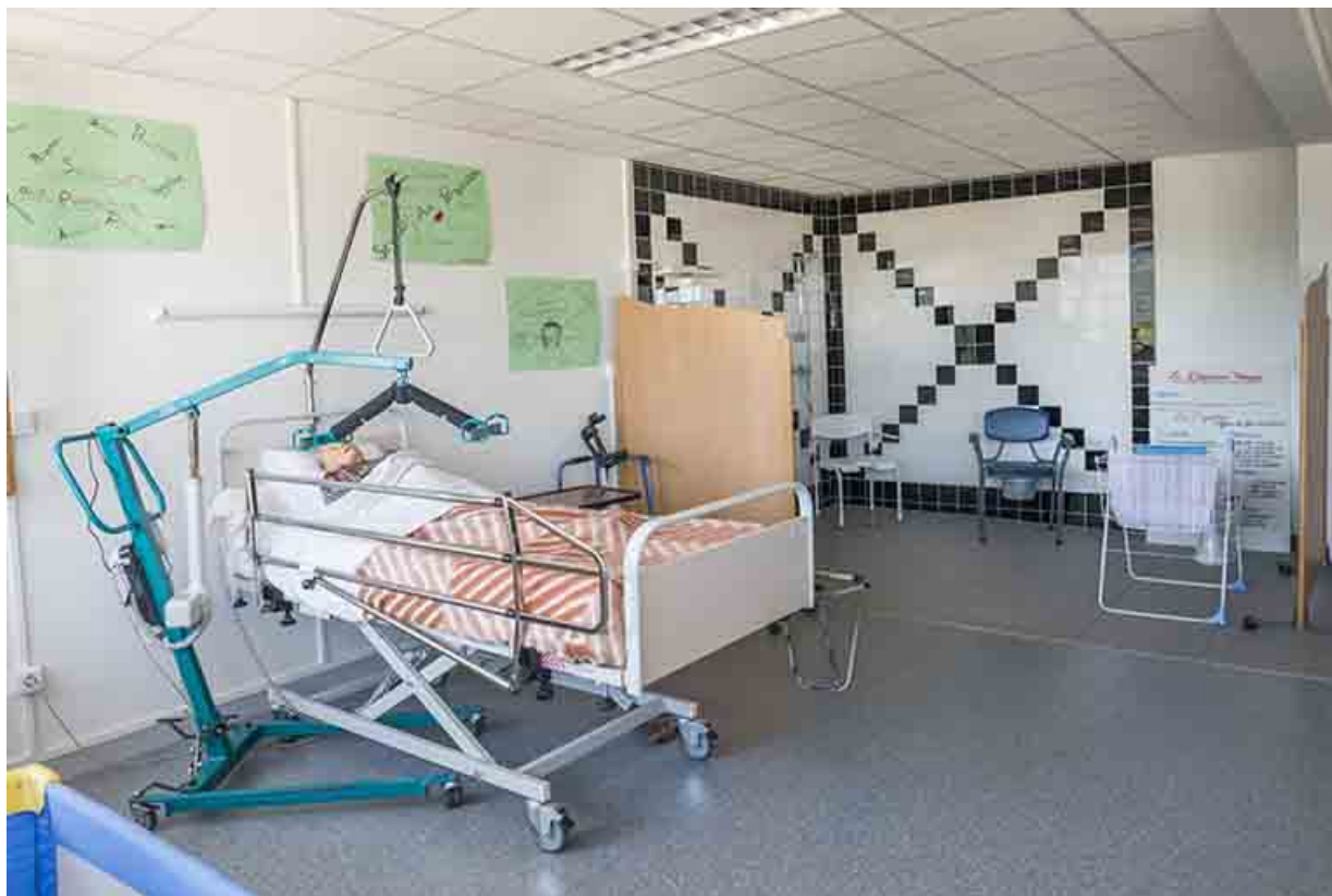
Salle de formation du Bac Pro service aux personnes et aux territoires.

70, Vesoul, 16 rue Edouard Belin, lieudit : Grand Mont Marin