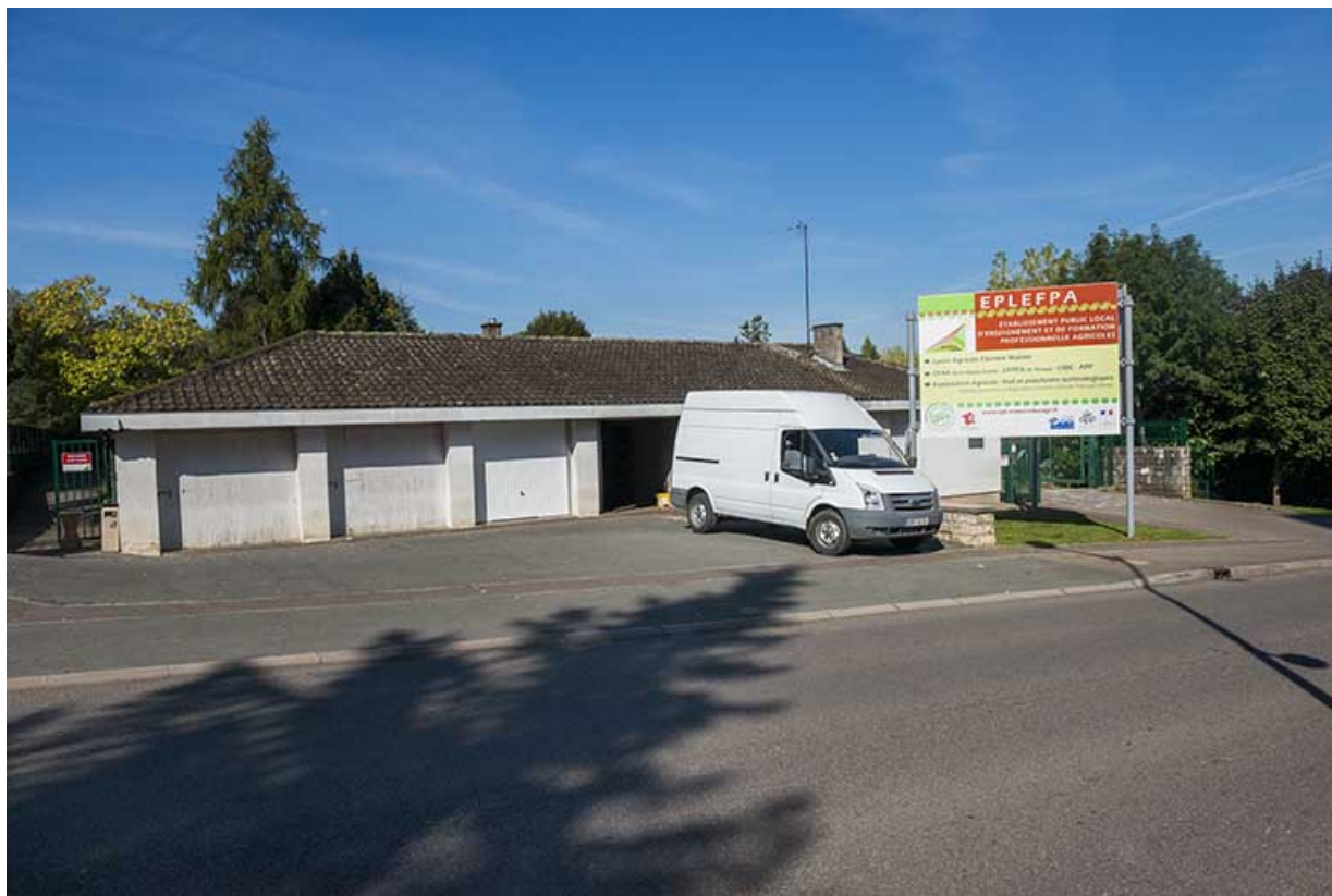
Le long de la rue Belin, garages, entrées des piétons, des véhicules, de part et d'autre de la loge.

70, Vesoul, 16 rue Edouard Belin, lieudit : Grand Mont Marin