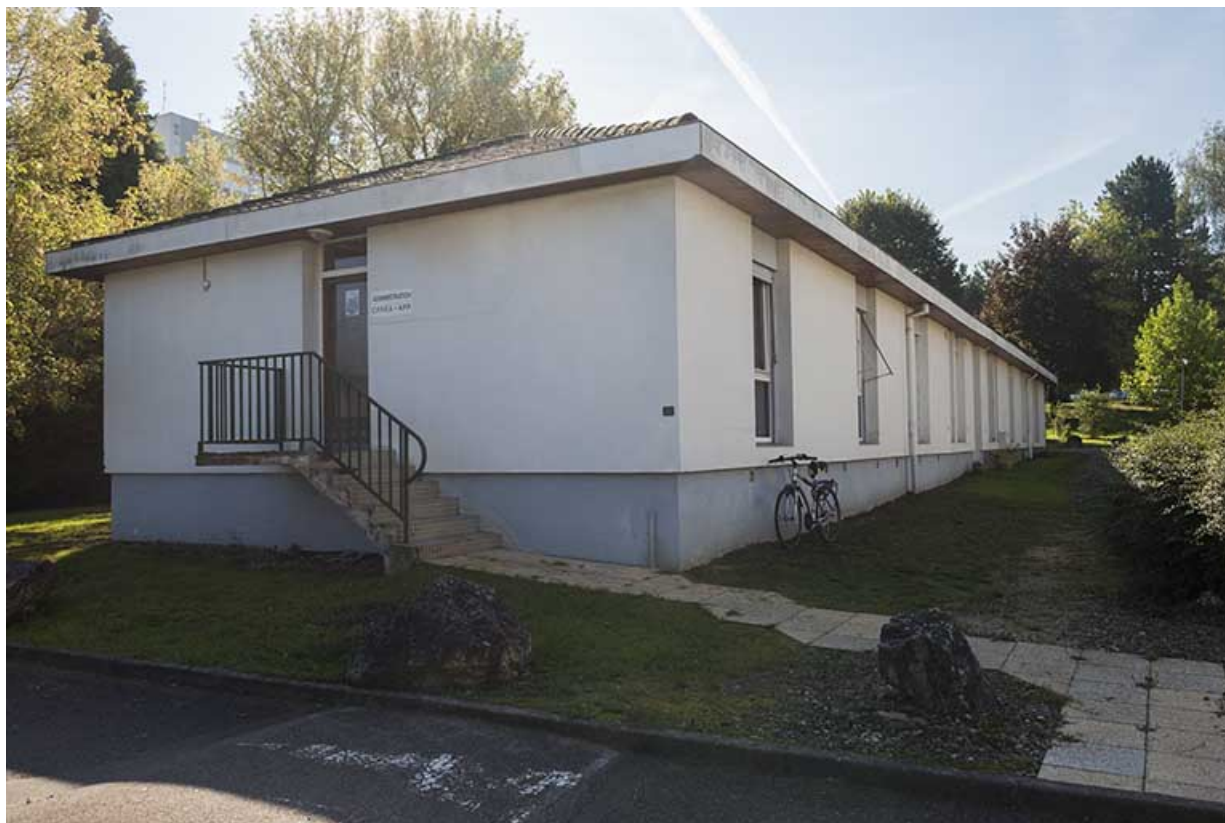
Angle nord-ouest de la barre de logements et administration des cfa et cfppa.

70, Vesoul, 16 rue Edouard Belin, lieudit : Grand Mont Marin