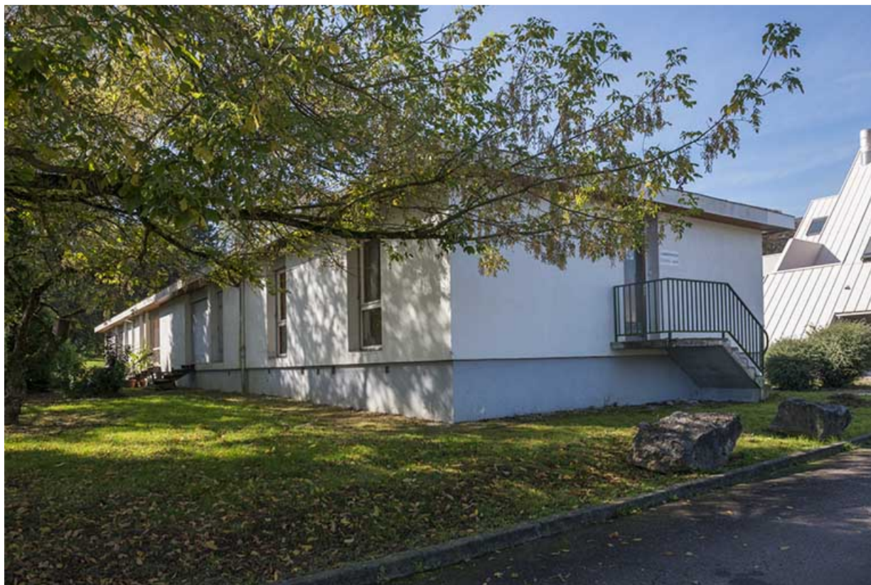
Angle nord-est de la barre de logements et administration des cfa et cfppa.

70, Vesoul, 16 rue Edouard Belin, lieudit : Grand Mont Marin