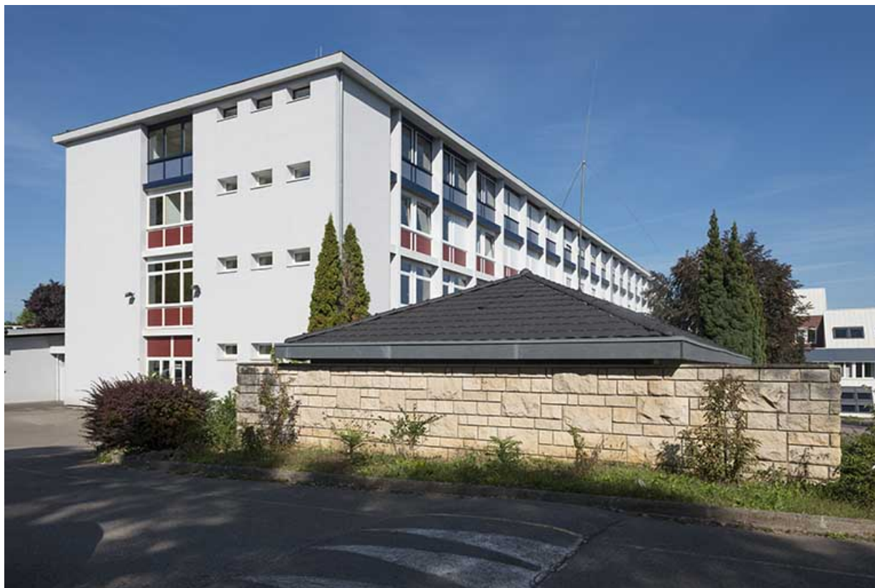
Façade sud de l'administration.

70, Vesoul, 16 rue Edouard Belin, lieudit : Grand Mont Marin