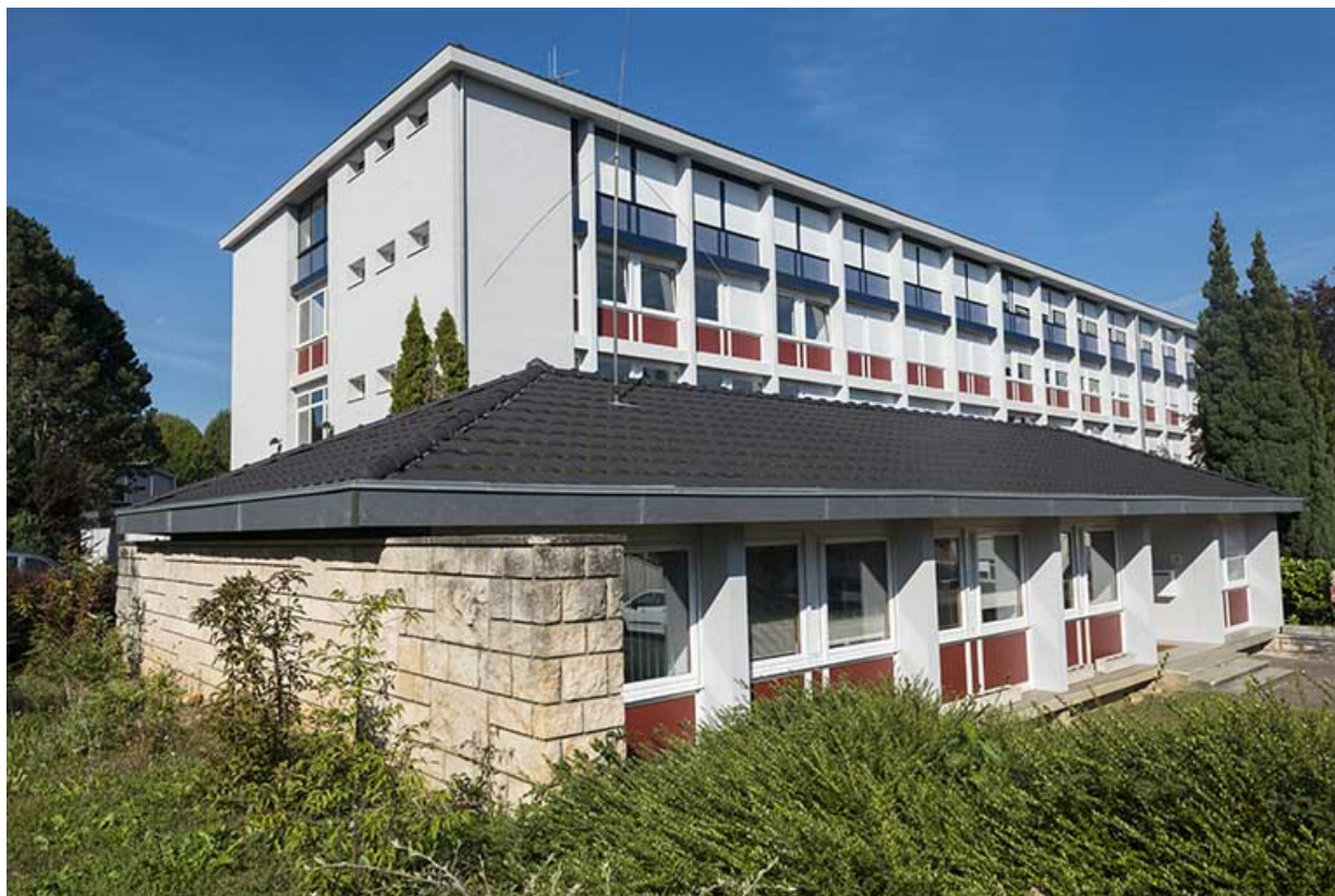
Angle sud-est et façade est de l'administration.

70, Vesoul, 16 rue Edouard Belin, lieudit : Grand Mont Marin