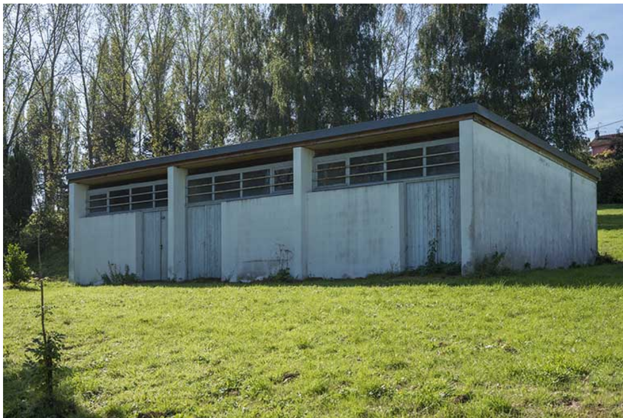
Angle nord-ouest et façade nord-est du dépôt.

70, Vesoul, 16 rue Edouard Belin, lieudit : Grand Mont Marin