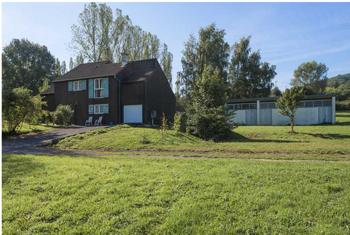
Façades antérieures nord-est du dépôt et du logement du directeur.

70, Vesoul, 16 rue Edouard Belin, lieudit : Grand Mont Marin