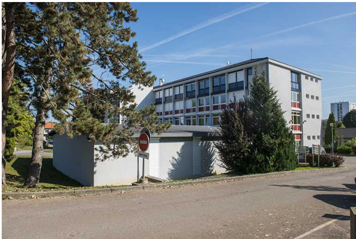
Façade sud de l'amphithéâtre.

70, Vesoul, 16 rue Edouard Belin, lieudit : Grand Mont Marin