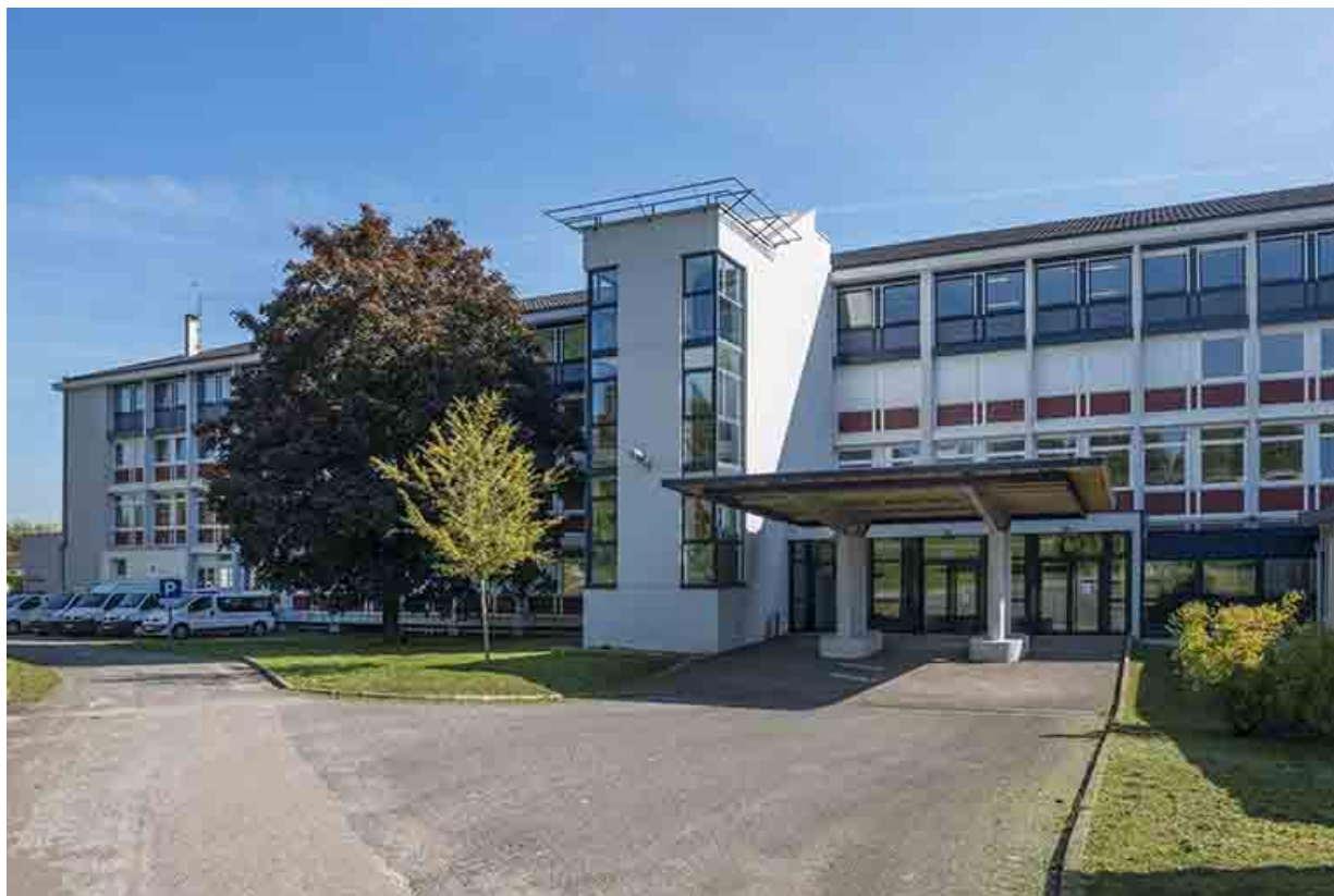
Façade ouest de l'externat.

70, Vesoul, 16 rue Edouard Belin, lieudit : Grand Mont Marin