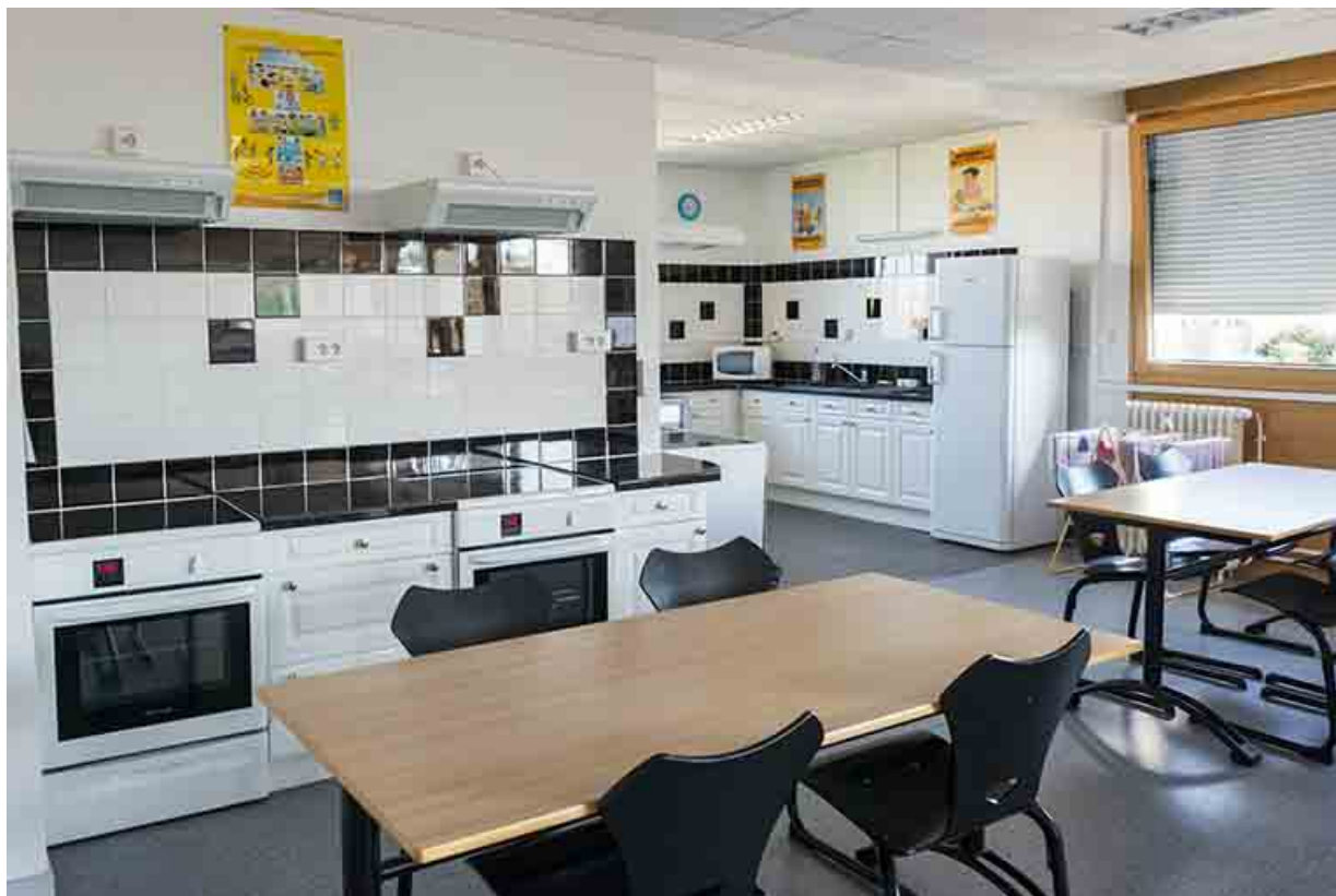
Salle de formation du Bac Pro service aux personnes et aux territoires.

70, Vesoul, 16 rue Edouard Belin, lieudit : Grand Mont Marin