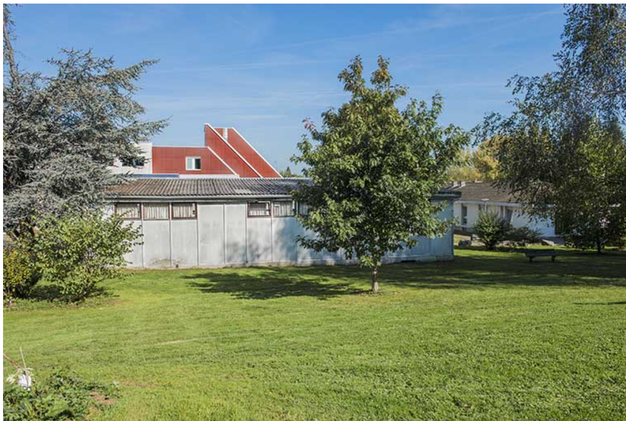
Face sud du préfabriqué sud et angle sud-ouest de la barre de logements de fonction.

70, Vesoul, 16 rue Edouard Belin, lieudit : Grand Mont Marin