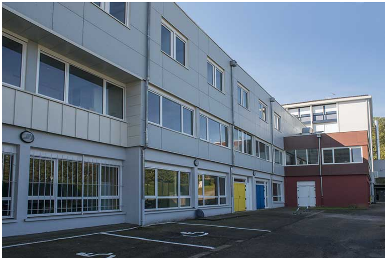
Détail de la façade nord du bâtiment du cfa et cfppa.

70, Vesoul, 16 rue Edouard Belin, lieudit : Grand Mont Marin