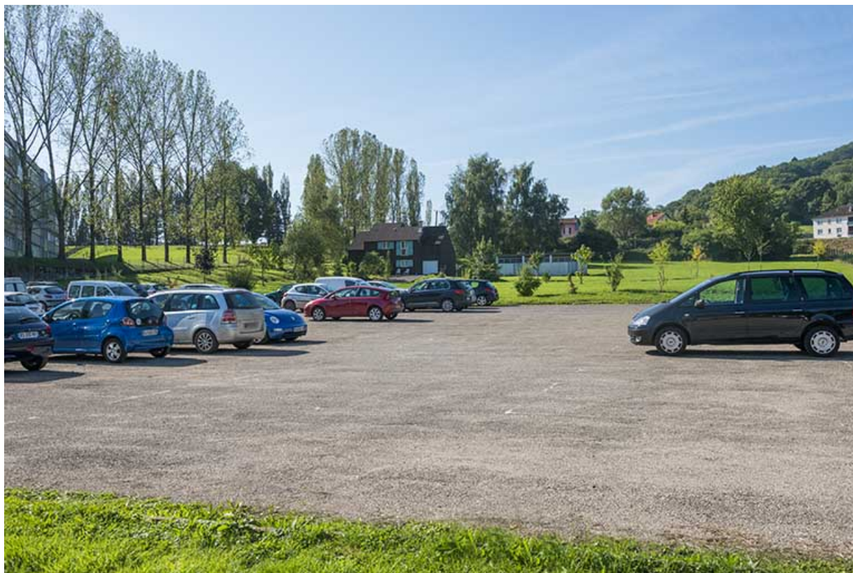
Aire de stationnement, bordée à l'est par l'internat, façades nord-est du logement du directeur et du dépôt. 70, Vesoul, 16 rue Edouard Belin, lieudit : Grand Mont Marin