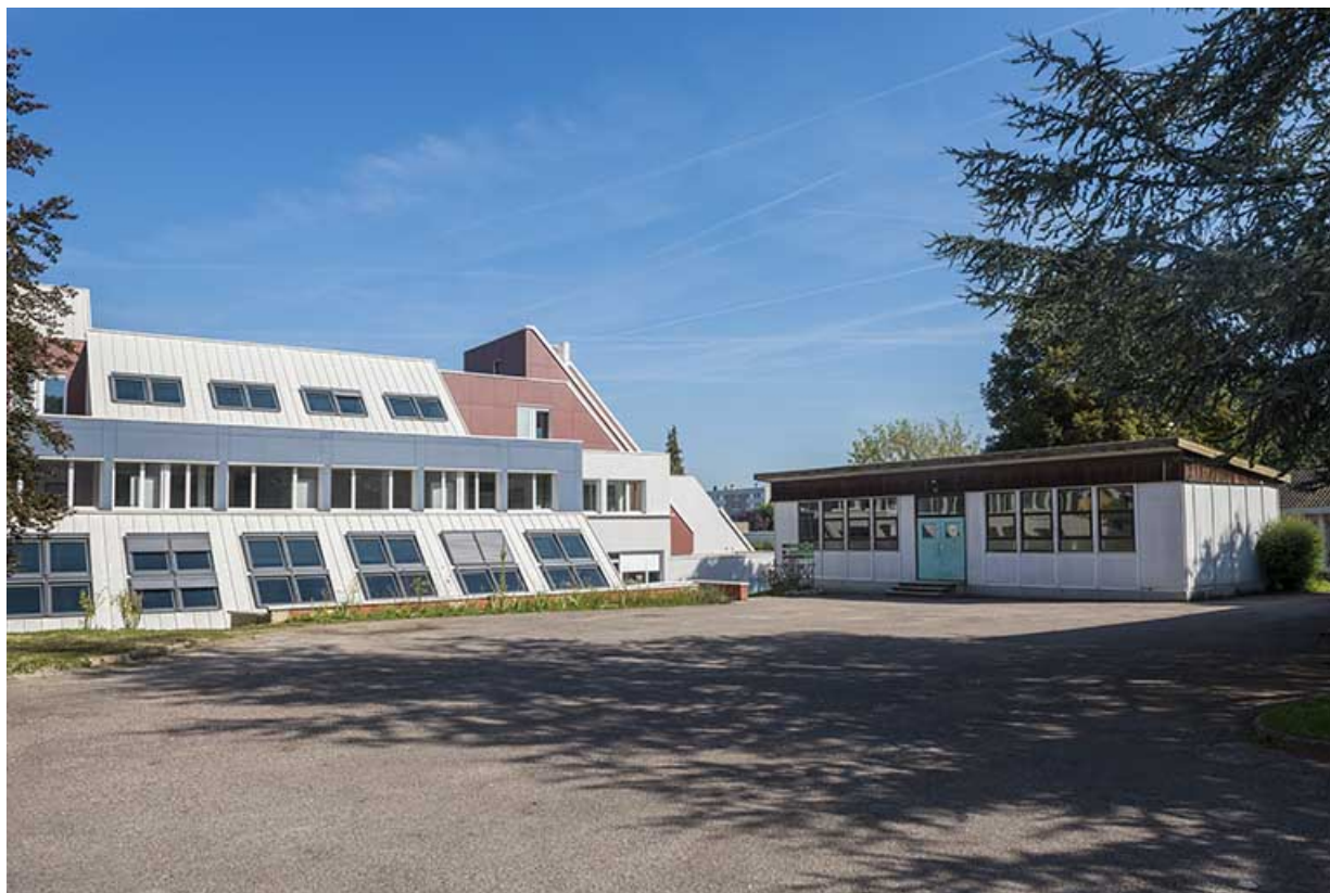
Angles sud-est du bâtiment du cfa et cfppa et du préfabriqué nord.

70, Vesoul, 16 rue Edouard Belin, lieudit : Grand Mont Marin