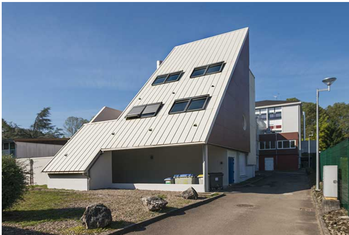
Angles nord-est du bâtiment du cfa et cfppa.

70, Vesoul, 16 rue Edouard Belin, lieudit : Grand Mont Marin