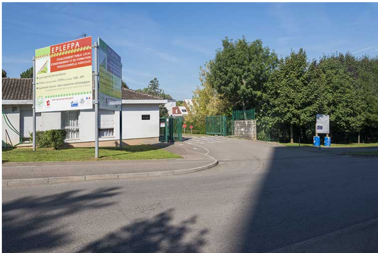
Le long de la rue Belin, garages, entrée des véhicules au nord de la loge.

70, Vesoul, 16 rue Edouard Belin, lieudit : Grand Mont Marin