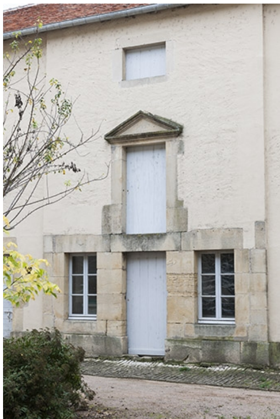
Bâtiment en fond de cour : la buanderie en rez-de-chaussée et l'étage surélevé ultérieurement. 70, Faverney rue Bossuet