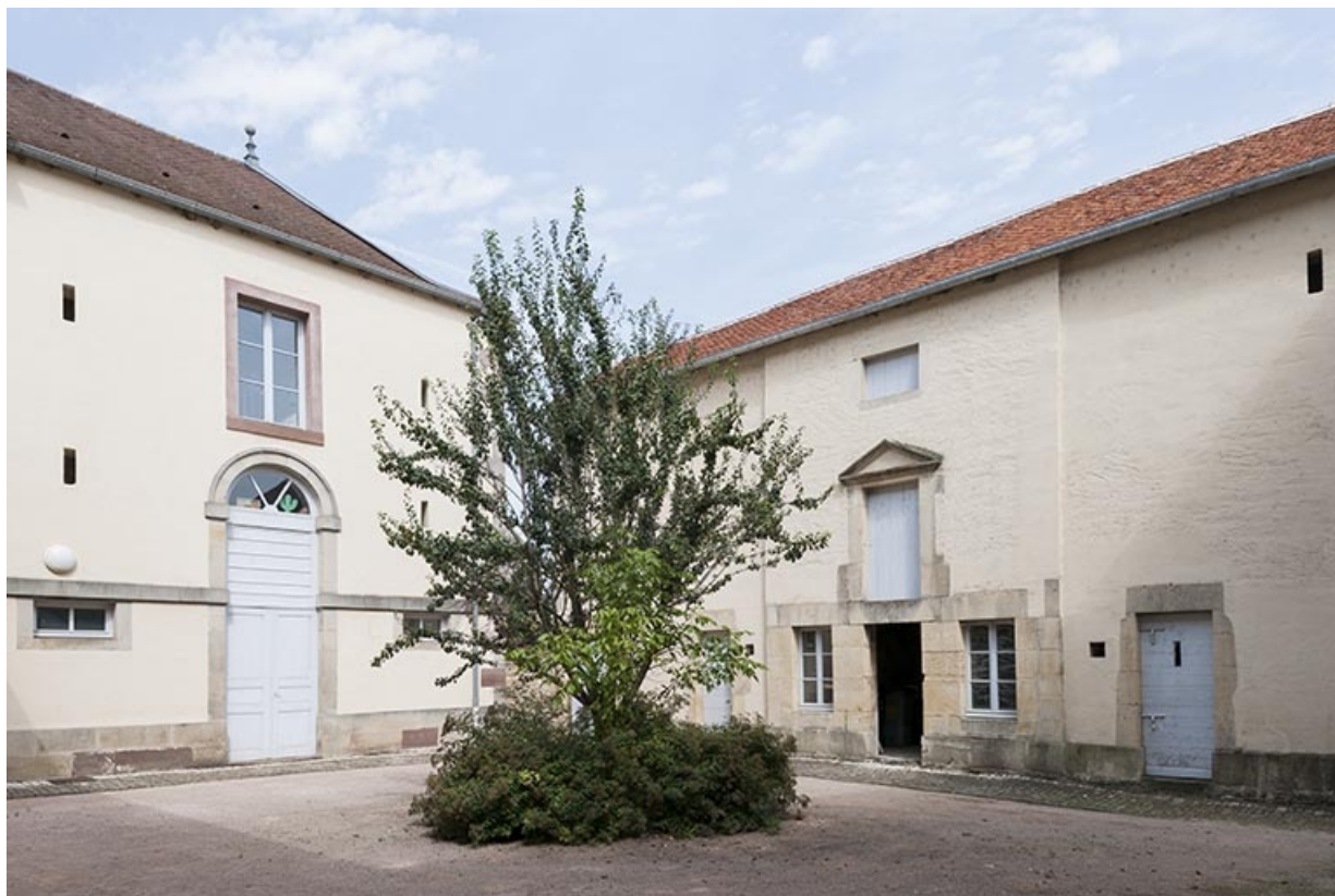
Intérieur de la cour : bâtiment en fond de cour (à droite) et aile nord. 70, Faverey rue Bossuet