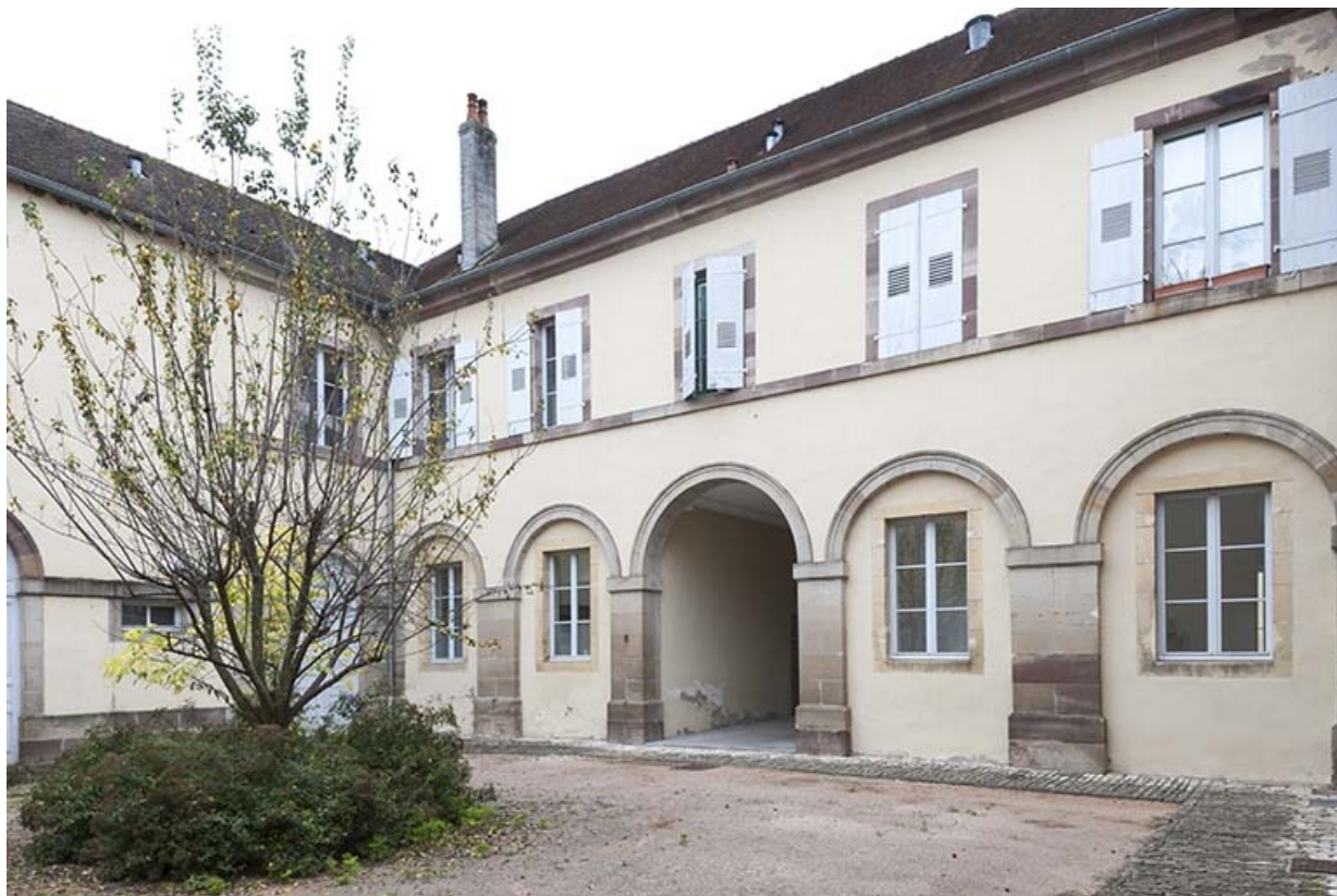
Façade postérieure et aile sud.