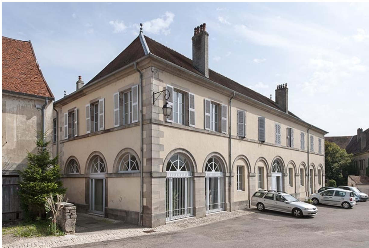
Vue de trois quarts droite depuis la rue Bossuet.