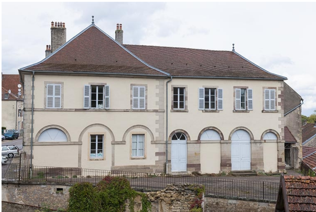
Aile droite (le long de la rue de l'Official) et façade postérieure sur cour. Les trois arcades à droite signalent le marché couvert. 70, Favorney rue Bossuet