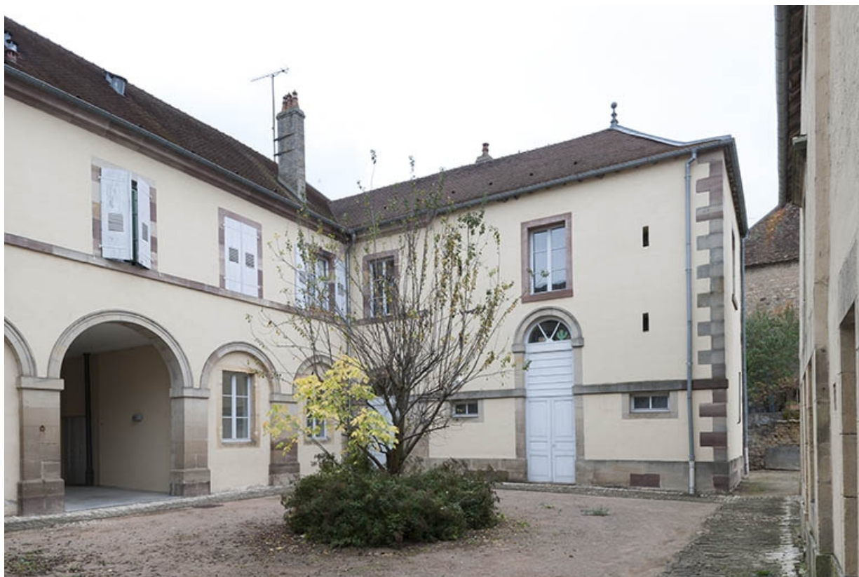
Façade postérieure et aile nord.