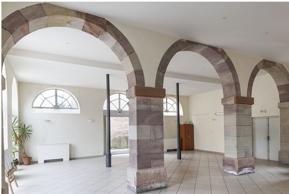
intérieur : le marché couvert.