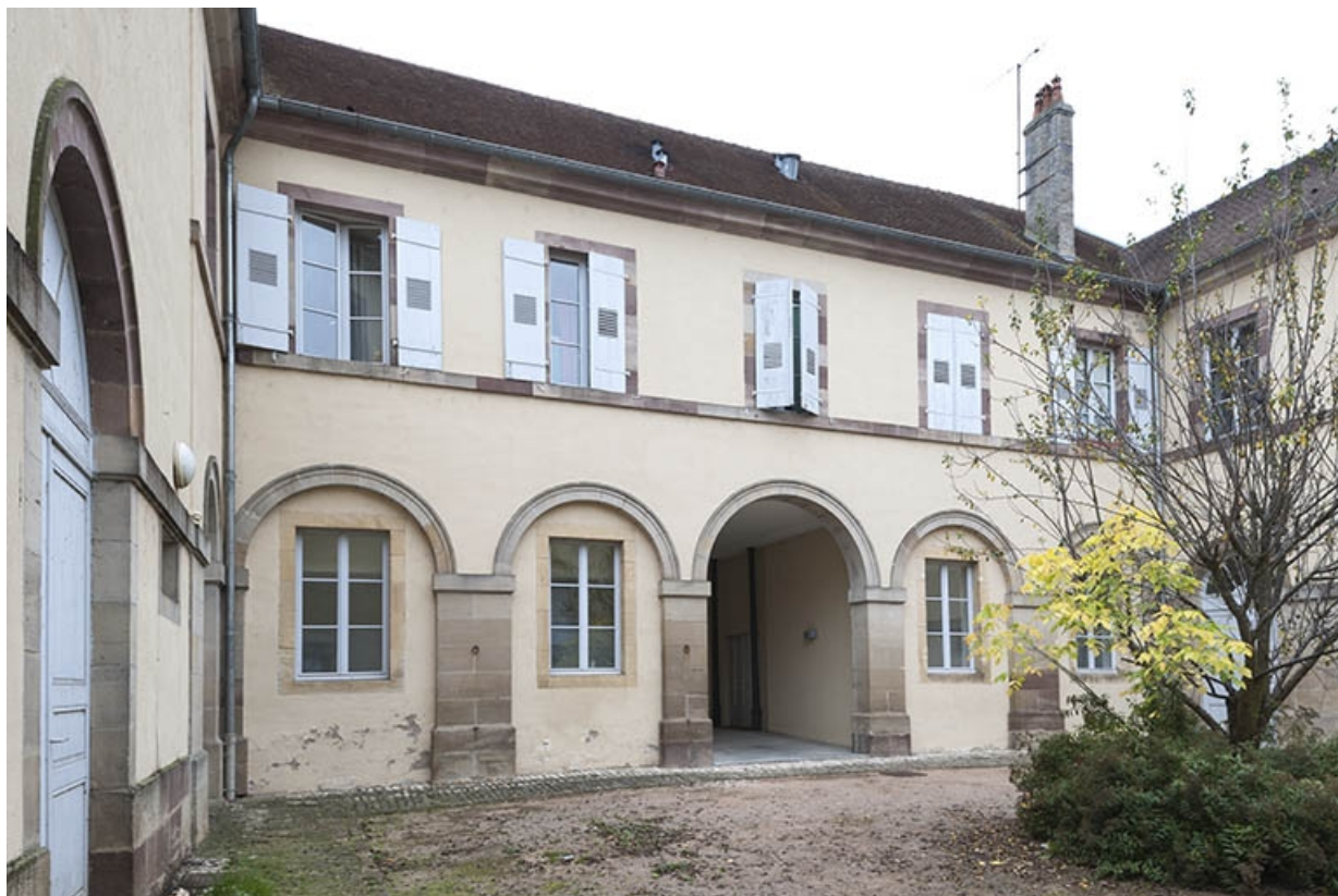
Façade postérieure, avec passage couvert et les deux ailes en retour sur cour. 70, Faverney rue Bossuet