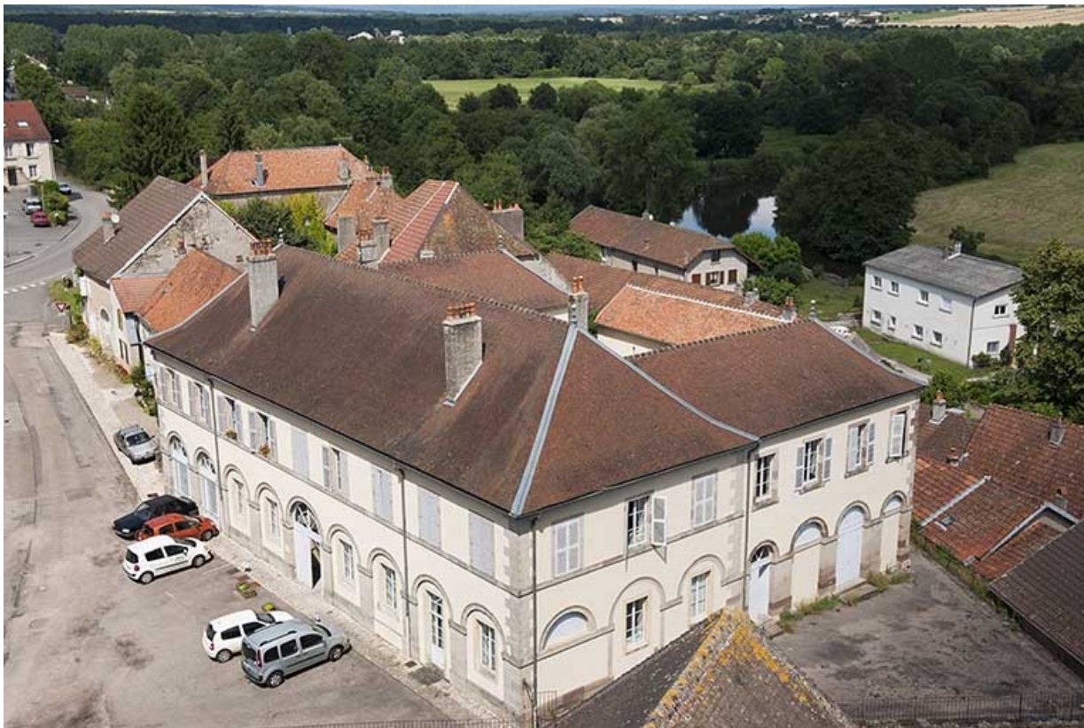
Vue d'ensemble depuis le clocher de l'église paroissiale. 70, Favorney rue Bossuet