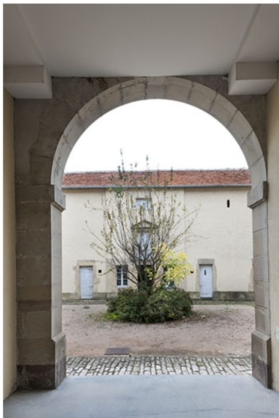
Passage couvert menant au bâtiment en fond de cour (chambres de sûreté et buanderie). 70, Favorney rue Bossuet