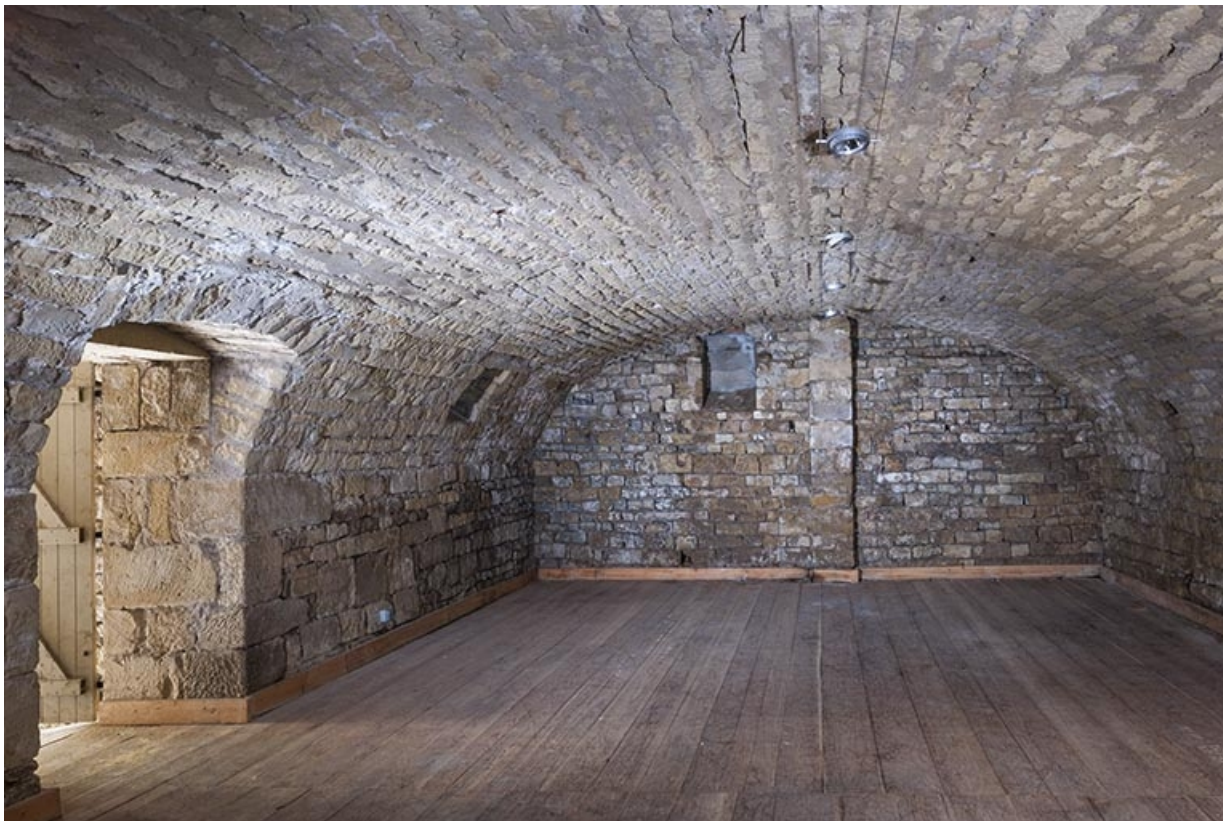
Intérieur : la cave aménagée pour la gendarmerie dans le mur de soutènement côté rue de l'Official. 70, Favorney rue Bossuet