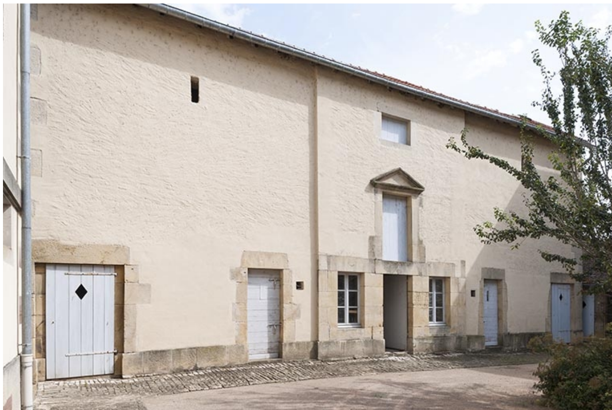
Bâtiment en fond de cour, abritant deux chambres de sûreté et une buanderie 70, Favorney rue Bossuet