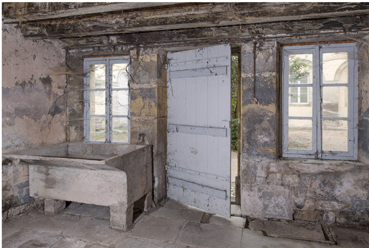
Intérieur de la buanderie.