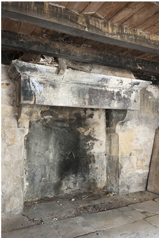
Intérieur de la buanderie : cheminée.