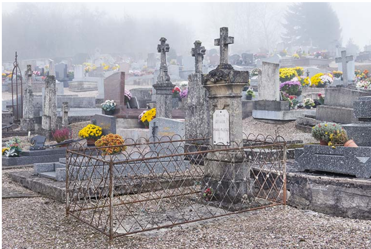
Vue partielle du cimetière.