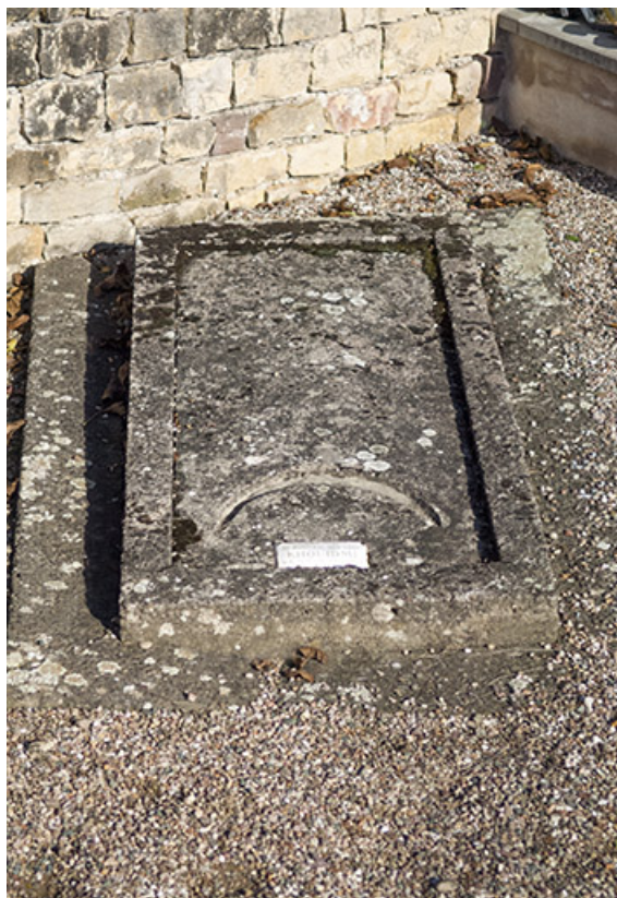
Tombe du maréchal des logis Khouidmi. La plaque porte l'inscription : AU MARECHAL DES LOGIS / KHOUIDMI / L'E.H.T DE FAVERNEY / 20 JUILLET 1937.