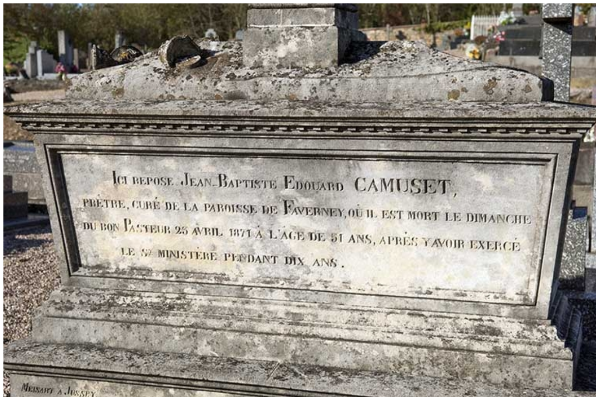
Tombeau de Jean-Baptiste-Edouard Camuset. Détail : l'épithaphe. 70, Faverney rue Catinat