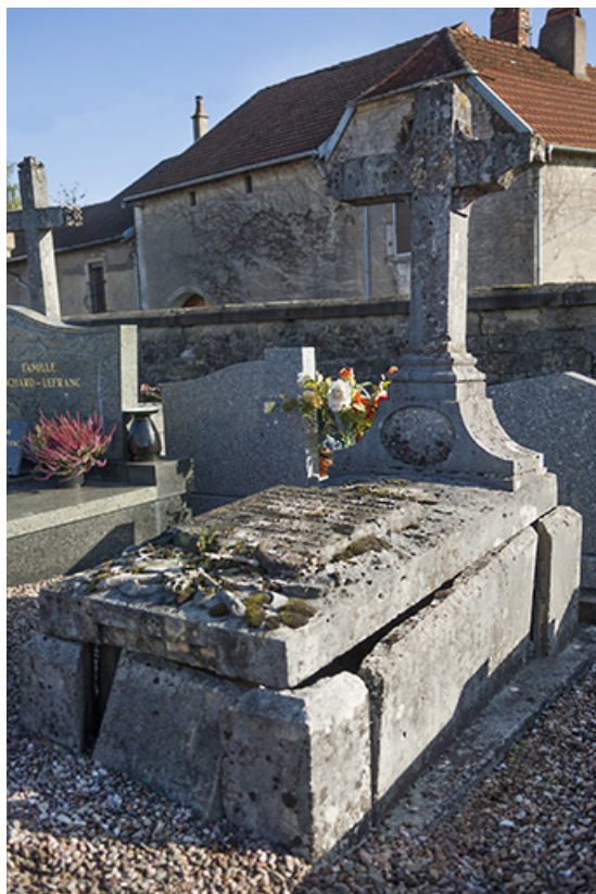
Tombeau de Jean-Pierre Pelissier. Inscription gravée sur un écu placé sur la tombe : ICI REPOSE EN DIEU / JEAN-PIERRE PELISSIER / OFFICIER EN RETRAITE / CHEVALIER DE LA / LEGION D'HONNEUR [...] 1884 [...] DANS SA 86E ANNEE. 70, Faverney rue Catinat