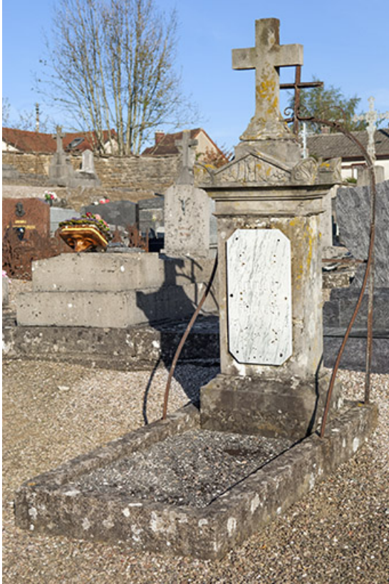
Tombeau de la famille Rouillot-Frickert.