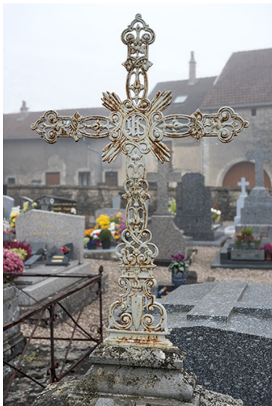
Tombeau de la famille Roland. Détail : croix en fonte constituée de volutes, rayons irradiants, IHS au centre des traverses et une urne funéraire à la base.