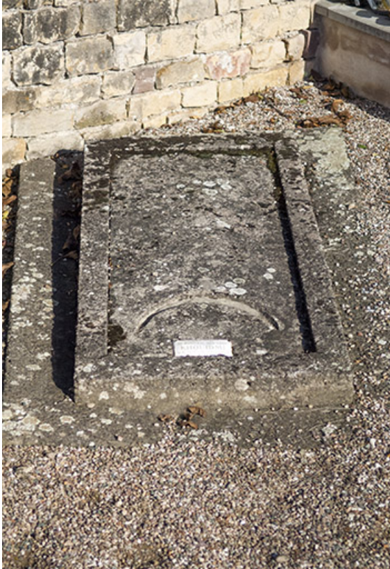
Tombe du maréchal des logis Khoudmi. La plaque porte l'inscription : AU MARECHAL DES LOGIS / KHOUIDMI / L'E.H.T DE FAVERNEY / 20 JUILLET 1937.