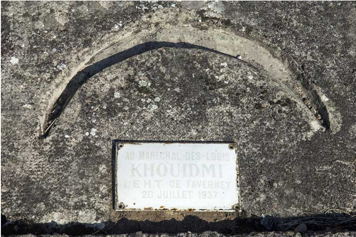
Tombe du maréchal des logis Khoudmi. Détail : plaque funéraire surmontée du Croissant. 70, Faverney rue Catinat