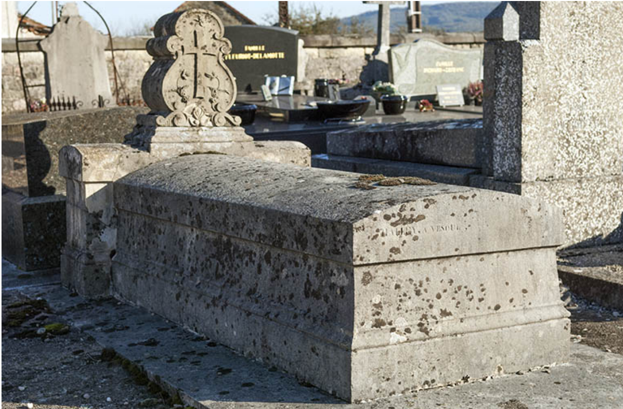
Tombeau Crevoisier, réalisé par Halley à Vesoul.