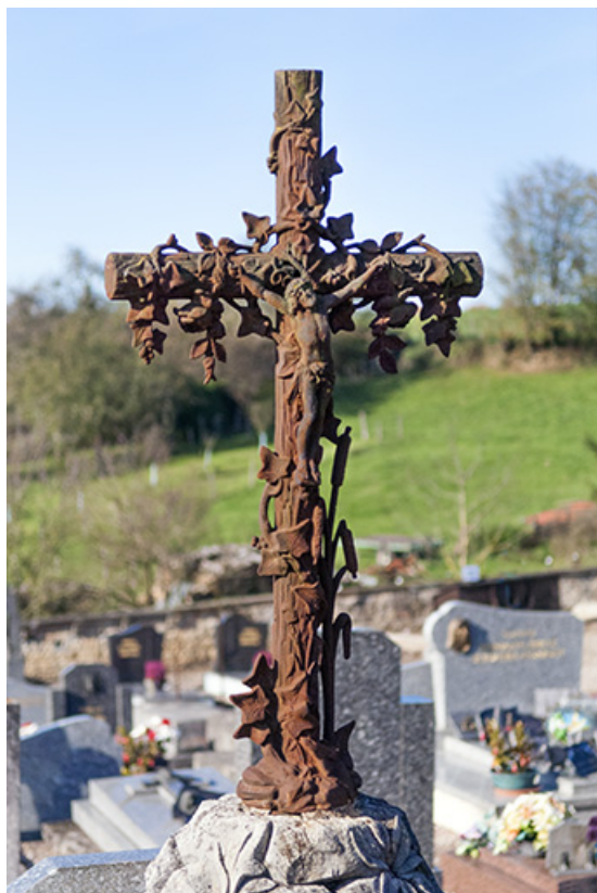
Tombes de la famille Belet-Maillot. Détail : Christ en croix, lierre et joncs. 70, Faverney rue Catinat