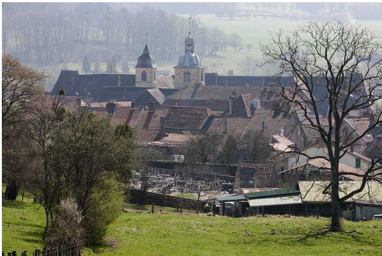
Vue générale depuis le chemin rural des Prés.