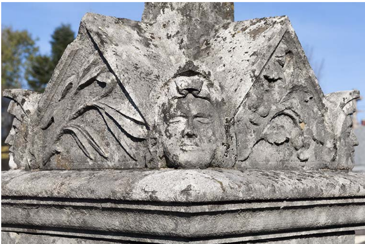
Tombeau de Laurent Marchal. Détail de la stèle : tête humaine et végétaux. 70, Faverney rue Catinat