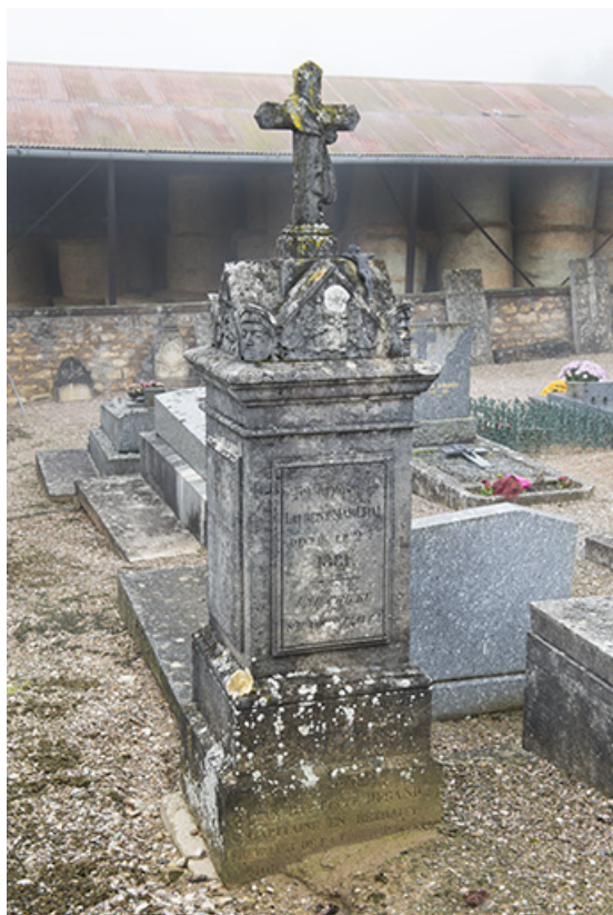
Tombeau de Laurent Marchal. Épitaphe gravée sur la face antérieure : ICI REPOSE/ LAURENT MARCHAL / DECEDÉ LE 27BRE / 1881 / UNE PRIERE / S'IL VOUS PLAIT ! Le revers comporte une autre épitaphe.