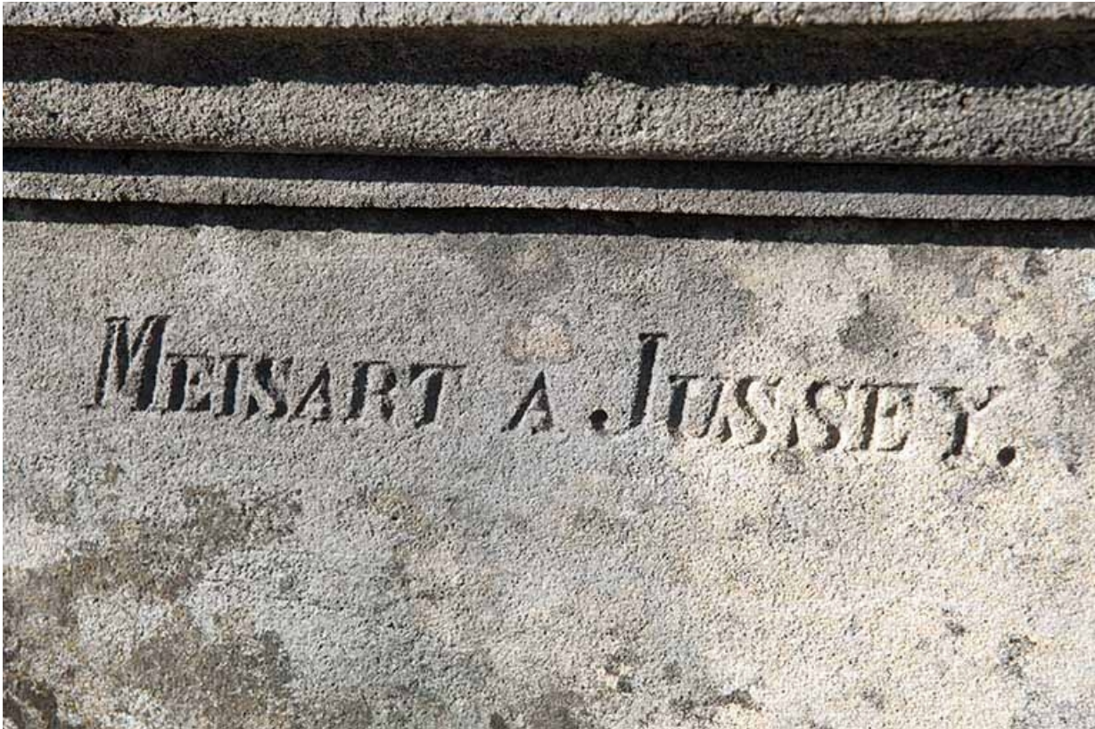
Tombeau de Jean-Baptiste-Edouard Camuset. Détail : la signature du sculpteur Meisart à Jussey. 70, Faverney rue Catinat