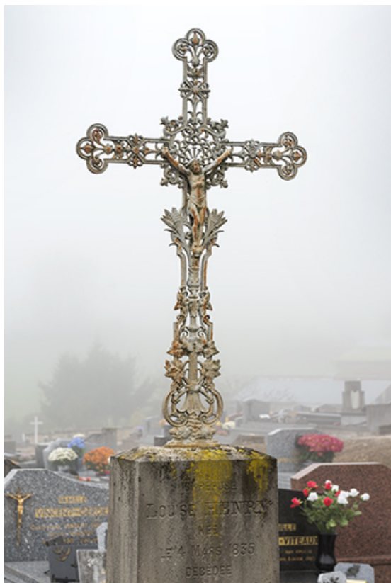
Tombeau de Louise Henry. Détail : croix en fonte. 70, Faverney rue Catinat