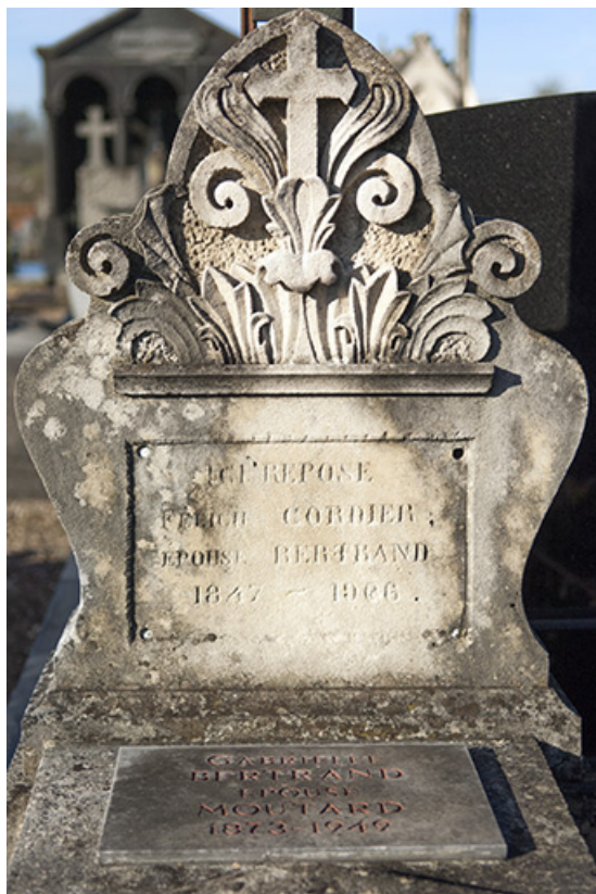
Tombeau de Félicie Cordier, détail : croix au centre d'un décor végétal. 70, Faverney rue Catinat