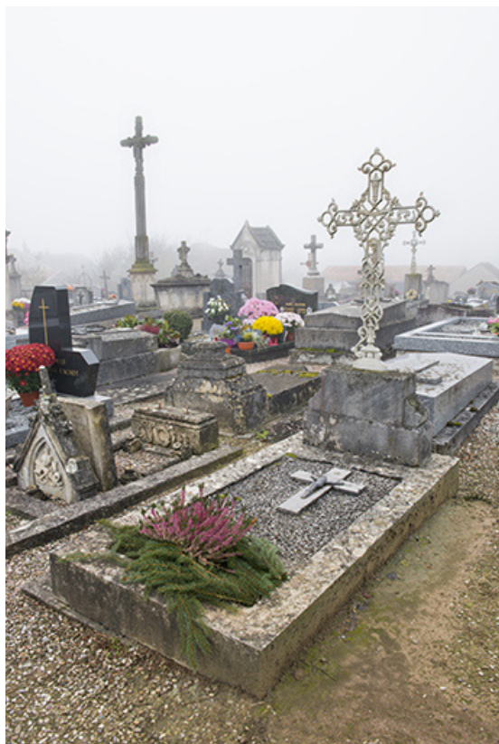
Tombeau : vue générale en direction de la croix de cimetière.