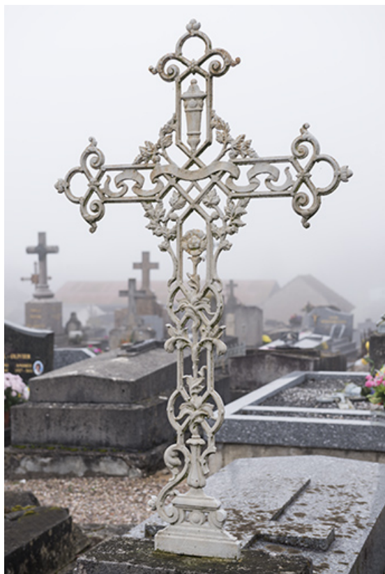
Tombeau précédent. Détail : croix en fonte ornée de volutes, ruban et urne. 70, Faverney rue Catinat