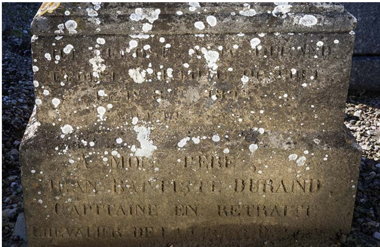
Tombeau de Jean-Baptiste Durand et Paul Brosselette. Epitaphe gravée sur la base de la stèle : (4 premières lignes illisibles) / A MON PERE / JEAN-BAPTISTE DURAND / CAPITAINE EN RETRAITE / CHEVALIER DE LA [LEGION D'HONNEUR]. 70, Faverney rue Catinat