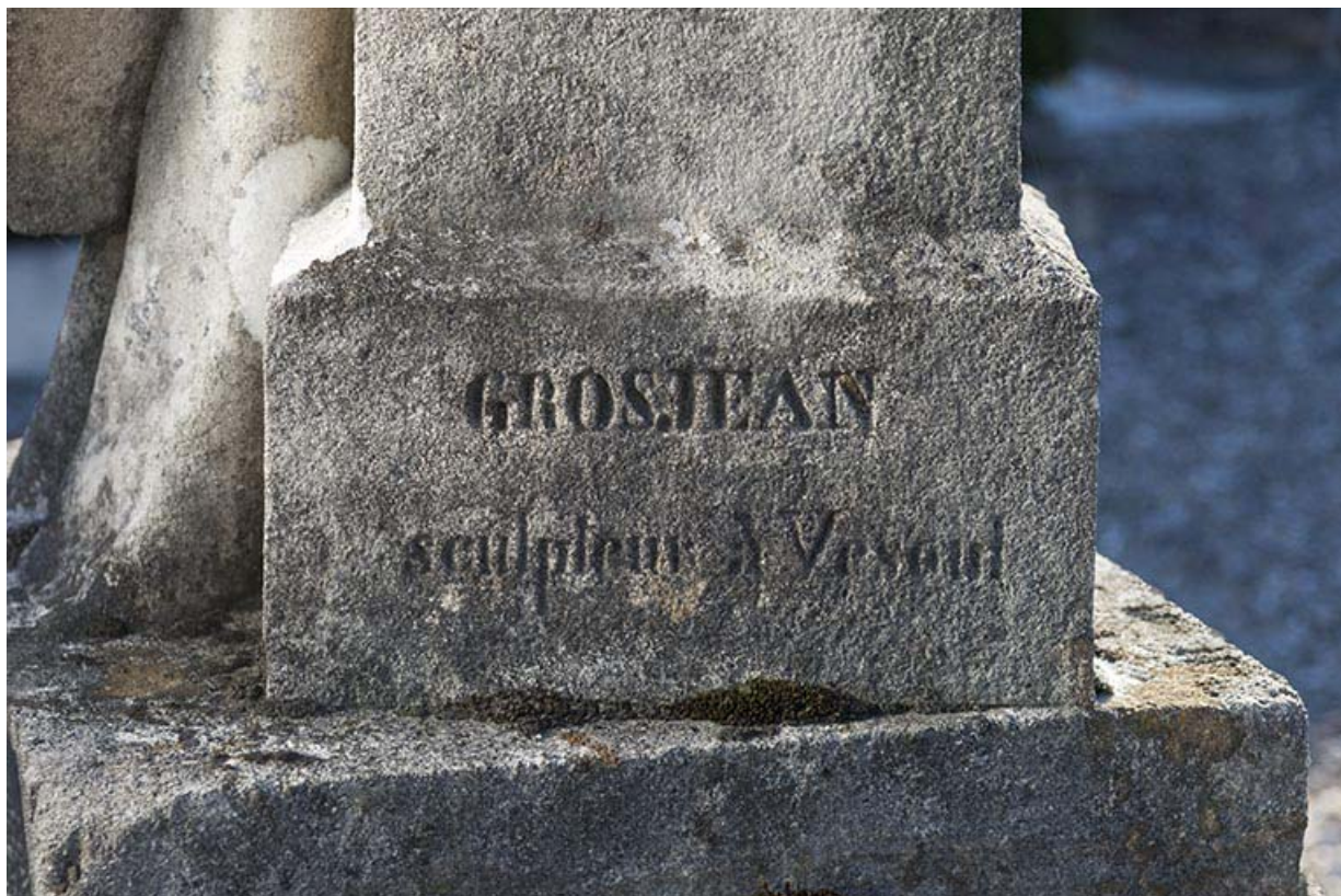
Tombeau de Jean-Baptiste Durand et Paul Brosselette. Signature du sculpteur gravée sur la base de la stèle : Grosjean sculpteur à Vesoul.