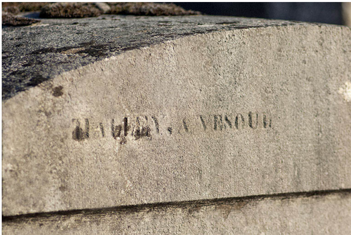
Tombeau de Laurent Marchal. Détail : signature du sculpteur Halley à Vesoul. 70, Faverney rue Catinat