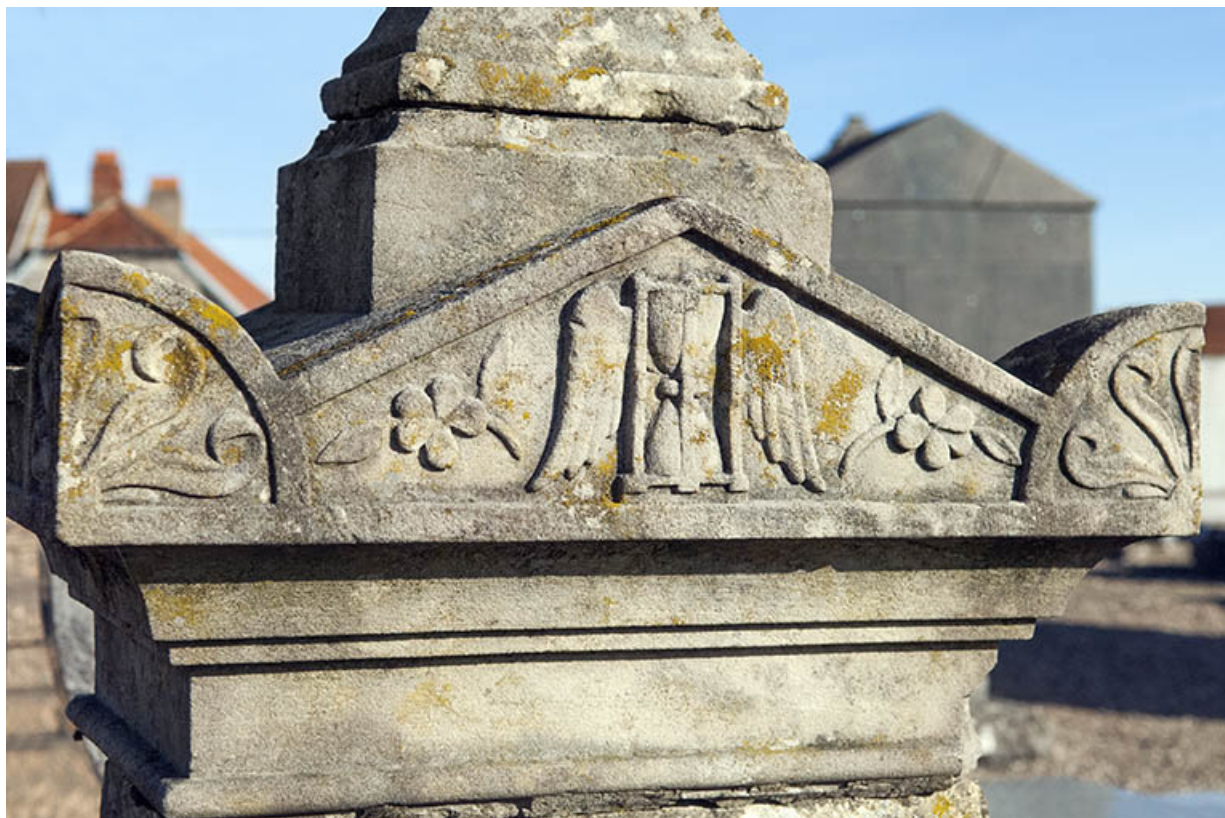
Tombeau de la famille Rouillot-Frickert. Détail de la stèle : un sablier cantonné d'une paire d'ailes et de fleurs. 70, Faverney rue Catinat