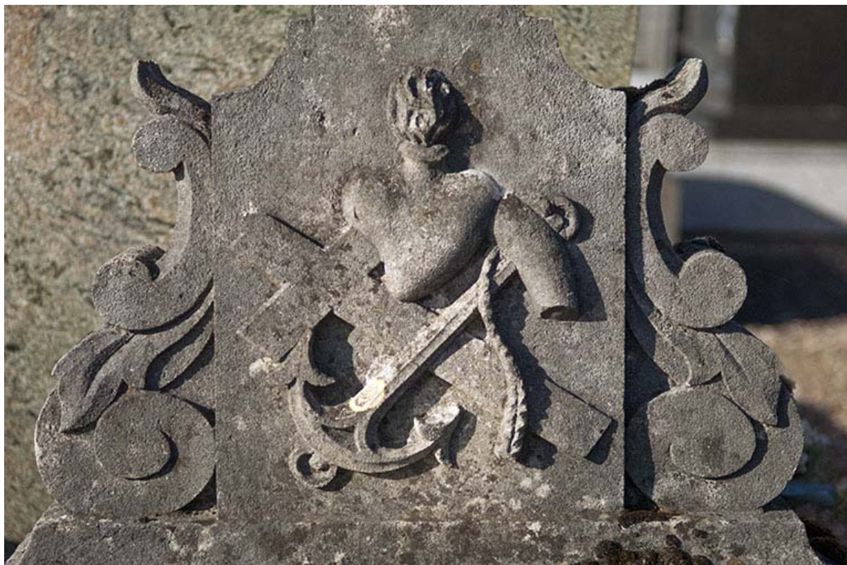
Tombeau précédent. Détail : panneau au pied de la croix représentant un relief composé d'une croix, d'une ancre et d'un coeur enflammé.