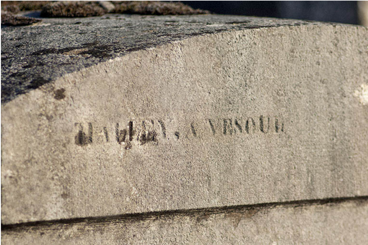
Tombeau de Laurent Marchal. Détail : signature du sculpteur Halley à Vesoul. 70, Faverney rue Catinat