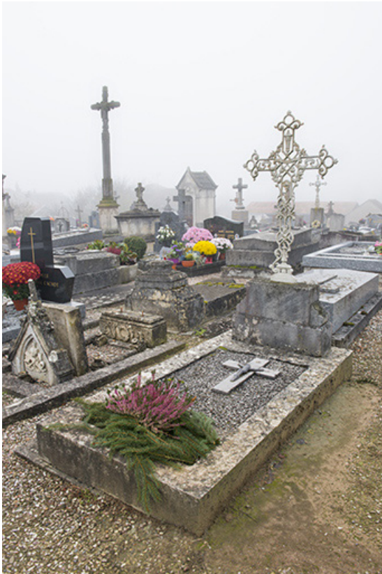
Tombeau : vue générale en direction de la croix de cimetière. 70, Faverney rue Catinat