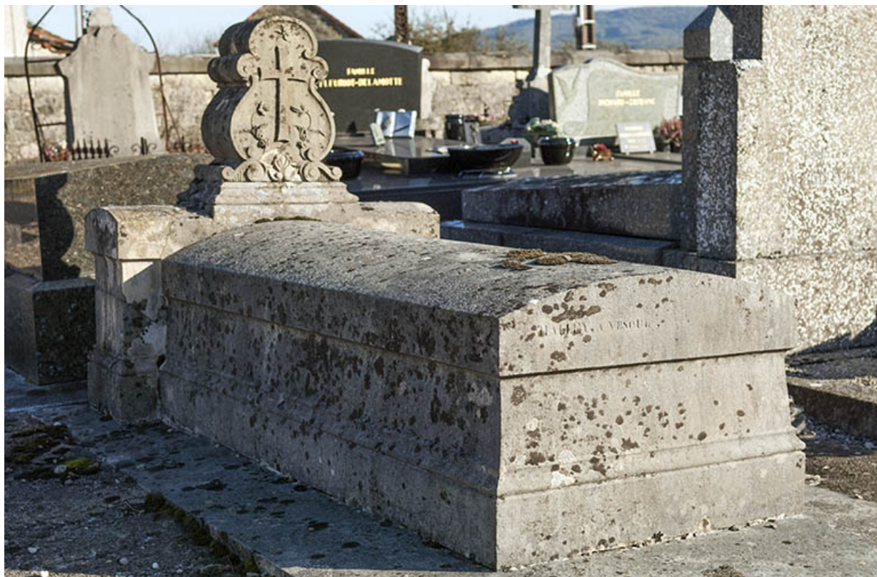
Tombeau Crevoisier, réalisé par Halley à Vesoul. 70, Faverney rue Catinat