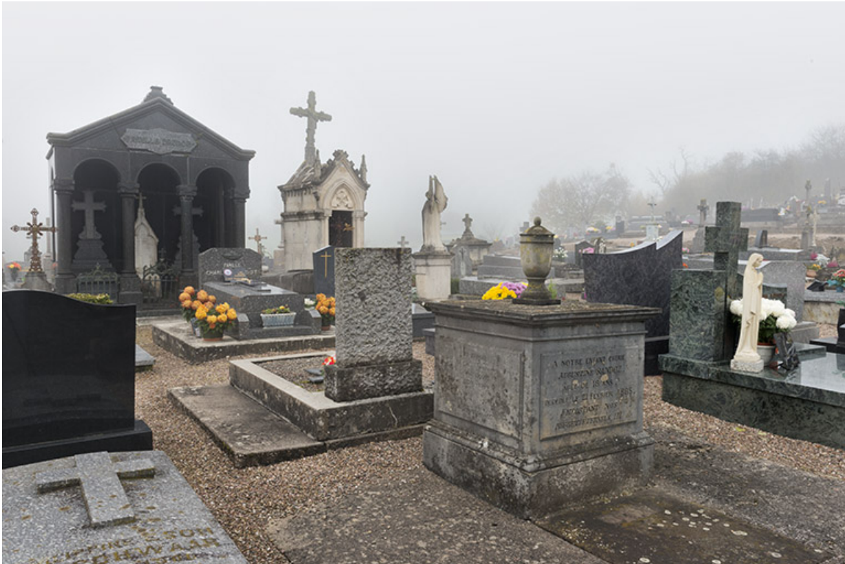
Vue partielle du cimetière en direction du monument funéraire de la famille Druhot.