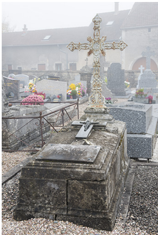
Tombeau de la famille Roland.