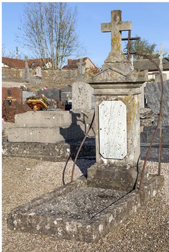
Tombeau de la famille Rouillot-Frickert.