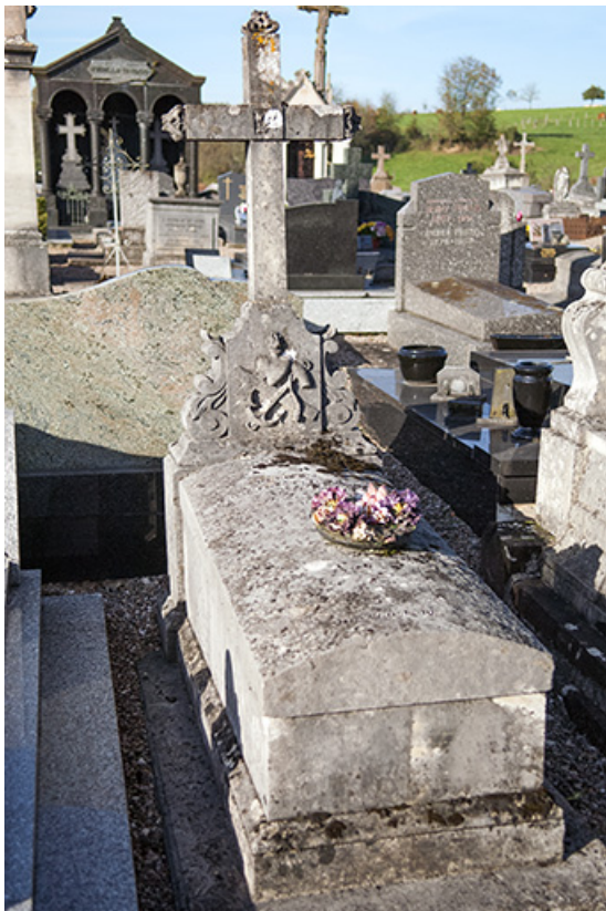
Tombeau portant la date 18 [..] et une inscription illisible. 70, Faverey rue Catinat