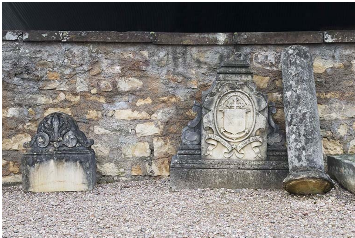
Vestiges de tombeaux dressés contre le mur d'enclos.