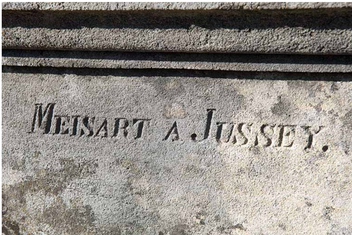
Tombeau de Jean-Baptiste-Edouard Camuset. Détail : la signature du sculpteur Meisart à Jussey. 70, Faverney rue Catinat