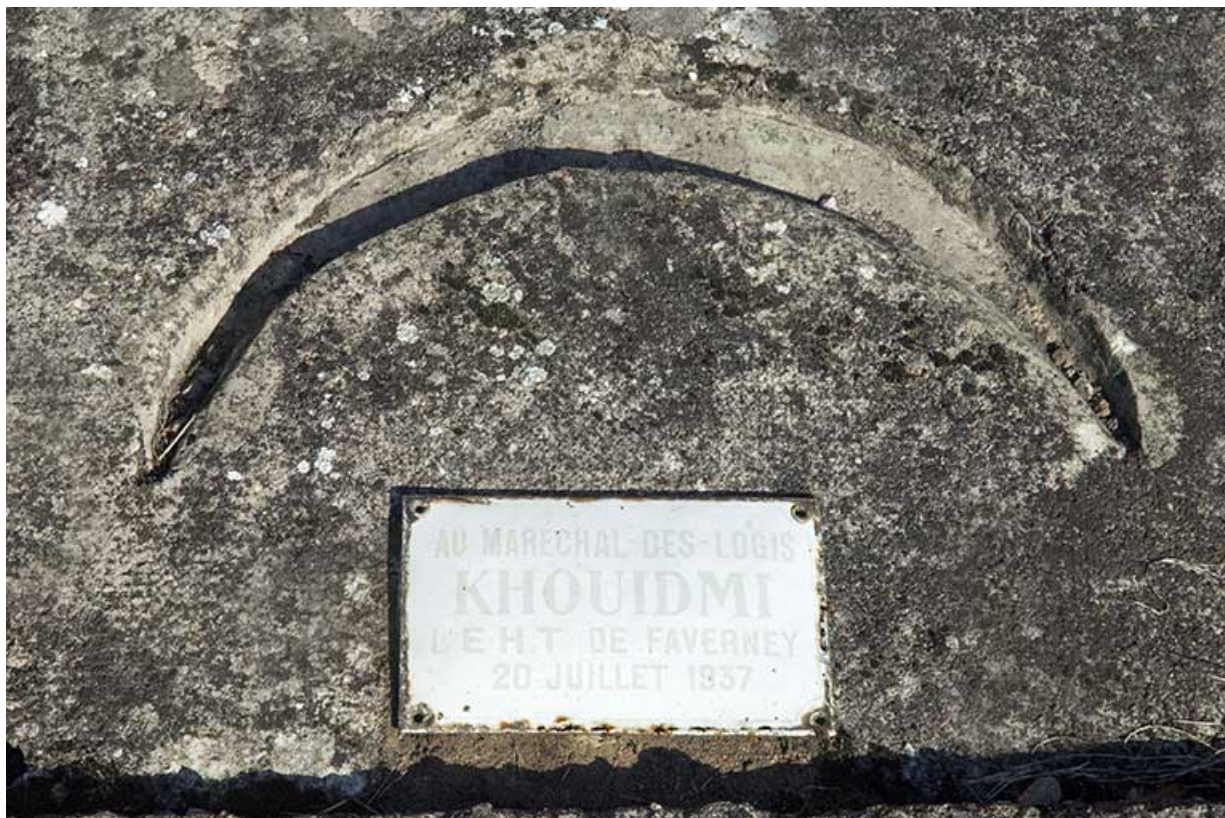
Tombe du maréchal des logis Khoudmi. Détail : plaque funéraire surmontée du Croissant. 70, Faverney rue Catinat