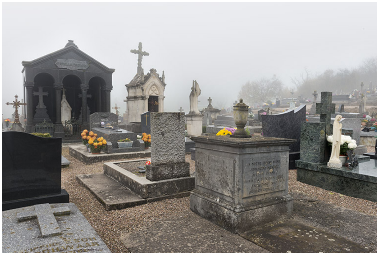
Vue partielle du cimetière en direction du monument funéraire de la famille Druhot. 70, Favorney rue Catinat