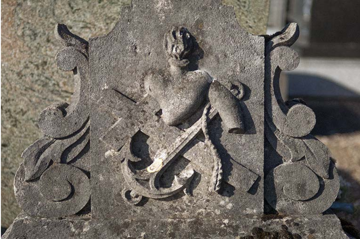
Tombeau précédent. Détail : panneau au pied de la croix représentant un relief composé d'une croix, d'une ancre et d'un coeur enflammé.