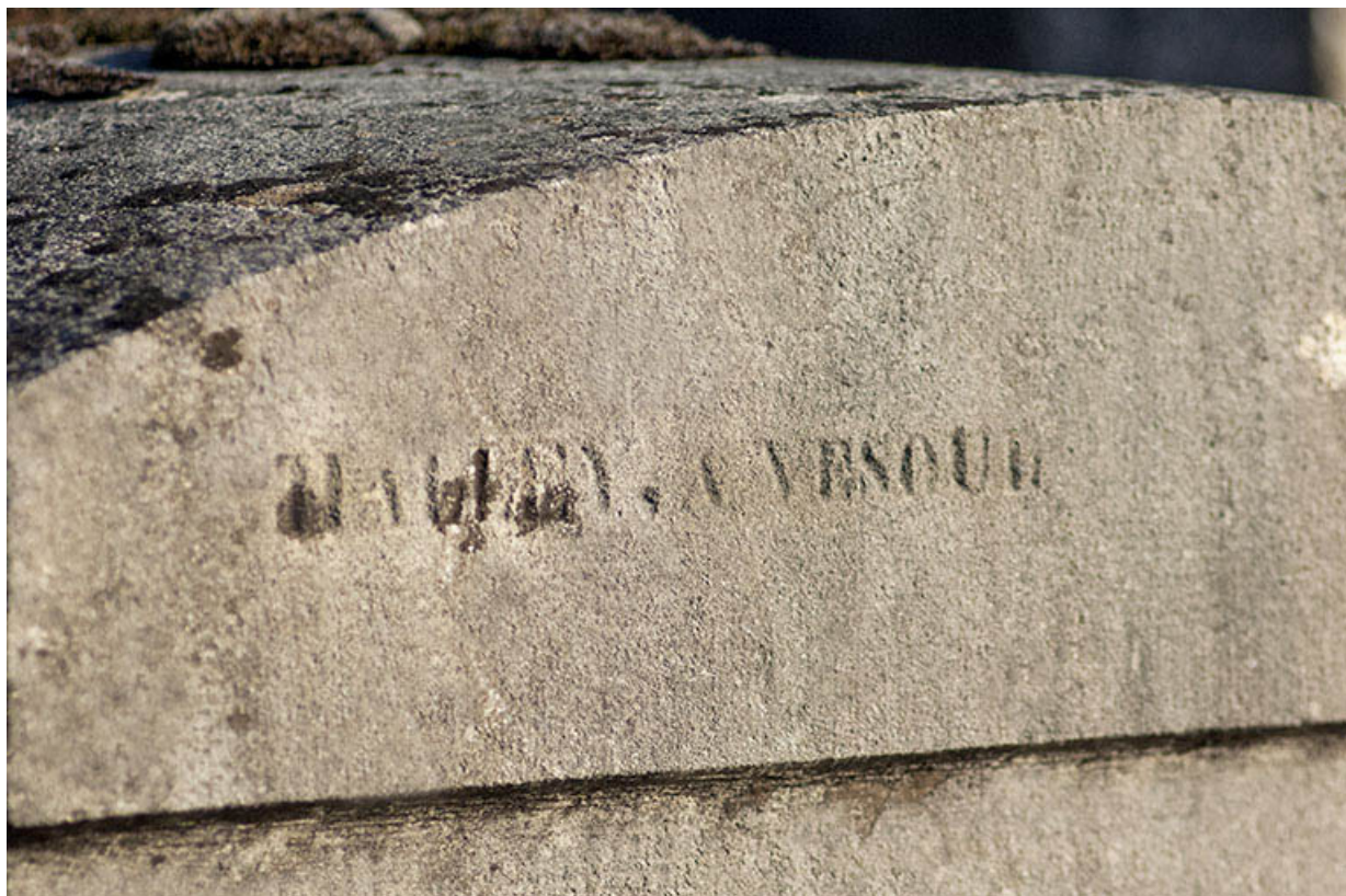
Tombeau de Laurent Marchal. Détail : signature du sculpteur Halley à Vesoul. 70, Faverney rue Catinat