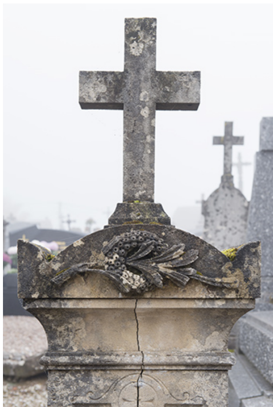
Tombeau de Delphine Delaire, épouse Mantez. Détail : bouquet d'immortelles. 70, Faverney rue Catinat