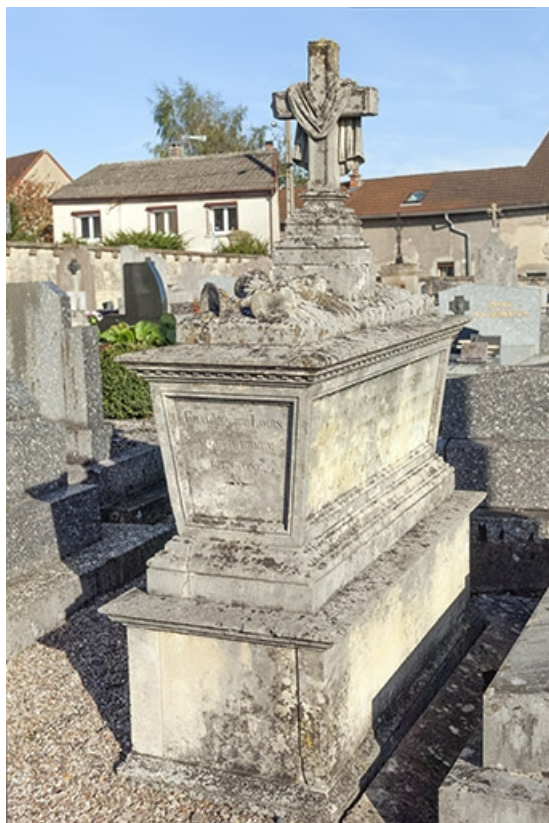
Tombeau de Jean-Baptiste-Edouard Camuset. 70, Faverney rue Catinat