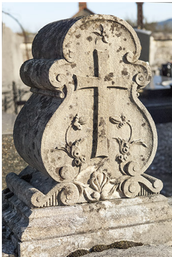
Tombeau Crevoisier. Détail de la stèle : croix au centre de pavots. 70, Faverney rue Catinat