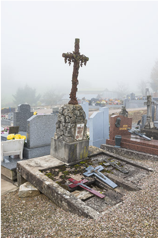
Tombes de la famille Belet-Maillot.