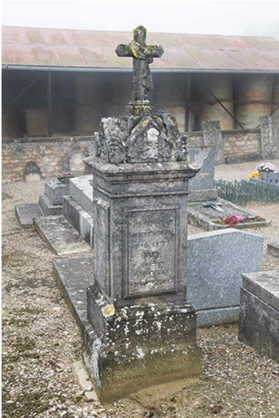
Tombeau de Laurent Marchal. Épitaphe gravée sur la face antérieure : ICI REPOSE/ LAURENT MARCHAL / DECEDÉ LE 27BRE / 1881 / UNE PRIERE / S'IL VOUS PLAÎT ! Le revers comporte une autre épitaphe.