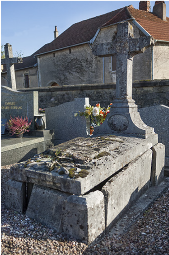
Tombeau de Jean-Pierre Pelissier. Inscription gravée sur un écu placé sur la tombe : ICI REPOSE EN DIEU / JEAN-PIERRE PELISSIER / OFFICIER EN RETRAITE / CHEVALIER DE LA / LEGION D'HONNEUR [...] 1884 [...] DANS SA 86E ANNEE.